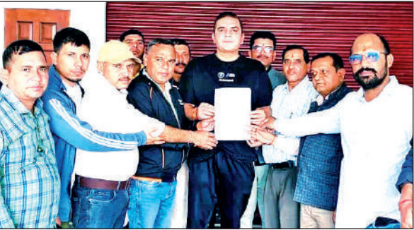
विधायक सुमित हृदयेश को ज्ञापन सौंपते उत्तरांचल परिवहन मजदूर संघ के पदाधिकारी।

पहल से नैनीताल ज़िले में धार्मिक पर्यटन के साथ साहसिक पर्यटन का भी संतुलित विकास होगा। इससे क्षेत्र की अर्थव्यवस्था को भी गति मिलने की उम्मीद है।