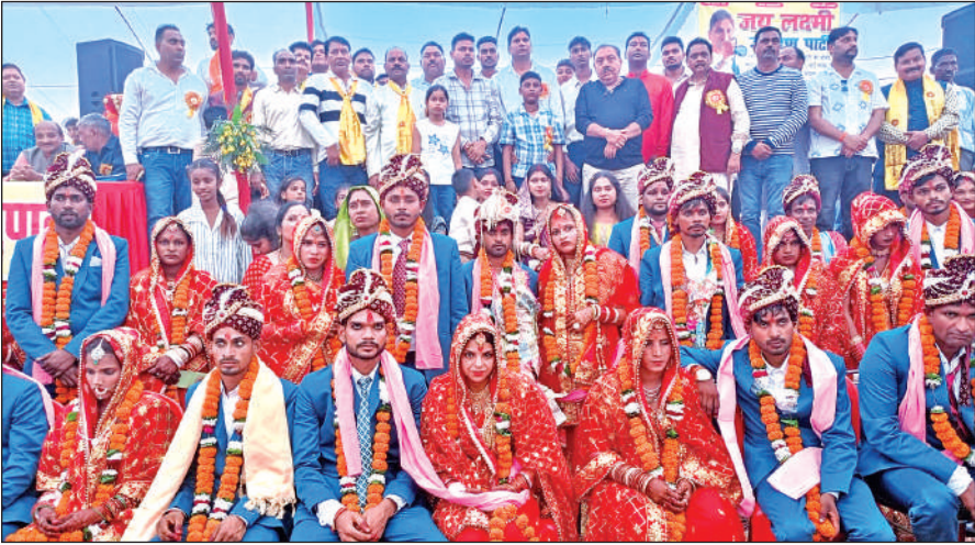
काशीपुर में विवाह के बाद अतिथियों के साथ नवविवाहित वर-वधू।