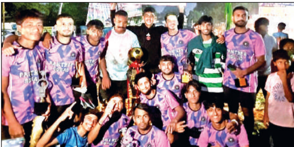
खटीमा से यूपी में फुटबॉल कप जीतने वाली डायमंड क्लब की टीम।