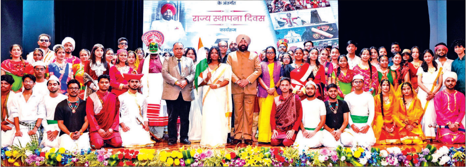
राजभवन देहरादून में विभिन्न राज्यों और केंद्र शासित प्रदेशों का स्थापना दिवस समारोह मनाया गया, इस अवसर पर राज्यपाल गुरमीत सिंह के साथ आंध्र प्रदेश, मध्य प्रदेश, पंजाब, हरियाणा, छत्तीसगढ़, केरल, कर्नाटक, दिल्ली आदि राज्यों के कलाकार।

विभिन्न राज्यों और केंद्र शासित प्रदेशों का मनाया गया स्थापना दिवस, कलाकारों ने दी सांस्कृतिक और मनमोहक प्रस्तुतियां