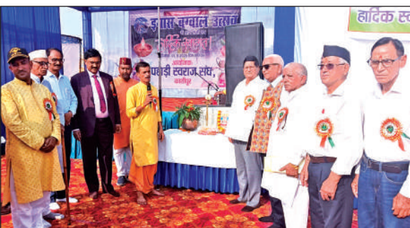
इगास कार्यक्रम का शुभारंभ करते अतिथि।