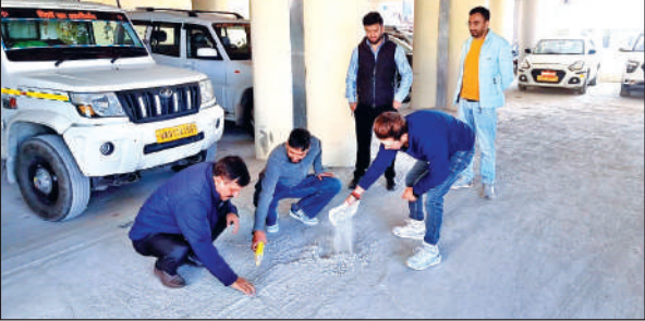
अल्मोड़ा माल रोड के पास बनी पार्किंग में गुणवत्ता की जांच करते पार्श्वद।