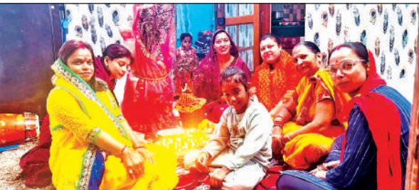
रामनगर में देवउठनी एकादशी पर पूजा अर्चना करते लोग।