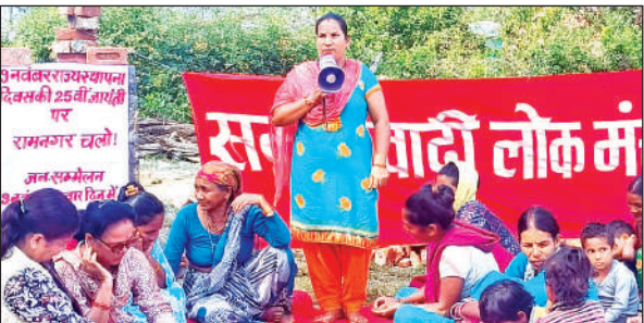
सुंदरखाल में जनसंपर्क के दौरान बोलती वक्ता।