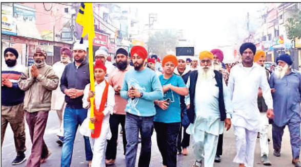
बाजपुर नगर में प्रभात फेरी निकालते श्रद्धालु।