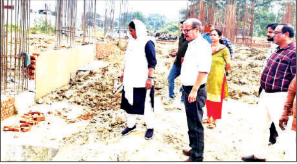
निर्माण कार्यों का निरीक्षण करती अल्पसंख्यक आयोग की उपाध्यक्ष फरजाना बेगम।

अमृत विचार: प्रधानमंत्री जन विकास कार्यक्रम ( पीएमजेवीके) के तहत ऊधमसिंह नगर जिले पंतनगर क्षेत्र में चल रहे विकास कार्यों का उत्तराखंड अल्पसंख्यक आयोग की उपाध्यक्ष एवं दर्जा राज्य मंत्री फरजाना बेगम ने स्थलीय निरीक्षण किया। इस दौरान उन्होंने संबंधित विभागीय अधिकारियों को कार्यों की गुणवत्ता और समय पर पूरा करने के निर्देश दिए। शनिवार को निरीक्षण के दौरान उत्तराखंड अल्पसंख्यक आयोग की उपाध्यक्ष फरजाना ने कहा कि योजनाओं का उद्देश्य समाज के सर्वांगीण विकास के लिए शिक्षा, रोजगार और बुनियादी सुविधाओं का सशक्तिकरण करना है। उन्होंने कहा कि मुख्यमंत्री पुष्कर