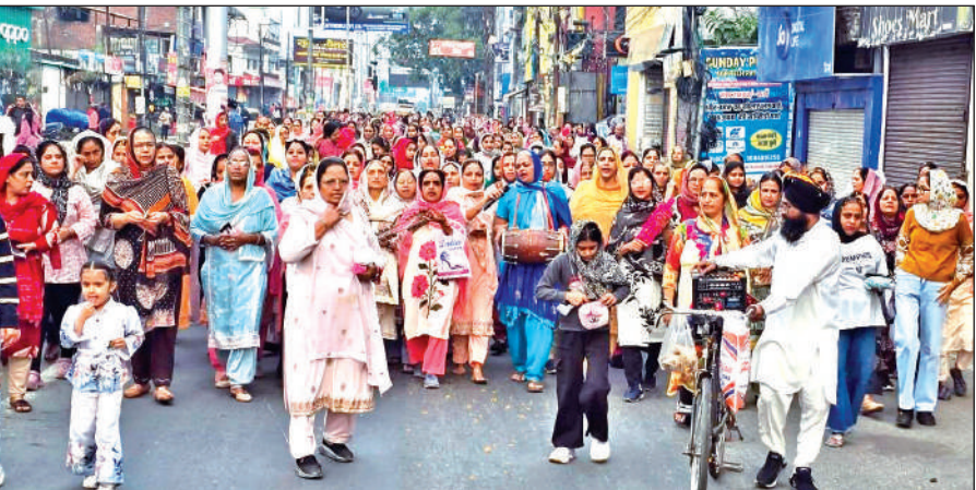
हल्द्वानी में शनिवार को प्रभात फेरी निकालते हुए सिख समुदाय के लोग।

शनिवार को प्रभात फेरी रामलीला ग्राउंड से प्रारंभ हुई और कालाढूंगी चौराहे, भोलानाथ गार्डन, पंजाबी क्वार्टर कॉलोनी से हीरानगर होकर मुखानी चौराहे होते हुए गुरुद्वारा चार साहिबजादे, कालाढूंगी रोड स्थित गुरुद्वारा में संपन्न हुई। प्रभात फेरी के दौरान साध संगत, जिसमें महिलाएं, बच्चे, और बुजुर्ग शामिल थे, गुरुबाणी गायन करते हुए प्रथम गुरु, गुरु नानक देव की महिमा कर रहे थे। राजेंद्र नगर सहित पूरे मार्ग में