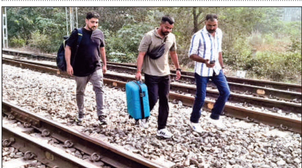
पैदल ही अपने गंतव्य को जाते यात्री।

दिल्ली जाने वाली संपर्क क्रांति एक्सप्रेस के आने का संदेश मिला। रेलवे विभाग ने आनन फानन में संपर्क क्रांति को गांव छतरपुर के समीप ही रुकवा दिया और फिर बचाव कार्य शुरू हुआ। आनन-फानन में जेसीबी मशीन द्वारा सात गोवंशीय पशुओं के शवों को ट्रैक