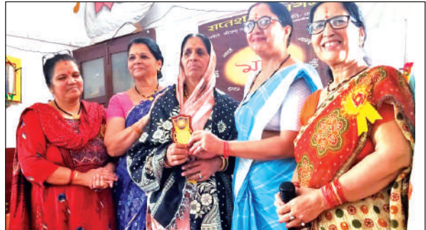
टनकपुर सरस्वती शिशु वाटिका में महिला को सम्मानित करतीं अतिथि।