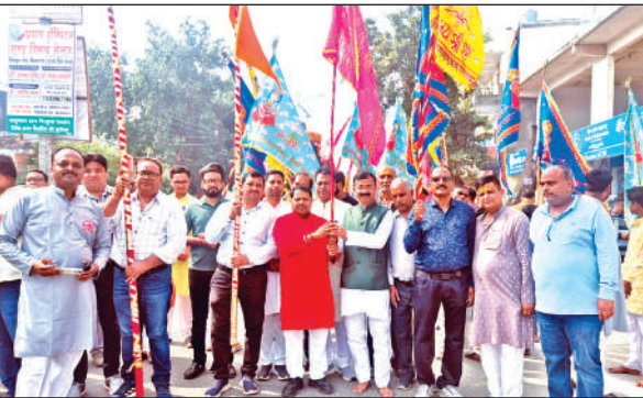
सितारगंज में निशान यात्रा निकालते श्याम भक्त। ● अमृत विचार

शनिवार को बाबा श्याम के भक्तों ने महाराजा अग्रसेन धर्मायं ट्रस्ट से विधिवत निशान यात्रा की शुरूआत की। जो नगर के विभिन्न मार्गों से होते हुए श्री सनातन धर्म मंदिर में समाप्त हुई। इस दौरान पूरा नगर श्याम बाबा के जयकारों से गुंजायमान हो उठा। वहीं, इससे पूर्व भक्तों