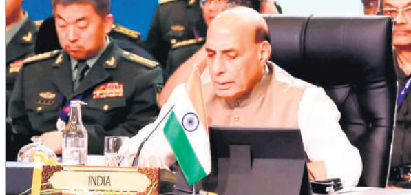
आसियान रक्षामंत्रियों के सम्मेलन को संबोधित करते रक्षामंत्री राजनाथ सिंह

तीन अज्ञात लोगों के अवशेष शुक्रवार देर रात इजराइल भेजे गए, जहां रात भर उनकी पड़ताल की गई। एक अन्य इजराइली सैन्य अधिकारी ने चेतावनी दी थी कि इजराइली खुफिया एजेंसियों ने संकेत दिया था कि ये अवशेष सात अक्टूबर, 2023 के दक्षिणी इजराइल पर हुए हमले के दौरान हमास द्वारा बंधक बनाए गए किसी भी व्यक्ति के नहीं थे।