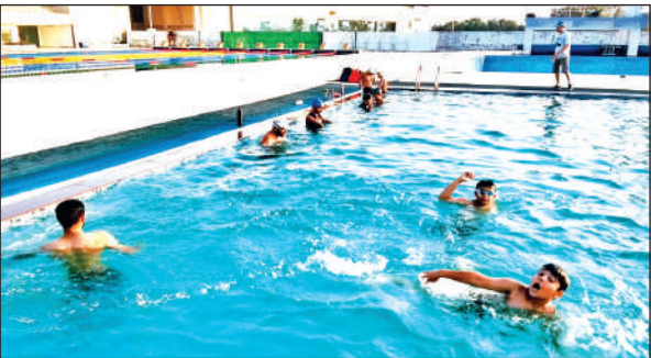
हीटिंग प्लांट सिस्टम चालू होने के बाद तरणताल में तैराकी करते प्रशिक्षणार्थी।