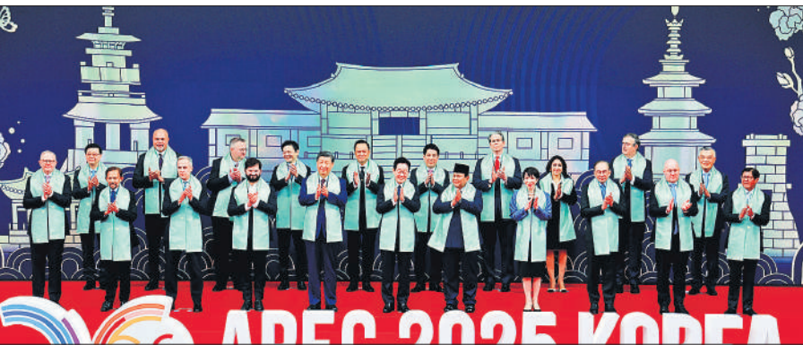
एपेक शिखर सम्मेलन के समापन के दौरान सदस्य देशों के राष्ट्राध्यक्ष और प्रतिनिधि

हम अपनी इस साझा मान्यता की पुष्टि करते हैं कि एशिया-प्रशांत क्षेत्र के विकास और समृद्धि के लिए मजबूत व्यापार और निवेश महत्वपूर्ण हैं। संयुक्त बयान में दुनिया की दो सबसे बड़ी अर्थव्यवस्थाओं, अमेरिका और चीन के बीच व्यापार तनाव से बुरी तरह प्रभावित वैश्विक को अर्थव्यवस्था की साझा चुनौतियों से निपटने के लिए अधिक सहयोग करने का वादा किया गया। एशियाई और प्रशांत क्षेत्र के 21 देशों के नेताओं ने