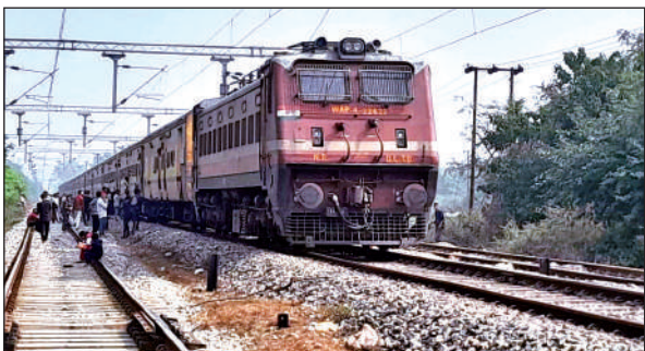
छतरपुर-भुरारानी रेलवे ट्रैक पर खड़ी संपर्क क्रांति ट्रेन।

जानकारी के अनुसार शनिवार की सुबह नौ बजे के करीब आवारा पशुओं को बहला-फुसलाकर कर अपने घर ले गया। वहां उसका मुंह बंद कर जबरन उसके साथ दुष्कर्म किया। वहीं, मामले में पुलिस ने आरोपी युवक के विरुद्ध पॉक्सो की धाराओं में केस दर्ज किया है। पुलिस ने किशोरी का मेडिकल परीक्षण भी कराया है। सीओ बीएस धौनी ने बताया कि किशोरी की मां की तहरीर पर आरोपी युवक के विरुद्ध पॉक्सो एक्ट में केस दर्ज किया है। पुलिस मामले की जांच कर रही है। जल्द ही, गिरफ्तारी की जाएगी।