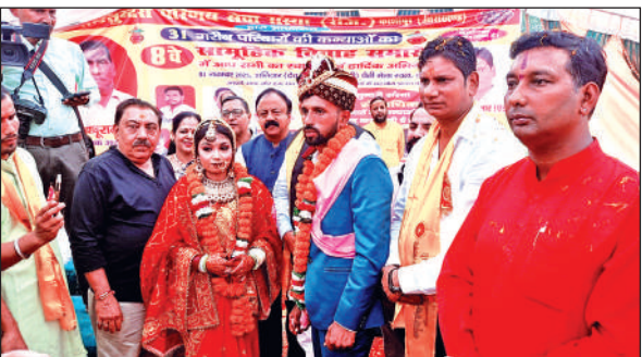
काशीपुर में नवविवाहत जोड़े को आशीर्वाद देते संस्था के सदस्य।