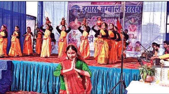
काशीपुर में कार्यक्रम के दौरान प्रस्तुति देती महिलाएं।

पहाड़ी स्वराज संघ की ओर से आयोजित किया गया कार्यक्रम, बच्चों ने भी बांधा समां