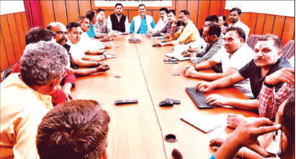
बैठक में चर्चा करते भाजपा कार्यकर्ता।