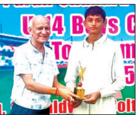
अंडर-14 क्रिकेट टूर्नामेंट में विजेता टीम के कप्तान टॉफी ग्रहण करते हुए।