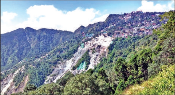
बलियानाला के निचले क्षेत्र में पड़ी दरार। ● अमृत विचार

अमृत विचार: संवेदनशील बलियानाला के दूसरे छोर पर दरारें पड़नी शुरू हो गई हैं। यह दरारें कृष्णापुर क्षेत्र की पहाड़ी से लगी हुई हैं। नया खतरा बना दरार का यह हिस्सा करीब सौ मीटर दायरे में फैला है। भूविज्ञानियों के स्थलीय सर्वे में यह जानकारी मिली है। बलियानाला नगर का सर्वाधिक संवेदनशील क्षेत्र है। इस क्षेत्र में विगत कई दशकों से भूस्खलन होने के कारण ऊपरी हिस्से में तीन सौ करोड़ की लागत से ट्रीटमेंट किया जा रहा जिसमें करीब तीन वर्ष से किए जा रहे ट्रीटमेंट के चलते पिछले दो वर्ष से भूस्खलन