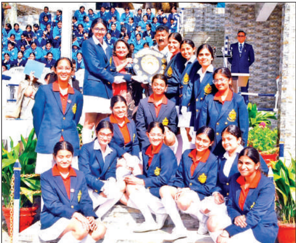
ऑल सेंट्स कॉलेज के स्थापना दिवस पर ट्राफी के साथ विद्यार्थी व अतिथि।