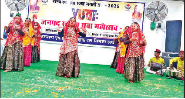
कार्यक्रम प्रस्तुत करती स्कूली छात्राएं।