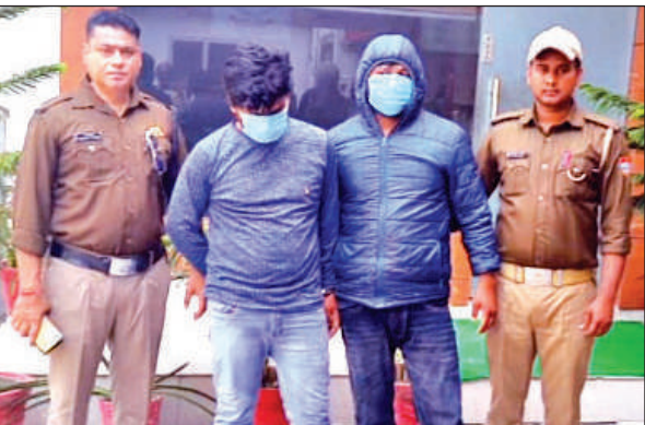
रामनगर में पुलिस द्वारा गिरफ्तार किए गए आरोपी।