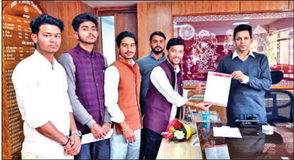
अल्मोड़ा में शनिवार को डीएम को ज्ञापन सौंपते दन्या के लोग।।