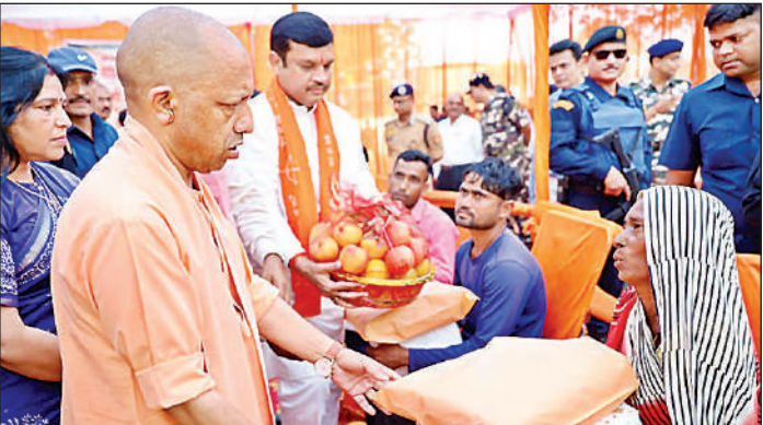
पीड़ित परिवारों को राहत सामग्री वितरित करते मुख्यमंत्री, साथ में अन्य