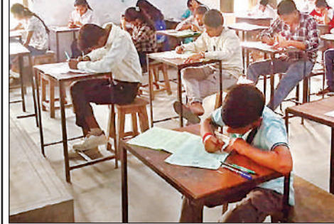
ओपीजेडी स्कूल में प्रतियोगिता में भाग लेते बच्चे।

शुक्लागंज। रविवार को राजधानी मार्ग स्थित ओम प्रकाश ज्वाला देवी इंटर कॉलेज में युवा एवं बाल विकास समिति के अंतर्गत भारतीय बौद्ध महासभा के तत्वावधान में डा. अम्बेडकर सामान्य ज्ञान प्रतियोगिता परीक्षा- 2025 का आयोजन किया गया। यह परीक्षा प्रातः 11 बजे से 12:30 बजे तक आयोजित की गई। ओपीजेडी इंटर कॉलेज केंद्र पर कुल 101 पंजीकृत विद्यार्थियों में से 95 विद्यार्थियों ने परीक्षा में हिस्सा लिया।