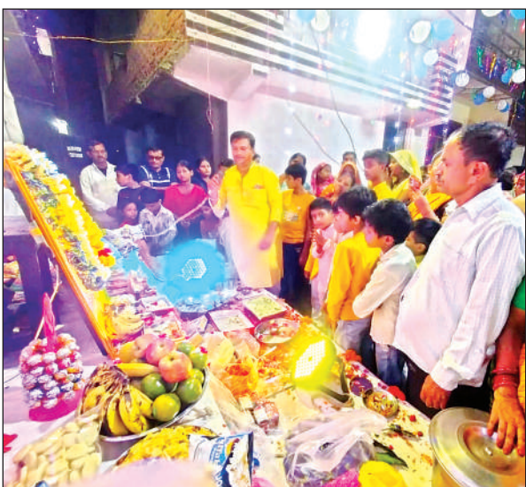
खाटू श्याम का जन्मोत्सव मनाते श्रद्धालु।

●श्रद्धालुओं ने आरती कर जगह-जगह बांटा प्रसाद