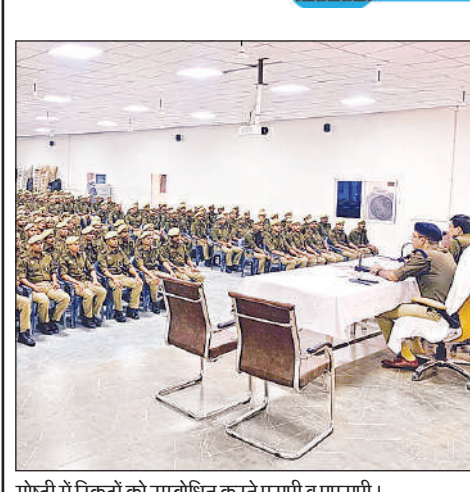
गोष्ठी में रिकूटों को सम्बोधित करते एसपी व एएसपी।