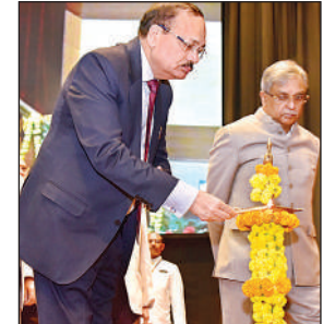
लखनऊ : कार्यक्रम की दीप जलाकर शुरुआत करते न्यायमूर्ति सूर्यकांत।

अमृत विचार : उप्र. राज्य विधिक सेवा प्राधिकरण (यूपीएसएलएसए) द्वारा रविवार को न्यायिक प्रशिक्षण एवं अनुसंधान संस्थान (जेटीआरआई), लखनऊ में कानूनी सहायता के माध्यम से प्रजनन स्वायत्तता में बाधाओं को दूर करना, विषय पर एक संवेदनशीलता कार्यक्रम आयोजित किया गया। यह कार्यक्रम भारत के सर्वोच्च न्यायालय एवं इलाहाबाद उच्च न्यायालय के न्यायमूर्तियों की मौजूदगी में हुआ। कार्यक्रम के दौरान अपने संबोधन में नामित सीजेआई न्यायमूर्ति सूर्यकांत ने कहा कि परिस्थितियां कैसी भी हों, प्रत्येक महिला यह आत्मविश्वास पाने की अधिकारी है कि न्याय व्यवस्था उसके साथ मजबूती से खड़ी है। उन्होंने उप्र.