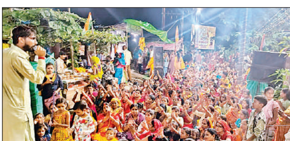
बाबा श्याम के भजनों पर झूमते श्याम प्रेमी।