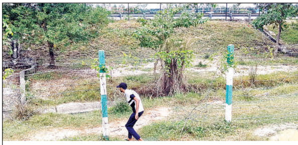
एक्सप्रेस-वे की टूटी फेंसिंग से निकलता युवक।

उन्नाव, अमृत विचार। लखनऊ-उन्नाव स्थित उदयन भवन में शनिवार को सृजन व शब्द गंगा शुद्धि अभियान संस्थान की ओर से 20वां अखिल भारतीय कवि सम्मेलन व सम्मान समारोह हुआ। मां सरस्वती के चित्र पर माल्यार्पण व दीप प्रज्ज्वलन के साथ कार्यक्रम का शुभारंभ हुआ। मुख्य अतिथियों में