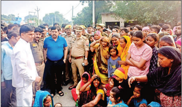
हादसे के बाद सड़क पर बैठी महिलाओं को समझाती पुलिस।