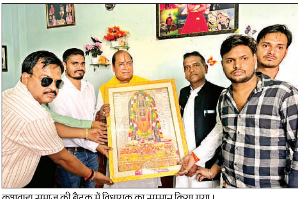
कुशवाहा समाज की बैठक में विधायक का सम्मान किया गया।