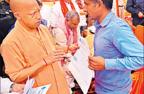
हादसे के प्रभावितों को चेक सौंपते मुख्यमंत्री योगी