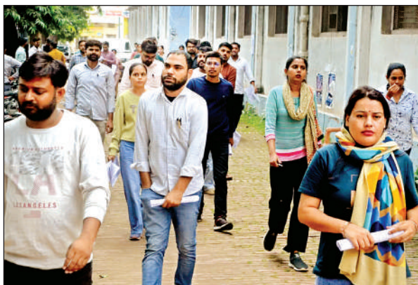
परीक्षा केंद्र से बाहर निकलते परीक्षार्थी।