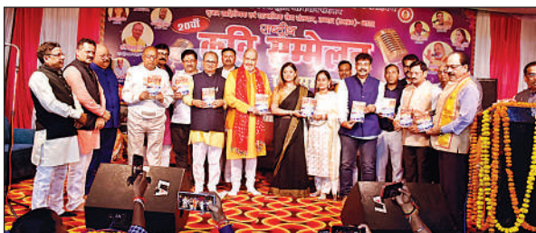
युग विर्दबना काव्य पुस्तक का किया गया विमोचन।

उन्नाव, अमृत विचार। लखनऊ-उन्नाव स्थित उदयन भवन में शनिवार को सृजन व शब्द गंगा शुद्धि अभियान संस्थान की ओर से 20वां अखिल भारतीय कवि सम्मेलन व सम्मान समारोह हुआ। मां सरस्वती के चित्र पर माल्यार्पण व दीप प्रज्ज्वलन के साथ कार्यक्रम का शुभारंभ हुआ। मुख्य अतिथियों में