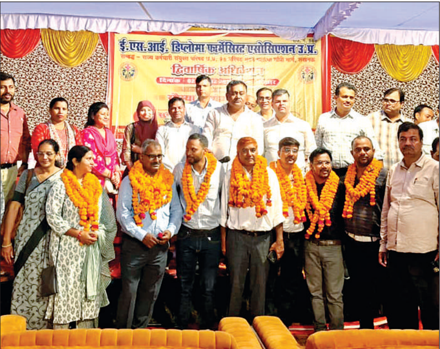
नई कार्यकारिणी चुनी गई।