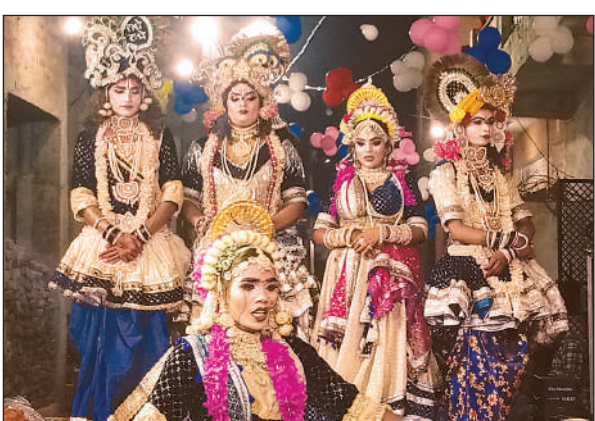
मनमोहक झांकियां प्रस्तुत करते कलाकार।