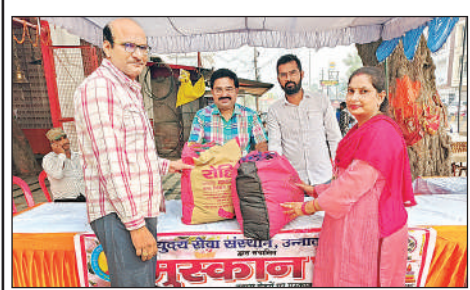
कैंप में वस्त्र एकत्र करते संस्थान के पदाधिकारी।