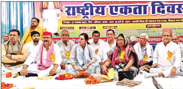
समारोह में उपस्थित लोग।