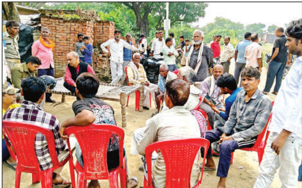
घटना के बाद मौके पर पहुंचे ग्रामीण।