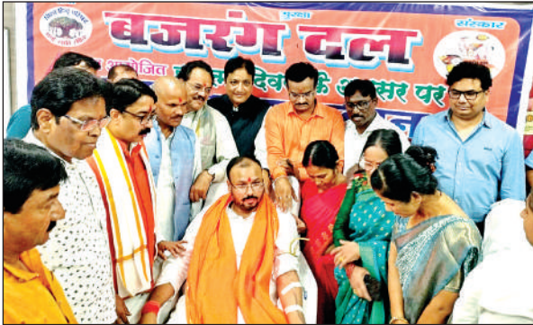
रक्तदान शिविर में पदाधिकारी व कार्यकर्ता।

का आयोजन आईएमए हॉल परेड, शंभुविला गेस्ट हाउस पनकी गंगागंज, कांशीराम हॉस्पिटल रामादेवी में किया गया। काशीराम