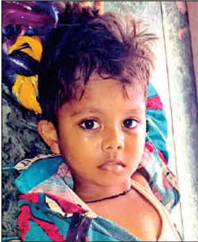
सारतिक का फाइल फोटो।

अमृत विचार: रविवार को देवोत्थानी एकादशी पर घर घर मंत्र बोलकर भगवान विष्णु को उठाने के लिए विनती की गई। इस पर्व पर तुलसी का पूजन अर्चन कर उनका शालिग्राम से विवाह उत्सव भी मनाया गया। देवोत्थानी एकादशी को देव उठनी एकादशी, हरि प्रबोधिनी एकादशी और तुलसी विवाह का नाम से भी जाना जाता है। इस एकादशी का हिंदू धर्म में विशेष महत्त्व है। मान्यता के