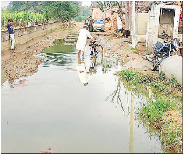
जलभराव में निकलते ग्रामीण।