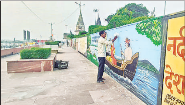
घाटों का हुआ सुंदरीकरण।

वीआईपी घाट, रानी शिवाला घाट के पक्के घाटों पर श्रद्धालुओं को प्राकृतिक एवं आध्यात्मिक चित्रण की भी झलक देखने को मिलेगी। यहां पर श्रद्धालु आकर मनमोहक चित्रण का भी आनंद लेगे जगह-जगह पर प्रकाश की उत्तम व्यवस्था के साथ ही नगर पंचायत द्वारा चैंजिंग रूम एवं शौचालय की अस्थाई व्यवस्था भी की गई है।