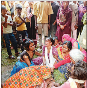
युवक की मौत पर बिलखते परिजन।