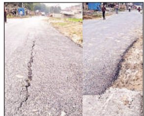
मानकविहीन नवनिर्मित बदावर-दरियागंज सम्पर्क मार्ग।