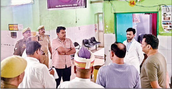
बाढ़ प्रभावित तहसील की सीएचसी का निरीक्षण करते जिलाधिकारी।

दरअसल, घड़ी में रात के लगभग 11 बजे बजे थे। अस्पताल परिसर