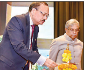
लखनऊ : कार्यक्रम की दीप जलाकर शुरुआत करते न्यायमूर्ति सूर्यकांत।

अमृत विचार : उप्र. राज्य विधिक सेवा प्राधिकरण (यूपीएसएलएसए) द्वारा रविवार को न्यायिक प्रशिक्षण एवं अनुसंधान संस्थान (जेटीआरआई), लखनऊ में कानूनी सहायता के माध्यम से प्रजनन स्वायत्तता में बाधाओं को दूर करना, विषय पर एक संवेदनशीलता कार्यक्रम आयोजित किया गया। यह कार्यक्रम भारत के सर्वोच्च न्यायालय एवं इलाहाबाद उच्च न्यायालय के न्यायमूर्तियों की मौजूदगी में हुआ। कार्यक्रम के दौरान अपने संबोधन में नामित सीजेआई न्यायमूर्ति सूर्यकांत ने कहा कि परिस्थितियां किसी भी हों, प्रत्येक महिला यह आत्मविश्वास पाने की अधिकारी है कि न्याय व्यवस्था