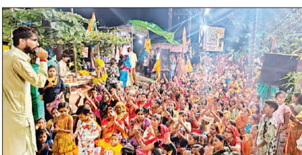
बाबा श्याम के भजनों पर झूमते श्याम प्रेमी।