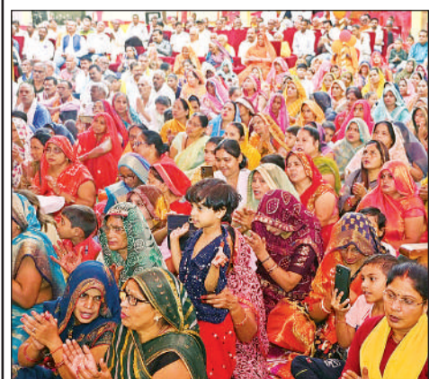
श्रीराम कथा के दौरान उपस्थित श्रद्धालु महिलाएं।