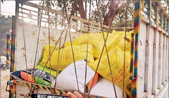
छापेमारी में बरामद किया गया संदिग्ध उर्वरक।