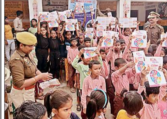
बालिकाओं को जानकारी देती महिला कांस्टेबल।