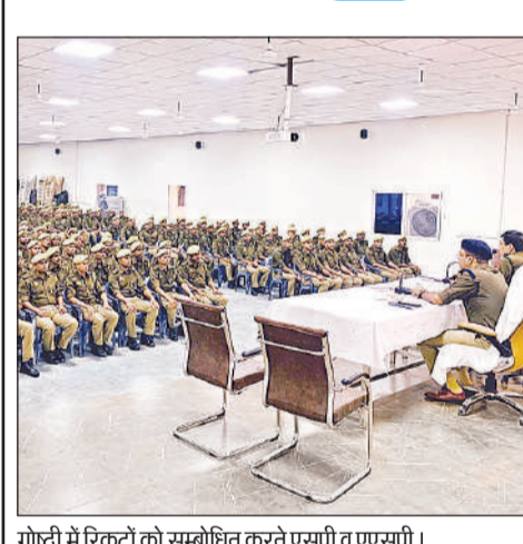
गोष्ठी में रिकूटों को सम्बोधित करते एसपी व एएसपी।