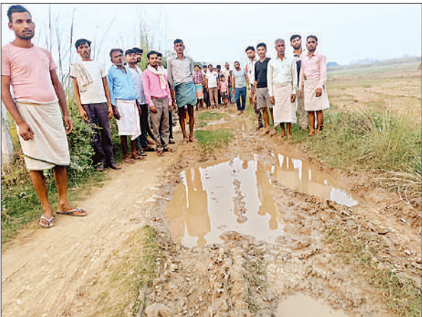
मुख्य मार्ग पर कीचड़युक्त गड्ढे की समस्या बताते ग्रामीण।

स्थानीय ब्लॉक के सठियाऊ पश्चिमी गांव की करीब 600 की आबादी है। गांव जाने के लिए 15 वर्ष पूर्व खड़जा डालकर रास्ता बनाया गया था, लेकिन खड़जा भी उखड़कर अब गायब हो गया। पूरे रास्ते पर बड़े-बड़े गड्ढे और कीचड़ भरा हुआ है, जिस गांव के लोगों को आने-जाने में बड़ी समस्या खड़ी होती है। पक्का मार्ग न होने के कारण युवाओं की शादी होना भी मुश्किल हो जाता है।