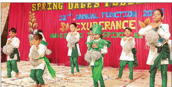
वार्षिकोत्सव में धूम मचाते बच्चे।

सर्वप्रथम बच्चों ने गणेश प्रस्तुति पेश की। प्री नर्सरी के बच्चों ने 'हलो हलो हाउ आर यू' पर समूह नृत्य पेश किया जिसे सभी ने बहुत सराहा। नर्सरी क्लास की बच्चियों वेलकम गेस्ट गीत पर डांस कर समां बांध दिया। इसके अलावा बच्चों ने राष्ट्रीयता पर आधारित