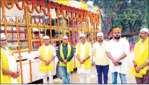
यात्रा का स्वागत करते श्रद्धालु।