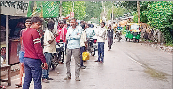
बस न होने से परेशान यात्री।