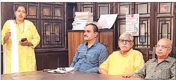
गोष्ठी में कविता पाठ करती कवयित्री।