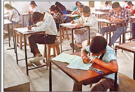
ओपीजेडी स्कूल में प्रतियोगिता में भाग लेते बच्चे।