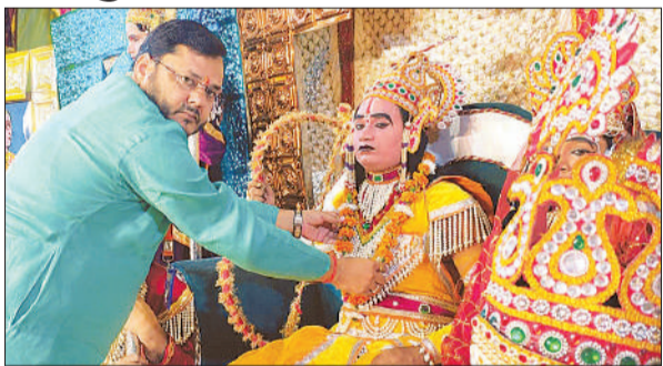
रामलीला में श्रीराम का माल्यार्पण करते लोग।