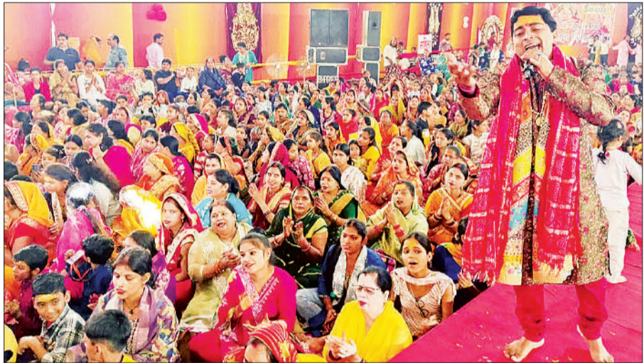
खाटू श्याम का गुणगान करते गायक व मौजूद श्रद्धालु।