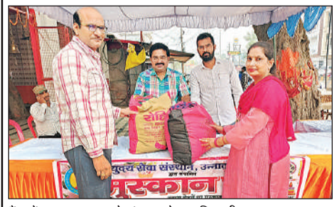
कैंप में वस्त्र एकत्र करते संस्थान के पदाधिकारी।