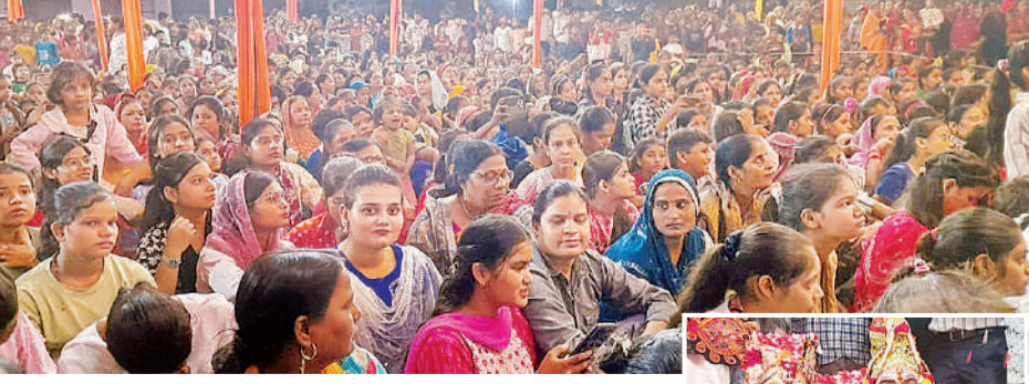
महोत्सव के दौरान मौजूद लोग व फूलों की होली खेलते कलाकार (इनसेट में)।