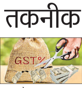
राज्य ब्यूरो, लखनऊ

अमृत विचार : प्रदेश में ‘एक टैक्स-एक रास्ट्र’ की संकल्पना अब ‘एक घोटाला-अनेक रूप’ में बदलता दिख रहा है। मुरादाबाद, भदोही और महाराजगंज सिर्फ बानगी है, जीएसटी लागू होने के आठ साल बाद भी कर चोरी का नेटवर्क पूरे प्रदेश में नई तकनीक और मिलीभगत से ज्यादा संगठित नजर आ रहा है।