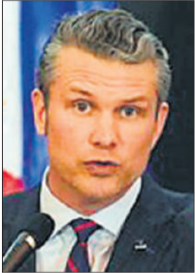
अमेरिकी रक्षामंत्री पीट हेगसेथ।

अमेरिका के रक्षा मंत्री पीट हेगसेथ ने दक्षिण-पूर्व एशियाई देशों से अपील की है कि वे दक्षिण चीन सागर में चीन की अस्थिर करने वाली बढ़ती गतिविधियों का दृढ़तापूर्वक मुकाबला करने के लिए तैयार रहें और अपनी समुद्री सेनाओं को मजबूत बनाएं। हेगसेथ ने हालांकि इसके कुछ घंटे बाद सोशल मीडिया पर चीन के प्रति नरम रुख अपनाते हुए कहा कि अमेरिका-चीन संबंध कभी इतने अच्छे नहीं रहे और दोनों पक्षों ने सीधे तौर पर सैन्य संपर्क स्थापित करने पर सहमति जताई है।