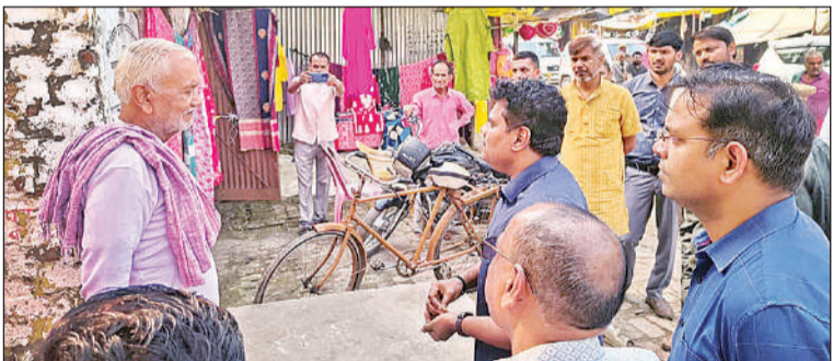
स्थानीय लोगों से संवाद करते जिलाधिकारी।