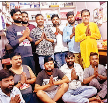
खाटू श्याम की पूजा- अर्चना करते लोग।