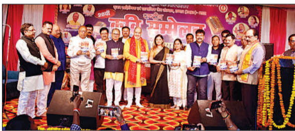
रुग विर्ढबना काव्य पुस्तक का किया गया विमोचन।

उन्नाव, अमृत विचार। लखनऊ-उन्नाव स्थित उदयन भवन में शनिवार को सृजन व शब्द गंगा शुद्धि अभियान संस्थान की ओर से 20वां अखिल भारतीय कवि सम्मेलन व सम्मान समारोह हुआ। मां सरस्वती के चित्र पर माल्यार्पण व दीप प्रज्ज्वलन के साथ कार्यक्रम का शुभारंभ हुआ। मुख्य अतिथियों में