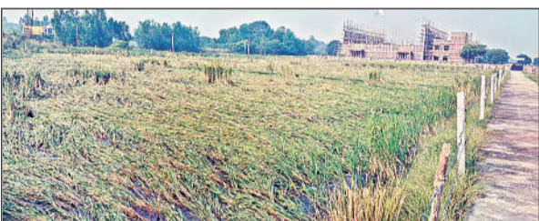
बारिश के चलते खेत में गिरी पड़ी फसल।

खेत में बारिश थमने के बावजूद रविवार को दिनभर बादलों की