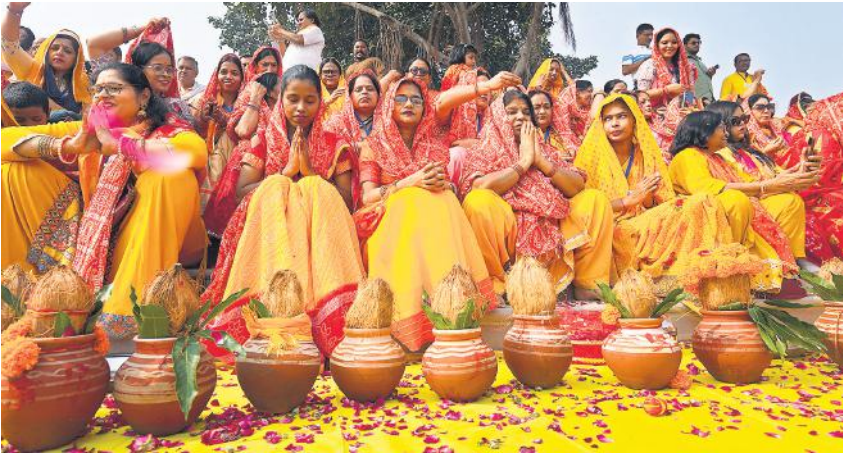
यमुना संसद अभियान के तहत यमुनोत्सव 2025 के पहले दिन रविवार को नई दिल्ली में यमुना के किनारे वासुदेव घाट पर पारंपरिक परिधानों में सजी महिलाएं अनुष्ठान करने के लिए एकत्रित हुईं।