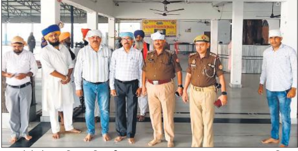
गुरुद्वारे में मौजूद पुलिस अधिकारी।

क्षेत्र के पसियापुरा गांव स्थित शहीद बाबा दीप सिंह गुरुद्वारे के प्रबंधन को लेकर 15 सितंबर को दो पक्षों में बड़ी हिंसा हो गई थी। गुरुद्वारा परिसर में धारदार हथियार चलने के साथ-साथ फायरिंग भी हुई थी। प्रशासन की ओर से भारी फोर्स तैनात हो गई थी। आम जनता का प्रवेश बाधित कर दिया था। गुरुद्वारे में होने वाले साप्ताहिक समागम के दृष्टिगत प्रशासन ने आज लगातार सातवें रविवार को भी संगत के लिए विशेष व्यवस्था की थी। गुरुद्वारे पहुंचे