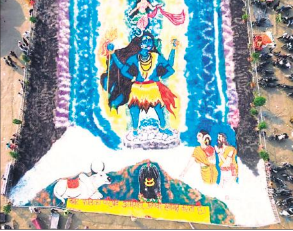
गंगा मेले में बनी शिव-गंगा की रंगोली।

को सर्वोच्च प्राथमिकता देने पर बल दिया। सुरक्षा की दृष्टि से की गई व्यवस्थाओं की सराहना करते