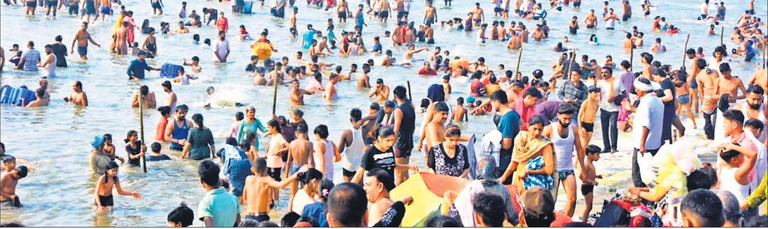
तिगरी में गंगा किनारे लगा मेला आस्था से लबालब हो चुका है। रविवार को स्नान करते बड़ी संख्या में श्रद्धालु।

● शादी के घर में 60 हजार की नकदी-माल पर किया हाथ साफ मोबाइल एवं गाड़ी पुलिस को सौंप दी। रविवार की सुबह जब परिजनों ने घर पर देखा तो उनके होश पड़ा गए। कपरे में सामान बिखरा पड़ा था और संदूक में रखी पचास हजार