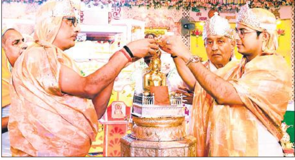
टीएमयू के रिडि- सिद्धि भवन में कल्पद्रुम महामंडल विधान में पूजन करते लोग।