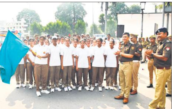
यातायात माह के उद्घाटन के दौरान एसपी व एसपी और महिला पुलिस प्रशिक्षु।