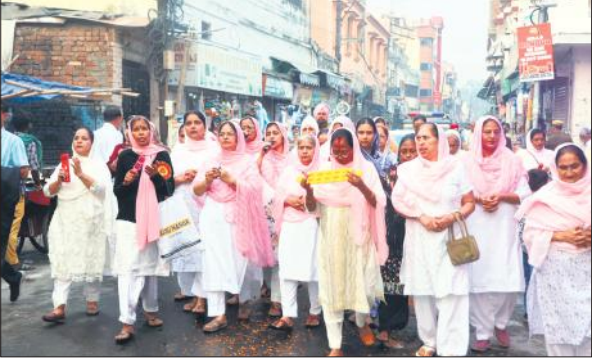
शबद कीर्तन करता महिला रागी जत्था।