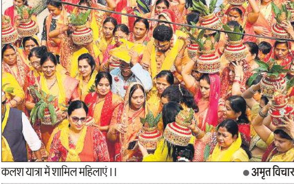
कलश यात्रा में शामिल महिलाएं।