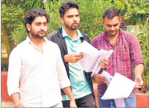
पेपर को लेकर चर्चा करते परीक्षार्थी।