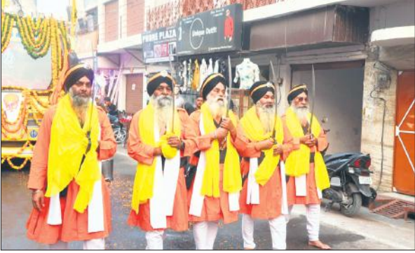
नगर कीर्तन में शामिल पंच प्यारे।

अमृत विचार : श्री गुरु नानक देव महाराज के 556वें आगमन दिवस पर रविवार को खालसा मोहल्ला स्थित गुरुद्वारा श्री कलगीधर से नगर कीर्तन निकाला गया। नगर कीर्तन में युवाओं के हैरतअंगेज करतब देख लोग अचंभित रह गए। नगर कीर्तन रात को गुरुद्वारा संत भाई जी बाबा पहुंचा और गुरु का अटूट लंगर बरताया गया। नगर कीर्तन में सबसे आगे जीप एवं एम्बुलेंस उसके पीछे 11 घोड़ों पर निहंग सवार होकर चल रहे थे और घोड़े भी करतब दिखा रहे थे। घोड़े के पीछे ताशे वालों की टीम चल रही थी। गतका पार्टी मोदी एकेडमी, मिल्टन स्कूल, गुरु नानक पब्लिक स्कूल, गुरु रामदास पब्लिक स्कूल, तारक एकेडमी स्कूल, व्हाइट हॉल पब्लिक स्कूल, गुरु नानक इंटर कॉलेज, गुरु नानक पब्लिक इंटरनेशनल स्कूल, भाई जी बाबा गुरुद्वारे के बच्चों की पीटी टीम, भांगड़ा, बैड, ढोल की टीम ने समां बांध दिया। खालसा मोहल्ले का शबदी जत्था, बाबा दीप सिंह नगर का शबदी जत्था, संत भाई जी