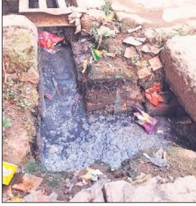
नाली में भरी गंदगी।

अमृत विचार अभियान कार्यालय संवाददाता, रामपुर