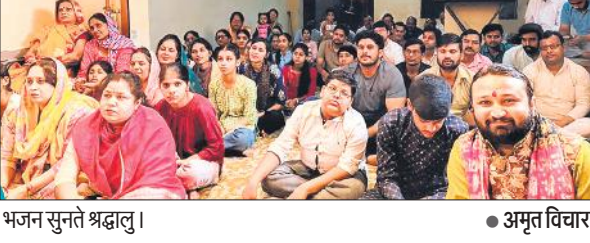
भजन सुनते श्रद्धालु।

हसनपुर, अमृत विचार : गजरौला की ओर जा रही बदामू डिपो की रोडवेज बस को प्लास्टिक भरे कैंटर ने जोरदार साइड मार दी। हादसा इतना भीषण था कि रोडवेज बस अनियंत्रित होकर सड़क किनारे खदक में जा घुसी। यात्रियों में चीख-पुकार मच गई। टक्कर के बाद बस और कैंटर के चालकों के बीच तीखी नोकझोंक हो गई, जिससे मौके पर भीड़ जमा हो गई। कोतवाली पुलिस तुरंत मौके पर पहुंची। पुलिस ने स्थिति को संभाला और दोनों पक्षों को शांत कराया।