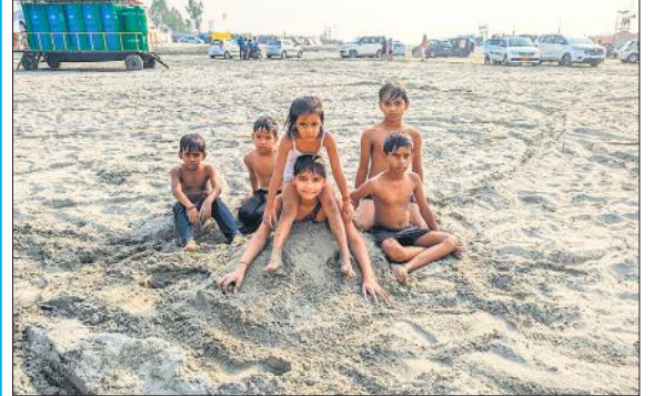
गंगा की रेती पर मस्ती करते बच्चे।

तिगरी गंगा मेला आस्था के साथ ही मनोरंजन का भी केंद्र है। मेले में आए परिवार सुबह स्नान के बाद खिचड़ी का आनंद ले रहे हैं। युवा वर्ग ताश खेल कर समय व्यतीत कर रहा है। टापू में कबड्डी खेल कर मनोरंजन कर रहे हैं। वहीं बालक दिनभर रेत में मौज मस्ती करते हैं। युवतियां वालीबॉल खेल कर मेले का आनंद ले रही हैं।