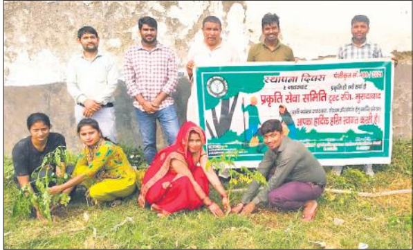
पौधारोपण करते प्रकृति सेवा समिति के पदाधिकारी व कार्यकर्ता।