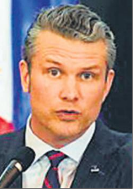
अमेरिकी रक्षामंत्री पीट हेगसेथ।

शनिवार को मलेशिया में दक्षिण-पूर्व एशियाई राष्ट्रों के संघ (आसियान) के अपने समकक्षों के साथ हुई बैठक में हेगसेथ ने विवादित जल क्षेत्रों में चीन की आक्रामकता को लेकर अमेरिका की चिंताओं को दोहराया और जहाजों को टक्कर मारने जैसी घटनाओं का हवाला दिया। उन्होंने चेतावनी दी कि चीन का उकसाने वाला व्यवहार उसके पड़ोसियों की संप्रभुता और क्षेत्रीय स्थिरता को खतरों में डाल सकता है। दक्षिण चीन सागर में चीन के व्यापक क्षेत्रीय एवं समुद्री दावे शांतिपूर्ण तरीके से विवादों को सुलझाने के वादों के विपरीत हैं। उन्होंने कहा कि हम शांति