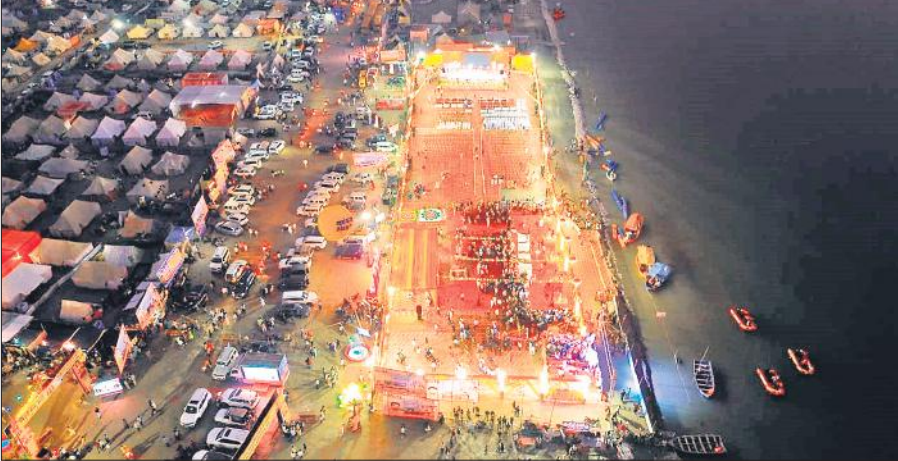
रात में तिगरी गंगा मेले का अद्भुत दृश्य।

तिगरी में गंगा तट पर लग रहे मेले में श्रद्धालुओं के जाने का सिलसिला कई दिन से जारी है। मगर रविवार को श्रद्धालुओं के सैकड़ों ट्रैक्टर ट्रॉली मेला के लिए रवाना हुए। सुबह से शाम तक ट्रैक्टर ट्रॉलियों की लाइन लगी रही। श्रद्धालुओं के परिवार ट्रैक्टर ट्रॉली में जरूरत का सभी सामान लाद कर गंगा में पुण्य कमाने जा रहे हैं। श्रद्धालुओं ने बताया कि कार्तिक पूर्णिमा पर भोर होते ही पतित पावनी में स्नान कर पुण्य कमाएंगे। उधर तिगरी गंगा मेले में स्नान कर पुण्य कमाने जा रहे हैं। श्रद्धालुओं के ट्रैक्टर-ट्रॉली सीधे नहीं जा रहे। उनको तिगरी चेक पोस्ट से मोहरका पट्टी वाले मार्ग से मेला भेजा जा रहा है। यहां पर मुस्तैद पुलिसकर्मी ट्रैक्टर ट्रॉलियों को उधर की तरफ मोड़ देते हैं।