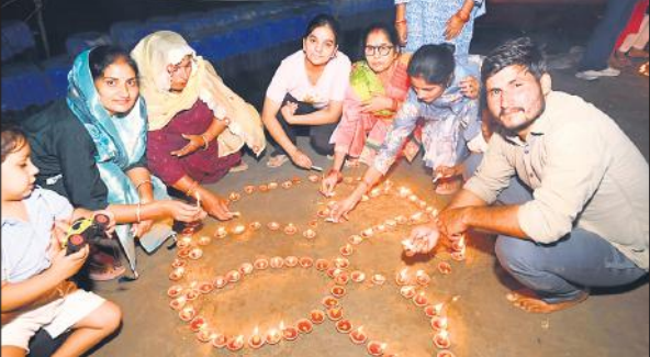
शनिवार रात गंगा घाट पर दीये जलाते लोग।

तिगरी गंगा में स्नान करने के लिए सुबह से ही श्रद्धालुओं की गंगा के घाटों पर भीड़ लगी रही। श्रद्धालुओं ने गंगा में स्नान कर पुण्य लाभ कमाया। वहीं, श्रद्धालुओं ने गंगा में स्नान के दौरान मांगों को नमन और सूर्य नारायण को अर्घ्य देकर कामना की।