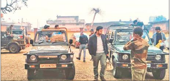
अमानगढ़ टाइगर रिजर्व मेंपहुंचे सैलानी।

सुबह की ठंडी हवा के साथ जब पर्यटकों के वाहन रिजर्व के हरे-भरे जंगलों में दाखिल हुए तो वातावरण में उत्कृष्टता का भाव सात झलक रहा था। हर किसी की नजर इस