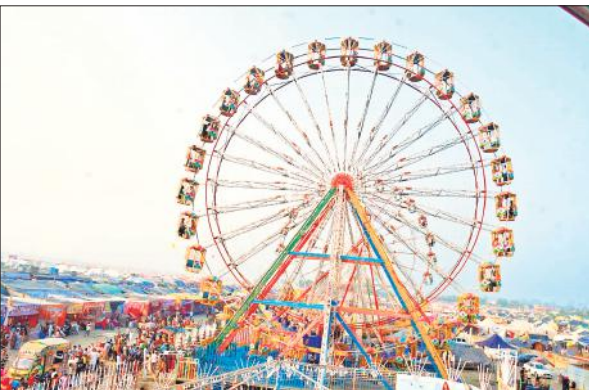
तिगरी गंगा मेले में चलते झूले।