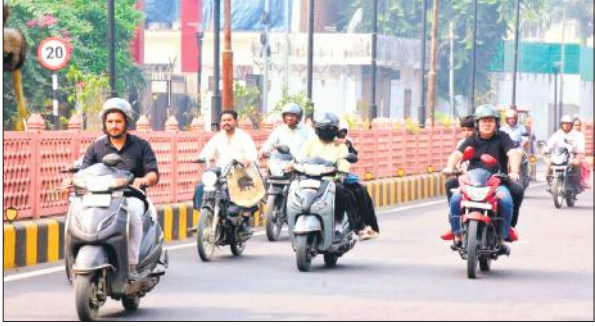
सुबह धुंध के बीचस काम परजाने के लिए निकले लोग।