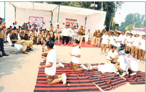
नुक्कड़ नाटक कर यातायात को लेकर जागरूक करती महिला पुलिस प्रशिक्षु।

जिसको लेकर शिक्षक नई रणनीति बना रहे हैं। उसी के चलते टीईटी अनिवार्यता के विरोध में 21 नवंबर को रामलीला मैदान दिल्ली में महारैली होगी। रामपुर जिले से