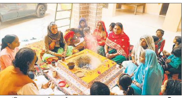
प्रज्ञा मंदिर पर यज्ञ करते आचार्य।