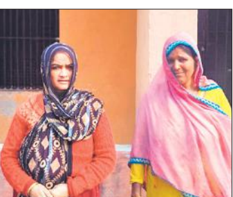
पुलिस की गिरफ्त में आरोपी।