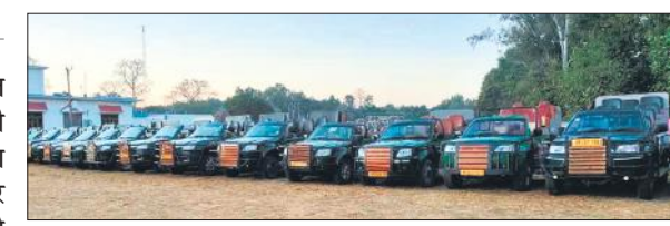
मुस्ताफाबाद के पास खड़े जंगल सफारी वाहन।

विभाग ने इसके लिए पीटीआर प्रशासन को पत्र भेजकर स्पष्ट कर दिया है कि सफारी में प्रयोग होने वाले वाहनों को टैक्सी परमिट लेना अनिवार्य होगा और निर्धारित टैक्स चुकाना पड़ेगा। कई वाहन स्वामियों ने नियमों का पालन करते हुए अपने वाहनों का पंजीकरण भी करा लिया है। यही नहीं, इसके अलावा कामर्शियल रूप से चलने वाली बाइकों पर भी पीली प्लेट लगेंगी। उनको भी टैक्स अदा करना होगा। इससे परिवहन विभाग की आय बढ़ेगी। बता दें कि पीलीभीत टाइगर रिजर्व स्थापित होने के बाद पर्यटकों