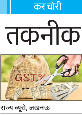
राज्य ब्यूरो, लखनऊ

अमृत विचार, लखनऊ : सपा प्रमुख अखिलेश यादव ने बिहार में इंडिया गठबंधन के प्रत्याशियों के समर्थन में आयोजित रैलियों में वादों की बाछर करते हुुए कहा कि तेजस्वी यादव मुख्यमंत्री बनेंगे तो आगरा-लखनऊ एक्सप्रेस-वे की तरह सड़क बनायेंगे। सपा प्रमुख ने रविवार को सराय रंजन, सीतामढ़ी, छपरा विधानसभा क्षेत्रों में तीन चुनावी जनसभाओं को संबोधित किया।