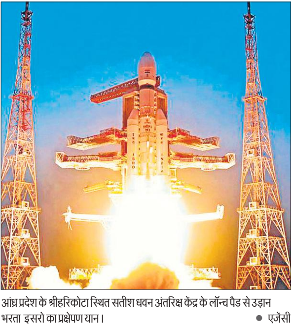
आंध्र प्रदेश के श्रीहरिकोटा स्थित सतीश धवन अंतरिक्ष केंद्र के लॉन्च पैड से उड़ान भरता इसरो का प्रक्षेपण यान।