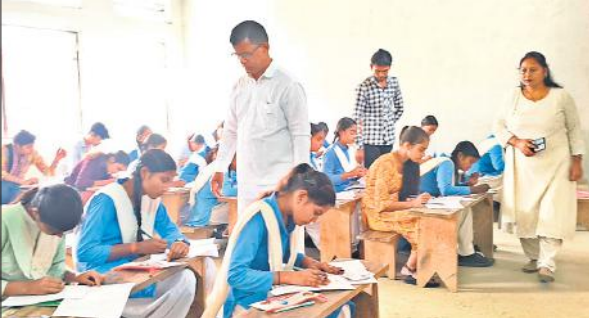
डॉ. आंबेडकर सामान्य ज्ञान परीक्षा देते छात्र, निगरानी करते पर्यवेक्षक।