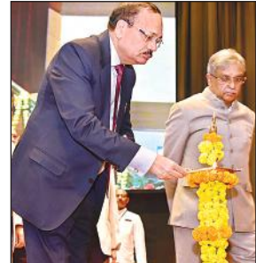
लखनऊ : कार्यक्रम की दीप जलाकर शुरुआत करते न्यायमूर्ति सूर्यकांत।

अमृत विचार : उप्र. राज्य विधिक सेवा प्राधिकरण (यूपीएसएलएसए) द्वारा रविवार को न्यायिक प्रशिक्षण एवं अनुसंधान संस्थान (जेटीआरआई), लखनऊ में कानूनी सहायता के माध्यम से प्रजनन स्वायत्तता में बाधाओं को दूर करना, विषय पर एक संवेदनशीलता कार्यक्रम आयोजित किया गया। यह कार्यक्रम भारत के सर्वोच्च न्यायालय एवं इलाहाबाद उच्च न्यायालय के न्यायमूर्तियों की मौजूदगी में हुआ। कार्यक्रम के दौरान अपने संबोधन में नामित सीजेआई न्यायमूर्ति सूर्यकांत ने कहा कि परिस्थितियां कैसी भी हों, प्रत्येक महिला यह आत्मविश्वास पाने की अधिकारी है कि न्याय व्यवस्था उसके साथ मजबूती से खड़ी है। उन्होंने उप्र.