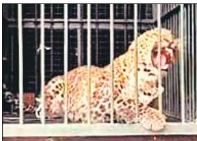
पिंजड़े में कैद तेंदुआ।