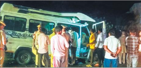
राजस्थान के जोधपुर जिले में हादसे के बाद टैपो-ट्रैवलर से लोगों को निकालते लोग।