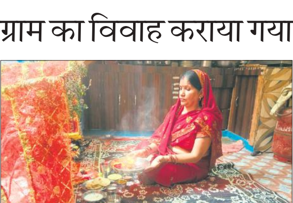
तुलसी विवाह अवसर पर पूजा-अर्चना करती महिला।