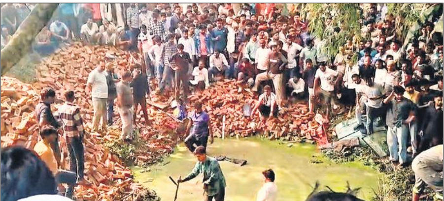
हादसे के बाद मौके पर एकत्र बड़ी संख्या में लोग।

रविवार सुबह करीब 9:30 बजे आरटीओ मुरादाबाद की टीम डिलारी-करणपुर मार्ग पर आलियाबाद के निकट वाहन चेकिंग कर रही थी। इसी दौरान ईंटों से भरी ट्रैक्टर ट्राली आ रही थी। आरटीओ चेकिंग देखकर ट्रैक्टर चालक घबरा गया और ट्रैक्टर की रफ्तार बढ़ा दी। इसी दौरान अनियंत्रित होकर ट्रैक्टर