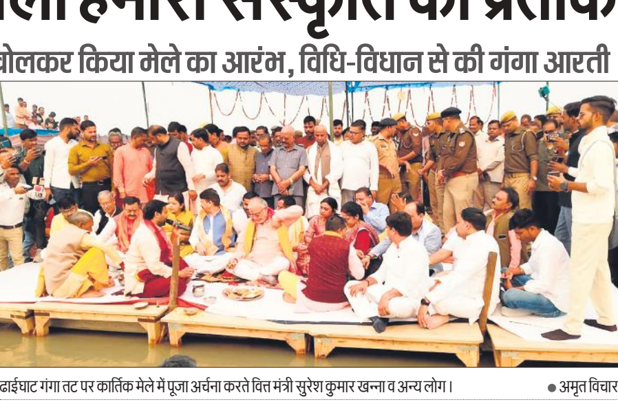
ढाईघाट गंगा तट पर कार्तिक मेले में पूजा अर्चना करते वित्त मंत्री सुरेश कुमार खन्ना व अन्य लोग।

अमृत विचार: देवउठनी एकादशी के बाद रविवार को नगर और आसपास के ग्रामीण क्षेत्रों में महिलाओं ने भगवान विष्णु और तुलसी माता का विवाह विधि-विधानपूर्वक कराया। सुबह से ही महिलाओं में विशेष उत्साह दिखाई दिया। तुलसी विवाह के शुभ अवसर पर वैदिक मंत्रोच्चारण के बीच तुलसी और शालिग्राम का विवाह कराया गया। इस दौरान पारंपरिक गीतों की धुन पर महिलाएं झूम उठीं। “सुगुं लगन आई तुलसी विवाह की” जैसे मंगलगीतों से