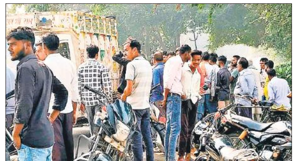
हादसे के बाद मौके पर लगी भीड़।