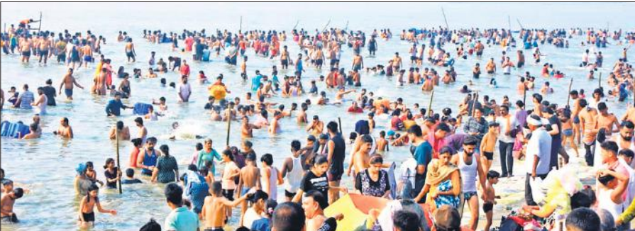
रविवार को स्नान करते बड़ी संख्या में श्रद्धालु।

तिगरी में गंगा तट पर लग रहे मेले में श्रद्धालुओं के जाने का सिलसिला कई दिन से जारी है। मगर रविवार को श्रद्धालुओं के सैकड़ों ट्रैक्टर ट्रॉली मेला के लिए रवाना हुए। सुबह से शाम तक ट्रैक्टर ट्रालियों की लाइन लगी रही। श्रद्धालुओं के परिवार ट्रैक्टर ट्रॉली में जरूरत का सभी सामान लाद कर गंगा में पुण्य कमाने जा रहे हैं। श्रद्धालुओं ने बताया कि कार्तिक