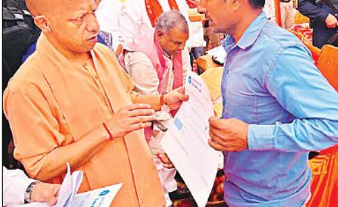
हादसे के प्रभावितों को चेक सौंपते मुख्यमंत्री योगी