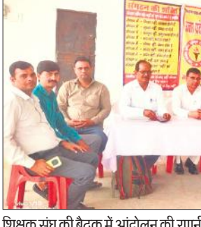
शिक्षक संघ की बैठक में आंदोलन की रणनीति पर विचार करते पदाधिकारी।