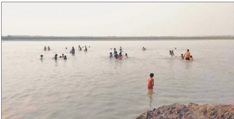
कम पानी में गंगा स्नान करते श्रद्धालु।

पुलिस प्रशासन की ओर से सुरक्षा, स्वच्छता और यातायात व्यवस्था पर विशेष ध्यान दिया जा रहा है। मेला क्षेत्र में सांस्कृतिक मंच तैयार हो चुका है जहां प्रतिदिन भक्ति, लोकगीत और सांस्कृतिक प्रस्तुतियों होंगी। विभिन्न सरकारी विभागों की प्रदर्शनियां भी लोगों के आकर्षण का केंद्र बनी हुई हैं। मीना बाजार में तरह-तरह की दुकानों, खिलौनों, चूड़ियों, मिठाइयों और ग्रामीण उत्पादों की बहार शुरू हो गई है। गंगा तट पर प्रसाद, खिलौनों और धार्मिक वस्तुओं की दुकानों पर श्रद्धालुओं की भारी भीड़ लगी है। चट, पकोड़ी, मूंगफली और पेटे के ठाटों पर लोगों की लंबी कतारें देखी जा रही हैं। पारंपरिक खजला बनाने का कार्य जोरों पर चल रहा