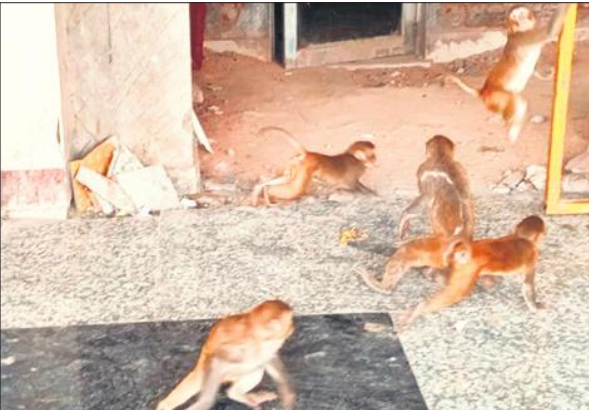
रेलवे स्टेशन पर उछल कूद करते बंदर।

शहर में ही नहीं बल्कि पूरे जिले में बंदरों का आतंक बना हुआ है। हर दिन बंदरों की संख्या बढ़ती जा रही है। शहर के बाजारों में बंदरों के चलते दुकानदार परेशान हैं। गांव खतरा बताया है। पुलिस ने दोनों भाइयों समेत तीन लोगों के खिलाफ रिपोर्ट दर्ज की है।