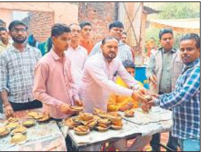
प्रसाद बाँटते श्याम बाबा के भक्त ।