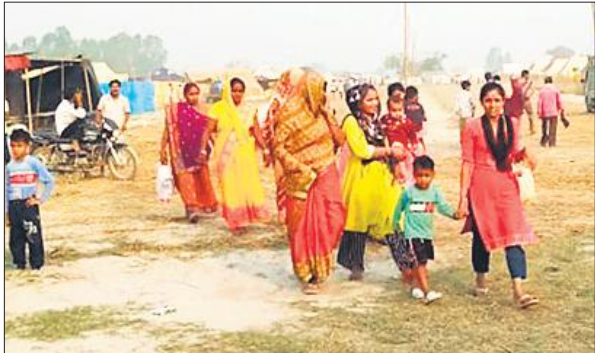
गंगा स्नान करने के लिए जाता परिवार।