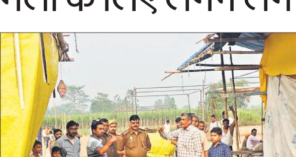
प्रधान व मेला प्रबंधन के साथ मेला क्षेत्र का निरीक्षण करते प्रभारी निरीक्षक।

उत्साहित हैं। श्रद्धालुओं को नदी पर मंदिर जाने के लिए मेला प्रबंधन ने लकड़ी के चार अस्थाई सेतु बनवाए हैं। मेले में दुकानें सज रही हैं, झूले भी लगने शुरू हो गए हैं। मेले में उड़ती धूल से लोगों को निजात मिलेगी इसके लिए गांव से लेकर श्रीराम मंढ़ा मेला मंदिर तक कच्चे रास्ते को डामर रोड में बदला जा रहा है