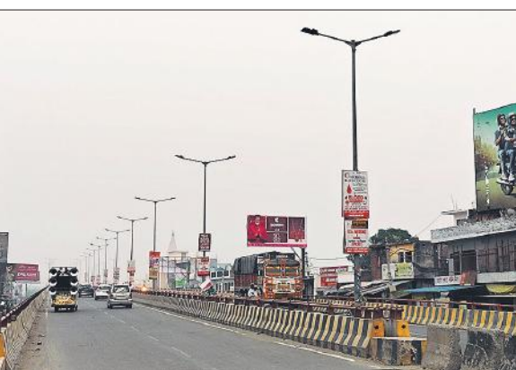
एक सप्ताह से बंद पड़ी हैं लालफाटक ओवरब्रिज की स्ट्रीट लाइट । ● अमृत विचार

सुदृढ़ करने का कार्य शुरू होने से श्रद्धालुओं की बड़ी चिंता दूर हो गई है। कार्तिक पूर्णिमा पर आवागमन सुगम रहेगा, जिससे श्रद्धालुओं को दिक्कत नहीं होगी।