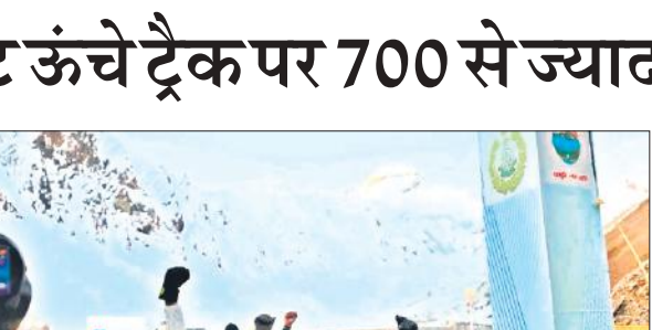
मौके ● अमृत विचार

प्रथम दृष्टया ऐसा प्रतीत होता है कि बच्चियां खेलते समय फिसलकर डूब गईं। दोनों की उम्र पांच से सात वर्ष के बीच है। पुलिस ने बताया कि परिवार की शिकायत के आधार पर डिबाई थाने में मामला दर्ज कर लिया गया है और शवों को पोस्टमार्टम के लिए भेज दिया गया है। उसने कहा कि बच्चियों की मौत के वास्तविक कारण का पता लगाने के लिए जांच जारी है।