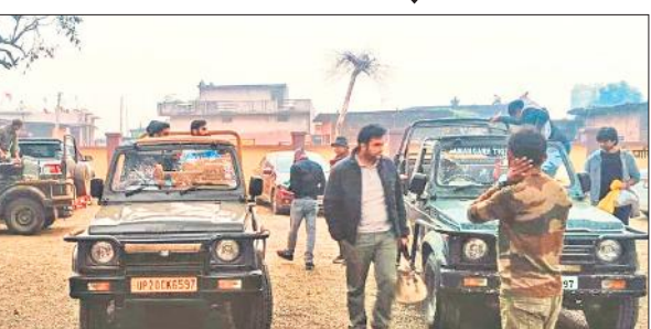
अमानगढ़ टाइगर रिजर्व मेंपहुंचे सैलानी।