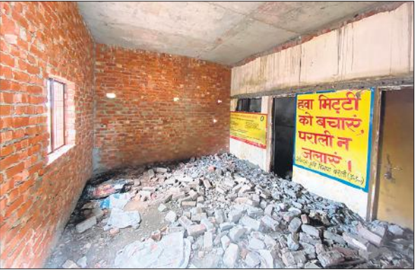
बिथरी ब्लाक परिसर में माडल पीएम आवास, इसमें पुरानी दीवार का प्रयोग किया गया।

अमृत विचार: बिथरी ब्लॉक परिसर में बना पीएम आवास का मॉडल शासन की मंशा के विपरीत जाकर भ्रष्टाचार की भेंट चढ़ गया है। इस आवास को मॉडल के तौर पर ब्लाक की सभी ग्राम पंचायतों में बनाने की बात कही गई थी, लेकिन कमाई के चक्कर में जिम्मेदारों ने इस आवास का नक्शा ही बिगाड़ दिया। इस मॉडल आवास को देखकर खुद का घर बनाने की बात सोची तो उनके घर भी भी नक्शा बिगड़ सकता है। ब्लाक परिसर में 1.20 लाख रुपये की लागत से बने इस आवास में नक्शे के विपरीत मानकों की अनदेखी जमकर की गई। इस मॉडल आवास में न तो शौचालय