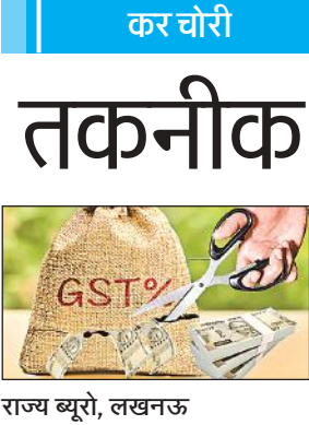
राज्य ब्यूरो, लखनऊ

अमृत विचार, लखनऊ : सपा प्रमुख अखिलेश यादव ने बिहार में इंडिया गठबंधन के प्रत्याशियों के समर्थन में आयोजित रैलियों में वादों की बाछर करते हुुए कहा कि तेजस्वी यादव मुख्यमंत्री बनेंगे तो आगरा-लखनऊ एक्सप्रेस-वे की तरह सड़क बनायेंगे। सपा प्रमुख ने रविवार को सराय रंजन, सीतामढ़ी, छपरा विधानसभा क्षेत्रों में तीन चुनावी जनसभाओं को संबोधित किया।