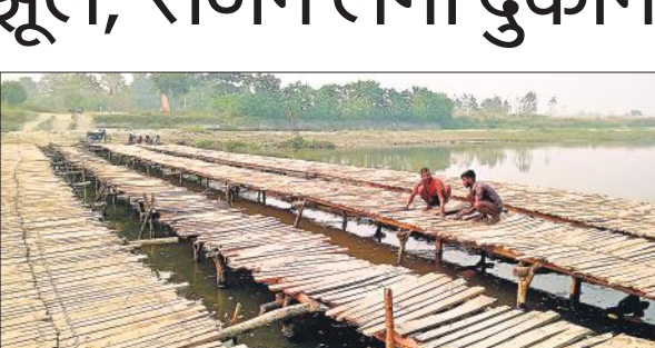
नदी पर आवागमन के लिए अस्थाई पुलों का निर्माण कराया गया।

उत्साहित हैं। श्रद्धालुओं को नदी पर मंदिर जाने के लिए मेला प्रबंधन ने लकड़ी के चार अस्थाई सेतु बनवाए हैं। मेले में दुकानें सज रही हैं, झूले भी लगने शुरू हो गए हैं। मेले में उड़ती धूल से लोगों को निजात मिलेगी इसके लिए गांव से लेकर श्रीराम मंढ़ा मेला मंदिर तक कच्चे रास्ते को डामर रोड में बदला जा रहा है