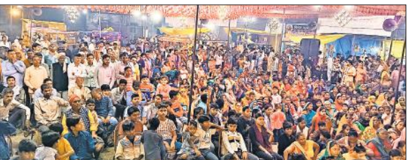
रिटौरा में रामलीला देखने पहुंचे दर्शक