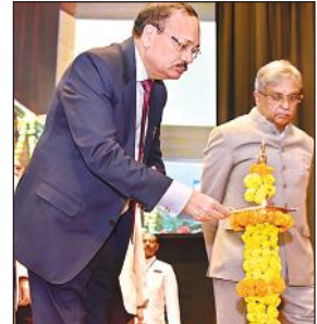
लखनऊ : कार्यक्रम की दीप जलाकर शुरुआत करते न्यायमूर्ति सूर्यकांत।

अमृत विचार : उप्र. राज्य विधिक सेवा प्राधिकरण (यूपीएसएलएसए) द्वारा रविवार को न्यायिक प्रशिक्षण एवं अनुसंधान संस्थान (जेटीआरआई), लखनऊ में कानूनी सहायता के माध्यम से प्रजनन स्वायत्तता में बाधाओं को दूर करना, विषय पर एक संवेदनशीलता कार्यक्रम आयोजित किया गया। यह कार्यक्रम भारत के सर्वोच्च न्यायालय एवं इलाहाबाद उच्च न्यायालय के न्यायमूर्तियों की मौजूदगी में हुआ। कार्यक्रम के दौरान अपने संबोधन में नामित सीजेआई न्यायमूर्ति सूर्यकांत ने कहा कि परिस्थितियां कैसी भी हों, प्रत्येक महिला यह आत्मविश्वास पाने की अधिकारी है कि न्याय व्यवस्था उसके साथ मजबूती से खड़ी है। उन्होंने उप्र.