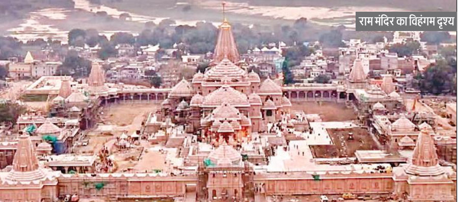
राम मंदिर का विहंगम दृश्य

अमृत विचार: श्री राम मंदिर के शिखर पर 25 नवंबर को प्रधानमंत्री नरेंद्र मोदी ध्वजारोहण करेंगे। यह देश के सभी मंदिरों से ऊंचा ध्वज होगा। ट्रस्ट के महासचिव चंपत राय का दावा है कि धरती से मंदिर के 191 फीट ऊपर ध्वजारोहण का यह पहला अवसर होगा। इस आयोजन को संपन्न कराने के लिए सेना के एक्सपर्ट जवानों की भी मदद ली जा रही है।