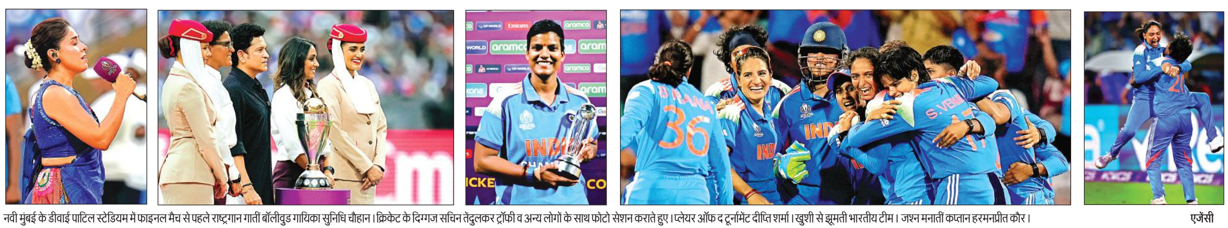
नवी मुंबई के डीवाई पाटिल स्टेडियम में फाइनल मैच से पहले राष्ट्रगान गाती बॉलीवुड गायिका सुनिधि चौहान। क्रिकेट के दिग्गज सचिन तेंदुलकर ट्रॉफी व अन्य लोगों के साथ फोटो सेशन कराते हुए। प्लेयर ऑफ द टूर्नामेंट दीप्ति शर्मा। खुशी से झूमती भारतीय टीम। जश्न मनाती कप्तान हरमनप्रीत कौर।