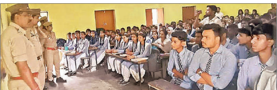
कॉलेज में छात्र-छात्राओं को नए कानूनों की जानकारी देती पुलिस।

दी। उन्होंने अपराध प्रौद्योगिकी, फॉरेंसिक साइंस के उपयोग और साइबर अपराध से बचाव के उपायों पर विस्तार से चर्चा की। इस मौके पर महिला एवं बाल संरक्षण से जुड़े नए प्रावधानों के बारे में जानकारी दी। उन्होंने अपराध प्रौद्योगिकी, फॉरेंसिक साइंस के उपयोग और साइबर अपराध से बचाव के उपायों पर विस्तार से चर्चा की। इस मौके पर महिला एवं बाल संरक्षण से जुड़े नए प्रावधानों के बारे में जानकारी दी।