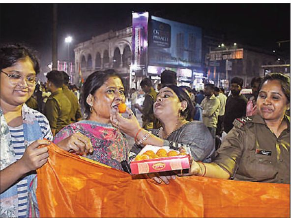
विश्वकप में भारत की बेटियों की जीत की खुशी में पुलिस कर्मियों ने भी मिठाई बांटी।

अमृत विचार: एक दिवसीय महिला क्रिकेट विश्व कप के फाइनल में दक्षिण अफ्रीका पर जीत के साथ ही शहर के क्रिकेट प्रेमी सड़कों पर उतर आए। हाथों में तिरंगा, गेंद-बैट लेकर भारत माता के जयकारे लगाए और आतिशबाजी जलाकर जीत का जश्न मनाया। एक-दूसरे को मिठाई भी खिलाईं। दुनिया में तिरंगा लहराने की खुशी में चौराहे पर ड्यूटी पर शामिल पुलिस कर्मी भी शामिल हो गए। देर रात तक जश्न चलता रहा। आधी रात को चौक-चौराहे, अलीगंज, हजरतगंज और गोमती नगर, कपूरथला, इंदिरानगर राजाजीपुरम, कुंडरी रकाबगंज, सहित कई प्रमुख स्थानों पर लोगों ने जमकर पटाखे चलाए। वहीं इस दौरान आतिशबाजी की रोशनी से शहर का आसमान सतरंगी हो उठा। जीत के एहसास के बाद पल भर के लिए सब कुछ ठहर गया, फिर खुशी के आंसू और मिठाइयों-बधाइयों का दौर शुरू हो गया। महिलाएँ हाथों में तिरंगा लिए, सड़कों पर उतर पड़े। 'वंदे मातरम' और 'भारत माता की जय' के नारों से हर सड़क और गली गूंज उठी।