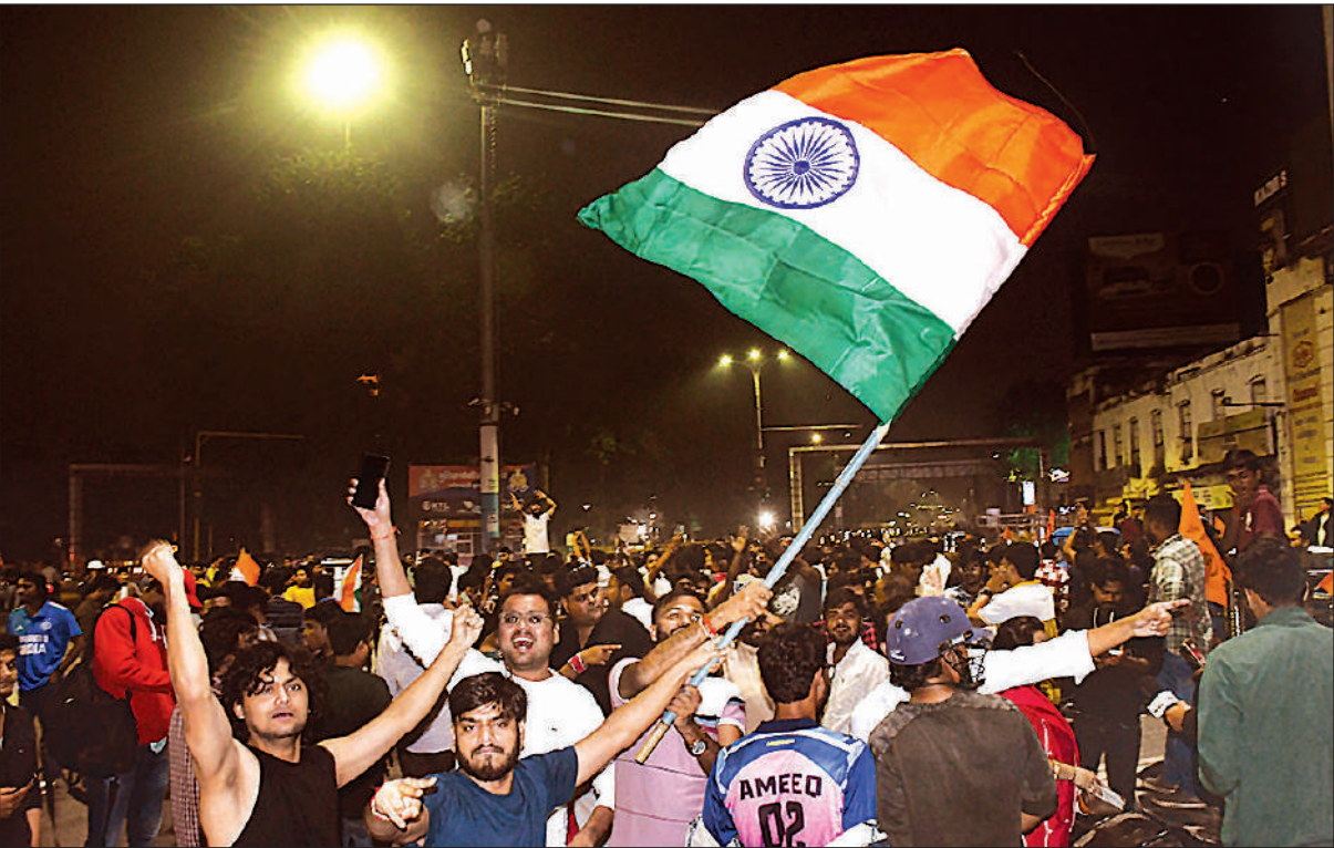
एक दिवसीय महिला क्रिकेट विश्व कप में भारतीय टीम की जीत के बाद राष्ट्रीय ध्वज लेकर बच्चे, महिलाएं, युवा और बुजुर्ग रविवार देर रात सड़कों पर उतर आए। शहर के हृदय स्थल हजरतगंज चौराहे पर भारत माता के जयकारे लगाकर जमकर जश्न मनाया।