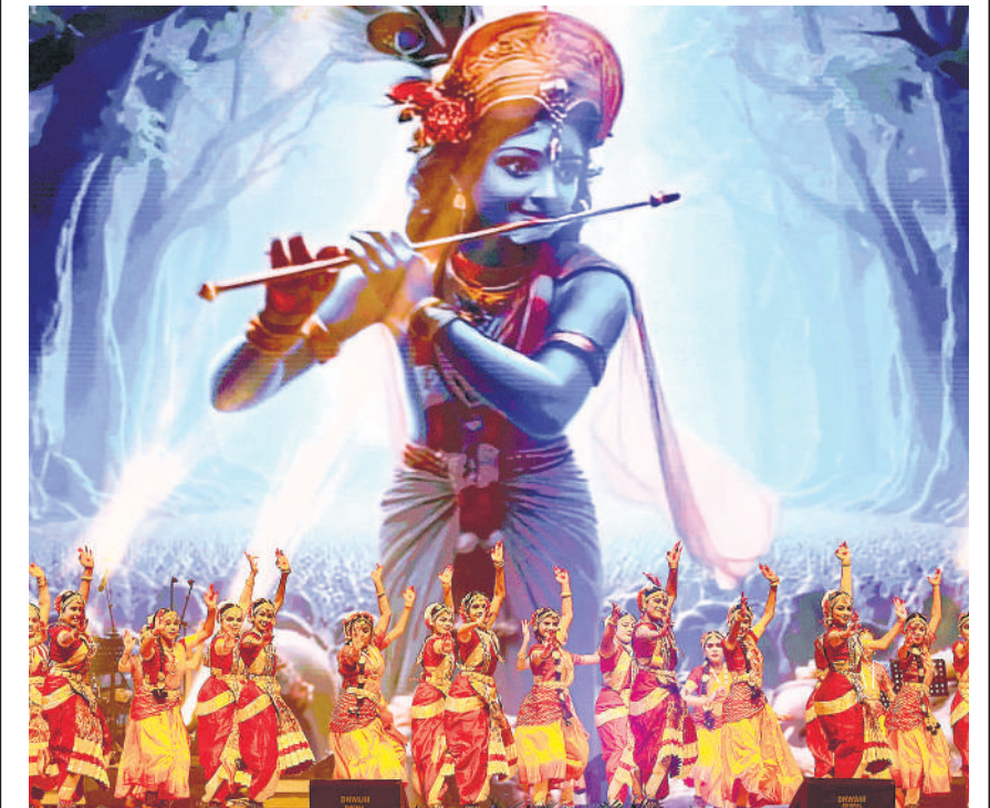
मध्य प्रदेश के 70वें स्थापना दिवस के अवसर पर शनिवार को राजधानी भोपाल में एक सांस्कृतिक कार्यक्रम आयोजित किया गया, इस दौरान कलाकारों ने विविध मनोहारी प्रस्तुतियां दीं जिसमें भगवान श्रीकृष्ण को समर्पित लीलाएं भी शामिल थीं । प्रस्तुतियों ने उपस्थित लोगों को मंत्रमुग्ध कर दिया ।