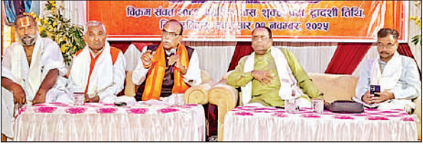
बैठक में मौजूद पदाधिकारी।

अमृत विचार। विश्व हिन्दू परिषद के गोरक्ष प्रान्त की विभागीय बैठक रविवार को जिला मुख्यालय स्थित जेपीएस ग्रांड पैलेस में रविवार को सम्पन्न हुई। बैठक में मुख्य वक्ता के रूप में उपस्थित विश्व हिन्दू परिषद के राष्ट्रीय सह संगठन मंत्री गोविंद शंडे ने कहा कि गोरक्षा केवल धार्मिक कार्य नहीं, बल्कि सांस्कृतिक और राष्ट्रीय कर्तव्य है। धर्मान्तरण समाज की एक गंभीर समस्या बन चुकी है, जिसे रोकने के लिए संगठन स्तर पर जागरूकता अभियान चलाया जा रहा है। उन्होंने कार्यकर्ताओं से आह्वान किया कि वे गांव-गांव जाकर समाज में एकता, सेवा और संगठन की भावना को मजबूत करें