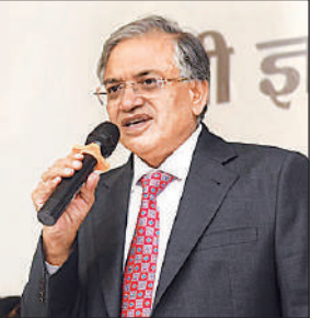
मुख्य निर्वाचन आयुक्त ज्ञानेश कुमार।

कार्यक्रम में पत्रकारों से बातें करते हुए उन्होंने कहा कि देश में मतदाता सूची का शुद्धिकरण होने जा रहा है। इस कार्य में लगभग 51 करोड़ मतदाता जद में आएंगे। मैं भरोसा दिलाता हूं कि इस प्रक्रिया