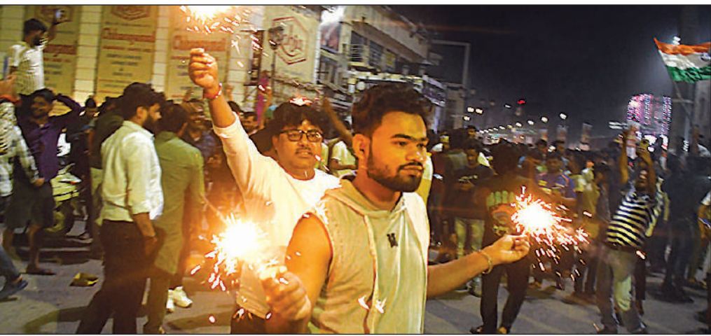
एक दिवसीय महिला क्रिकेट विश्व कप में भारतीय टीम की जीत के बाद हजरतगंज चौराहे पर आतिशबाजी जलाकर जश्न मनाते युवक।