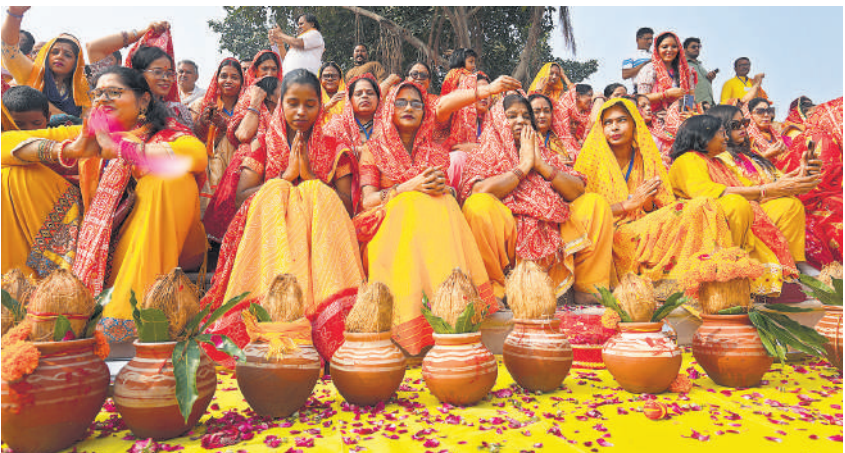
यमुना संसद अभियान के तहत यमुनोत्सव 2025 के पहले दिन रविवार को नई दिल्ली में यमुना के किनारे वासुदेव घाट पर पारंपरिक परिधानों में सजी महिलाएं अनुष्ठान करने के लिए एकत्रित हुईं।