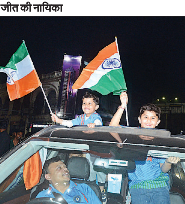
जीत की खुशी में तिरंगा लहराते बच्चे।