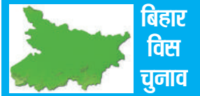
बिहार विस चुनाव

समय दरती से गला काट दिया । अधिकारी ने बताया कि व्यक्ति ने अपनी बड़ी बेटी की भी हत्या करने की कोशिश की लेकिन वह बच निकलने में सफल रही । आरोपी ने बाद में अपने घर में फंदे से लटकर आत्महत्या कर ली । पुलिस ने प्रारंभिक जांच के आधार पर कहा कि ऐसा प्रतीत होता है कि व्यक्ति और उसकी पत्नी के बीच कुछ विवाद था । पुलिस ने मामला दर्ज कर लिया गया है और जांच जारी है । अस्पताल में भर्ती बड़ी बेटी ने बताया कि शनिवार को माता-पिता में झगड़ा हुआ था जिसके बाद-मां घर से चली गई थी ।