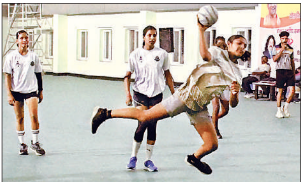
महिला हैंडबॉल प्रतियोगिता के मैच के दौरान संघर्ष करती खिलाड़ी।

उत्तर प्रदेश खेल निदेशालय और उत्तर प्रदेश हैंडबॉल एसोसिएशन में चल रही प्रतियोगिता का आयोजन किया जा रहा है। केडी सिंह बाबू स्टेडियम स्थित भारत रत्न अटल बिहारी बाजपेयी बहुउद्देश्यीय हाल में रविवार को क्वार्टर फाइनल लखनऊ का सामना आजमगढ़ मंडल की टीम से हुआ। इसमें