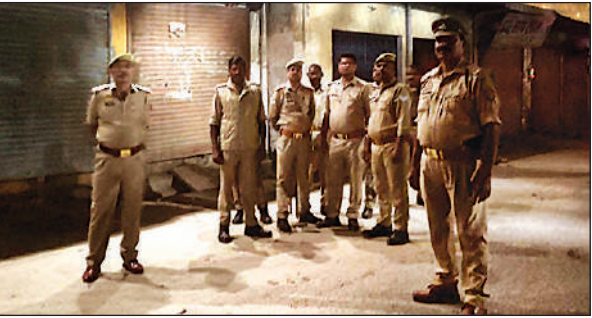
कोतवाली खलीलाबाद क्षेत्र की रेप पीड़िता के गांव में तैनात अतिरिक्त पुलिस बल।