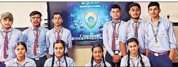
साइबर क्राइम पर जानकारी देते अंबिका स्कूल के बच्चे।