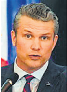
अमेरिकी रक्षामंत्री पीट हेगसेथ।

शनिवार को मलेशिया में दक्षिण-पूर्व एशियाई राष्ट्रों के संघ (आसियान) के अपने समकक्षों के साथ हुई बैठक में हेगसेथ ने विवादित जल क्षेत्रों में चीन की आक्रामकता को लेकर अमेरिका की चिंताओं को दोहराया और जहाजों को टक्कर मारने जैसी घटनाओं का हवाला दिया। उन्होंने चेतावनी दी कि चीन का उकसाने वाला व्यवहार उसके पड़ोसियों की संप्रभुता और क्षेत्रीय स्थिरता को खतरों में डाल सकता है। दक्षिण चीन सागर में चीन के व्यापक क्षेत्रीय एवं समुद्री दावे शांतिपूर्ण तरीके से विवादों को सुलझाने के वादों के विपरीत हैं। उन्होंने कहा कि हम शांति