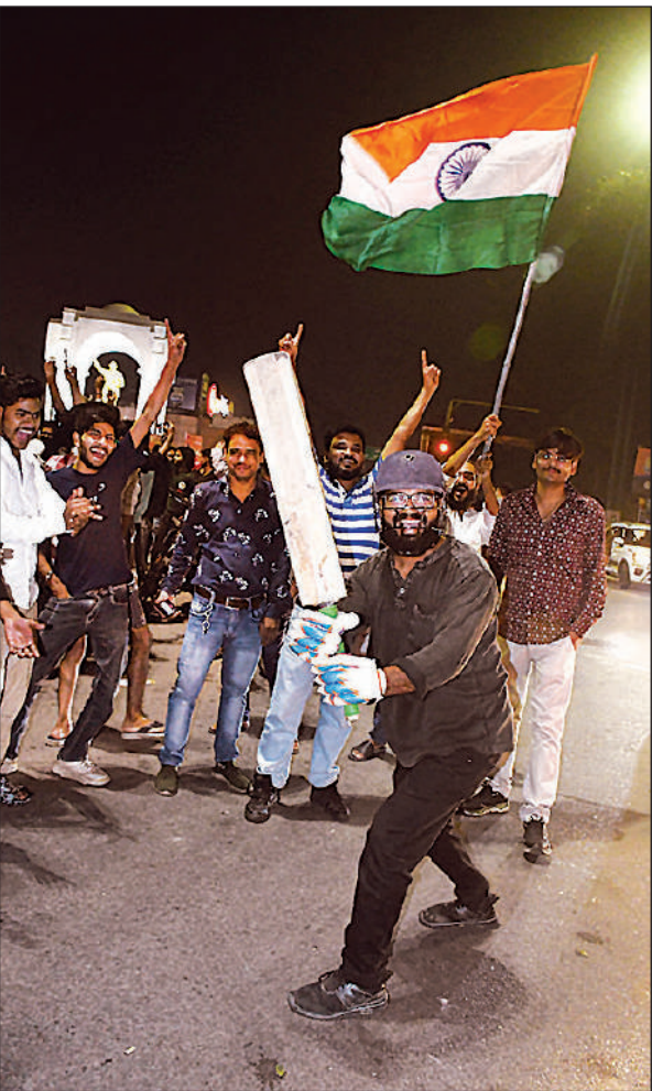
क्रिकेट खेलने के अंदान में हजरतगंज चौराहे पर खुशी मनाता युवा।

हाथों में तिरंगा और गेंद-बैट लेकर देर रात सड़कों पर उतरे लोग, जलाई आतिशबाजी और बांटी मिठाई