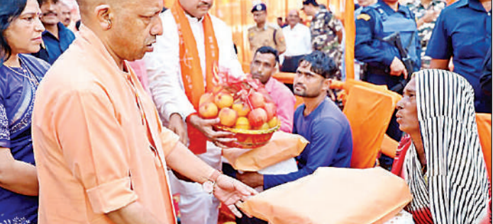
पीड़ित परिवारों को राहत सामग्री वितरित करते मुख्यमंत्री, साथ में अन्य