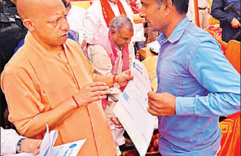
हादसे के प्रभावितों को चेक सौंपते मुख्यमंत्री योगी