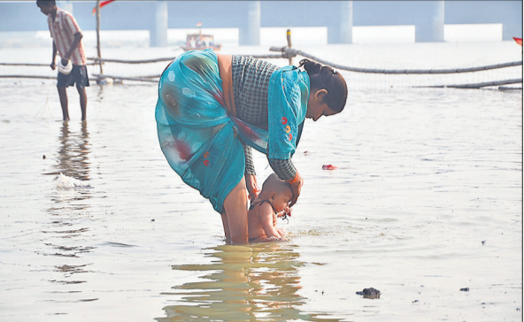
चौबारी घाट पर रामगंगा में बच्चे की डुबकी लगाती मां।

घाट पर पूजा पाठ करवाने वाले गोस्वामी समाज के लिए जगह चिह्नित कर दी गई। मेला पूरा सज चुका है। मेले में श्रद्धालु पहुंचने लगे हैं। लोग चाट-पकौड़े, गोल गप्पे आदि का स्वाद ले रहे हैं। मिठाई की दुकानों पर खजला और जलेबी की खूब बिक्री हो रही है। हालांकि, मीना बाजार में ग्राहकों की आमद कम है। दुकानदारों के अनुसार मंगलवार व बुधवार को ग्राहकों की संख्या बढ़ जाएगी।