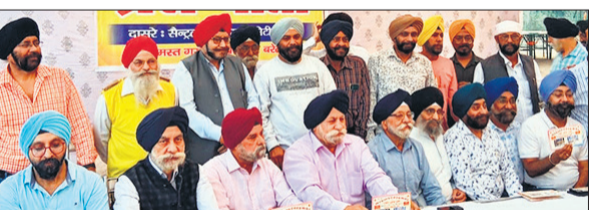
बरेली कॉलेज में कीर्तन दरबार के बारे में जानकारी देते कमेट्री के पदाधिकारी।

बरेली, बरेली, अमृत विचार : गुरु नानक देव के प्रकाश पर्व के उपलक्ष्य में सेंट्रल गुरुपर्व कमेट्री की ओर से बरेली कॉलेज के हॉकी ग्राउंड पर मंगलवार को कीर्तन दरबार का आयोजन शाम 7 से रात 10 बजे तक किया जाएगा। जिसमें बाहर से आए हुए जत्थे पहुंचेंगे।