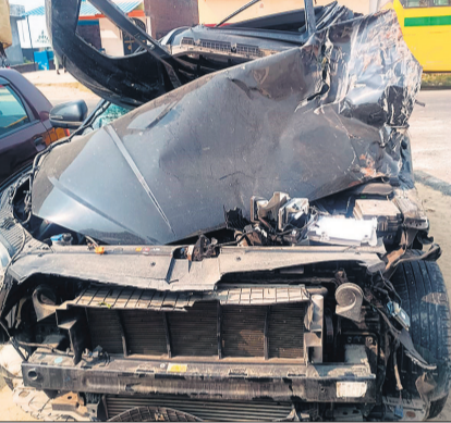
हादसे में क्षतिग्रस्त कार।