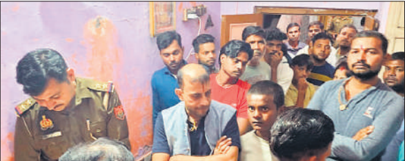
कमरे में शव मिलने के बाद पहुंची पुलिस और मोहल्ले वाले।