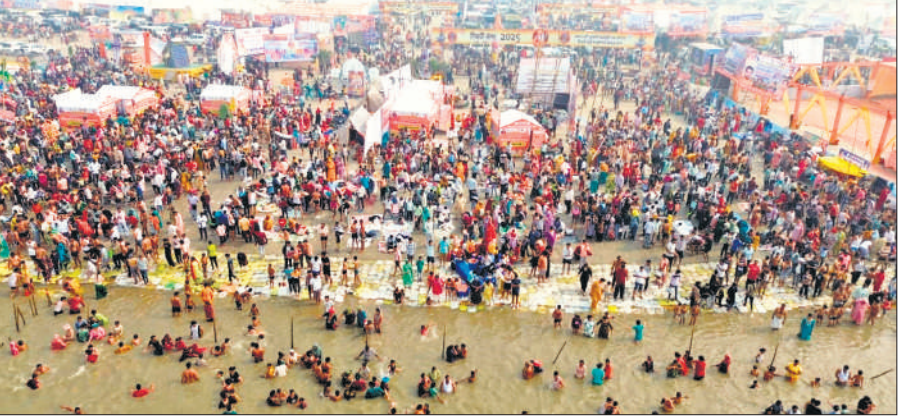
सोमवार को तिगरी गंगा में स्नान करते बड़ी संख्या में श्रद्धालु।