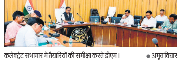
कलेक्ट्रेट सभागार में तैयारियों की समीक्षा करते डीएम।

बैठक में बताया गया कि 11 से 15 नवंबर तक होने वाली प्रतियोगिता में 44 टीम बालकों की और 44 बालिकाओं की शामिल होगी। प्रतियोगिता में 1056 प्रतिभागी शामिल होंगे। प्रत्येक टीम के लिए लाइजनिंग ऑफिसर तैनात किए