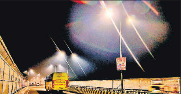
सोमवार शाम को जली लाल फाटक पुल की स्ट्रीट लाइट।