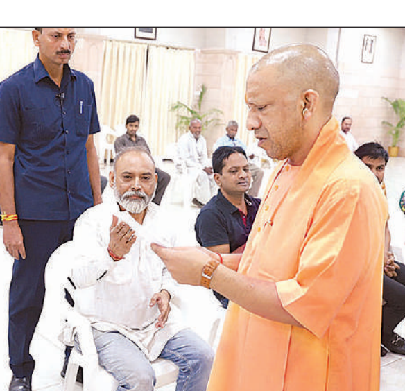
लखनऊ में जनता दर्शन के दौरान लोगों की समस्याएं सुनते मुख्यमंत्री योगी आदित्यनाथ।

कराने का कार्य कराएगी। नगर विकास विभाग ने यूपी एससीआर में करीब 250 किलोमीटर लंबे और छह लेन चौड़े विज्ञान पथ की कार्ययोजना बनाने के निर्देश दिए हैं। विज्ञान पथ से लखनऊ से हरदोई, सीतापुर, बाराबंकी, रायबरेली और उन्नाव को सीधे