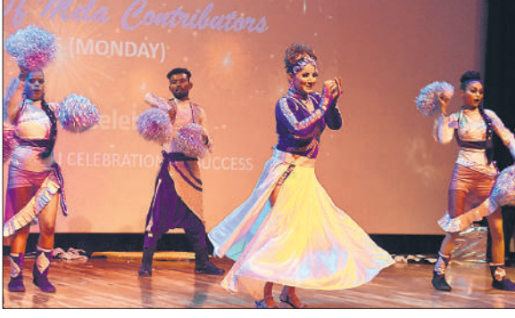
अर्बन हाट सभागार में म्यूजिकल नाइट में प्रस्तुति देते कलाकार।