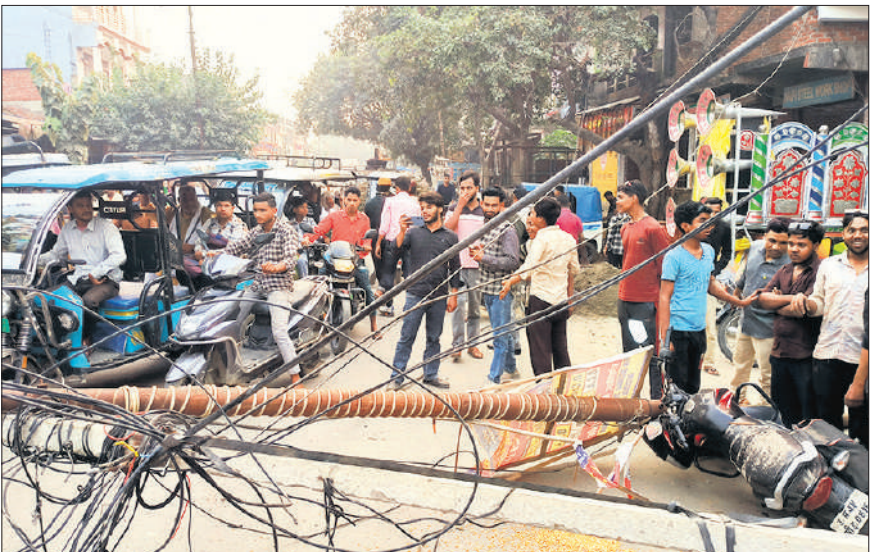
बिजली के तार वाले खंभे गिरने से सड़क पर जाम लग गया। काफी देर तक लोग करंट के डर से भयभीत रहे।

पोल और तार गिरने से पूरे इलाके की बिजली आपूर्ति बाधित हो गई। शॉर्ट सर्किट की आशंका से लोगों में डर का माहौल बन गया। पोल गिरने से तार जमीन परलगने से लोग करंट फैलने के डर से दहशत में रहे। कई लोग तो मौके से ही भाग खड़े हुए। बिजली