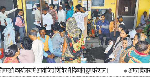
सीएमओ कार्यालय में आयोजित शिविर में दिव्यांग हुए परेशान।