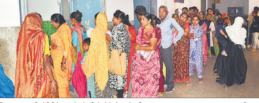
जिला अस्पताल की ओपीडी में लाइन में लगे मरीजों को बैठने तक के नहीं इंतजाम। ● अमृत विचार

सुबह 8 से 1 बजे तक ओपीडी में मरीजों की भीड़ रही। डॉक्टरों के अनुसार मौसम में बदलाव के चलते वायरल बुखार और त्वचा रोगियों की संख्या में लगातार इजाफा हो रहा है। कई युवा मरीज बुजुर्गों के लिए आरक्षित