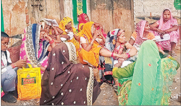
समिति पर खाद लेने आई महिलाएं।

अमृत विचार। क्षेत्र की साधन सहकारी समितियों पर किसानों की खाद के लिए सुबह से लम्बी-लम्बी लाइनें लग रही हैं, कटियारी का किसान एक-एक बोरी खाद के लिए जद्दोजहद कर रहा है। क्षेत्र के सभी खाद वितरण सेंटर पर किसान लाइन में लगकर खाद के लिए घंटों लाइन में लगने को मजबूर हैं। हालात ऐसी है कि घर का चौका-चूल्हा छोड़कर महिलाएं भी लाइन में लग रही हैं। कई किसान तो सुबह से लाइन लगाने आ जाते हैं, वहीं अधिकारी दावा कर रहे हैं कि खाद का संकट नहीं है। कुछ दिन पहले बारिश के बाद जो कुछ बचा था वगैर गंगा रामगंगा नदी में आई बाढ ने सब कुछ नष्ट कर