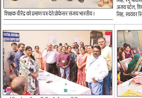
आयोजित नेत्र परीक्षण शिविर में मौजूद अतिथि।