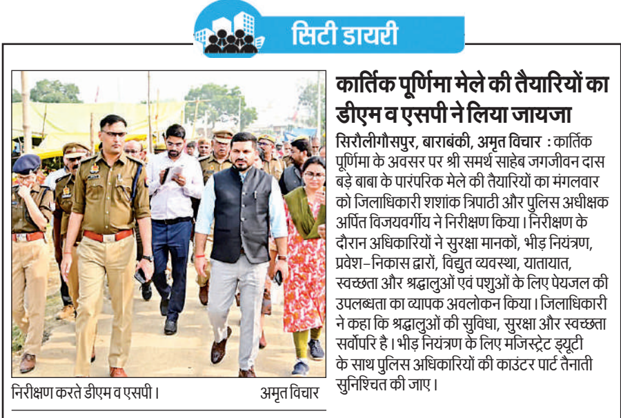
निरीक्षण करते डीएम व एसपी।