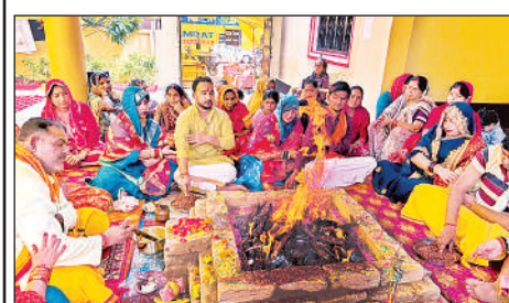
हवन-पूजन करते श्रद्धालु।