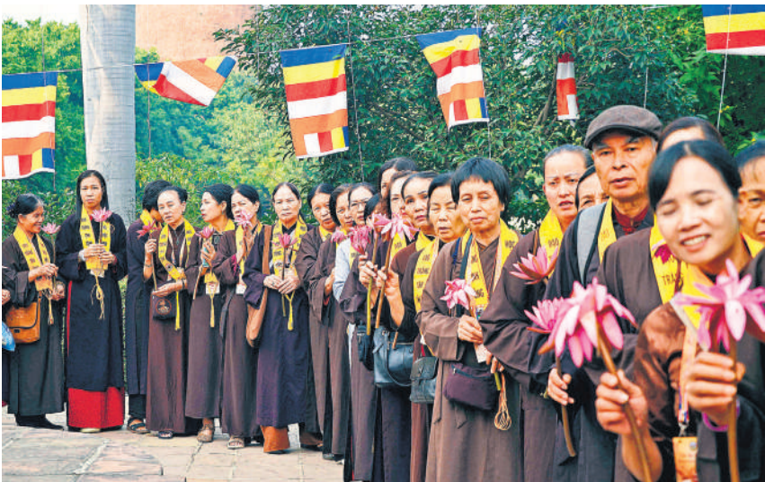
वाराणसी के सारनाथ में महाबोध सोसाइटी ऑफ इंडिया द्वारा आयोजित तीन दिवसीय समारोह के दौरान एक बौद्ध मंदिर में प्रवेश पाने के लिए कतार लगाकर खड़े विद्यतनाम के पर्यटक। उन्होंने अपने आराध्य को अर्पित करने को फूल भी ले रखे हैं।