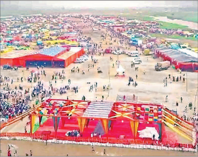
बेरिया घाट पर सजा कार्तिक मेला ।