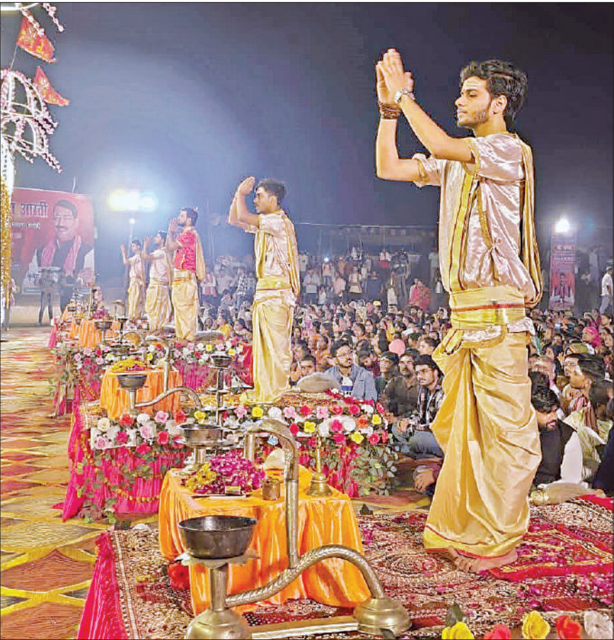
मंगलवार शाम मां गंगा की आरती करते पुजारी व मौजूद श्रद्धालु ।

बिलग्राम, हरदोई। एसडीएम ने बताया कि बिलग्राम से लेकर राजघाट तक मेले में दो सीओ, 50 दरोगा, 150 सिपाही, 25 महिला सिपाही, एक फ्लड यनिट की टीम लगाई गई है। मेले में सभी को ड्यूटी प्वाइंट बताकर ड्यूटी शनिवार की साम से ही तैनात कर दी गयी है। उन्होने बताया कि रास्ते पर पूरी रात गस्त के लिए दो टीमें बना दी गई हैं ताकि कोई जाम न लगे और स्नान के लिए लोग सुरक्षित घाट तक पहुंच सकें।