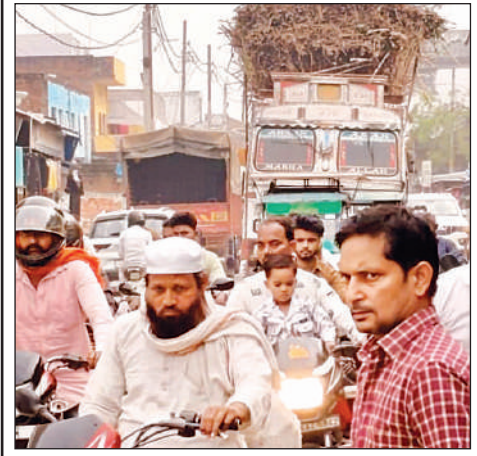
लहरपुर स्थित केसरीगंज मार्ग पर लगा वाहनों का जाम।