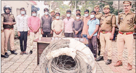
बरामद माल के साथ पकड़े गए तार चोरी गैंग के आरोपी।