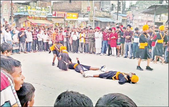
गुरु नानक देव के प्रकाश पर्व पर निकाली गई शोभायात्रा में करतब दिखाते सिख युवक।