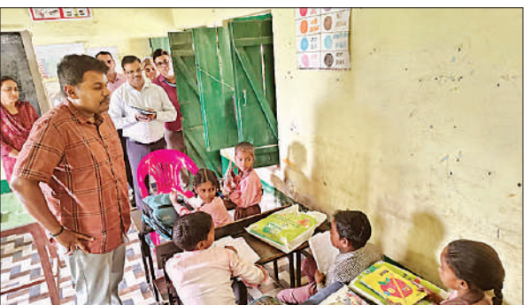
प्राथमिक विद्यालय में बच्चों से संवाद करते जिलाधिकारी। ● अमृत विचार

की उपलब्धता पर डीएम ने खुद लिया हिसाब : इमलिया सुल्तानपुर। ऐलिया ब्लॉक इलाके में डीएम ने सबसे पहले टिकरा जार स्थित एएनएम सेंटर का निरीक्षण किया। केंद्र पर सुविधाओं का जायजा लेते हुए उन्होंने दवाओं की उपलब्धता, साफ-सफाई व अभिलेखों की जांच की। कमियां मिलने पर संबंधितों को तुरंत