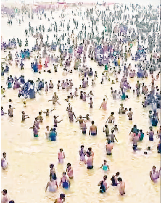
बेरियाघाट पर स्नान करते श्रद्धालु ।