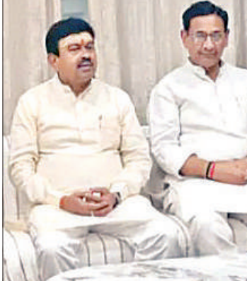
पालिका अध्यक्ष के आवास पर उपस्थित सांसद अजय मिश्रा टेनी।

टेनी ने कहा कि बिहार में भाजपा भारी बहुमत से सरकार बनाने जा रही है। कांग्रेस पर निशाना साधते हुए उन्होंने कहा कि राहुल गांधी बिना प्रमाण के कुछ भी बोल देते हैं। इमरान मसूद का जिक्र करते हुए उन्होंने कहा कि वही उस पार्टी के नेता हैं जिसके नेता राहुल गांधी हैं। अखिलेश यादव, राहुल गांधी और तेजस्वी यादव पर तंज कसते हुए कहा कि इन्हें राजनीति विरासत में मिली है। जमीन पर संघर्ष