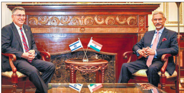
नई दिल्ली में बैठक के दौरान इजराइली समकक्ष गिदोन सार के साथ विदेश मंत्री विदेश मंत्री एस जयशंकर।

दोनों देश आने वाले महीनों में इजराइल के प्रधानमंत्री बेजामिन नेतन्याहू की भारत यात्रा की संभावना पर भी विचार कर रहे हैं। बैठक में भारत-पश्चिम एशिया-यूरोप आर्थिक गलियारा (आईएमईसी) पर भी चर्चा हुई, जिसके तहत क्षेत्रीय संपर्क व व्यापार को बढ़ावा देने के अवसरों की तलाश की जा रही है। विदेशमंत्री एस जयशंकर ने अपने उद्घाटन वक्तव्य में कहा कि भारत और इजराइल दोनों आतंकवाद की चुनौती का सामना कर