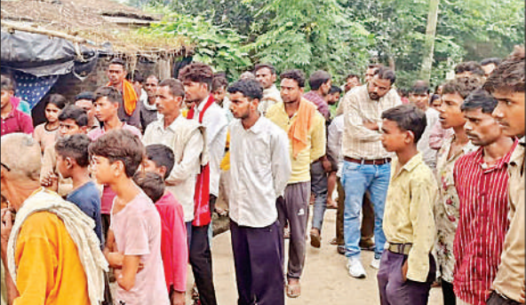
पिसावां में हुई वारदात के बाद घर के बाहर जुटी ग्रामीणों की भीड़। ● अमृत विचार

इस पर झगड़ा शुरू हो गया और भोला के पक्ष में उसका 22 वर्षीय पुत्र