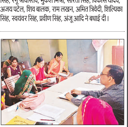
सूक्ष्म उद्यम सखी की परीक्षा में उपस्थित लोग।