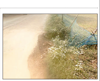
सड़क धंसने के कारण बना गड्ढा।