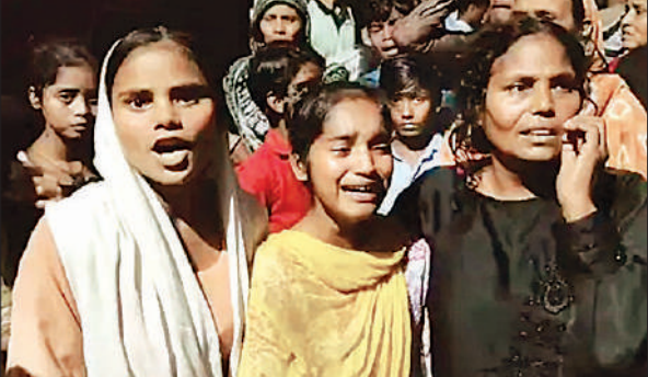
हरगांव में युवक की हत्या के बाद रोते बिलखते परिवारीजन। ● अमृत विचार