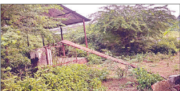
खंडहर में तब्दील अंत्येष्टि स्थल और बदहाल दीवारें व छत।