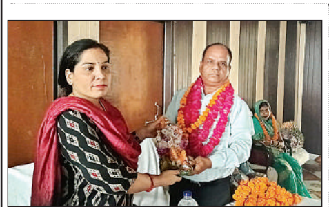
विदाई समारोह के दौरान उपस्थित ग्राम विकास अधिकारी।