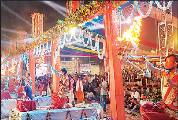
डलमऊ स्थित वीआईपी घाट पर गंगा आरती करते पुजारी।

दुग्ध अभिषेक करते हुए काशी की तर्ज पर महा आरती के साथ ही कार्तिक पूर्णिमा स्नान पर्व का आगाज किया गया। इस दौरान हजारों गंगा भक्तों द्वारा गंगा मैया की जयकारों के साथ मेले का शुभारंभ किया गया। पूजा अर्चना और महा आरती के बाद वन विभाग द्वारा लेजर लाइट से सजाया गया वीआईपी घाट पर संगोष्ठी का आयोजन किया गया। आकर्षक आतिशबाजी