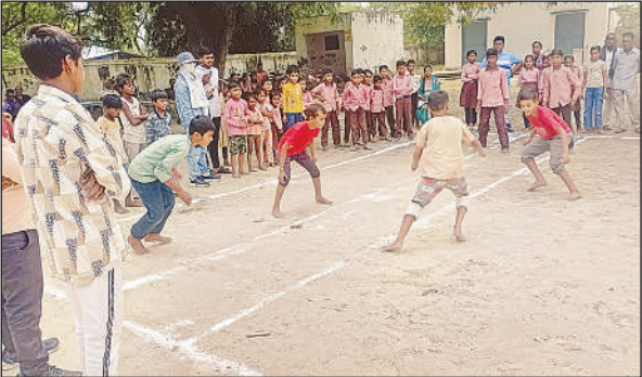
ग्राम पंचायत कहिंजर में आयोजित सांसद खेल स्पर्धा में खेलते बच्चे।