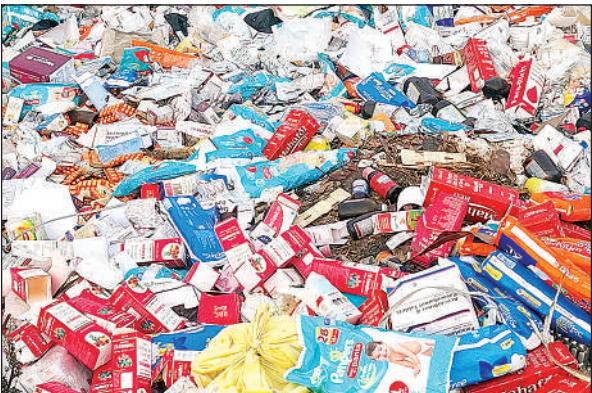
बाईपास किनारे फेंकी गई दवाएं।

अमृत विचार। स्थानीय कस्बे में बाईपास के पास सड़क किनारे भारी मात्रा में एक्सपायर दवाइयां मिलने से इलाके में सनसनी फैल गई। इन दवाओं की अनुमानित कीमत लाखों रुपये है। जानकारी के मुताबिक सुबह टहलने के लिए निकले लोगों ने सड़क किनारे जब दवाइयों के ढेर को देखा तो तुरंत इसकी सूचना स्थानीय लोगों को दी। मौके पर पहुंचे लोगों ने पाया कि वहां जीवन रक्षक इंजेक्शन, पौरुष वर्धक दवाएं, ग्लूकोज की बोतलें और ताकत बढ़ाने वाले सिरप खुले में पड़े थे। ये सभी दवाएं करीब दो वर्ष पहले एक्सपायर हो चुकी हैं और आशंका जताई जा रही है कि ये किसी निजी मेडिकल स्टोर से जुड़ी हो सकती हैं। वहीं स्थानीय लोगों ने इस कृत्य को बड़ी लापरवाही