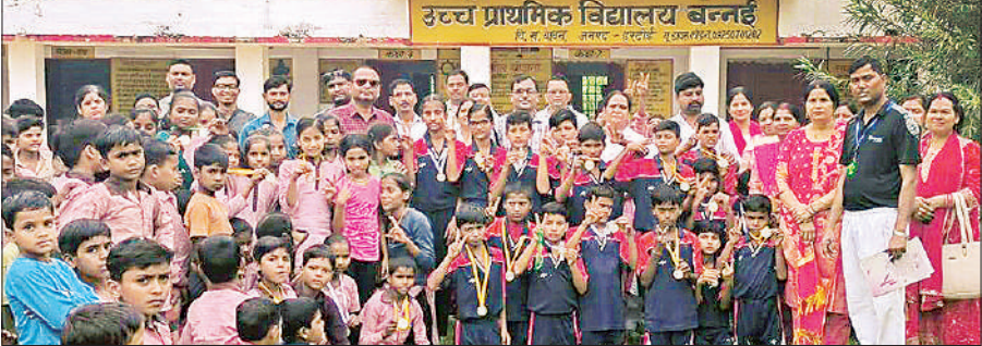
प्रतियोगिताओं में विजयी खिलाड़ियों के साथ विद्यालय परिवार ।