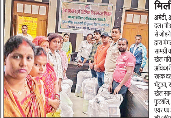
खेल सामग्री वितरित करते खंड विकास अधिकारी।