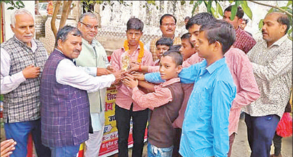
सांडी में खिलाड़ी को सम्मानित करते अतिथि ।