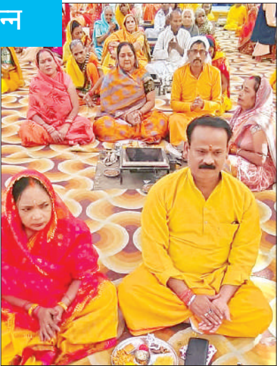
यज्ञ में आहुतियां देते श्रद्धालु ।