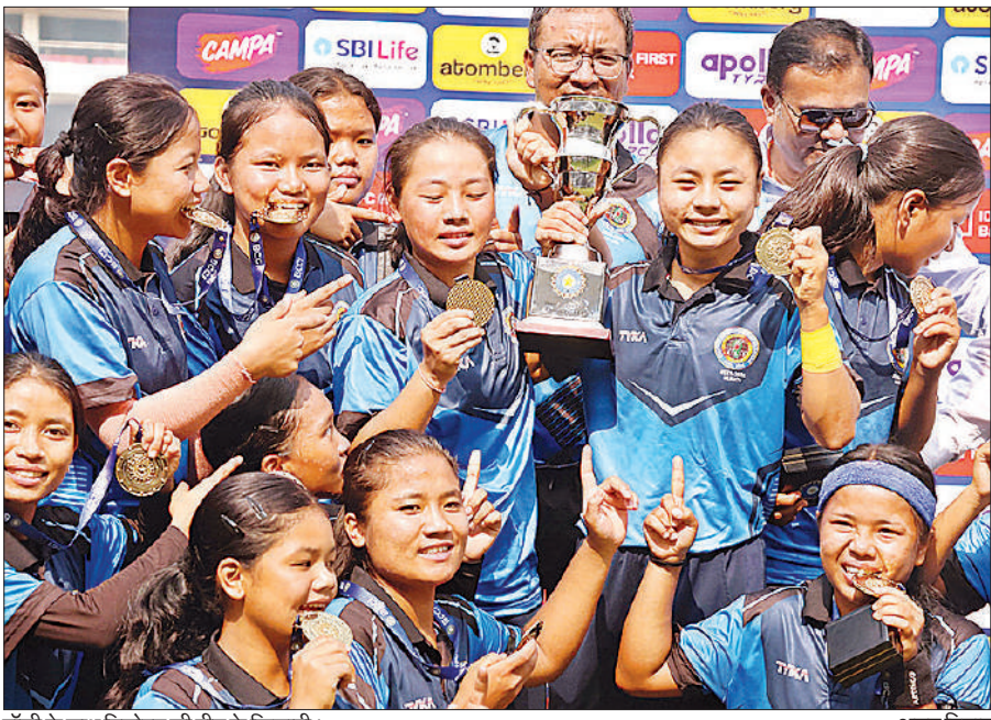
ट्रॉफी के साथ मिजोरम की टीम के खिलाड़ी।