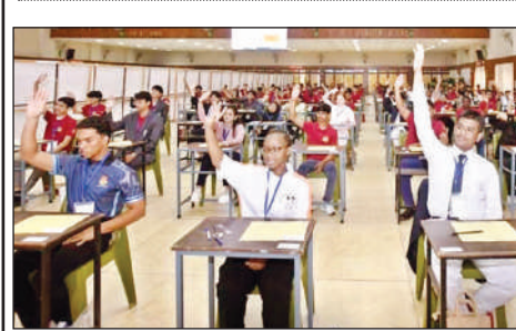
मौखिक सवालों पर उत्तर देने को हाथ उठाए छात्र-छात्राएं।