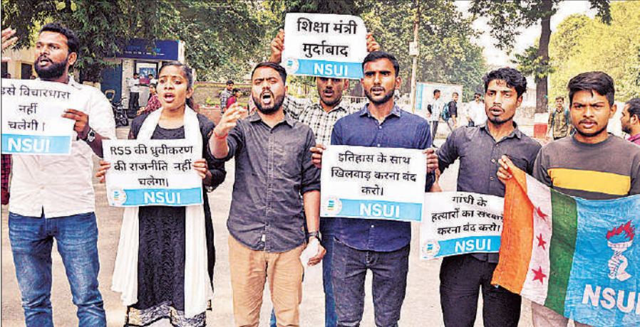
लखनऊ विश्वविद्यालय गेट के सामने प्रदर्शन करते एनएसयूआई के सदस्य।

मंगलवार दोपहर करीब एक बजे बड़ी संख्या में छात्र विश्वविद्यालय गेट पर पहुंचे और विरोध प्रदर्शन शुरू किया। इस दौरान मौके पर भारी पुलिस बल तैनात रहा ताकि किसी प्रकार का यातायात व्यवधान न हो।