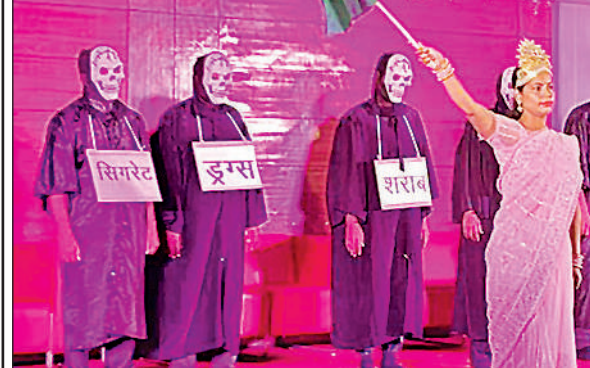
नाट्य मंचन करते रंगकर्मी।

अमृत विचार, लखनऊ : सिटी मॉन्टेसरी स्कूल, कानपुर रोड शाखा में चल रहे चार दिवसीय इंटरनेशनल यंग मैथमेटिशियन कन्वेंशन के दूसरे दिन युवा गणिताज्ञों ने अल्लेब्रा, जियोमेट्री, डेटा एनालिसिस और प्रोबेबिलिटी जैसे कठिन सवालों से मुकाबला किया। एक दर्जन देशों के लगभग 700 छात्र-छात्राओं ने व्यक्तिगत और टीम दोनों प्रतियोगिताओं में भाग लिया। सम्मेलन के पहले सत्र में 'मैथविज' (व्यक्तिगत) प्रतियोगिता आयोजित हुई, जिसमें जूनियर व सीनियर वर्ग के छात्रों ने गणित की विभिन्न शाखाओं पर आधारित आठ प्रश्न हल किए। इसके बाद 'मैथमानिया' टीम पंचटिविटी में प्रतिभागियों ने संयुक्त रूप से गणितीय समस्याओं का समाधान किया।