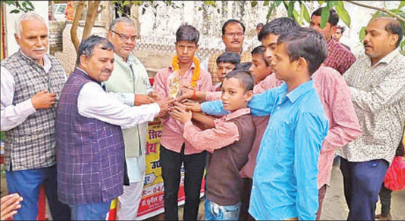
सांडी में खिलाड़ी को सम्मानित करते अतिथि।