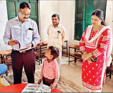
विकासखंड खलीलाबाद के प्राथमिक विद्यालय नगवां में कक्षा 2 के छात्र अनमोल से पहाड़ा सुनते जिलाधिकारी आलोक कुमार। अमृत विचार

निरीक्षण के दौरान जिलाधिकारी आलोक कुमार ने कक्षा 2 के छात्र अनमोल से 19 का पहाड़ सुनवाया और और उसकी प्रशंसा भी की। इसके अलावा उन्होंने बच्चों को गणित विषय के फार्मूले और उनको हल करने के तरीके भी सुझाए। इसके अलावा उन्होंने बच्चों की लेखन शैली और गणित की समझ का परीक्षण भी किया। वहीं, एक छात्रा को बुखार की शिकायत मिलने पर उन्होंने संबंधित को तत्काल दवा उपलब्ध कराने के निर्देश दिए। इसके बाद उन्होंने उपस्थित पंजिका और एमडीएम रजिस्टर की जांच कर परिसर की साफ सफाई और भोजन की गुणवत्ता पर विशेष ध्यान देने का निर्देश दिया। डीएम आलोक कुमार ने कहा कि शिक्षा और