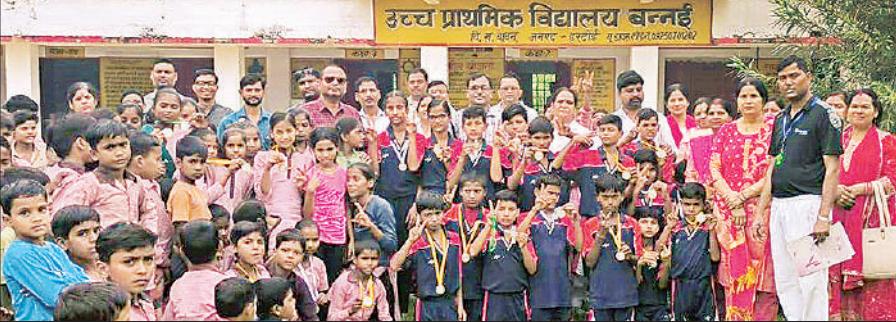
प्रतियोगिताओं में विजयी खिलाड़ियों के साथ विद्यालय परिवार।