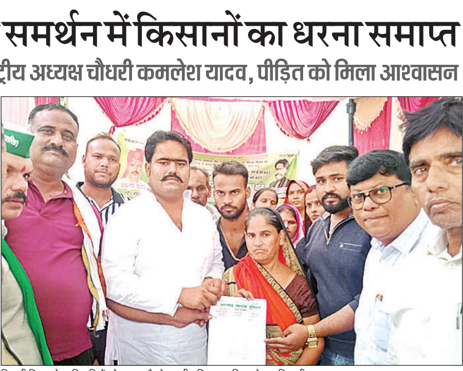
बिजली विभाग के अधिकारियों को ज्ञापन सौंपते भारतीय किसान यूनियन के पदाधिकारी।