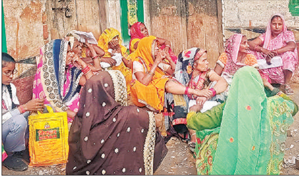
समिति पर खाद लेने आई महिलाएं।