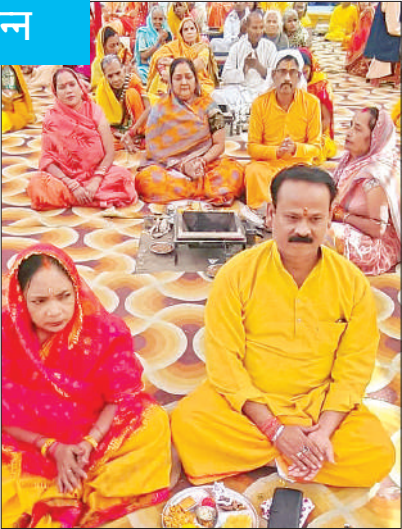
यज्ञ में आहुतियां देते श्रद्धालु।