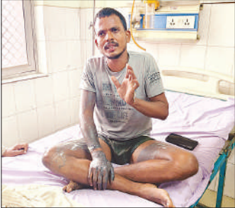
अस्पताल में भर्ती घायल ऑपरेटर।