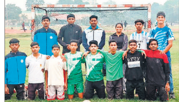
हैंडबाल की मंडलीय टीम में चयनित खिलाड़ी।