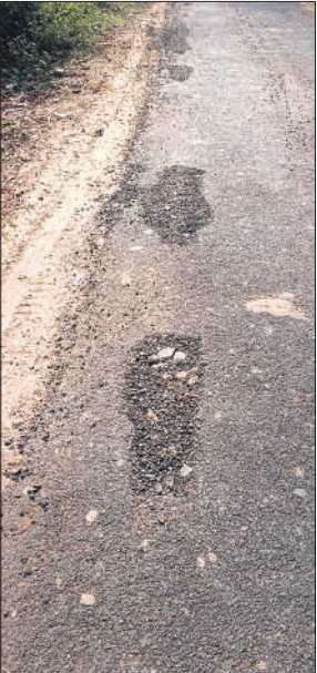
एक माह बाद उखड़ने लगी सड़क।