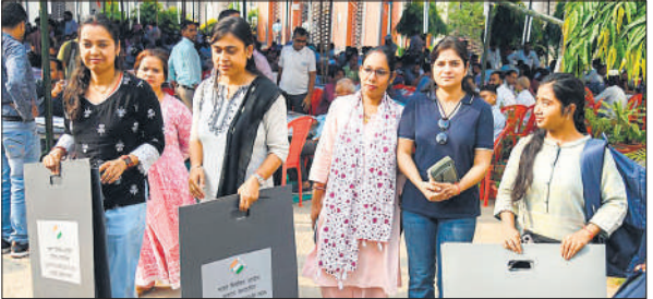
बूथ के लिए रवाना होते पोलिंग पार्टी के सदस्य।