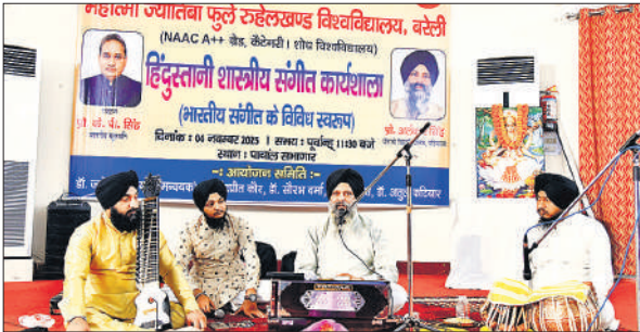
रुहेलखंड विश्वविद्यालय में शास्त्रीय संगीत प्रस्तुत करते कलाकार।