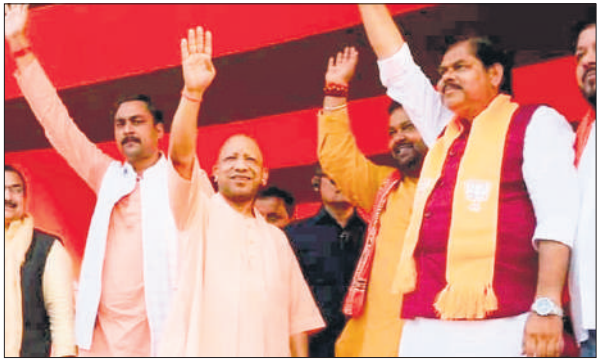
बैकुंठपुर विधान सभा क्षेत्र में सीएम योगी।

रोड शो करने के साथ लखीसराय, बैकुण्ठपुर और मोहिउद्दीननगर विधान सभा क्षेत्र में जनसभाओं को संबोधित किए। लखीसराय में एनडीए प्रत्याशी एवं बिहार के उपमुख्यमंत्री विजय कुमार सिन्हा के समर्थन में योगी ने कहा कि 1990 से 2005 तक का दौर बिहार के इतिहास का