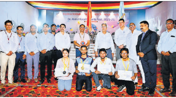
मुख्य अतिथि के साथ विजेता खिलाड़ी।