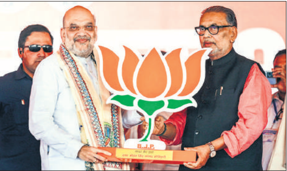
चंपारण की चुनावी रैली को संबोधित करने पहुंचे शाह को भेंट किया गया स्मृति चिह्न।

जनरल द्विवेदी ने कहा कि युद्ध का भविष्य किसी एक क्षेत्र या सिद्धांत से परिभाषित नहीं होगा, बल्कि इस बात से परिभाषित होगा कि हम विचारों को कितनी निर्णायक