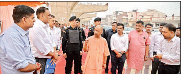
गोरखपुर में छह लेन हाइवे के निर्माण में देरी पर अधिकारियों को निर्देश देते मुख्यमंत्री योगी।