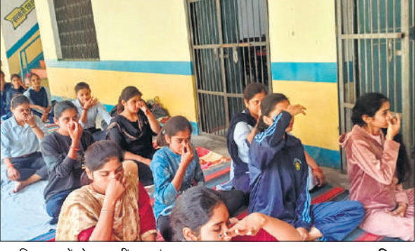
महाविद्यालय में योग करती छात्राएं।

कार्यालय संवाददाता, बरेली अमृत विचार: पंडित दीन दयाल उपाध्याय राजकीय मॉडल इंटर कॉलेज, नवाबगंज के छात्रों ने मंगलवार को आईवीआरआई का शैक्षिक भ्रमण किया। कक्षा 9 से 12 के छात्रों ने पशु चिकित्सालय में एक्स-रे, अल्ट्रासाउंड और परीक्षण जैसे विभिन्न पशु चिकित्सा प्रक्रियाओं के बारे में जानकारी प्राप्त की। इसके अलावा