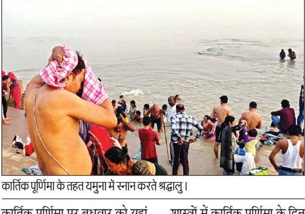
कार्तिक पूर्णिमा के तहत यमुना में स्नान करते श्रद्धालु।

भारतीय संस्कृति में कार्तिक पूर्णिमा का धार्मिक के साथ आध्यात्मिक महत्व भी है। वर्ष के बारह मासों में कार्तिक मास आध्यात्मिक और शारीरिक ऊर्जा संचय के लिए सर्वश्रेष्ठ माना गया है तो इस पर्व को देवों की दीपावली भी कहा जाता है।