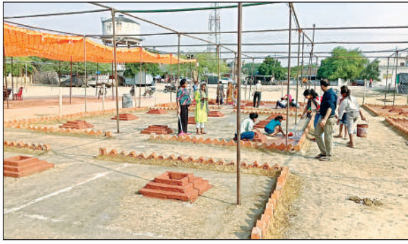
महायज्ञ की तैयारी करते लोग।

अमृत विचार। कस्बे के मेला ग्राउंड में गायत्री परिवार द्वारा आयोजित होने वाले चार दिवसीय कार्यक्रम की तैयारियां पूरी हो चुकी हैं। 7 नवंबर से 10 नवंबर 2025 तक चलने वाले इस आयोजन के लिए 51 कुंड बनाए गए हैं। कार्यक्रम स्थल पर पंडाल को गाय के गोबर से लीपकर तैयार किया गया है। इस आयोजन को सफल बनाने के लिए गायत्री परिवार के सदस्य जोर-शोर से कार्य कर रहे हैं। कार्यक्रम के पहले दिन शुक्रवार, 7 नवंबर 2025 को