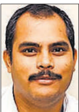
दिग्विजय सिंह कानपुर

ऑपरेशन सिंदूर में मिली करारी हार से बौखलाया पाकिस्तान भारत को अब हर तरफ से घेरने की कोशिश कर रहा है। इसके लिए अपने मित्र राष्ट्रों के दुश्मन देशों से भी हाथ मिलाने को आतुर है। इसका ताजा उदाहरण उत्तर कोरिया है। भारत और उत्तर कोरिया के रिश्ते बहुत ही अच्छे हैं। 2018 में तत्कालीन विदेश मंत्री ने उत्तर कोरिया का दौरा किया था, हालांकि इस दौरान के बाद अमेरिका ने कड़ी प्रतिक्रिया दी थी, लेकिन भारत ने नजरअंदाज कर दिया था। अब पाकिस्तान उत्तर कोरिया से अपने राजनयिक रिश्ते बहाल करने जा रहा है। माना जा रहा है कि इस रिश्ते की बहाली के साथ ही दोनों देश गुप्तचुप तरीके से सैन्य समझौते भी कर सकते हैं।