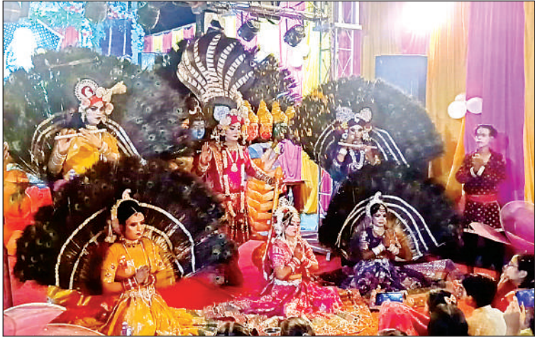
जन्मोत्सव के अवसर पर अपनी प्रस्तुति देते कलाकार।

आयोजन समिति के अनुसार इस वर्ष भक्तों की भीड़ पिछले वर्षों की तुलना में कहीं अधिक रही। हजारों की संख्या में श्रद्धालु देर रात तक भजन-कीर्तन में झुमते नजर आए। कार्यक्रम में राजस्थान और कानपुर से आई हितेश दीवाना जागरण पार्टी के भजन कलाकारों ने ऐसा भक्ति माहौल रचा कि श्रद्धालु