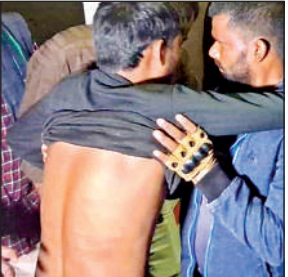
लाटियों के निशान दिखाता पीड़ित युवक।