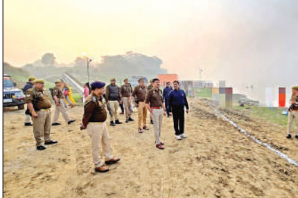
यमुना घाट का निरीक्षण करते डीएम व एसपी। मेला में लगी श्रद्धालुओं की भीड़।

निरीक्षण के दौरान अधिकारियों ने घाट पर साफ-सफाई, श्रद्धालुओं के आवागमन के रास्तों पर यातायात व्यवस्था का सुचारू संचालन, सड़क सुरक्षा, गोताखोर की व्यवस्था, प्रकाश व्यवस्था सहित संबंधित व्यवस्थाओं, सुविधाओं को सुनिश्चित करने हेतु संबंधित अधिकारियों को निर्देश दिए ताकि श्रद्धालुओं को किसी प्रकार की समस्या का सामना न करना पड़े। इसके अलावा उन्होंने महिलाओं को वस्त्र बदलने के लिए अस्थाई कक्ष