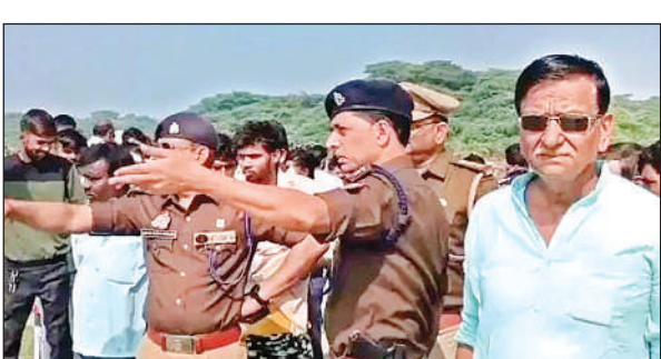
घटना स्थल पर जांच करते एएसपी, सीओ व अन्य ।

अधिकारी नगर पालिका परिषद इटावा को भी सिरोपा, शॉल और प्रतीक चिन्ह भेंट कर स्वागत किया। बुधवार को गुरुद्वारा श्रीतेग बहादुर साहिब में सर्वधर्म सद्भाव के अग्रदूत मानवता के उपासक नानक देवजी का प्रकाशोत्सव बड़ी ही श्रद्धा उल्लास व धूमधाम के साथ मनाया गया। पिछले पंद्रह दिनों से प्रकाशोत्सव पर्व को मनाने की तैयारियों चल रही थीं, नगर में प्रभात फेरी, शबद कीर्तन का गायन प्रारम्भ हो गया साथ ही साथ गुरुद्वारा में 16 श्री अखण्ड पाठ साहिब की श्रृंखला प्रारम्भ हो गयी, जिसका कि समापन आज अर्द्धरात्रि प्रकाशोत्सव के पश्चात शबद कीर्तन हुए। गुरुद्वारा तेगबहादुर साहिब में सुबह से ही माथा टेकने वालों का ताता रहा।