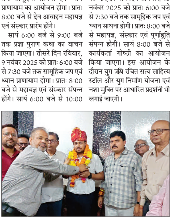
वैभव का स्वागत करते लोग।

बजे तक विशाल दीप यज्ञ और पावन प्रज्ञा पुराण कथा का आयोजन होगा, जिसमें छात्र-छात्राओं द्वारा रंगोली प्रतियोगिता भी आयोजित की जाएगी। चौथे दिन सोमवार, 10 नवंबर 2025 को प्रातः 6:00 बजे से 7:30 बजे तक सामूहिक जप एवं ध्यान साधना होगी। प्रातः 8:00 बजे से महायज्ञ, संस्कार एवं पूर्णाहुति संपन्न होगी। सायं 8:00 बजे से कार्यकर्ता गोष्ठी का आयोजन किया जाएगा। इस आयोजन के दौरान युग ऋषि रचित सत्य साहित्य स्टॉल और युग निर्माण योजना एवं नशा मुक्ति पर आधारित प्रदर्शनी भी लगाई जाएगी।