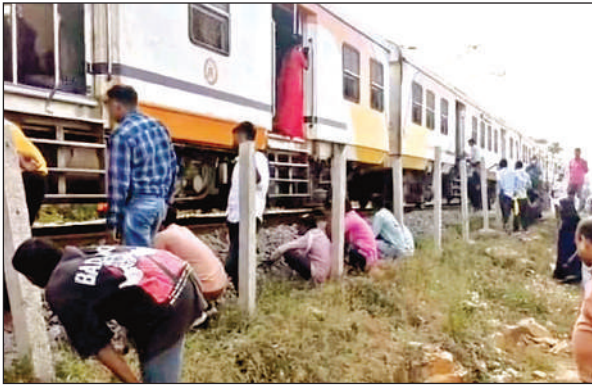
गोवंश कटने से रूकी ट्रेन, जमीन पर बैठे यात्री।

जानकारी के मुताबिक, मानिकपुर में झांसी-प्रयागराज रेल खंड में ओहन और मानिकपुर स्टेशन के बीच बुधवार को कानपुर मानिकपुर मेमो ट्रेन से चार अन्ना गोवंश कट गए। इससे प्रेशर लीक होने और ट्रैक में गोंवशों के अवशेष फंस जाने से मेमो दो घंटे से अधिक समय तक वहीं खड़ी रही। इससे यात्रियों को