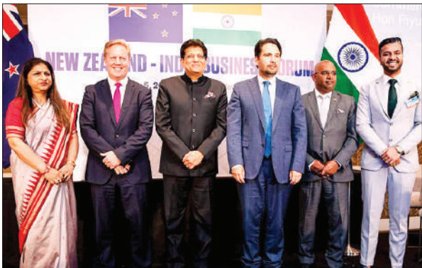
ऑकलैंड में भारत-न्यूजीलैंड बिजनेस फोरम के दौरान अपने समकक्ष टॉड मैक्ले के साथ केंद्रीय वाणिज्य एवं उद्योग मंत्री पीयूष गोयल व अन्य अधिकारी।

भारत नवंबर के अंत से रूसी कच्चे तेल की सीधी खरीद में कटौती करने जा रहा है। यह कदम रूस की दो प्रमुख तेल कंपनियों पर 21 नवंबर से लागू होने वाले नए अमेरिकी प्रतिबंधों के बाद उठाया जा रहा है। विश्लेषकों ने यह संभावना जताई है। विश्लेषकों ने कहा कि देश के कुल रूसी तेल आयात में आधे से अधिक हिस्सा रखने वाली भारतीय रिफाइनरी इकाइयां नए अमेरिकी प्रतिबंधों के अनुपालन में रूसी तेल की प्रत्यक्ष खरीद में कटौती कर सकती हैं। इनमें रिलायंस इंडस्ट्रीज लिमिटेड (आरआईएल), मंगलौर रिफाइनरी एंड पेट्रोकेमिकल्स लिमिटेड (एमआरपीएल) और एचपीसीएल-मि्तल एनर्जी लिमिटेड (एचएमईएल) शामिल हैं। अमेरिकी ने रूसी पेट्रोलियम कंपनियों-रोसेनेफ्ट और ल्यूकऑयल पर 21