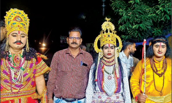
भरत मिलाप के प्रसंग का मंचन करते कलाकार।

अखिल नगर में चल रही रामलीला में दक्षिणमुखी हनुमान मंदिर परिसर में भरत मिलाप का मंचन किया गया। भक्तों ने श्रीराम व भरत का तिलक कर पूजा की। मंचन के दौरान निषादराज से जानकारी लेकर भरत अपनी माताओं के साथ चित्रकूट पर्वत पर जाते हैं। लक्ष्मण को लगता है कि भरत युद्ध की मंशा से आ रहे हैं लेकिन राम उनको शांत कराते हैं। भरत पहुंचकर राम के गले लग क्षमा मांगते हैं। श्री राम भरत मिलाप के बाद तीनों माताओं