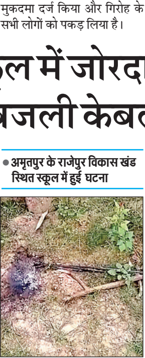
विद्यालय में टूटी पड़ी बंध केबल।