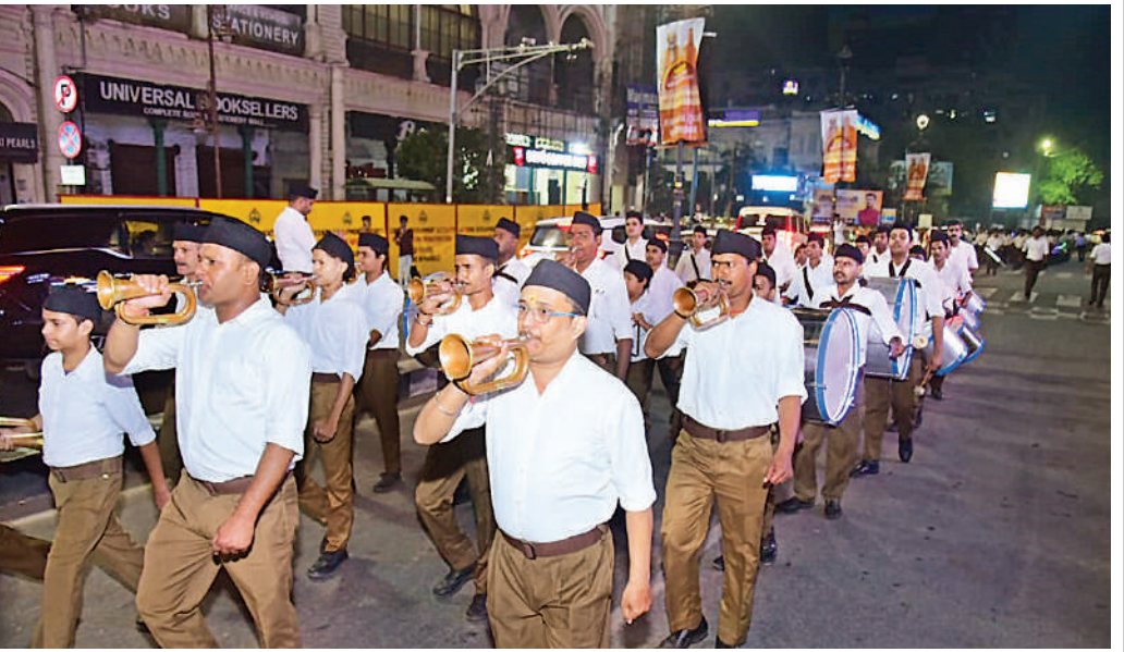
राष्ट्रीय स्वयंसेवक संघ (आरएसएस) के लखनऊ विभाग ने कार्तिक पूर्णिमा तथा प्रकाश पर्व के अवसर पर राजधानी लखनऊ में भव्य कौमुदी घोष संचलन आयोजित किया। संचलन का शुभारंभ शहर के लालबाग स्थित नगर निगम पार्क से हुआ, जहां संघ के पूर्ण गणवेशधारी स्वयंसेवकों ने वाद्य यंत्रों के साथ घोष वादन किया और नगर कार्यालय के सामने से होते हुए अटल चौहारा-हरजतगंज एवं मेफेयर चौराहा के माध्यम से सुरुद्धारा श्री गुरु सिंह सभा तक मार्ग तय किया। स्वयंसेवकों ने वाद्य-यंत्र जैसे श्रृंग, वेणु, शंख, ताल-आनक आदि बजाते हुए कदमताल किया।

पहले तीन बार हुए ऑपरेशन से संक्रमण काबू में नहीं आया, चौथी बार में केजीएमयू में हुई सर्जरी