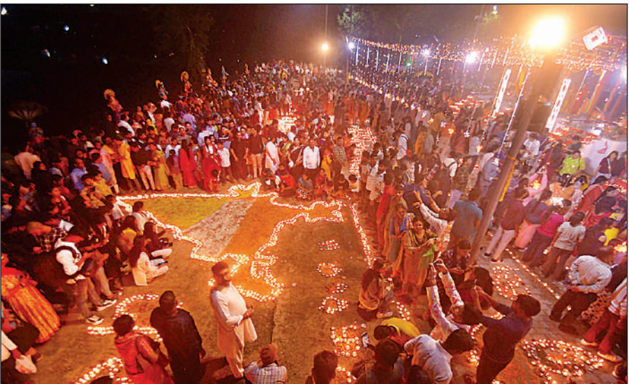
दीपकों से बनाया गया देश का नक्शा।