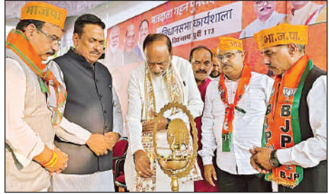
दीप प्रज्ज्वलित कर कार्यक्रम की शुरुआत करते मुख्य अतिथि।