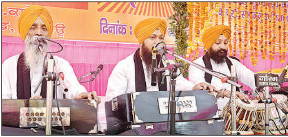
प्रकाश पर्व भजन कीर्तन करते सिख समाज के लोग।

डेंगू के वायरस का लार्वा गंदे पानी के साथ-साथ साफ पानी में भी पाया जाता है, और इसका अभी कोई इलाज नहीं है। इससे बचने के लिए नागरिकों को थोड़ी सी सावधानी बनरतने की जरूरत है।