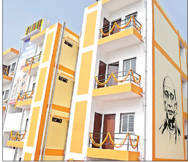
बनकर तैयार सरदार वल्लव भाई पटेल आवासीय योजना।