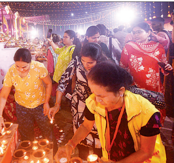
मनकामेश्वर उपवन घाट पर कार्तिक पूर्णिमा पर दीपक जलाते लोग।