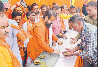
भंडारे में प्रसाद ग्रहण करते भक्त।