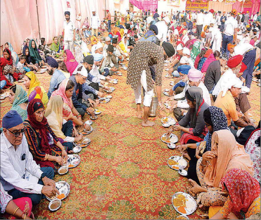
डीएवी कॉलेज के प्रांगण में गुरु नानक देव महाराज के प्रकाश पर्व लंगर छक्के लोग।

व एनपीके का अधिक इस्तेमाल करते हैं। इससे मिट्टी को नुकसान पहुंचता है और कीट मित्र मरने से उर्वरा शक्ति कमजोर हो जाती है। ऑर्गेनिक कार्बन व नाइट्रोजन कम है। इससे उपज कम होती है और लागत ज्यादा आती है। सभी किसान मिट्टी का परीक्षण जरूर कराएं। उन्हें जो मृदा रिपोर्ट कार्ड देगे उस अनुसार ही गोहूँ, सरसों, मटर, आलू व दलहन-तिलहन में उर्वरकों का प्रयोग करें। इससे गुणवत्ता युक्त अधिक पैदावार होगी। मृदा परीक्षण की प्रक्रिया कर्मचारी मोबाइल एप के माध्यम से करते हैं। इसमें जीपीएस लोकेशन के साथ जमीन सम्बंधित पूरा ब्योरा दर्ज होता है।