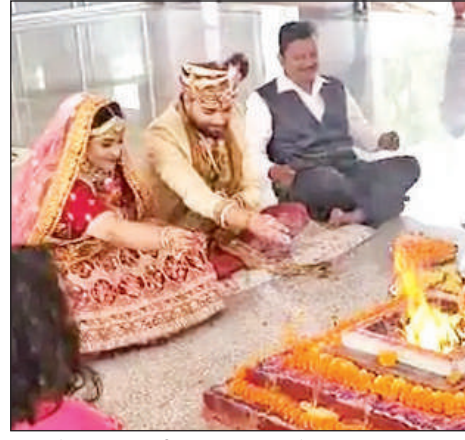
फिल्म के मुहूर्त पर शादी का शॉट शूट कराते कलाकार।

करता है और रक्त प्रवाह बढ़ाता है। 5-10 मिनट तक नियमित अभ्यास करें। कुर्सी आसन: यह पैरों और मसल को मजबूत करता है। त्रिकोणासन: मांसपेशियों को खींचता और जकड़न को दूर करता है। भुजंगासन: छाती और रीढ़ को खोलता है, सांस लेने में मदद करता है। सेतु बंधासन: रीढ़, कमर और कूल्हों को मजबूत करता है। प्राणायाम-भस्त्रिका: तेज सांस से शरीर में गर्मी पैदा होती है। कपालभाति: फेफड़ों और साइनस को साफ करता है, इम्युनिटी बढ़ाता है। सूर्य भेदी: दाईं नासिका से सांस लेने से शरीर गरम रहता है।