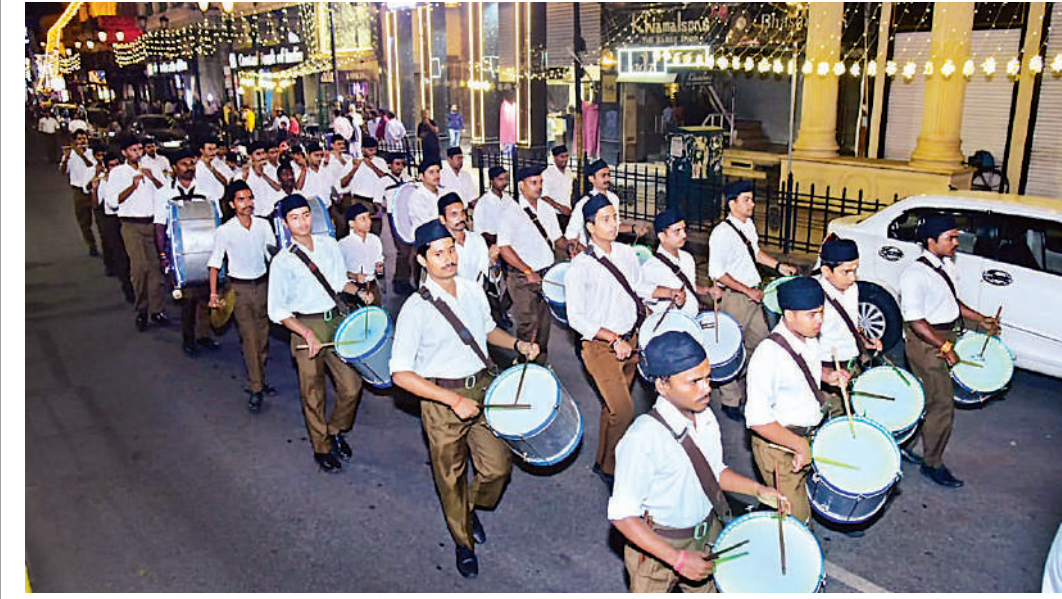
राष्ट्रीय स्वयंसेवक संघ (आरएसएस) के लखनऊ विभाग ने कार्तिक पूर्णिमा तथा प्रकाश पर्व के अवसर पर राजधानी लखनऊ में भव्य कौमुदी घोष संचलन आयोजित किया। संचलन का शुभारंभ शहर के लालबाग स्थित नगर निगम पार्क से हुआ, जहां संघ के पूर्ण गणवेशधारी स्वयंसेवकों ने वाद्य यंत्रों के साथ घोष वादन किया और नगर कार्यालय के सामने से होते हुए अटल चौहारा-हरजतगंज एवं मेफेयर चौराहा के माध्यम से सुरुद्धारा श्री गुरु सिंह सभा तक मार्ग तय किया। स्वयंसेवकों ने वाद्य-यंत्र जैसे श्रृंग, वेणु, शंख, ताल-आनक आदि बजाते हुए कदमताल किया।