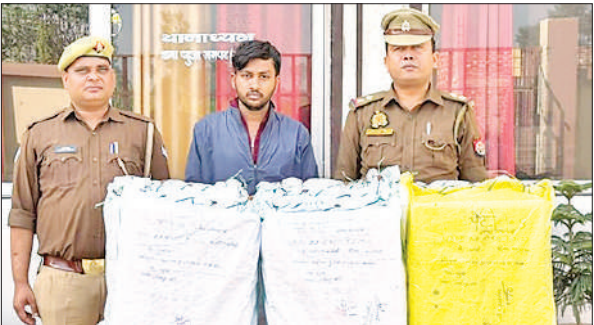
बरामद सिरप के साथ गिरफ्तार आरोपी।