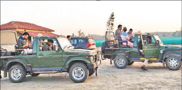
पीलीभीत टाइगर रिजर्व में जंगल सफारी के लिए रवाना होते सैलानी। ● अमृत विचार

पीलीभीत टाइगर रिजर्व का पर्यटन सत्र बीते 1 नवंबर से शुरू किया गया है। इस बार सैलानियों की सुविधा के लिए दो पर्यटन गेटों के अलावा तीसरा नया बराही