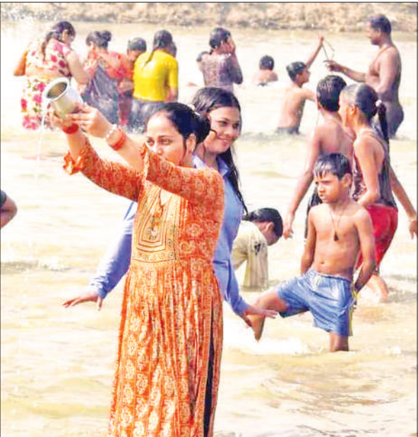
स्नान के बाद सूर्य देव को अर्घ्य देती महिला।

शर्मा ने इस संबंध में आदेश जारी कर दिया है। जारी आदेश में कहा गया कि स्टॉप एवं रजिस्ट्रेशन विभाग के ऑनलाइन पोर्टल के लिए एनआईसी द्वारा संचालित मेघराज क्लाउड सर्वर को नेशनल गवर्नमेंट क्लाउट (एनजीसी) पर स्थानांतरित कराया जाना है। इसलिए चार दिन तक सर्वर पर रख-रखाव और स्थानांतरण का काम किया जाएगा। इस अवधि में जनपद के सभी उप निबंधक कार्यालयों में रजिस्ट्री, बैनामे समेत अन्य आवेदनों का कार्य भी अस्थाई रूप से बाधित रहेगा। हालांकि 8 नवंबर को दूसरे शनिवार और 9 नवंबर को रविवार का अवकाश