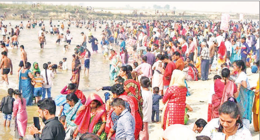
ब्रह्मचारी घाट पर उमड़ी श्रद्धालुओं की भीड़।

सिंगल यूज प्लास्टिक के उपयोग को समाप्त करने, नगर को स्वच्छ एवं सुंदर बनाने के लिए प्रेरित किया गया। कलाकारों ने आकर्षक संवादों और अभिनय के माध्यम से स्वच्छता का संदेश आमजन तक पहुंचाया। कलाकारों ने रंग-बिरंगे परिधानों में लोक शैली और आम भाषा का प्रयोग करते हुए नाटक प्रस्तुत किया, जिसे देखकर बड़ी संख्या में महिलाएं, पुरुष, बच्चे और युवा इकट्ठा हुए।