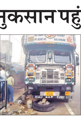
घर से टकराकर खड़ा ट्रक।