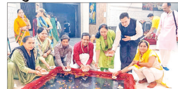
गौरधाम मंदिर में हुए कार्यक्रम में मौजूद भक्त।