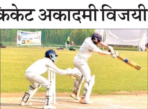
मैच के दौरान शॉट लगाता खिलाड़ी।