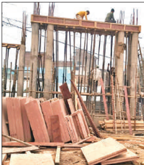
गोला में स्टेशन रोड पर मुख्य प्रवेश द्वार पर शटरिंग करते श्रमिक।