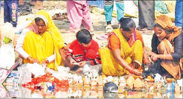
स्नान के बाद घाट पर मां गंगा की पूजा करती महिलाएं।

बरखेड़ा, अमृत विचार : नवाबगंज मार्ग पर देवहा नदी के पुल के पास स्थित घाट पर कार्तिक पूर्णिमा के अवसर पर बुधवार को मेला लगा। बड़ी संख्या में श्रद्धालुओं ने आस्था की डुबकी लगाई। सुबह से ही लोग स्नान के लिए देवहा नदी के तट पर पहुंचने लगे। विधि विधान से देवहा नदी में स्नान कर मां गंगा, भगवान शंकर और भगवान विष्णु की आराधना की। परिवार की सुख समृद्धि की मंगल कामना की गई। दान पुण्य करते हुए अन्न और वस्त्र वितरित किए गए।