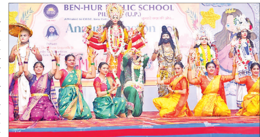
बेनहर पब्लिक स्कूल में हुए कार्यक्रम में प्रस्तुति देते बच्चे।