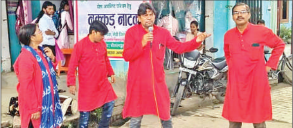
नुककड़ नाटक पेश करते कलाकार।