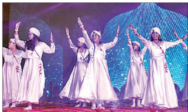
वार्षिकोत्सव में नृत्य की प्रस्तुति देती छात्राएं।