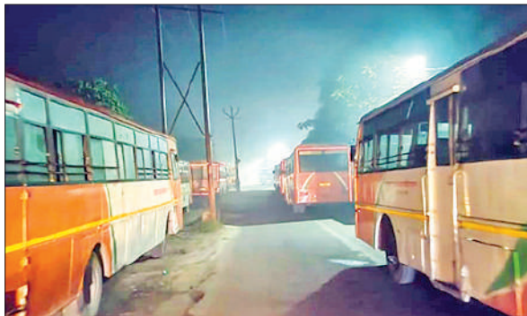
रोडवेज के बाहर सड़क पर खड़ी की गई बसें।

मंगलवार रात अचानक सड़कों पर कोहरे की घनी चादर दिखाई दी। जिससे आवागमन में राहगीरों को हादसे का डर सताता रहा। इसकी एक वजह ये भी रही कि सड़क के किनारे जहां-तहां वाहनों की बेतरतीब पार्किंग जाती है। कोहरे में रोशनी के पुख्ता इंतजाम न होने से खतरा और बढ़ता दिखा। वैसे तो पूर्व में कई बार हादसों की रोकथाम के लिए असम, बरेली समेत कई हाईवे पर खड़े वाहनों पर कार्रवाई करने के आदेश किए जाते रहे हैं। कार्रवाइयां