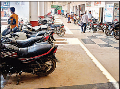
व्यावस्था को मुंह चिढ़ा रही यात्री प्रतीक्षालय में खड़ी बाइकें।