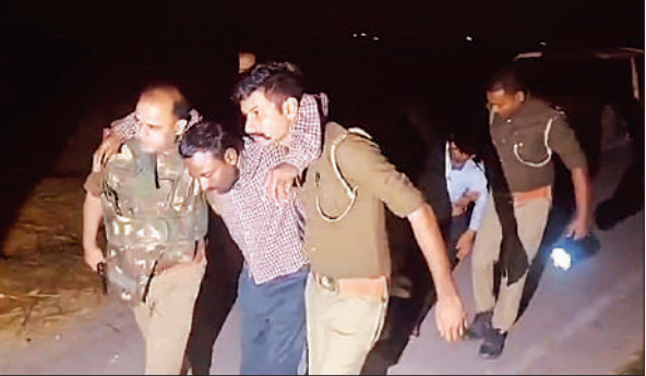
मुठभेड़ में घायल बदमाश को लाती पुलिस।