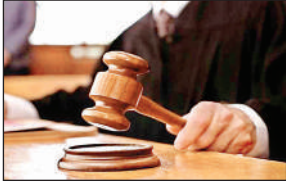
विधि संवाददाता, सुलतानपुर

केंद्रीय गृहमंत्री अमित शाह पर आपत्तिजनक टिप्पणी करने से जुड़ा मामला