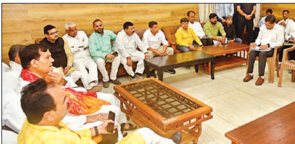
सर्किट हाउस में समीक्षा बैठक करते ऊर्जा मंत्री एके शर्मा ।

बैठक में शहरी क्षेत्रों में आन्तरिक मार्ग/गलियों के गुणवत्तापूर्ण निर्माण का निर्देश दिया। नगर आयुक्त ने गलियों के निर्माण के संबंध में किए जा रहे कार्यों के बारे में जानकारी