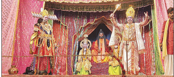
रामलीला में मंचन करते कलाकार।