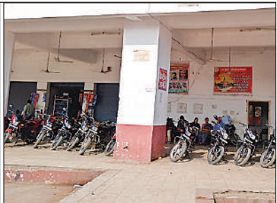
● अमृत विचार

सुरक्षा की दृष्टि से नगर कोतवाली द्वारा रोडवेज स्टेशन को पुलिस चौकी बनाया गया