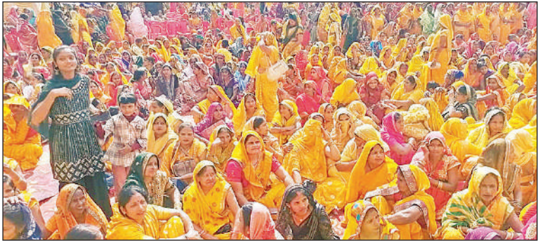
दुरदुरिया पूजन कार्यक्रम में मौजूद महिलाएं।