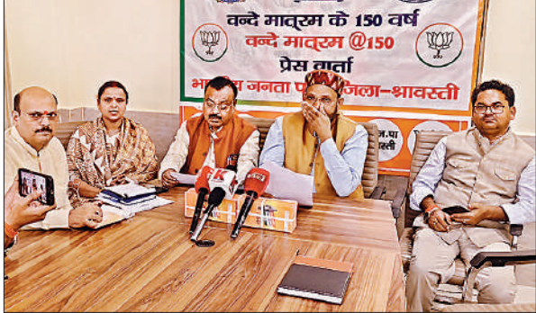
भाजपा कार्यालय भिन्ना में वार्ता में मौजूद जिला पंचायत अध्यक्ष, विधायक व अन्य।

ये बातें गुरुवार को भाजपा का कार्यालय में आयोजित बैठक में पूर्व सांसद व जिला पंचायत अध्यक्ष