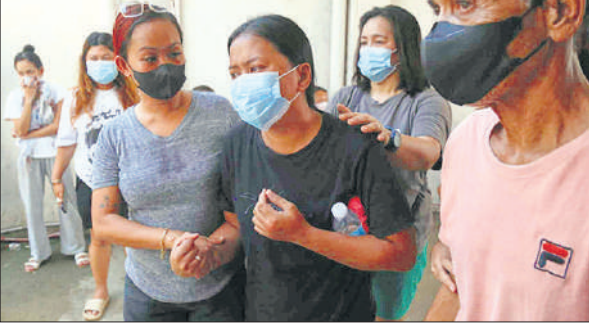
लिलोन में पति, तीन बच्चों और माता–पिता के लापता होने के बाद बिलखती एक महिला।