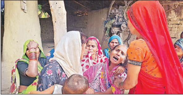
घटना के बाद रोते-बिलखते परिजन।