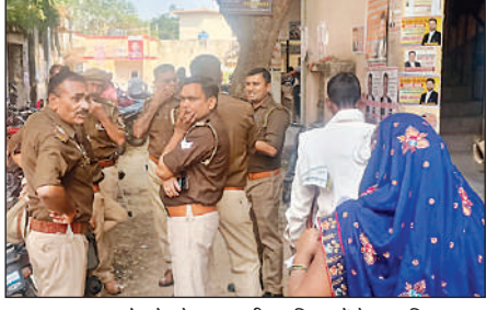
शपथ ग्रहण समारोह के दौरान तहसील परिसर में तैनात पुलिस।