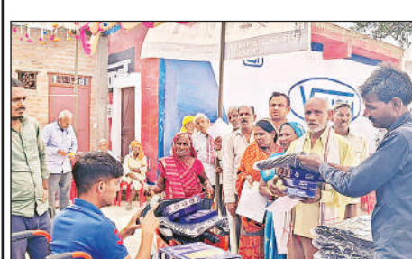
सहायक उपकरण वितरण के दौरान मौजूद वृद्धजन।