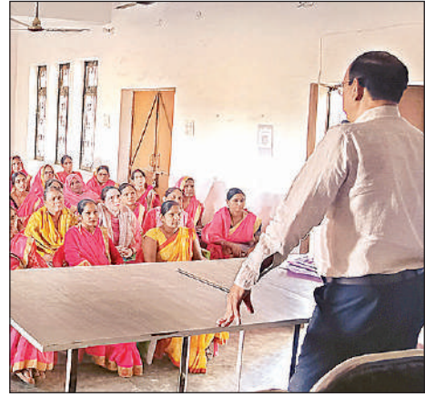
प्रशिक्षण के दौरान उपस्थित आंगनबाड़ी कार्यकर्त्रियां।