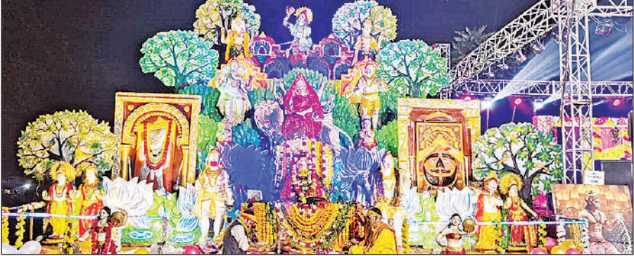
जागरण में भजन-कीर्तन करते गायक।