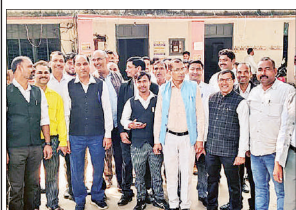
विरोध-प्रदर्शन करते अधिवक्ता।