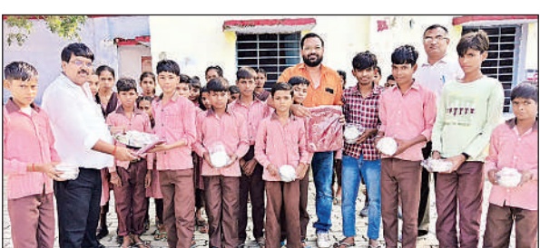
सम्मानित छात्रों के साथ संगठन के पदाधिकारी ।