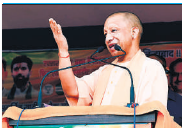
बिहार के बेतिया में एनडीए प्रत्याशी के पक्ष में चुनाव प्रचार करते मुख्यमंत्री योगी आदित्यनाथ।

● सीएम ने कहा, यूपी की तरह बिहार में भी खानदानी माफिया की उलटी गिनती शुरू