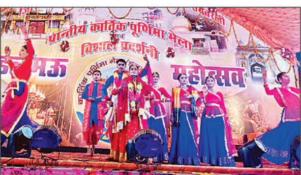
कार्यक्रम प्रस्तुत करते रिदम एकेडमी हमीरपुर के कलाकार।

और रखवालों को मार भगाया। रावण ने अपने प्रिय पुत्र अक्षय कुमार को भेजा तो हनुमान जी ने उसका वध कर दिया। क्रोधित रावण ने मेघनाद से कहा कि “ इंद्रजीत अब जाओ तुम, बानर है बलवर्त। वध मत करना बांधकर, लाना यहां तुरंत।” मेघनाद से अशोक वाटिका में हनुमान ने परिचय पूछा तो उसने बताया कि “मैं मेघनाद कहलाता हूं, वैरी को सदा हराया है। जीता है मैंने स्वर्गलोक, पद इंद्रजीत का पाया है।” मेघनाद ने हनुमान जी को ब्रह्मपास में बांधकर दरबार में रावण के सामने प्रस्तुत किया। जहां हनुमान और रावण में तीखा संवाद हुआ। रावण ने हनुमान की पूंछ में आग लगाकर जलाने का आदेश दिया। हनुमान की पूंछ में आग लगते ही उन्होंने सारी लंका को जलाकर नष्ट कर दिया और सीता के सामने पहुंचे तो सीता ने उन्हें चूड़ामणि देकर विदा किया और आशीर्वाद दिया “अजर अमर गुननिधि सुत होहू। करहू बहुत रघुनायक छोहू।” इधर विभीषण ने रावण ने उन्हें लात मारकर लंका से निकाल दिया। इस अवसर पर आसपास के गांवों के महिला, पुरुष दर्शक, कमेटी के सभी पदाधिकारी और सदस्य उपस्थित थे।