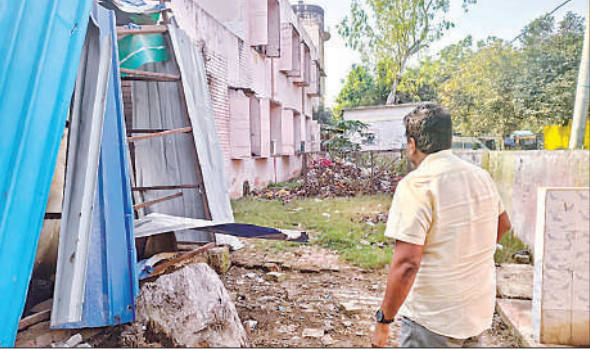
सीएचसी मिश्रिख का निरीक्षण करते जिलाधिकारी।

अमृत विचार : सेहत की तस्वीर से जुड़े मुद्दे को लगातार उठा रहा है। ऐसे में बिना सूचना दिए जिलाधिकारी तीर्थ नगरी मिश्रिख