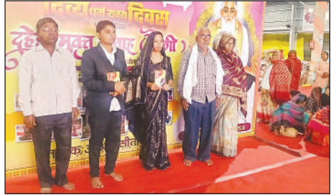
विवाह समारोह के दौरान उपस्थित जोड़े।