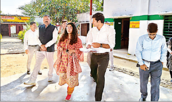
परिषदीय विद्यालय का निरीक्षण करतीं मुख्य विकास अधिकारी।