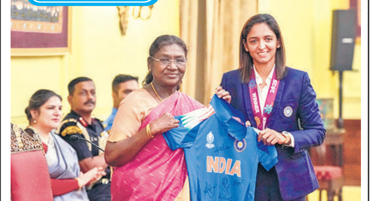
राष्ट्रपति द्रौपदी मुर्मू ने गुरुवार को नई दिल्ली स्थित राष्ट्रपति भवन में आईसीसी महिला वनडे विश्व कप जीतने वाली भारतीय महिला क्रिकेट टीम से मुलाकात की। जिसमें कप्तान हरमनप्रीत कौर ने उन्हें सभी खिलाड़ियों के हस्ताक्षर वाली टीम जर्सी भेंट की। (विस्तृत खेल पेज पर)

मुख्यमंत्री ने बिहार के लौरिया, बेतिया और परिहार विधानसभा क्षेत्र में भरी हुंकार