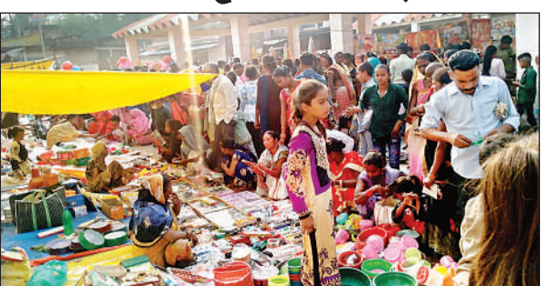
हटिया मेला में खरीदारी करते लोग।