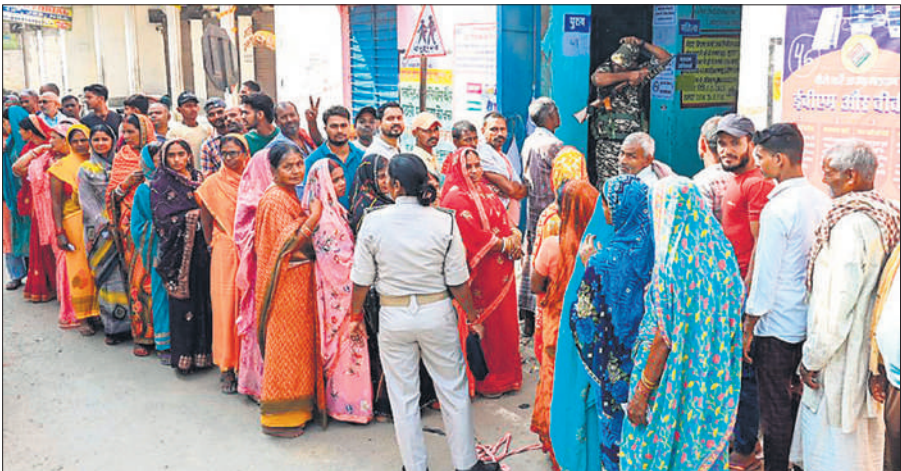
पटना के बख्तियारपुर में एक मतदान केंद्र पर वोट डालने के लिए कतार में प्रतीक्षा करते मतदाता ।