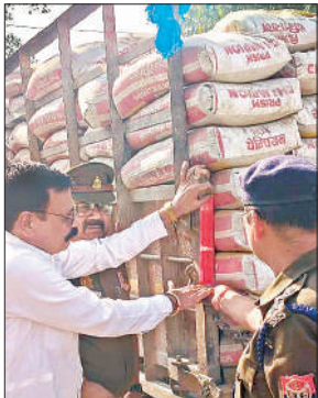
वाहन पर रेडियम टेप लगाती यातायात पुलिस।

अभियान के दौरान ट्रैक्टर-ट्रॉली चालकों, मंडी समिति के पदाधिकारियों, व्यापार मंडल के