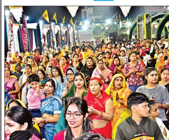
श्री खाटू श्याम के पूजा-अर्चना में शामिल भक्त।