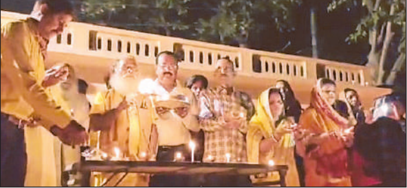
गंगा आरती करते नवदुर्गा पूजन समिति के सदस्य।