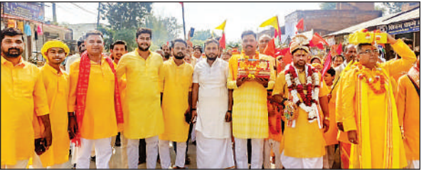
कलश यात्रा में शामिल श्रद्धालु।