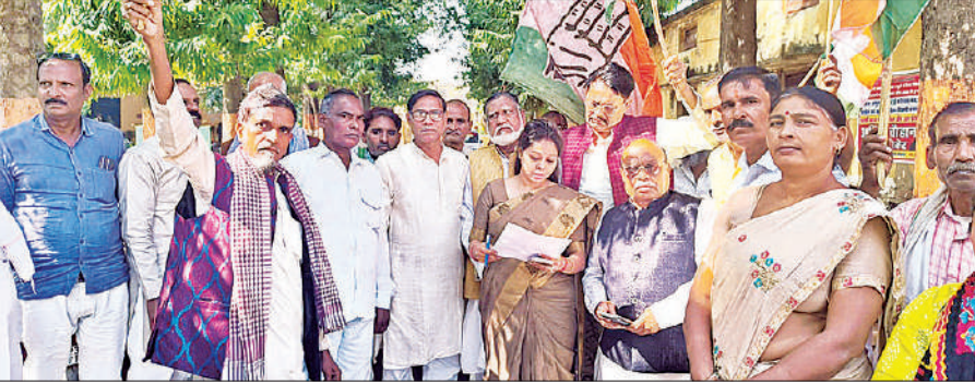
एसडीएम को ज्ञापन सौंपने जाते विभिन्न संगठनों के पदाधिकारी और सदस्य।

यहां उन्होंने निपुण भारत आंकलन परीक्षा का हाल जाना, शिक्षकों से संवाद किया। जानकारी करने पर पता चला कि तीन शिक्षक तो पहले से ही नदारद हैं। भगौतीपुर और मुलायमपुर में बच्चों से सवाल किये तो जवाब बेहतर नहीं मिले। बच्चों की उपस्थिति भी कम थी।