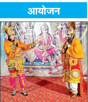
रामलीला का सजीव मंचन करते आदर्श रामलीला कमेटी के कलाकार।

बुधवार को रामलीला में हनुमान जी सौ योजन समुद्र लांघकर लंका पहुंचे तो मुख्य द्वार पर लंकिनी ने उन्हें रोक लिया। हनुमान की एक मुष्टिका प्रहार से वह स्वर्ग चली गई। लंका में सीता की खोज करते हुए हनुमान जी विभीषण की सात्विक कुटी देखकर रुक गए। हनुमान और विभीषण के संवाद के बाद विभीषण ने उन्हें बताया कि सीता जी अशोक वाटिका में हैं। हनुमान जी छिपते हुए अशोक वाटिका पहुंचे। तभी रावण वहां सीता का सुन्दर संवाद हुआ। रावण ने सीता को एक महौने का समय दिया। रावण के जाने के बाद हनुमान ने सीता के