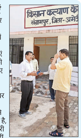
नवनिर्मित किसान कल्याण केंद्र का निरीक्षण करते जिला कृषि अधिकारी।

एफपीओ और पंजीकृत कृषक समितियों को फार्म मशीनरी बैंक की स्थापना हेतु सहायता प्रदान की जा रही है। उन्होंने बताया कि अब कंबाइन हार्वेस्टर