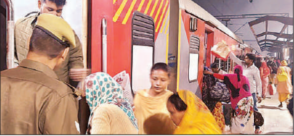
महिलाओं की मदद करती जीआरपी पुलिस।