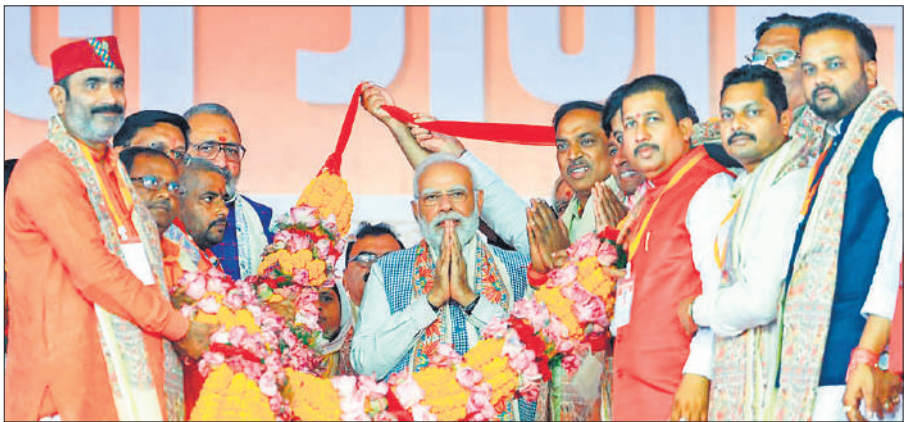
भागलपुर में रैली के दौरान प्रधानमंत्री नरेन्द्र मोदी को सम्मान देते भाजपा नेता ।

राजद पर निशाना साधते हुए प्रधानमंत्री ने कहा, जंगलराज की पाठशाला में 'ए' का मतलब होता है अपहरण और 'फ' का मतलब फिरौती