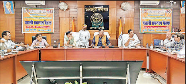
समीक्षा बैठक करते डीएम व मौजूद अन्य अधिकारी।

संवाददाता, डलमऊ (रायबरेली) अमृत विचार। कार्तिक पूर्णिमा स्नान के लिए आए लाखों श्रद्धालुओं के जाने के बाद हर तरफ गंदगी फैली हुई है। मेला क्षेत्र में जगह-जगह पर लगे हुए कूड़े के ढेर अब नगर पंचायत के लिए चुनौती बने हुए हैं। बुधवार को समाप्त हुए कार्तिक पूर्णिमा स्नान के बाद डलमऊ के सभी घाटों पर जगह-जगह पर गंदगी फैल गई। दूर-दराज से आए बड़ी संख्या में श्रद्धालुओं ने अपनी आस्था के साथ मां गंगा के घाटों पर गंदगी का अंबार लगा दिया। सड़क घाट, वीआईपी घाट, रानी शिवाला घाट, महावीरन घाट