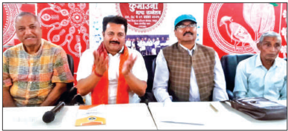
पत्रकारों को जानकारी देते आयोजन समिति के पदाधिकारी। ● अमृत विचार

रुद्रपुर में कुमाऊंनी भाषा राष्ट्रीय सम्मेलन आज से