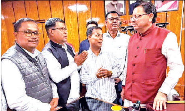
देहरादून विधानसभा कार्यालय में मुख्यमंत्री से मुलाकात करता शिष्टमंडल।

होगा, बल्कि क्षेत्रीय संस्कृति और लोक परंपराओं की नई ऊर्जा प्रदान करेगा। उन्होंने कहा कि रुद्रपुर जैसे औद्योगिक शहर में कुमाऊंनी भाषा-संस्कृति पर आधारित यह पहला कार्यक्रम है। इसमें क्षेत्र में लोकभाषा के पुनर्जागरण का संदेश जाएगा। उन्होंने बताया कि सम्मेलन का शुभारंभ पूर्व मुख्यमंत्री एवं पूर्व राज्यपाल भगत सिंह कोशरया करेंगे। उद्घाटन सत्र में कुमाऊंनी भाषा की प्राचीनता, साहित्यिक परंपरा और सांस्कृतिक योगदान पर विस्तृत चर्चा होगी। इसी दिन भारतीय संविधान की आठवीं अनुसूची में कुमाऊंनी भाषा को शामिल किए जाने की आवश्यकता पर भी गहन चर्चा की जाएगी। साथ ही भाषा को स्कूली पाठ्यक्रम में सम्मिलित करने की दिशा में टॉप सुझाव और रणनीतियां प्रस्तुत की जाएंगी।