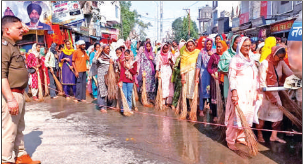
गुरु साहिब की पालकी के आगे सफाई की सेवा करती संगत।