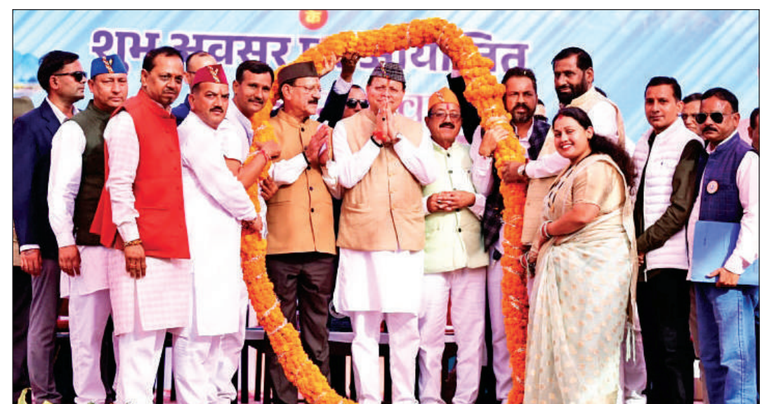
रामनगर में सीएम धामी का स्वागत करते भाजपा कार्यकर्ता।