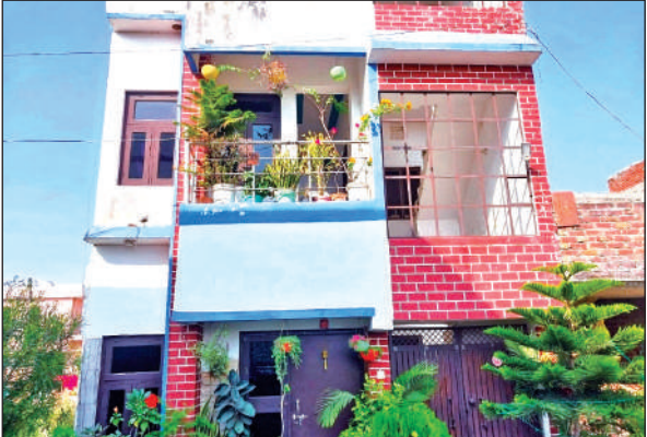
किच्छा के लालपुर स्थित इसी मकान में हुई युवती की हत्या।