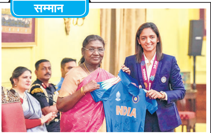
राष्ट्रपति द्रौपदी मुर्मू ने गुरुवार को नई दिल्ली स्थित राष्ट्रपति भवन में आईसीसी महिला वनडे विश्व कप जीतने वाली भारतीय महिला क्रिकेट टीम से मुलाकात की। जिसमें कप्तान हरमनप्रीत कौर ने उन्हें सभी खिलाड़ियों के हस्ताक्षर वाली टीम जर्सी भेंट की। (विस्तृत खेल पेज पर)

मुख्यमंत्री धामी ने किया विकसित भारत यंग लीडर्स थीम पर आधारित राज्य युवा महोत्सव का शुभारंभ