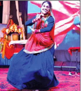
कार्यक्रम की प्रस्तुति देती कलाकार।