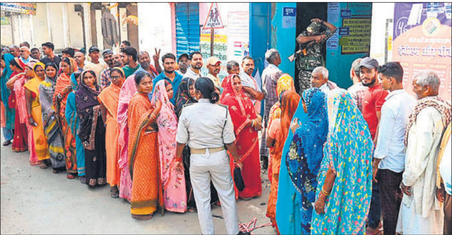
पटना के बख्तियारपुर में एक मतदान केंद्र पर वोट डालने के लिए कतार में प्रतीक्षा करते मतदाता।