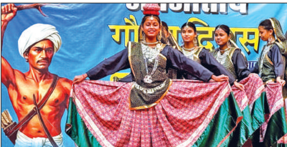
जनजाति गौरव दिवस पर सांस्कृतिक कार्यक्रम प्रस्तुत करते युवा।।