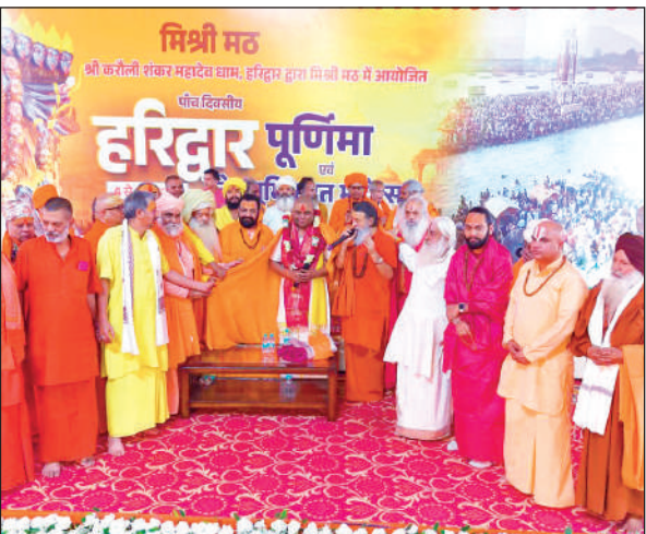
पंच दिवसीय पूर्णिमा एवं देवभूमि रजत उत्सव में मौजूद संत-महात्मा।