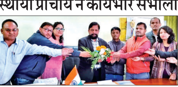
प्राचार्य का स्वागत करते महाविद्यालय परिवार।