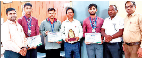
सामान्य ज्ञान प्रतियोगिता में द्वितीय स्थान हासिल करने वाले बच्चों के साथ शिक्षक।