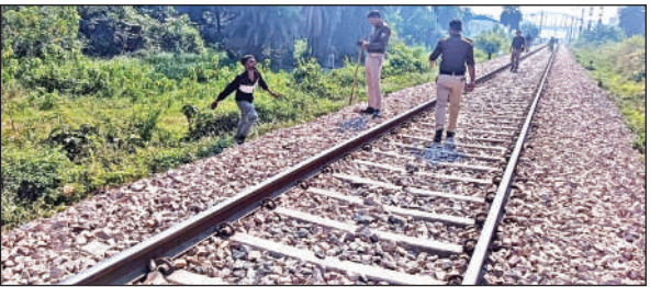
काशीपुर में चीमा रेलवे फाटक के पास एक नशेड़ी को खदेड़ती पुलिस।

दरअसल चीमा रेलवे फाटक के पास नशेड़ियों का नशा छुड़ाने के लिये एक सेंटर खुला हुआ है। यहां नशा छोड़ने के लिये दवाइयां दी जाती हैं। लेकिन सेंटर से दवा लेने