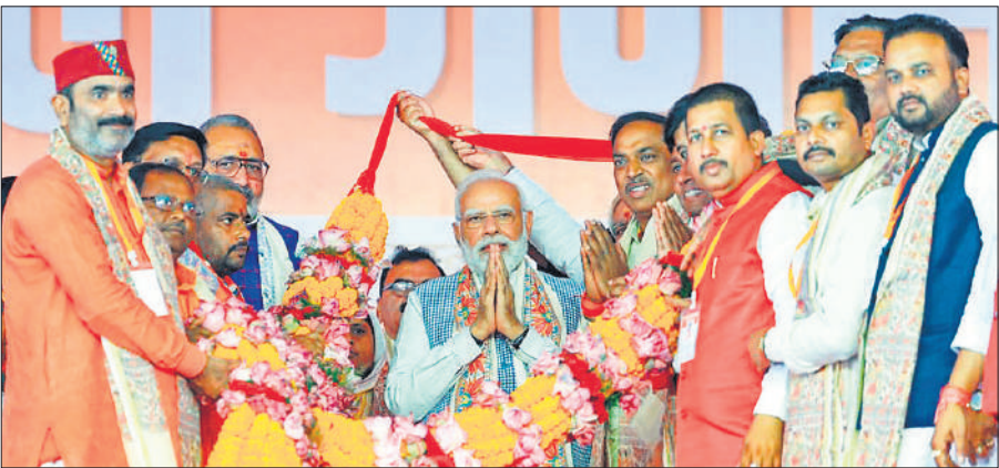
भागलपुर में रैली के दौरान प्रधानमंत्री नरेन्द्र मोदी को सम्मान देते भाजपा नेता।

प्रधानमंत्री नरेन्द्र मोदी ने गुरुवार को कहा कि बिहार की जनता, विशेषकर माताएं और बेटियां, बड़ी संख्या में मतदान कर रही हैं ताकि राजद के जंगलराज को वापस आने से रोका जा सके। उन्होंने कहा कि फिर एक बार बिहार में सुशासन की सरकार बननी चाहिए। बिहार के भागलपुर में चुनावी रैली को संबोधित करते हुए प्रधानमंत्री ने राजद और कांग्रेस पर तीखा हमला बोलते हुए कहा कि इन दलों ने बिहार के गरीबों और महिलाओं के हितों के बारे में कभी नहीं सोचा। राजद पर निशाना साधते हुए प्रधानमंत्री ने कहा, जंगलराज की पाठशाला में 'ए' का मतलब होता है अपहरण और 'फ' का मतलब फिरौती