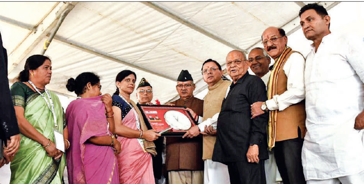
हल्द्वानी में पूर्व सैनिक सम्मेलन में वीर नारियों को सम्मानित करते मुख्यमंत्री पुष्कर सिंह धामी और साथ में कैबिनेट मंत्री व विधायक।