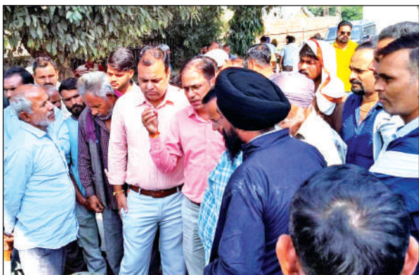
काशीपुर में किसानों से बात करते मंडी अधिकारी।