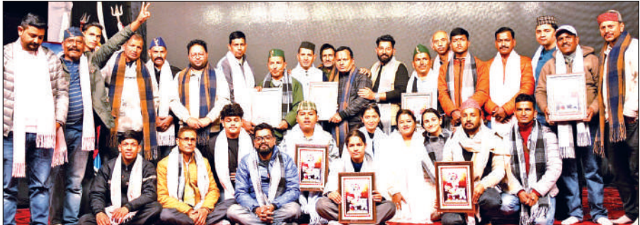
गोल्ज्यू महोत्सव के दौरान अतिथियों को सम्मानित करते आयोजन समिति के सदस्य।