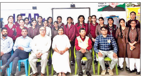
नोजगे पब्लिक स्कूल में आयोजित जन जागरूकता कार्यक्रम में उपस्थित लोग।