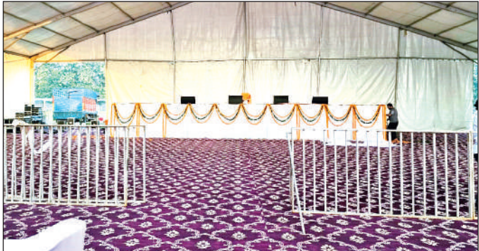
जीबी पंत विश्वविद्यालय में कृषक सम्मेलन के लिए सजा पड़ा।