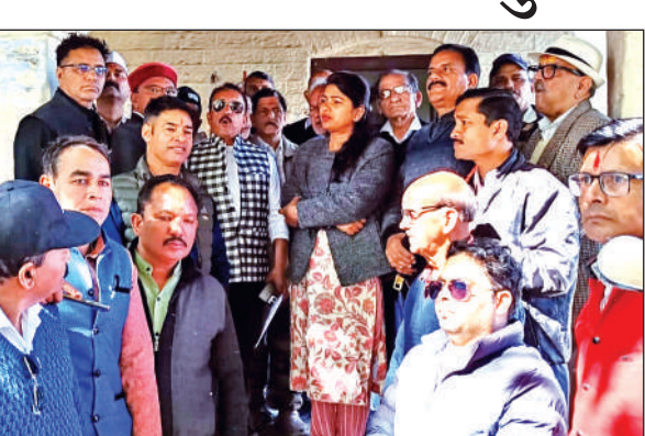
रानीखेत जिले की मांग को लेकर संयुक्त मजिस्ट्रेट को ज्ञापन सौंपते स्थानीय लोग

अमृत विचार: रानीखेत जिले की मांग को लेकर एक बार फिर आवाज बुलंद होने लगी है। जिले की मांग को लेकर संयुक्त मजिस्ट्रेट गौरी प्रभात के माध्यम से मुख्यमंत्री के नाम ज्ञापन भेजा गया। ज्ञापन में कहा कि वर्ष 2011 में तत्कालीन मुख्यमंत्री डॉ. रमेश पोखरियाल 'निशंक' ने कई नए जिलों की घोषणा की थी। जिनमें रानीखेत का नाम भी शामिल था। यह घोषणा उस समय रानीखेत की जनता के लिए विकास की आस थी। लेकिन 14 साल बाद भी रानीखेत को जिला नहीं बनाया गया। अब जबकि उत्तराखंड राज्य अपनी रजत जयंती मनाने जा रहा है। ऐसे में क्षेत्र में रानीखेत जिले की मांग फिर से उठने लगी है। ज्ञापन में कहा गया है कि रानीखेत क्षेत्र भौगोलिक, ऐतिहासिक तथा रणनीतिक दृष्टि से अत्यंत