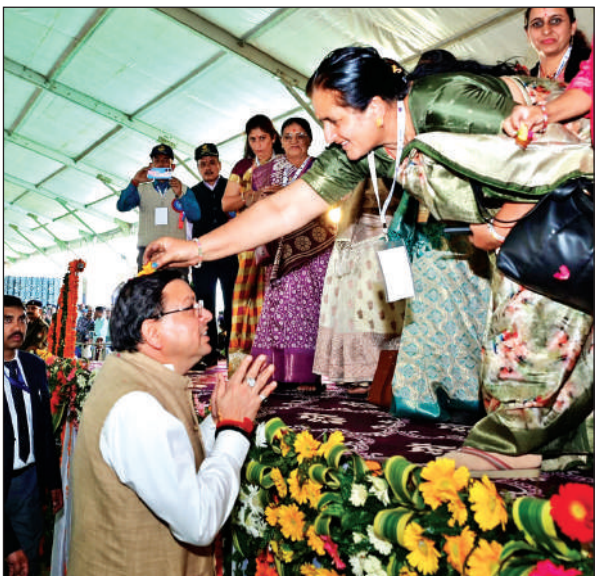
सीएम धामी को आशीर्वाद देती वीर नारी।