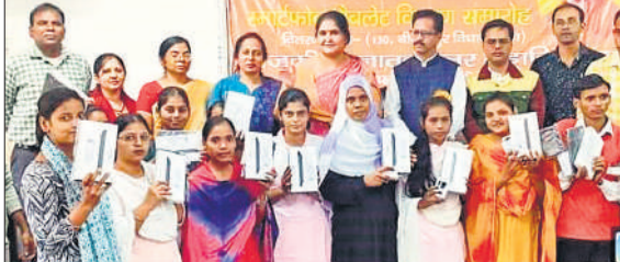
योजना से लाभान्वित हुए विद्यार्थी।