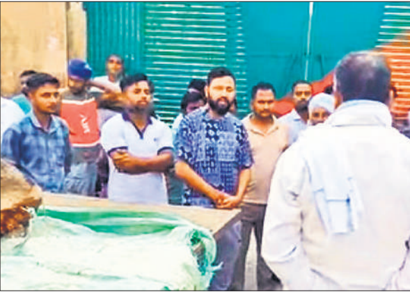
दुधवा मुख्यालय पर प्रदर्शन करते बसंतापुर के ग्रामीण।