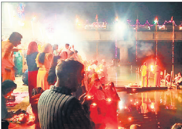
शारदा नदी में हजारों दीप प्रवाहित कर देव दीपावली मनाते श्रद्धालु।