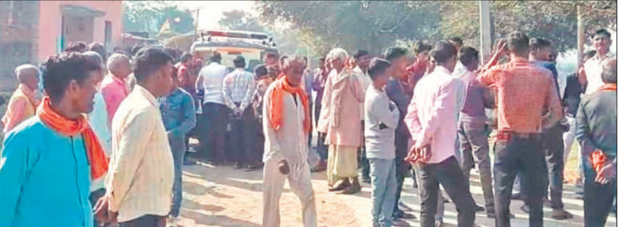
घटना के बाद मौके पर लगी भीड़।