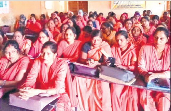
प्रशिक्षण में मौजूद आंगनबाड़ी कार्यकर्ता।