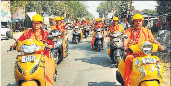
विराट नारी उत्कर्ष समारोह की नारी गौरव मंगल यात्रा में गायत्री परिवार की स्कूटी वाहिनी।