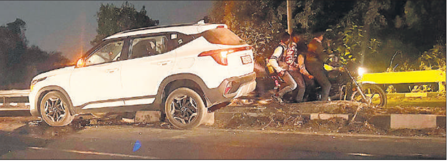
बरेली हाईवे पर बालपुर गांव के पास डिवाइडर कार।

अमृत विचार : तराई क्षेत्र में सर्दी की दस्तक दिवाली के बाद शुरू हो चुकी है। सुबह और रात के वक्त कोहरे की चादर होने से हादसे का डर बना हुआ है। मगर, हाईवे पर भी हालात नहीं सुधारे जा सके हैं। बरेली हाईवे पर भी ललौरीखेड़ा और बालपुर पट्टी के पास आधे अधूरे इंतजाम हैं। आए दिन हादसे होने के बाद भी सुधारात्मक कार्य को लेकर जिम्मेदार बेपरवाह बने हुए हैं। डिवाइडर पर लगवाई गई स्ट्रीट लाइटें लंबे समय से बंद पड़ी हैं और राहगीर परेशान हैं। बता दें कि बरेली हाईवे पर ललौरीखेड़ा क्षेत्र में आए दिन हादसे होते रहते हैं। यहां दो साल से अधिक समय पहले डिवाइडर बनवाए गए। इसके बाद पोल लगाकर स्ट्रीट लाइट लगवा दी