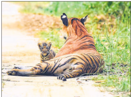
पीलीभीत टाइगर रिजर्व में शावक के साथ बैठी बाधिन।