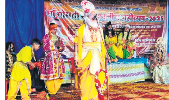
गोमती उदगम स्थल पर राम विवाह का मंचन करते कलाकार।

माधोटंडा स्थित गोमती उद्गम तीर्थ स्थल पर पांच दिवसीय मां गोमती शरदकालीन महोत्सव का आयोजन किया जा रहा है। कार्यक्रम में ब्रज लोक कला फाउंडेशन ग्रुप मथुरा वृंदावन के कलाकारों द्वारा सीता स्वयंवर का मार्मिक मंचन किया गया। मंचन के दौरान दर्शाया गया कि सीता स्वयंवर में राजा जनक ने भगवान शंकर के धनुष तोड़ने वाले के साथ अपनी पुत्री वैदेही के विवाह की शर्त रखी। स्वयंवर में संपूर्ण