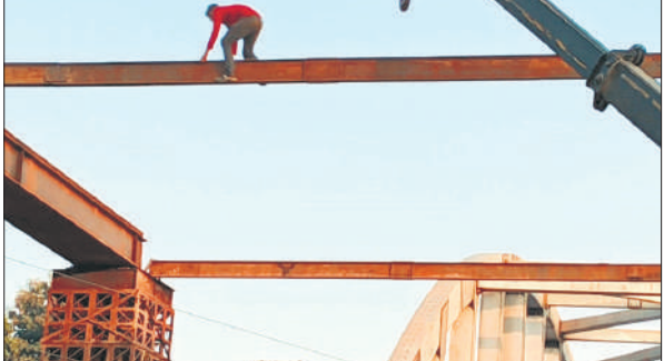
रेलवे लाइन के ऊपर डाले जा रहे गाटर।

इस नवजात शावक के जन्म के साथ ही दुधवा में गैंडों की कुल संख्या बढ़कर 52 हो गई है। उच्च वनाधिकारियों ने इसे गैंडा पुनर्वास योजना की बड़ी सफलता बताते हुए कहा कि दुधवा की हरियाली और संरक्षित पर्यावरण इस प्रजाति के सुरक्षित भविष्य की मजबूत नींव बन रहा है।