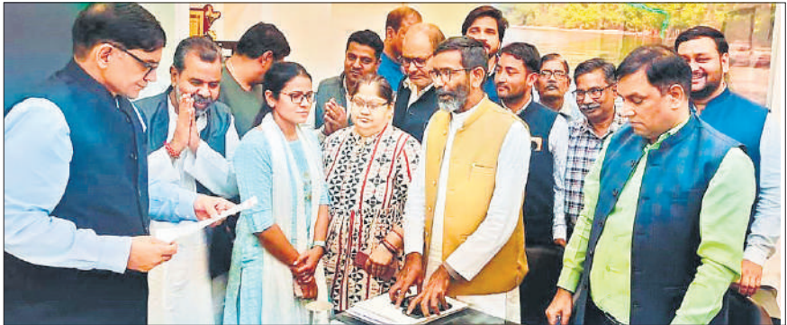
डीएम को ज्ञापन सौंपते एलपीजी वितरक संघ के पदाधिकारी।