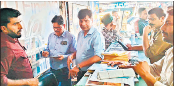
मोबाइल की दुकान पर छापेमारी करती जीएसटी की टीम।

बता दें कि अमरिया कस्बे में संचालित हो ही सिंह मोबाइल शॉप पर टैक्स चोरी को लेकर जीएसटी को शिकायतें मिल रही थी। इसको लेकर टीम ने पड़ताल करने के बाद गुरुवार दोपहर