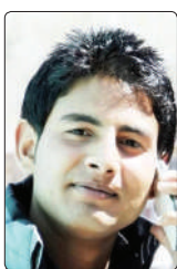
बबलू चंद्रा नैनीताल

यह हमारे सौर मंडल के ग्रह बृहस्पति से भी बड़ा है। जेम्स वेब स्पेस टेलीस्कोप से आश्चर्यजनक कर देने वाले अनोखे ग्रह की खोज हुई। आयरलैंड के ट्रिनिटी कॉलेज डबलिन के वैज्ञानिकों ने इसे खोजा। यह ग्रह हमसे 20 प्रकाश वर्ष दूर है। इसके व्यवहार को देख वैज्ञानिकों ने इस ग्रह को दुष्ट प्रकृति का ग्रह माना है। खगोलविदों ने पहली बार वर्ष 2018 में सिंप - 0136 को देखा था। गहन अध्ययन के बाद इसके ग्रह होने की पुष्टि हुई है, क्योंकि इसका किसी तारे से संबंध नहीं होने के कारण इसकी पहचान नहीं हो पा रही थी, मगर जेम्स वेब टेलीस्कोप के जरिए इसकी पुष्टि संभव हो सकी है। यह दुष्ट ग्रह बृहस्पति की तुलना में लगभग 13 गुणा अधिक विशाल है। यह बहुत गर्म ग्रह है, जिसका तापमान 1500 डिग्री सेल्सियस है। इस ग्रह के खोज का श्रेय डॉ. एवर्ट को जाता है, जिनका कहना है कि यह ग्रह प्रकाश की विभिन्न तरंग दैर्घ्य विभिन्न वायुमंडलीय विशेषताओं वाला है। इस ग्रह पर भारी मात्रा में चुंबकीय क्षेत्र फैला हुआ है, जिस कारण इसमें ऑरोरा बनते रहते हैं। यह अजूबा ग्रह है। इस तरह के ग्रह का पहली बार पता चला है। ब्रह्मांड में इस तरह के और ग्रह भी हो सकते हैं। इसकी वास्तविकता का पता चलने के बाद अधिक चुंबकीय घेरे वाले अन्य ग्रहों की खोज कर पाना आसान हो जाएगा।