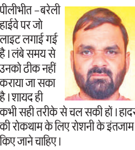
पीलीभीत –बरेली हाईवे पर जो लाइट लगाई गई है। लंबे समय से उनको ठीक नहीं कराया जा सका है। शायद ही कभी सही तरीके से चल सकी हो। हादसे की रोकथाम के लिए रोशनी के इंतजाम किए जाने चाहिए।

अपने संसाधनों से घायलों की मदद करते रहे हैं। अब सर्दी की दस्तक के साथ कोहरा होने पर हादसे होने लगे हैं।