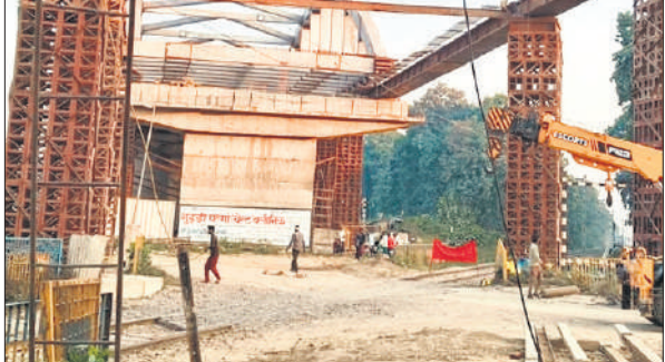
रेलवे लाइन के पास चल रहा निर्माण।