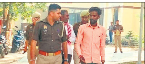
चेकिंग के दौरान बांका लेकर आते पकड़े गए पिता -पुत्र।