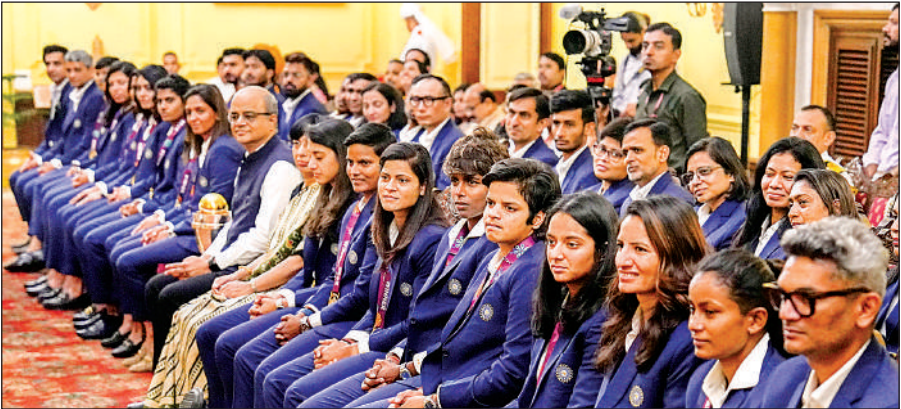
राष्ट्रपति भवन में मौजूद विश्व कप विजेता महिला क्रिकेट टीम व अन्य स्टाफ।

राष्ट्रपति मुर्मू ने टीम को उनकी ऐतिहासिक उपलब्धि पर बधाई दी और कहा कि खिलाड़ियों ने सिर्फ इतिहास ही नहीं रचा है बल्कि वे युवा पीढ़ी के लिए आदर्श भी बन गई हैं। राष्ट्रपति के कार्यालय से जारी एक बयान में उनके हवाले से कहा गया कि युवा पीढ़ी विशेषकर लड़कियां इस उपलब्धि से जीवन में आगे बढ़ने के लिए प्रेरित होंगी। मुर्मू