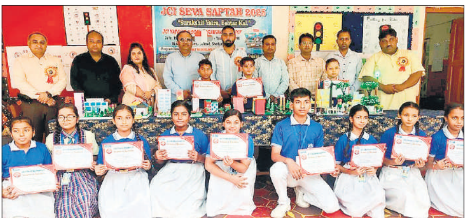
प्रमाण पत्रों के साथ बच्चे।