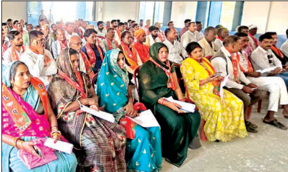
कार्यक्रम में मौजूद भाजपा कार्यकर्ता व पदाधिकारी।