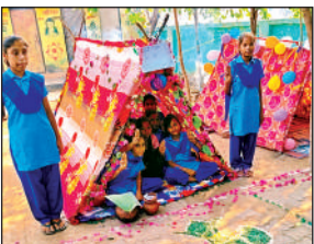
टेंट लगाकर बैठी स्काउड गाइड।

अमृत विचार। विकास खंड ताखा के उच्च प्राथमिक विद्यालय नगला पछांय में आयोजित स्काउट गाइड शिविर के तृतीय दिवस का समापन उत्साहपूर्ण वातावरण में हुआ। इस दौरान बच्चों ने टीमवर्क और स्वावलंबन का शानदार प्रदर्शन करते हुए टेंट निर्माण किया तथा बिना बर्तनों के भोजन तैयार कर रचनात्मकता का परिचय दिया। शिविर में बच्चों को आपदा प्रबंधन से जुड़े कई महत्वपूर्ण विषयों की जानकारी दी गई। उन्होंने प्राथमिक चिकित्सा, स्टेचर निर्माण, गैजेट्स तैयार करने, विभिन्न प्रकार की गांठें व बंधन, दिशा ज्ञान, मीनार निर्माण और कंपास के उपयोग के बारे में व्यावहारिक प्रशिक्षण प्राप्त किया। प्रशिक्षण के दौरान छात्रों में सेवा, अनुशासन और सहयोग की भावना को मजबूत करने पर विशेष