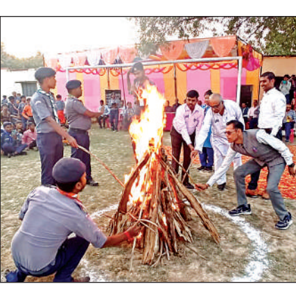
कैप फायर के दौरान शिक्षक और स्काउट-गाइड।