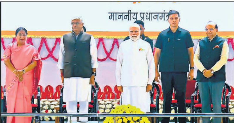
राष्ट्रीय गीत वंदे मातरम के 150 साल पूरे होने पर आयोजित कार्यक्रम में उपस्थित प्रधानमंत्री मोदी।

मोदी ने कहा, वंदे मातरम भारत के स्वतंत्रता संग्राम की आवाज बन गया। इसने हर भारतीय की भावनाओं को व्यक्त किया। दुर्भाग्य से 1937 में वंदे मातरम के महत्वपूर्ण छंदों को... उसकी आत्मा के एक हिस्से को निकाल दिया गया। आज की पीढ़ी को यह जानने की जरूरत है कि राष्ट्र निर्माण के इस महामंत्र के साथ यह अन्याय क्यों हुआ, यह विभाजनकारी मानसिकता देश के लिए आज भी एक चुनौती है। प्रधानमंत्री ने 'वंदे मातरम' को हर युग में प्रासंगिक बताया और 'ऑपरेशन सिंदूर' का स्पष्ट संदर्भ देते हुए कहा, जब दुश्मन ने आतंकवाद का इस्तेमाल करके हमारी सुरक्षा और सम्मान पर हमला