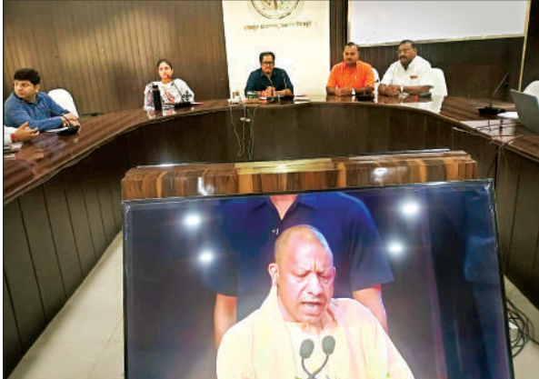
लखनऊ में हुए सीएम के कार्यक्रम को देखते अधिकारी।