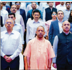
वंदे मातरम कार्यक्रम में मुख्यमंत्री योगी।

● कहा, वंदे मातरम किसी जाति, उपसमा विधि या व्यक्ति का महिमा मंडन नहीं करता