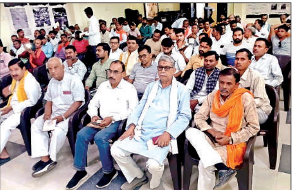
शुक्रवार को आयोजित कार्यशाला में भाग लेते भाजपाई।