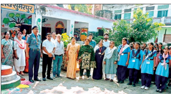
झंडा गान करते शिक्षक और स्काउट-गाइड।