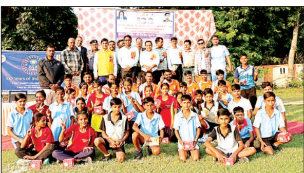
कार्यक्रम में मौजूद खिलाड़ी व अधिकारी।