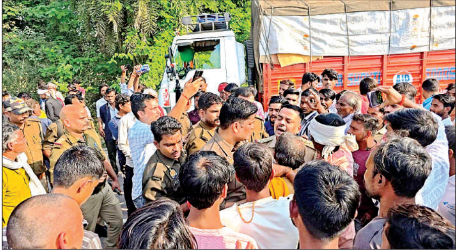
हादसे के बाद बसेला गांव के पास जाम लगाए ग्रामीणों को समझाती कोतवाली पुलिस।