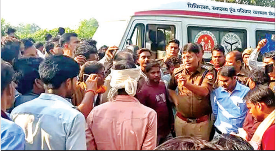
एसडीएम और सीओ के समझाने-बुझाने के बाद जाम खोलने को तैयार हुए ग्रामीण।