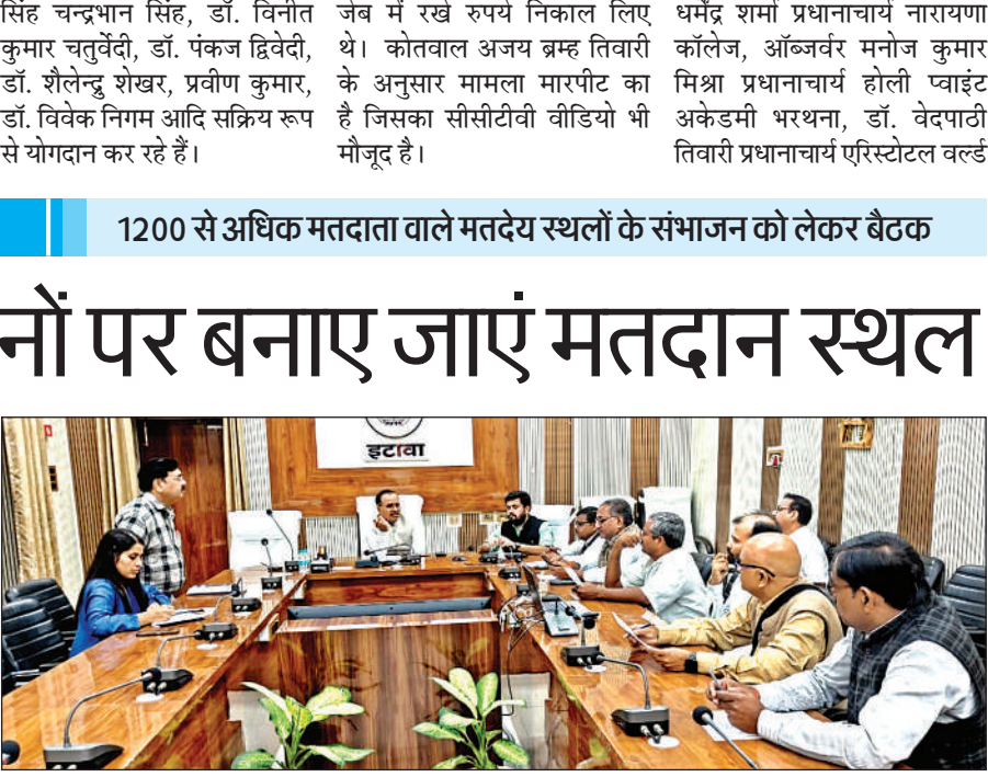
बैठक मेंनिर्देश देते जिलाधिकारी।

अमृत विचार। भारत निर्वाचन आयोग एवं मुख्य निर्वाचन अधिकारी उप्र. लखनऊ द्वारा पुनरीक्षण पूर्व गतिविधियों के अंतर्गत मतदाताओं को बेहतर अनुभव प्रदान करने एवं सुगमता बढ़ाने हेतु 1200 से अधिक मतदाता वाले मतदेय स्थलों का संभाजन कराए जाने के संबंध में बैठक आहुति की गई। बैठक में जिलाधिकारी ने समस्त राजनीतिक दलों से अपील की कि आपका कोई सुझाव हो तो 18 नवंबर तक दे सकते हैं। उन्होंने कहा कि बीएलए को नियुक्त किया जाए। तीनों विधानसभा के मतदान केंद्रों को परीक्षण किया जाए, जिससे चुनाव के समय कोई भी समस्या न हो। पुराने एवं जर्जर भवनों का