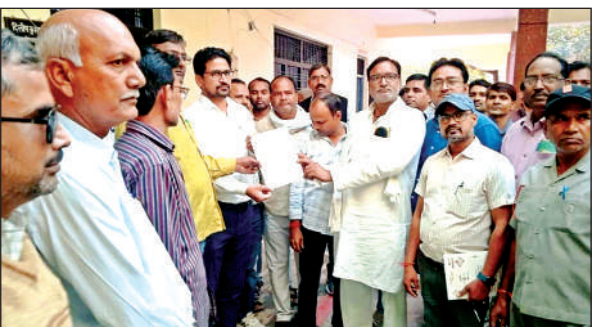
तहसीलदार को ज्ञापन देते प्राथमिक शिक्षक संघ के पदाधिकारी।