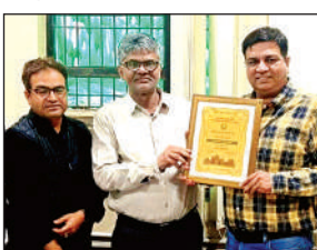
प्रथम पुरस्कार प्राप्त करते कृषि वैज्ञानिक।