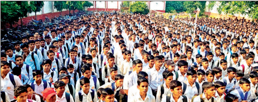
सरस्वती विद्या मंदिर इंटर कॉलेज तिर्वा में वंदेमातरम का गान करते बच्चे।