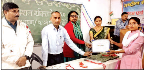
विजेता छात्रा को प्रमाणपत्र देते प्राचार्य।