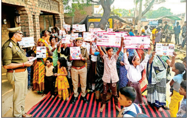
महिलाओं को जागरूक करते पुलिसकर्मी।