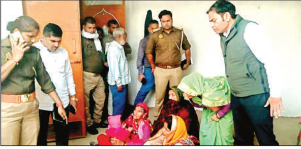
परिजनों से पूछताछ करती पुलिस।