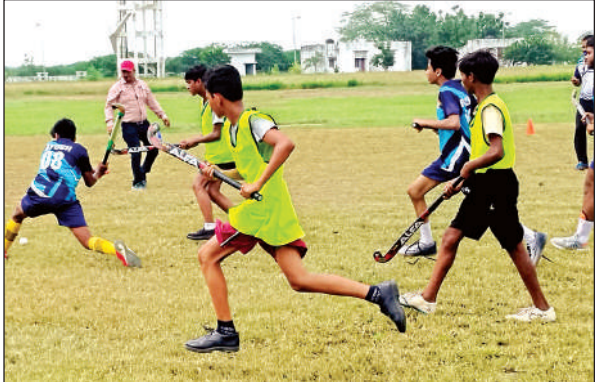
हांकी प्रतियोगिता में हिस्सा लेती टीम।

पं. दीनदयाल उपाध्याय जन्म शताब्दी के अवसर पर जिला