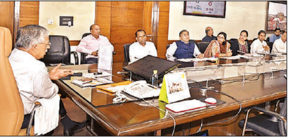
लखपति महिला कार्यक्रम को लेकर बैठक करते मुख्य सचिव एसपी गोयल।