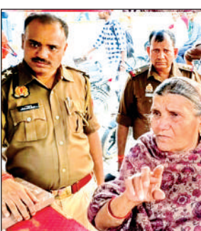
महिला दे रही मामले की जानकारी।