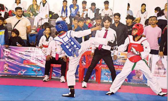
जीत के लिए दम दिखाते ताइक्वांडो के खिलाड़ी।