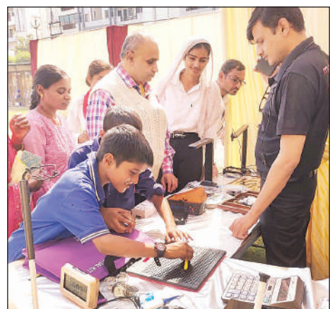
कार्यक्रम में उपस्थित विद्यार्थी व अन्य।