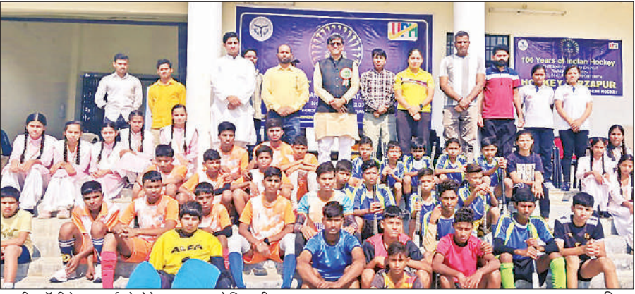
भारतीय हॉकी के 100 वर्ष पूरे होने पर जश्न मनाते खिलाड़ी।