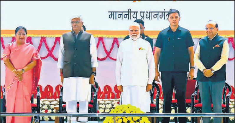
राष्ट्रीय गीत वंदे मातरम के 150 साल पूरे होने पर आयोजित कार्यक्रम में उपस्थित प्रधानमंत्री मोदी।

मोदी ने कहा, वंदे मातरम भारत के स्वतंत्रता संग्राम की आवाज बन गया। इसने हर भारतीय की भावनाओं को व्यक्त किया। दुर्भाग्य से 1937 में वंदे मातरम के महत्वपूर्ण छंदों को... उसकी आत्मा के एक हिस्से को निकाल दिया गया। आज की पीढ़ी को यह जानने की जरूरत है कि राष्ट्र निर्माण के इस महामंत्र के साथ यह अन्याय क्यों हुआ, यह विभाजनकारी मानसिकता देश के लिए आज भी एक चुनौती है। प्रधानमंत्री ने 'वंदे मातरम' को हर युग में प्रासंगिक बताया और 'ऑपरेशन सिंदूर' का स्पष्ट संदर्भ देते हुए कहा, जब दुश्मन ने आतंकवाद का इस्तेमाल करके हमारी सुरक्षा और सम्मान पर हमला