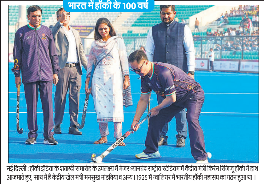
नई दिल्ली : हाँकी इंडिया के शताब्दी समारोह के उपलक्ष्य में मेजर ध्यानचंद राष्ट्रीय स्टेडियम में केंद्रीय मंत्री किरेन रिजिजू हाँकी में हाथ आजमाते हुए, साथ में हैं केंद्रीय खेल मंत्री मनसुख मांडविया व अन्य । 1925 में ग्यालिखर में भारतीय हाँकी महासंघ का गठन हुआ था ।