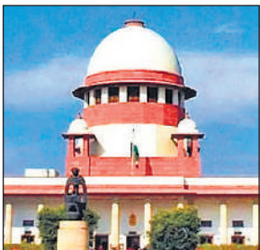
सार्वजनिक रूप से भोजन कराने पर भी रोक लगाई और उनके लिए भोजन स्थल बनाने का निर्देश दिया।

● उच्चतम न्यायालय ने आवारा कुत्तों को सार्वजनिक रूप से भोजन कराने पर भी रोक लगाई