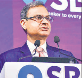
मुंबई में एसबीआई के सभा को संबोधित करते संजय मल्होत्रा।

भारतीय स्टेट बैंक (एसबीआई) के आयोजित बैंकिंग और इकोनॉमिक्स कॉन्क्लेव 2025 में मल्होत्रा ने स्पष्ट किया कि बैंकों पर अधिक जिम्मेदारियां उनके बेहतर प्रदर्शन एवं बेहतर कामकाज के कारण हैं। केंद्रीय बैंक के पास किसी भी गलत व्यवहार पर लगाम लगाने के लिए पर्याप्त साधन मौजूद हैं। आरबीआई सूक्ष्म प्रबंधन नहीं करना चाहता है। कोई भी नि यामक 'बोर्डरूम' के निर्णय का स्थान नहीं ले सकता है और न ही उसे ऐसा करना चाहिए।