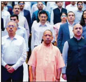
वंदे मातरम कार्यक्रम में मुख्यमंत्री योगी।

● कहा, वंदे मातरम किसी जाति, उपसना विधि या व्यक्ति का महिमा मंडन नहीं करता