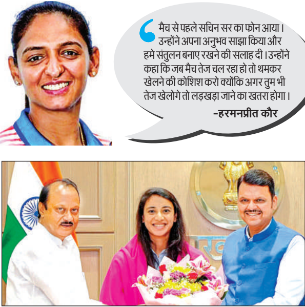
महाराष्ट्र के मुख्यमंत्री देवेंद्र फडणवीस (दाएं) और उपमुख्यमंत्री अजीत पवार ने महिला विश्व कप विजेता भारतीय टीम की उपकप्तान स्मृति मंधाना को सम्मानित किया।

केंद्रीय खेल मंत्री डॉ. मनसुख मांडविया ने शुक्रवार को हॉकी के शताब्दी समारोह में कहा कि ओलंपिक में हॉकी के जरिए ही हमने दुनिया को दिखाया कि भारत खेलों में क्या हासिल कर सकता है। आज यहां भारतीय खेल प्राधिकरण और हॉकी इंडिया ने ऐतिहासिक मेजर ध्यानचंद नेशनल स्टेडियम में एक भव्य शताब्दी समारोह के साथ भारतीय हॉकी के 100 साल पूरे होने का जश्न मनाया। इस अवसर पर डॉ. मांडविया ने इस ऐतिहासिक पल का हिस्सा बनने पर गर्व व्यक्त करते हुए कहा इस खेल ने कई दौर देखे हैं, और ओलंपिक में हॉकी के जरिए ही हमने दुनिया को दिखाया