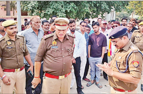
घटना के बारे में जांच-पड़ताल करते सीओ सिटी।

पुलिस ने उसके बेटे को पकड़ कर उसका इनकाउंटर किया, लेकिन पुलिस का कहना है कि लक्ष्य ने ट्रेन के आगे कूदकर आत्महत्या की।