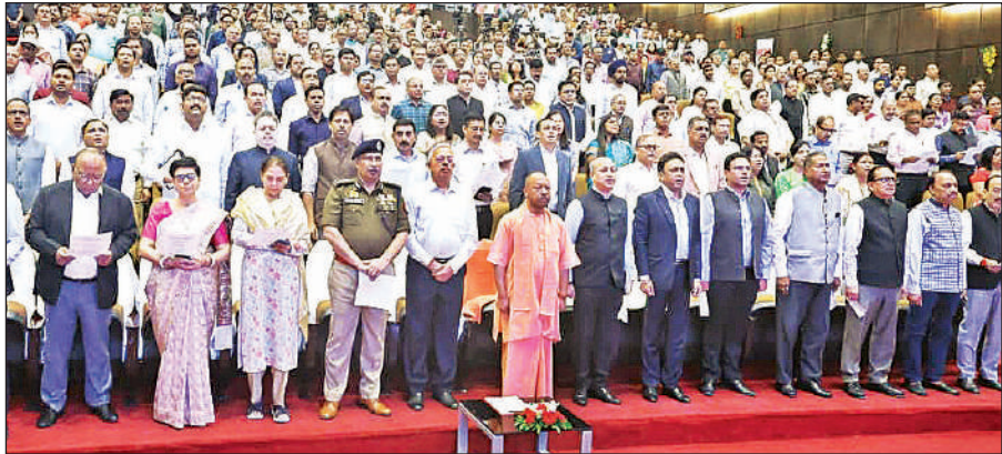
‘वंदे मातरम्’ के 150 वर्ष पूर्ण होने के अवसर पर लखनऊ स्थित लोकभवन में सामूहिक गायन एवं स्वदेशी का संकल्प लेते मुख्यमंत्री योगी आदित्यनाथ, साथ में मुख्य सचिव, डीजीपी, अपर मुख्य सचिव, प्रमुख सचिव व अन्य अधिकारी।

राशन खाने निकले हैं। यह वही दल हैं, जिन्होंने 1990 से 2005 तक बिहार को जातीय संघर्ष, अपहरण, नरसंहार और लूटपाट के अंधकार