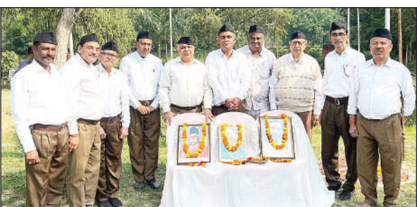
परशुराम वाटिका में आयोजन हुआ।