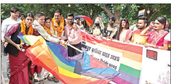
परेड निकालकर अपनी मांगें रखीं।