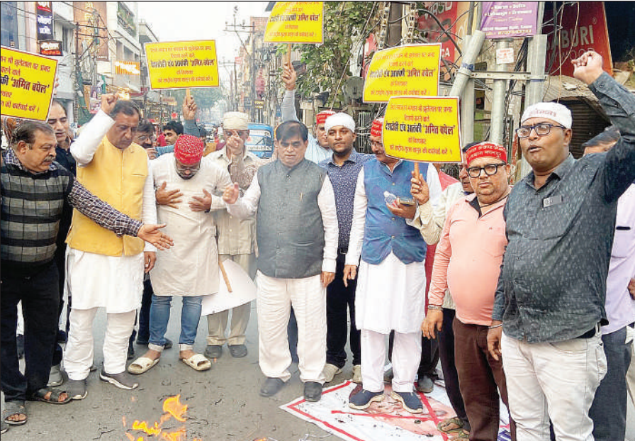
झुलेलाल मंदिर रामबाग से यात्रा निकालकर प्रदर्शन किया।