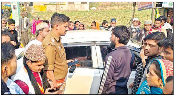
घटनास्थल पर पहुंच कर परिजनों से बातचीत करती पुलिस।

● स्थानीय लोगों ने डंड से मौत होने की आशंका जताई