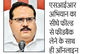
एसआईआर अभियान का सीधे फील्ड से फीडबैक लेने के साथ ही ऑनलाइन