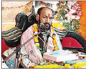
कथा सुनाते आचार्य।