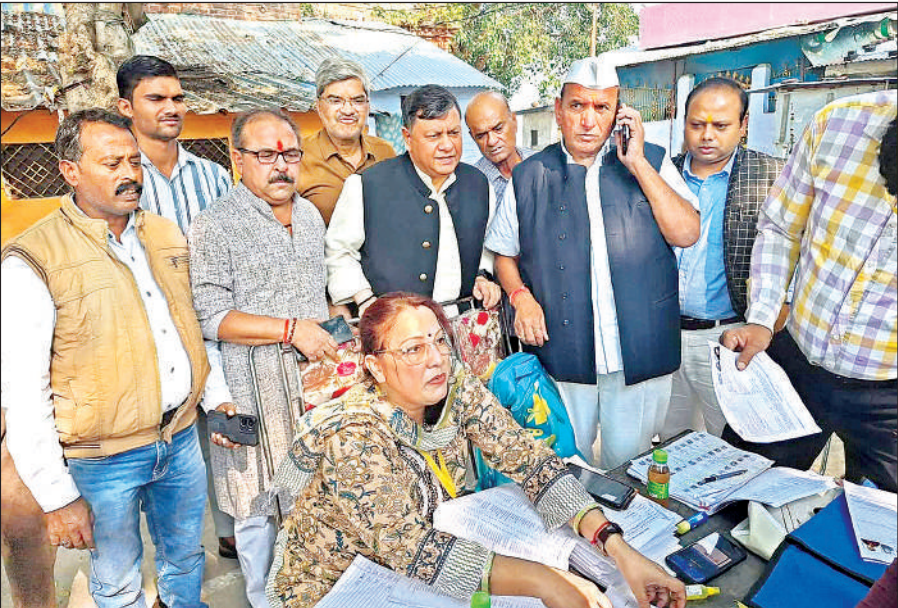
बीएलओ के साथ जुटे कांग्रेसी नेता।

बूथ पर 1200 मतदाता, बीएलओ को फार्म मिले 250, कैसे करें काम, कांग्रेसियों ने बीएलओ को तलाश कर पकड़ा तो खुला राज