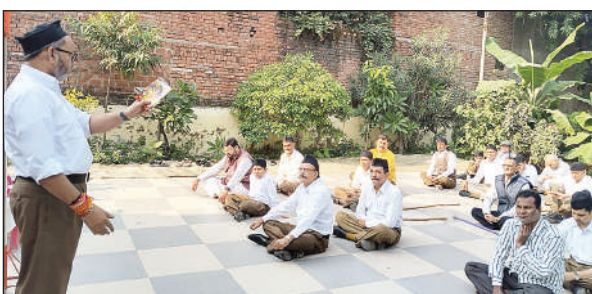
विनायकपुर में वार्षिकोत्सव मनाया गया।