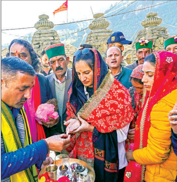
शिमला के रोहड़ु स्थित हाटकोटी मंदिर में पूजा-अर्चना करने पहुंची महिला विश्व कप विजेता टीम की खिलाड़ी रेणुका सिंह।

छठी वरीयता प्राप्त और 2022 विंबलडन चैंपियन एलेना रिबाकिना ने शानदार प्रदर्शन करते हुए शीर्ष रैंकिंग खिलाड़ी एरिना सवालेंका को 6-3, 7-6 (0) से हराकर डब्ल्यूटीए फाइनल्स जीत लिया। रायबाकिना ने शनिवार को रियाद के इनडोर हार्डकोर्ट पर हुए मुकाबले में आठ ऐस लगाए और मैच का एकमात्र ब्रेक भी हासिल किया। रायबाकिना ने अपने खिताबी अभियान में दूसरी वरीयता प्राप्त इगा स्विथालेक, अमांडा अनिसिमोवा और जेसिका पेगुला पर जीत दर्ज की। उन्होंने फाइनल्स जीतने के बाद कहा यह सप्ताह अविश्वसनीय रहा। मुझे किसी नतीजे की उम्मीद नहीं थी और यहां तक सफर तय करना अविश्वसनीय रहा। चार बार की ग्रैंडस्लैम विजेता सवालेंका