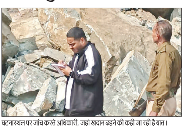
घटनास्थल पर जांच करते अधिकारी, जहां खदान ढहने की कही जा रही है बात।