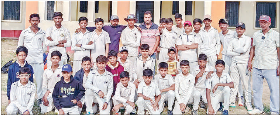
विजेता टीम के साथ मौजूद कोच व आयोजक।