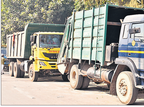
नगर निगम के बाहर कर्मचारियों ने खड़े किए वाहन ।

नगर आयुक्त को शुक्रवार को अपनी समस्याओं से अवगत कराने पहुंचे एबीवीपी कार्यकर्ताओं की नगर निगम कर्मचारियों से विवाद हो गया था। विवाद इतना बढ़ा कि एबीवीपी कार्यकर्ताओं और निगम कर्मचारियों के बीच मारपीट हो गई और जमकर हंगामा हुआ। एबीवीपी कार्यकर्ताओं ने कलेक्ट्रेट में धरना दिया तो नगर निगम कर्मियों ने अपने दफ्तर पर धरना शुरू कर दिया इस दौरान सफाई कर्मचारियों ने अनिश्चितकालीन हड़ताल का ऐलान करते हुए शहर की सफाई व्यवस्था ठप कर दी। शुक्रवार को हुए विवाद के बाद शनिवार और