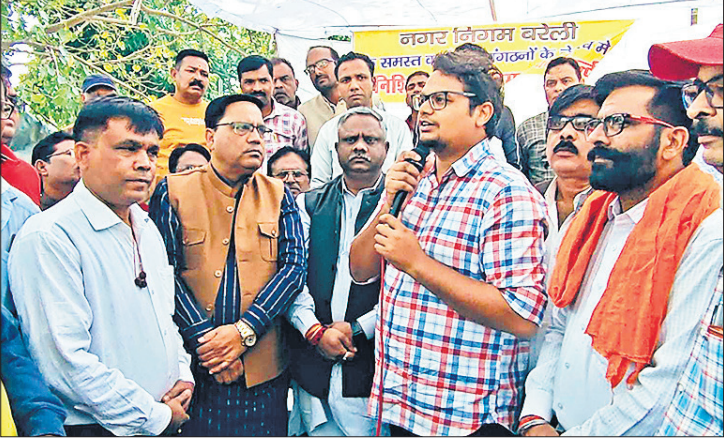
कर्मचारियों से वार्ता कर हड़ताल खत्म कराते आयोग के सदस्य व नगर आयुक्त ।