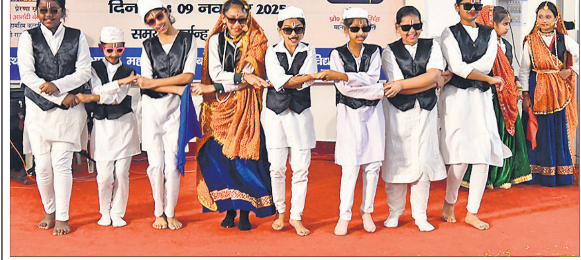
रुहेलखंड विश्वविद्यालय में उत्तराखंड के स्थापना दिवस पर आयोजित कार्यक्रम में सांस्कृतिक प्रस्तुति देते कलाकार ।