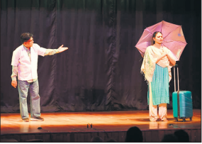
नाटक हम तुम का मंचन करते कलाकार।