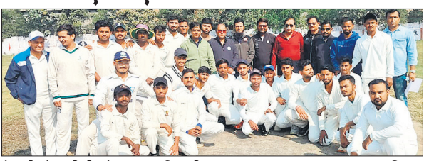
मैच जीतने वाली टीम के साथ पदाधिकारी।