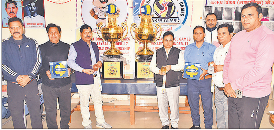
ट्रॉफी का अनावरण करते संयुक्त शिक्षा निदेशक, डीआईओएस व अन्य अधिकारी।

69वीं राष्ट्रीय विद्यालयीय वालीबॉल प्रतियोगिता के लिए पीएम श्री राजकीय इंटर कॉलेज में तैयारियां पूरी कर ली गई हैं। इसमें अंडर-17 आयु वर्ग के बालक और बालिकाएं प्रतिभाग करेंगी।