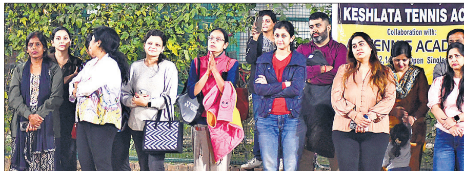
केशलता अकादमी में टेनिस प्रतियोगिता के दौरान मौजूद बच्चों के माता-पिता।