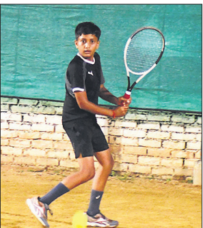
टूर्नामेंट में मैच खेलता खिलाड़ी।