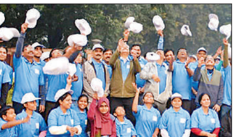
वॉकथॉन में शामिल चिकित्सक व अन्य प्रतिभागी।