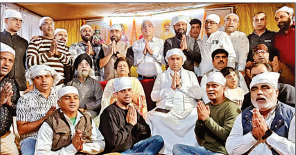
रेन बसेरा की शुरुआत के मौके पर मौजूद लोग।