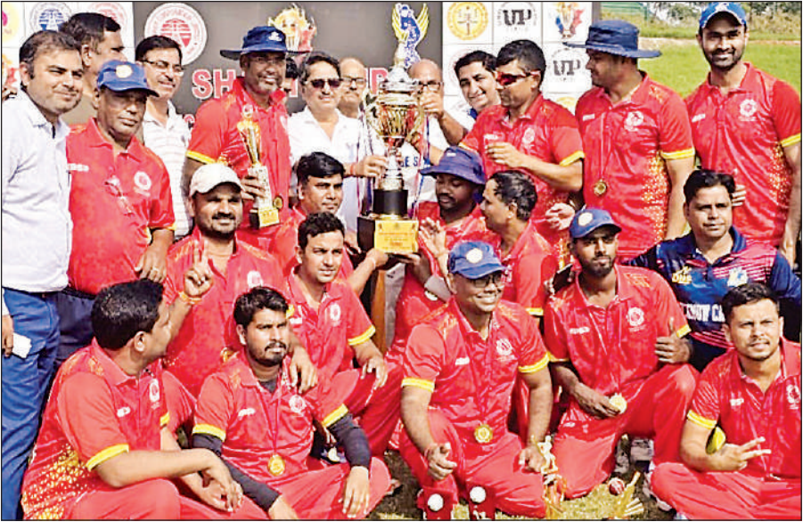
एमवीवीएनएल टीम के कप्तान को ट्रॉफी देते आयोजक और अतिथि।