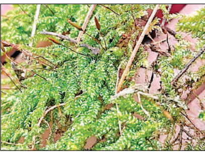
पहाड़ों से लाई गई वनस्पतियां।

दवा के रूप में सामने आई। गठिया से ग्रस्त चूहों पर किए गए प्रयोगों में पाया गया कि इस दवा से जोड़ों की सूजन में उल्लेखनीय कमी आई। जोड़ों के ऊतक शरीर में मौजूद एक प्रमुख प्रोटीन पर प्रभाव डालती हैं। जो प्रतिरक्षा प्रणाली तथा सूजन संबंधी प्रतिक्रियाओं को नियंत्रित करता है। अध्ययन में गठिया की प्रगति को रोकना जा सका।