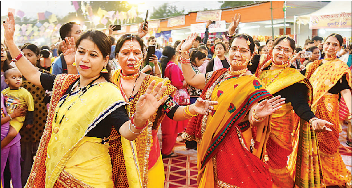
उत्तराखंड महोत्सव में नृत्य प्रस्तुत करती पारंपरिक परिधानों और गहनों से सजी महिलाएं।