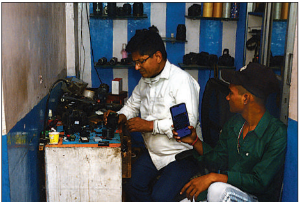
गणेशगंज मार्केट में मोबाइल की रोशनी में काम निपटता दुकानदार।

डिवीजन के टिकैतराय तालाब ट्रांसमिशन में रविवार को रखरखाव का काम किया गया। इससे ऐशबाग के खजुहा, कुंडरी रकाबगंज, शास्त्रीनगर, रामनगर, घोबीघाट तालकटोरा, राजेन्द्र नगर, मवैया लोकोमोटिव क्षेत्र, बशीरतगंज, रानीगंज, नाका हिंडोला, दुर्विजयगंज, सुभाष मार्ग, पीली कॉलोनी, रामलीला ग्राउंड, मोतीझील और हैदरगंज तिराहा जैसे इलाकों में बिजली आपूर्ति लगातार बाधित रही। इससे करीब 50 हजार बिजली उपभोक्ताओं को घंटों बिजली संकट का सामना करना पड़ा। जल संस्थान की पंपिंग व्यवस्था भी ठप पड़ गई, जिससे कई क्षेत्रों में पानी की सप्लाई नहीं हो सकी। पानी के लिए तरसना पड़ा। रविवार को ऐशबाग के टिकैतराय तालाब ट्रांसमिशन पर रखरखाव कार्य के लिए सुबह 10 बजे से 2 बजे तक सप्लाई बाधित होने की जानकारी उपभोक्ताओं को दी गई थी। बिजली आपूर्ति शाम 4 बजे के बाद सामान्य हो सकी।