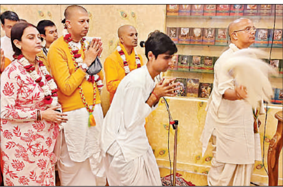
गोमतीनगर के इस्कान मंदिर इस्कान बेस के उद्घाटन अवसर पर मौजूद लोग।