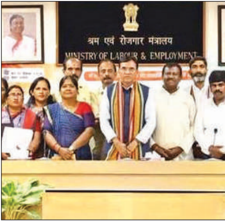
केंद्रीय श्रममंत्री के साथ भारतीय मजदूर संघ का प्रतिनिधिमंडल।