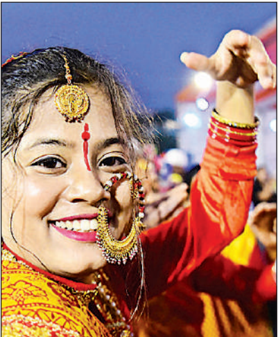
युवती के चेहरे पर झलकता महोत्सव का उल्लास।