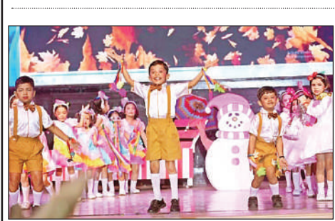
सांस्कृतिक प्रस्तुति देते सीएमएस के छात्र।