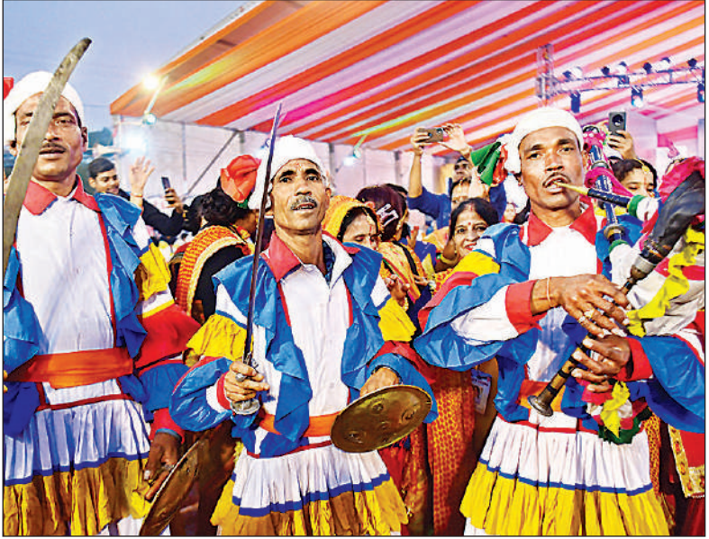
महोत्सव में ढाल, तलवार और बौन के साथ कार्यक्रम प्रस्तुत करते कलाकार।