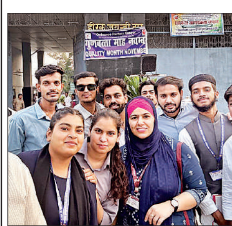
शैक्षिक भ्रमण पर निकले भाषा विश्वविद्यालय के छात्र-छात्राएं।