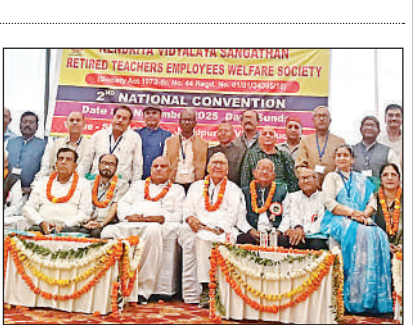
कार्यक्रम में मौजूद संगठन के पदाधिकारी।