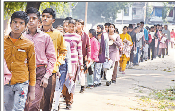
लालबाग गर्ल्स कॉलेज से छात्रवृत्ति परीक्षा देकर निकलते छात्र-छात्राएं।