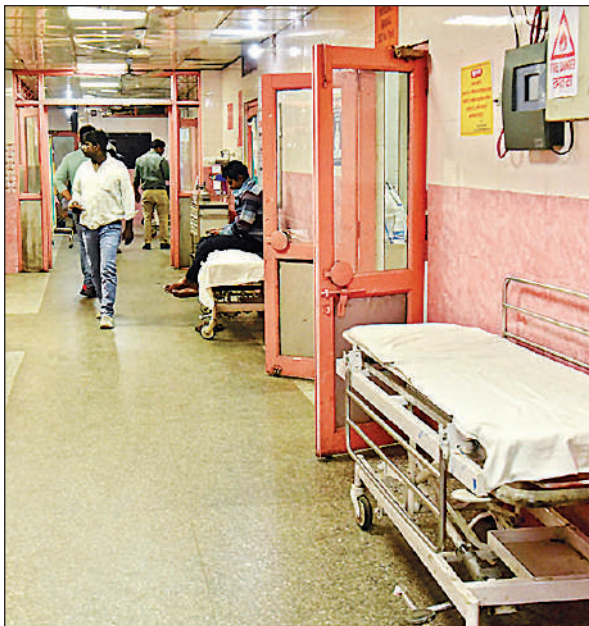
अस्पताल में चाक चौबंद व्यवस्था।