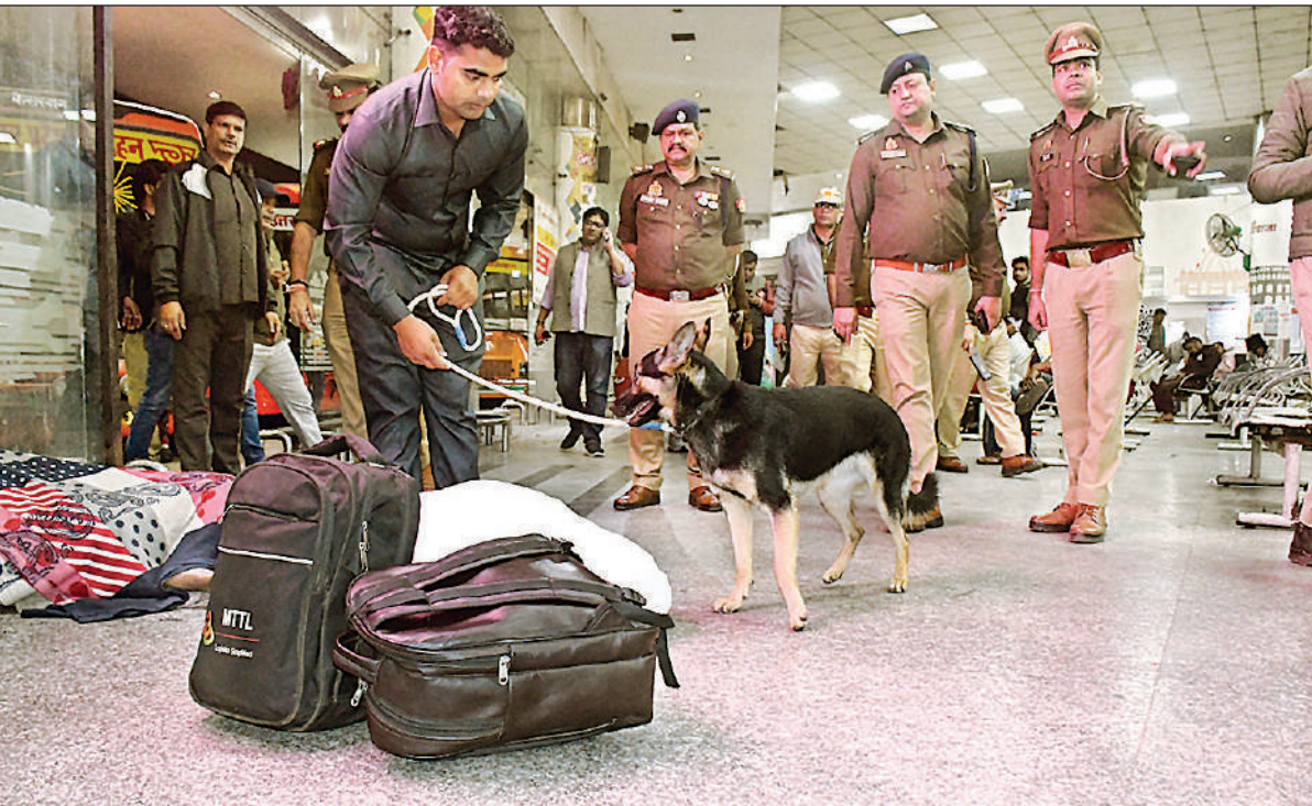
कैसरबाग बस अड्डे पर यात्री के सामान की जांच करती डाग स्क्वाड दस्ता साथ में मौजूद पुलिस अधिकारी।