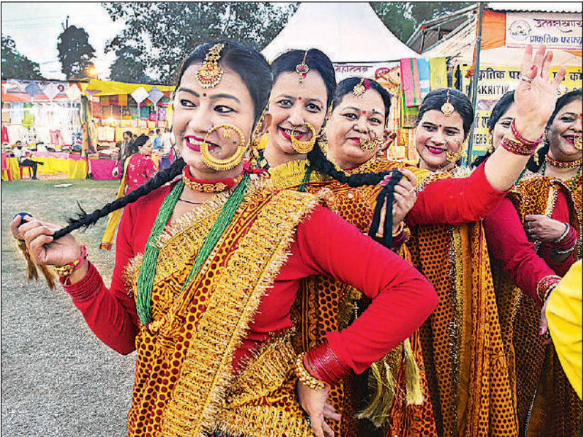
गोमती तट स्थित पं. गोविंद बल्लभ पंत पर्वतीय सांस्कृतिक उपवन में चल रहे उत्तराखंड महोत्सव में पारंपरिक परिधानों में सजी युवतियां और नृत्य करती महिला।