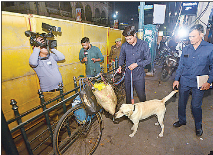
राजधानी में हाई अलर्ट घोषित होने के साथ ही बम निरोधक दस्ते और डाग स्क्वाड के साथ पुलिस ने तलाशी अभियान शुरू कर दिया। बाजार, मॉल के साथ सड़कों पर कार और बाइक ही नहीं साइकिलों तक की जांच की गई।