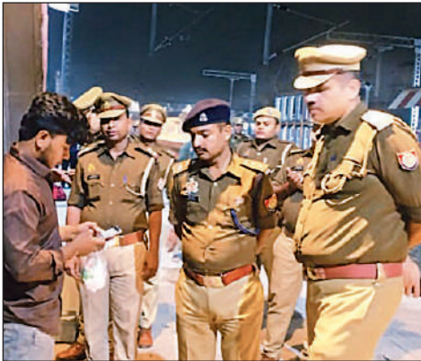
बादशाह नगर रेलवे स्टेशन पर यात्री से पूछताछ करते पुलिस अधिकारी।

■ रेलवे पुलिस और जीआरपी भी अलर्ट हो गई थी। चारबाग, बादशाहनगर, गोमतीनगर, ऐशबाग, सिटी रेलवे स्टेशन पर सुरक्षा में जवान मुस्तैद थे। बिना सामान के प्लेटफार्म पर प्रवेश नहीं दिया जा रहा था। वहीं, सुरक्षाकर्मी ट्रेनों के अंदर भी चेकिंग कर रहे थे। एसीपी जीआरपी की तरफ से निर्देश दिए गए हैं कि संदिग्ध लगने पर न सिर्फ उससे पूछताछ करने के लिए कहा गया, बल्कि उसके दस्तावेज लेकर हस्ताक्षर कराने के लिए कहा है।