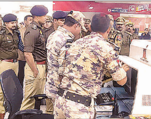
इंदिरानगर मेट्रो स्टेशन पर जांच करते पुलिस अधिकारी।