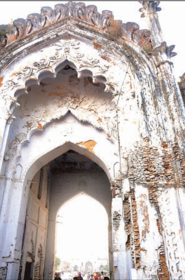
छोटे इमामबाड़े का जर्जर गेट।

इलाहाबाद उच्च न्यायालय की लखनऊ खंडपीठ में वर्ष 2013 में याचिका दायर की गई थी। इसमें बताया गया था कि छोटे इमामबाड़े के दोनों गेट देखरेख के अभाव में पूरी तरह से जर्जर हो चुके हैं और जबरदस्त अतिक्रमण का शिकार हैं। 12 वर्ष की लंबी लड़ाई के बाद हाईकोर्ट ने 9 जनवरी 2025 को राजधानी के प्रशासन को छोटे इमामबाड़े के दोनों गेटों को अतिक्रमण मुक्त कराने और मरम्मत की तत्काल व्यवस्था कराने के आदेश दिए थे। इसके बाद जिम्मेदार फिर सो गए। पुरातत्व विभाग भी जर्जर गेटों की