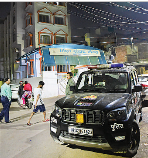
आरएसएस कार्यालय के बाहर मुस्तैद पुलिस।