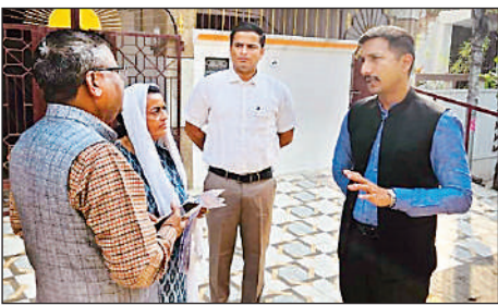
बीएलओ से गणना प्रपत्र की जानकारी लेते जिलाधिकारी।

अमृत विचार, लखनऊ : विधानसभा निर्वाचन क्षेत्रों की मतदाता सूचियों के विशेष प्रगाढ़ पुनरीक्षण कार्यक्रम (एसआईआर) के सफल क्रियान्वयन के लिए जिलाधिकारी एवं जिला निर्वाचन अधिकारी विशाख जी ने सोमवार को लखनऊ उत्तर विधानसभा के विभिन्न क्षेत्रों का निरीक्षण किया। उन्होंने विनय खंड, गोमतीनगर स्थित बृध संख्या 401, 402, 403 एवं 404 का स्थल निरीक्षण कर आवश्यक दिशा-निर्देश दिए। इसके अलावा विवेक खंड स्थित बृध संख्या 405, 406, 407, 409 एवं 410 का औचक निरीक्षण कर व्यवस्थाओं का जायजा लिया। जिलाधिकारी ने बृध लेवल ऑफिसर (बीएलओ) से गणना प्रपत्रों के वितरण की स्थिति, मतदाताओं से संपर्क की प्रगति एवं मोबाइल एप के माध्यम से जी आ रही मार्किंग की जानकारी ली।