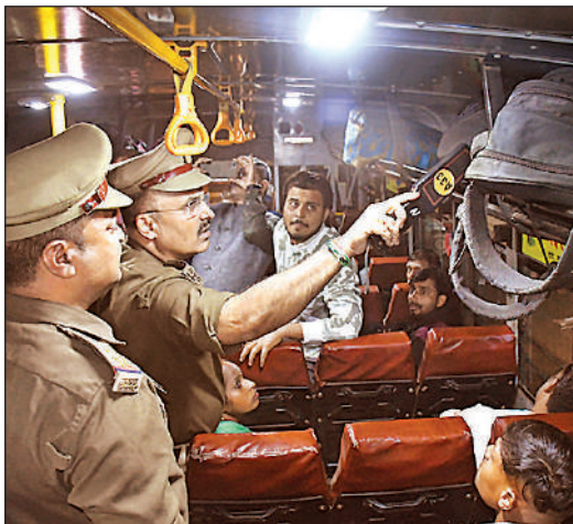
बस में यात्री के सामान की जांच करती पुलिस।