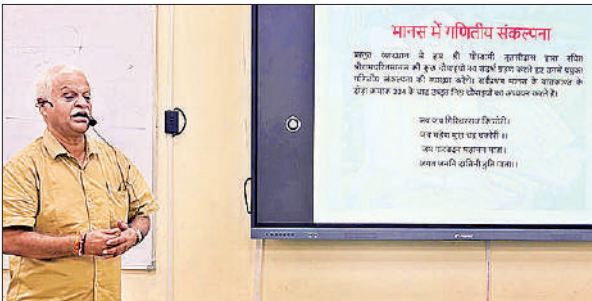
रामचरित मानस की चौपाई पर गणित समझाते विशेषज्ञ।