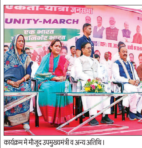
कार्यक्रम में मौजूद उपमुख्यमंत्री व अन्य अतिथि।