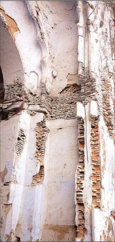
छोटे इमामबाड़े का जर्जर गेट।