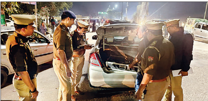
दुबगा में कार की जांच करती पुलिस की टीम।