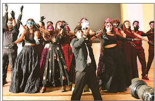
यूरेका में कार्यक्रम प्रस्तुत करते विद्यार्थी।