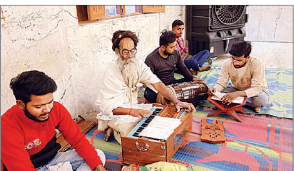
भजन-कीर्तन करते पुजारी व श्रद्धालु।

उनके एचडीएफसी बैंक खाते से 8 सितंबर की देर रात 45,700 की निकासी कर ली गई। उन्होंने 9 सितंबर को साइबर सेल में शिकायत दर्ज कराई। दोनों मामलों में तहरीर मिलने के बाद शहर कोतवाली पुलिस ने रिपोर्ट दर्ज की है।