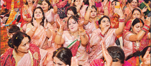
रिफार्म क्लब में आयोजित श्री श्याम महोत्सव में मौजूद लोग।