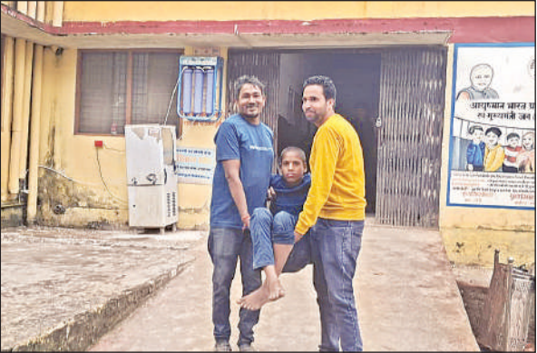
संसाधन के आभाव में मरीज को उठाकर ले जाते परिजन।