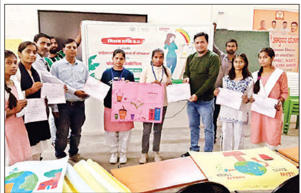
पोस्टर प्रतियोगिता के दौरान कला का प्रदर्शन करती छात्राएं।