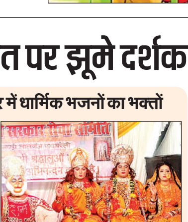
सजी राम लक्ष्मण जानकी व हनुमान की झांकी।