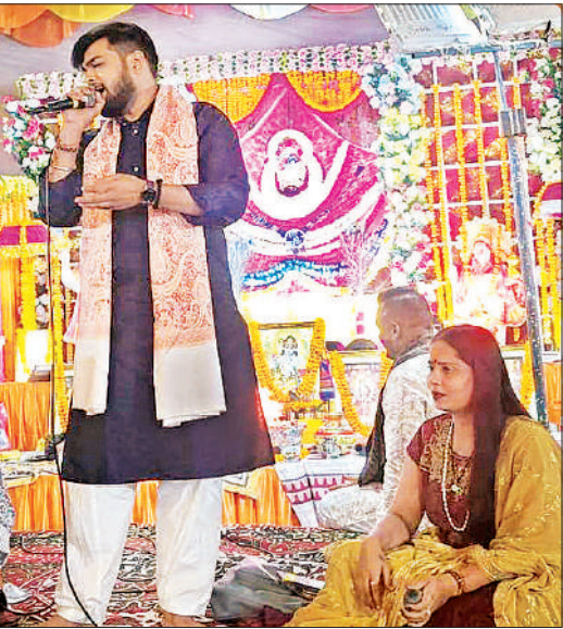
भजन कीर्तन करते गायक।