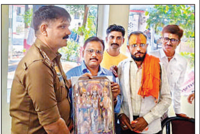
चित्र थैट करते केसरिया हिंदू वाहिनी परिवार के सदस्य।