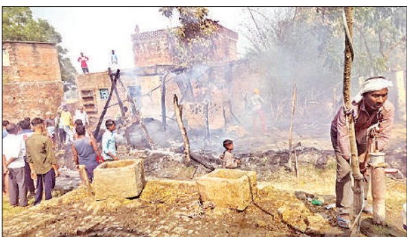
आग बुझाने के बाद मौके पर मौजूद लोग।