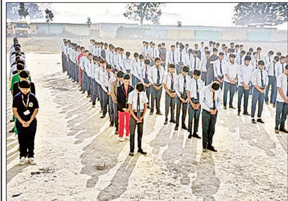
शोक व्यक्त करते संस्कार ग्लोबल स्कूल गौरीगंज के बच्चे व शिक्षक।