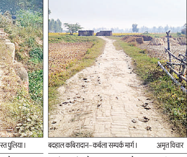
जगतपुर क्षेत्र के चंदौली तिराहे के पास क्षतिग्रस्त पुलिया।