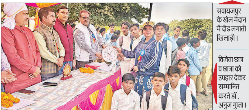
सवायजपुर के खेल मैदान में दौड़ लगाती खिलाड़ी।