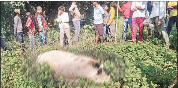
मारा गया पागल सांड व मौके पर मौजूद ग्रामीण।