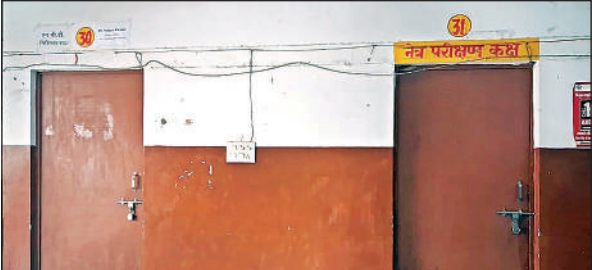
सीएचसी में ओपीडी और नेत्र परीक्षण कक्ष में लटका मिला ताला। अमृत विचार

अमृत विचार। अमेठी सीएचसी में मरीजों को आए दिन भारी दिक्कतों का सामना करना पड़ रहा है। यहां उपस्थित मरीजों व तीमारदारों में ने अधीक्षक पर सीएचसी न पहुंचकर खुद का नर्सिंगहोम चलाने का आरोप लगाया है। इसके अलावा लापरवाही के चलते सीएचसी में अव्यवस्थाओं की अंबार लगा हुआ है, जिसकी कोई जिम्मेदार सुधि लेने के लिए तैयार नहीं है।