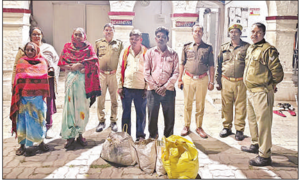
आबकारी की गिरफ्त में आरोपी।