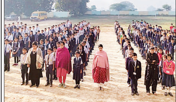
शोक व्यक्त करते बच्चे व शिक्षक।