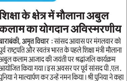
शिक्षा के क्षेत्र में मौलाना अबुल कलाम का योगदान अविस्मरणीय