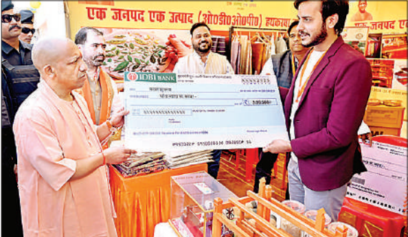
मुख्यमंत्री युवा उद्यमी योजना के तहत लाभार्थी को चेक देते सीएम। ● अमृत विचार

मुख्यमंत्री ने कहा कि राष्ट्रीय एकता के लिए सबको अपने मनमुटाव छोड़कर एकजुट होना होगा। जब देश एक होगा, तभी विकास की गति और तीव्र होगी। योगी ने कहा कि उत्तर प्रदेश अब बीमारू राज्य नहीं, बल्कि