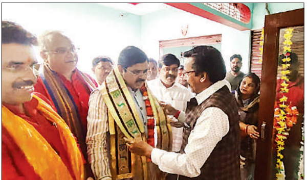
भाजपा कार्यालय पर उपस्थित अवध क्षेत्र प्रभारी का स्वागत करते पदाधिकारी।