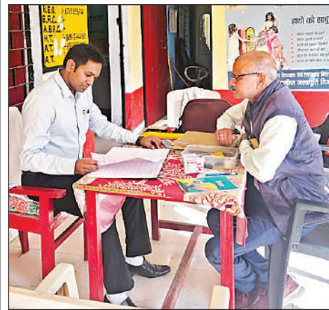
विद्यालय में अभिलेखों की जांच करते खण्ड विकास अधिकारी।