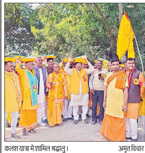
कलश यात्रा में शामिल श्रद्धालु।