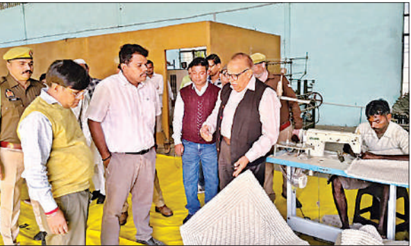
बिसवां में ओडीओपी योजना को लेकर निरीक्षण करते डीएम।