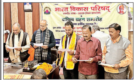
शपथ लेते भारत विकास परिषद के नवमनोनीत पदाधिकारी।