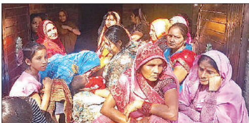
मृतक के गमगीन बेटे परिजन।

सरकार ने सड़क पर धूमने वाले गोवंशों को एक ठिकाना देने के लिए गांव-गांव गौशालाएं खोलीं। इन गौशालाओं पर करोड़ों रुपये खर्च भी किए जा रहे हैं। लेकिन सच्चाई यही है कि अधिकतर गौशाला गोवंशों का ठिकाना नहीं, बल्कि जिम्मेदारों की कमाई का जरिया बन गई हैं। मौत का तांडव मचाने वाला आंवारा सांड अहमदी में घूमा करता था, वहीं से पागल हुआ। लोगों का कहना है कि अगर उसे गौशाला में आश्रय मिल जाता तो वह न तो खुले में घूमता, न ही उसे पागल कुत्ता काटता और न ही मौत का यह तांडव होता।