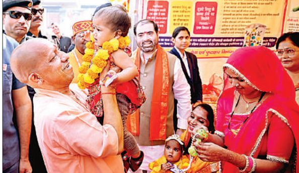
बच्चे को गोद में उठाकर दुलार करते मुख्यमंत्री योगी आदित्यनाथ। ● अमृत विचार

लाभार्थियों को किया सम्मानित : कार्यक्रम में मुख्यमंत्री