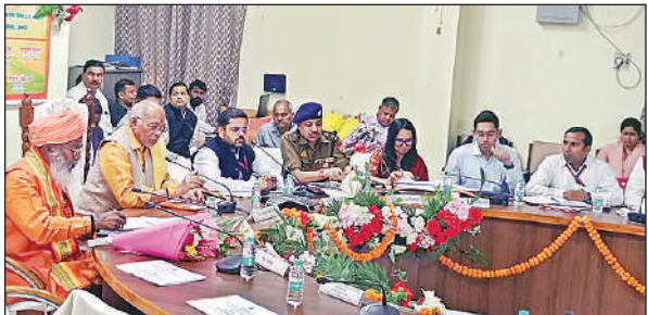
विकास भवन सभागार में आयोजित बैठक में मौजूद प्रभारी मंत्री, सांसद व अन्य।