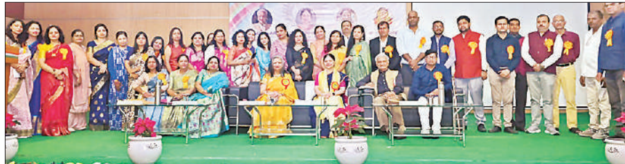
लविवि कुलपति के साथ महाविद्यालय की शिक्षिकाएं व शिक्षक।