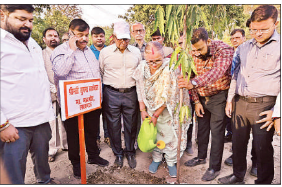
हिंद नगर वार्ड में अतिक्रमण मुक्त कराई जमीन पर पौधरोपण करतीं महापौर।