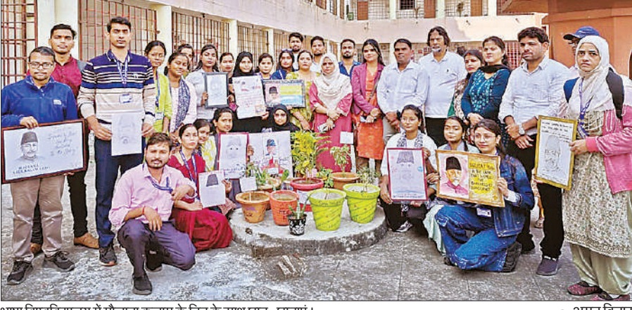
भाषा विश्वविद्यालय में मौलाना कलाम के चित्र के साथ छात्र-छात्राएं।