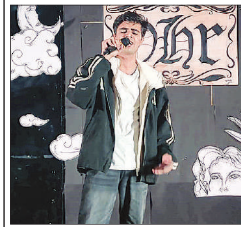
सांस्कृतिक प्रस्तुति देता विश्वविद्यालय का छात्र।