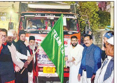
राहत सामग्री को हरी झंडी दिखाते ट्रस्ट के पदाधिकारी।