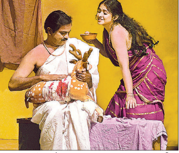
नाटक आषाढ़ का मंचन करते कलाकार।