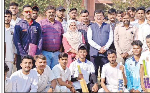
क्रिकेट चयन ट्रायल में कुलपति के साथ खिलाड़ी।