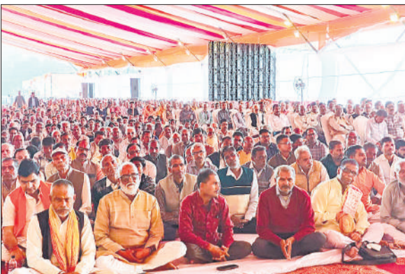
श्रीराम कथा के दौरान अहिल्या उद्धार प्रसंग सुनते श्रद्धालु।

महाराज ने कहा कि भगवान जब धरती पर अवतरित होते हैं, तो वे केवल अधर्म का नाश करने नहीं, बल्कि आत्माओं का उद्धार करने आते हैं। उन्होंने कहा "अहिल्या पत्थर नहीं थीं, वे अहंकार और अविश्वास की प्रतीक थीं। जब श्रीराम के चरण उन पर पड़े, तो उनके भीतर की चेतना जाग उठी। यही रामकृपा है जो स्पर्श से नहीं, भावना से उद्धार करती है।" ताड़का वध प्रसंग पर महाराज ने बताया कि यह केवल राक्षसी का वध