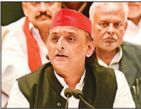
पत्रकारों को जानकारी देते सपा प्रमुख।

अखिलेश यादव ने घोषणा की कि विजन इंडिया, स्टार्टअप समिट की पहली बैठक इस वर्ष 16 नवंबर को ताज बंगलोर, बेंगलुरु,