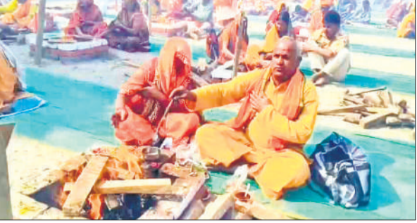
रज्ञ में आहूति देते साधु संत व श्रद्धालु।