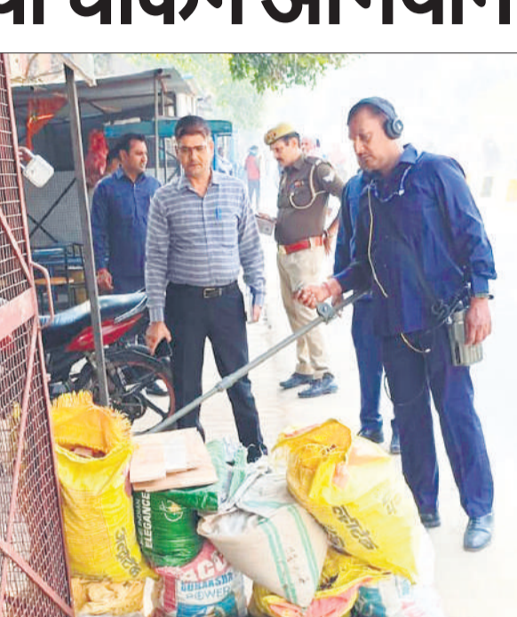
मेटल डिटेक्टर से सामान चेक करते पुलिसकर्मी।

दिक्कत न हो। मरीज और तीमारदार भी वार्ड से बाहर निकल कर टहल सकें। सीएमएस ने बताया कि स्ट्रीट लाइट लगाने के बाद अस्पताल परिसर बिजली से रोशन हो जाएगा।