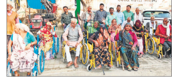
बांटे गए सहायक उपकरणों के साथ बुजुर्ग।