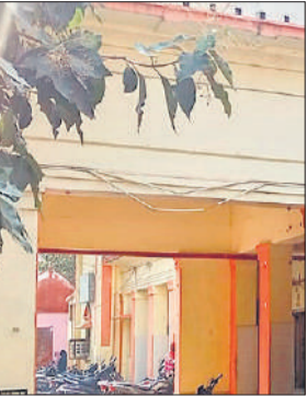
जिला अस्पताल भवन।

तीमारदारों को किसी भी समय अप्रिय घटना की आशंका बनी रहती है। अस्पताल कर्मचारियों को भी अंधेरे में दिक्कत होती है। पिछले दिनों स्वास्थ्य विभाग की लखनऊ से आई एक टीम ने अस्पताल परिसर का निरीक्षण किया। निरीक्षण में रात के समय कुछ स्थानों पर अंधेरा छाप रहने की बात कही गई। टीम ने अस्पताल के विभिन्न स्थानों पर स्ट्रीट लाइट लगाने के निर्देश दिए थे, लेकिन स्वास्थ्य विभाग के उच्चाधिकारियों की ओर से स्ट्रीट लाइट लगाने की अनुमति नहीं मिली। अस्पताल प्रशासन द्वारा इसके