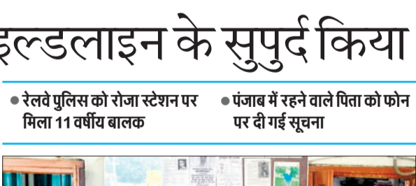
रोजा स्टेशन पर बालक को वाइल्ड केयर टीम को सौंपती जीआरपी शाहजहांपुर पुलिस।