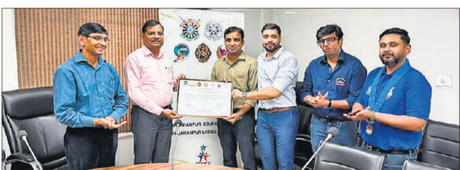
नर्सिंग स्टाफ को सम्मानित करते मेडिकल कॉलेज के प्राचार्य।