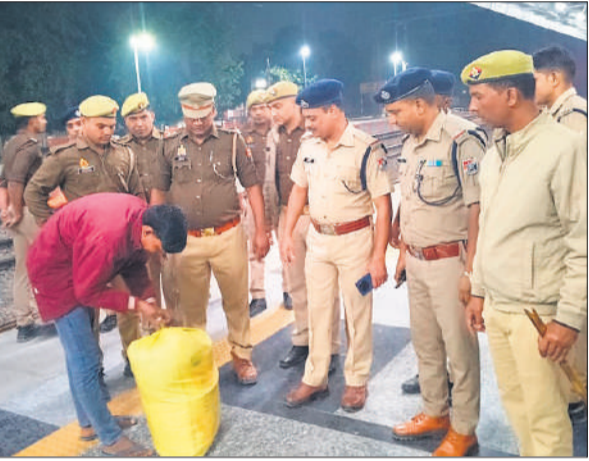
रेलवे स्टेशन पर यात्री का सामान चेक करती पुलिस।

यात्रियों का सामान खंगाला, रेलवे की पार्किंग में खड़े वाहन चेक किए गए। रेलवे स्टेशन परिसर में संदिग्धों से पूछताछ की गई। रेलवे स्टेशन के बाहर दुकानों पर पूछताछ कर उनकी तलाशी ली गई। हर आने जाने वाले से पूछताछ की गई। मंगलवार को वरिष्ठ पुलिस