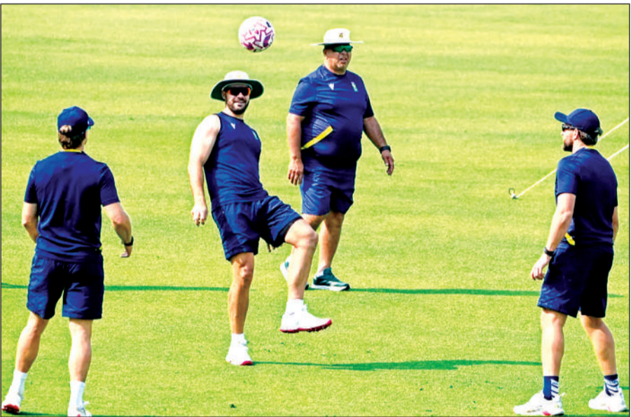
अभ्यास सत्र के दौरान फुटबाल खेलते दक्षिण अफ्रीका के एडेन मार्कराम व अन्य खिलाड़ी।

दक्षिण अफ्रीका की टीम आत्मविश्वास से भरी हुई है क्योंकि पिछले महीने चुनौतीपूर्ण परिस्थितियों में उसने पाकिस्तान के खिलाफ दो मैच की सीरीज 1-1 से ड्रां कराई थी। गिल ने पिछले महीने वेस्टइंडीज के खिलाफ दो टेस्ट मैचों में अर्धशतक और नाबाद शतक लगाया था, लेकिन इसके बाद सीमित ओवरों की क्रिकेट में वह रन बनाने के लिए जूझते रहे। वह ऑस्ट्रेलिया में वनडे और टी-20 मैचों की आठ पारियों में एक भी अर्धशतक नहीं लगा पाए और उनका उच्चतम स्कोर 46 रन रहा। लेकिन टेस्ट टीम की कमान संभालने के बाद वह प्रतिबद्ध दिखे और उन्होंने अपनी फॉर्म हासिल करने के लिए अभ्यास सत्र में