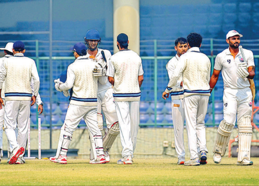
अरुण जेटली स्टेडियम में मैच के उपरांत एक-दूसरे का औपचारिक अभिवादन करते जम्मू-कश्मीर और दिल्ली के खिलाड़ी।