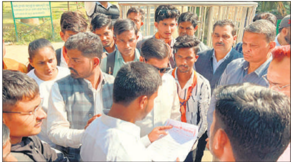
गांधी फैज-ए-आम कॉलेज गेट पर मांग-पत्र सौंपते एबीवीपी कार्यकर्ता।

एबीवीपी नेताओं ने बताया कि कॉलेज परिसर में स्वच्छता, सुरक्षा और अनुशासन की स्थिति बेहद खराब है। छात्र-छात्राएं मूलभूत सुविधाओं के अभाव में परेशान हैं। हाल ही में एबीवीपी ने इसी कॉलेज में अपनी इकाई का विस्तार किया है, जिसके बाद छात्रों की शिकायतों को संज्ञान में लेकर यह कदम उठाया गया। मांग-पत्र में प्रमुख