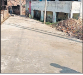
कुलचौरा गांव की पक्की सड़क।

ब्लॉक जगत का गांव कुलचौरा फरूखाबाद हाईवे पर शहर से सटा हुआ है। इस गांव में करीब एक हजार से अधिक मतदाता हैं। एक ही जाति के लोग रहते हैं। गांव में हर पांच साल बाद ग्राम पंचायत के चुनाव होते हैं। प्रधान चुने जाते हैं और पांच साल का कार्यकाल पूरा कर चले जाते हैं, लेकिन किसी ने भी गांव की दुर्गति को लेकर कुछ नहीं किया। फरूखाबाद रोड से गांव के अंदर को जाने को 100 मीटर की कच्ची रास्ता थी। इस रास्ते पर हर समय जलभराव रहता था। बारिश के समय दो से तीन फुट पानी भरा रहता था। इससे ग्रामीणों