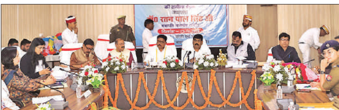
उत्तर प्रदेश विधान परिषद की वित्तीय एवं प्रशासकीय विलंब समिति की बैठक में शामिल लोग।

उत्तर प्रदेश विधान परिषद की वित्तीय एवं प्रशासकीय विलम्ब समिति की बैठक है। जिला पंचायत राज अधिकारी बदायूं के यहां मृतक आश्रित के सेवायोजन से संबंधित 10 प्रकरण लंबित हैं। बदायूं के उपायुक्त उद्योग की सेवारत कर्मचारी की बरेली में सात वर्ष से भर्ती लंबित है। इस पर समिति ने कड़ी नाराजगी जताई। इसके