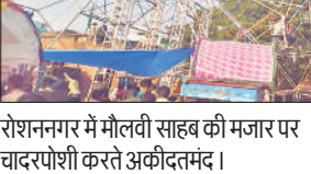
रोशननगर में मौलवी साहब की मजार पर चादरपोशी करते अकीदतमंद।

अमृत विचार: रोशन नगर कस्बे में हो रहे मौलवी साहब के चार दिवसीय सालाना उर्स का समापन फ़ातेहा, चादरपोशी और मन्नतो के साथ हो गया। दूर दराज से आये दुकानदार बिक्री से खुश हुये तो बच्चों ने खेलों और झालों का आनंद लिया। रोशननगर में मौलवी साहब बाबा के चार दिनी उर्स में दूर दराज के साथ क्षेत्र के गांव रोशननगर, ममरी, सरकारगढ़, बांसबेरिया, सोखिया, मुरादपुर, जनकपुर, शेखवापुर, जमुनहा, अंगदपुर, दूनीपुर, भगतपुर, बुधेली नानकार, वनबुधेली, कैमा, परेली, धिरावां, रामपुर, डाटपुर, बाबरपुर. लखैया, बन्जारागंज, नरसिंहपुर, बरगदिया आदि कई गांवों के तमाम अकीदतमन्दों ने मजार पर