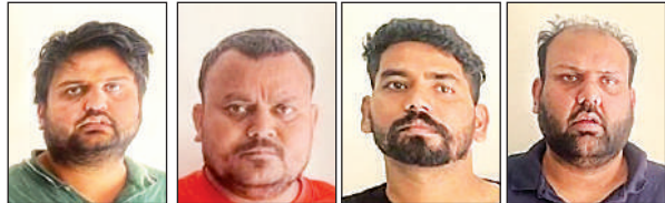
यूपी एसटीएफ की कार्रवाई में पकड़े गए तस्करी के आरोपी।

आरोपी करीब डेढ़ साल से लखनऊ के सुशांत गोल्फ सिटी थाने में दर्ज मामले में फंरा चल रहे थे। आरोपियों ने फेंसेडिल सिरप की तस्करी से करीब 200 करोड़ की संपति बनायी थी। जिसका ब्योरा