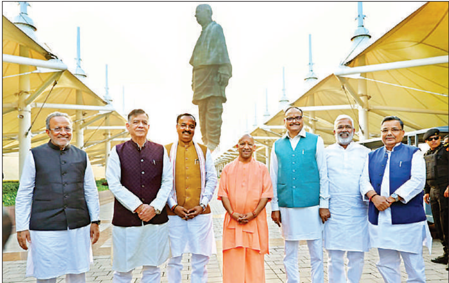
गुजरात स्थित स्टैच्यू ऑफ यूनिटी देखने पहुंचे मुख्यमंत्री योगी, साथ में विधानसभा अध्यक्ष सतीश महाना व अन्य मंत्रीगण।

मुख्यमंत्री सूचना परिसर, लखनऊ से साझा की गई खबर के अनुसार, वहां मुख्यमंत्री योगी आदित्यनाथ ने कहा कि गुजरात सदैव से देश को राह दिखाने वाला राज्य रहा है। साथ ही नया भारत देश की सुरक्षा, संप्रभुता व अखंडता से कोई समझौता नहीं करता है। भारत और उसके नागरिकों की सुरक्षा में सैंध लगाने का दुस्साहस करने वाले को कीमत चुकानी ही पड़ेगी। 11 वर्ष में सभी ने देखा कि नया भारत समय आने पर जवाब देता है। सीएम योगी ने गुजरात सरकार व आयोजन से जुड़े लोगों का