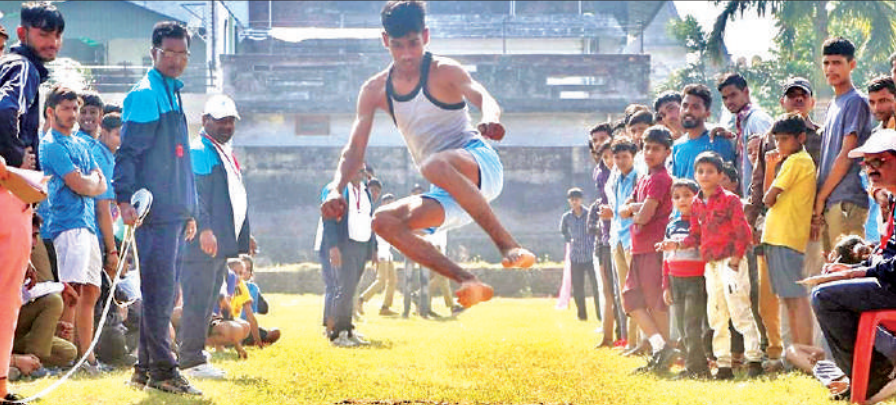
गोला में लंबी कूद लगाता प्रतिभागी।