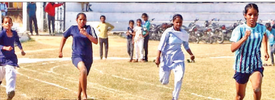
गोला में 400 मीटर की दौड़ में प्रतिभाग करती बालिकाएं।