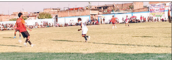
खेल मैदान पर गोल करने के लिए भिड़ती टीमें।