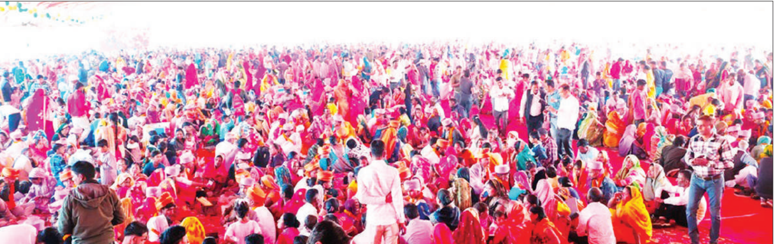
इमंड राजकीय इंटर कॉलेज मैदान में सामूहिक विवाह समारोह के दौरान रस्मे अदा करते वर-वधु और साथ में बैठे उनके परिजन।

मुख्यमंत्री सामूहिक विवाह योजना के तहत बुधवार को शहर के इमंड राजकीय इंटर कॉलेज परिसर में सामूहिक विवाह समारोह का आयोजन किया गया। सामूहिक विवाह के प्रथम चरण में बरखेड़ा विधानसभा के अंतर्गत ब्लाक बरखेड़ा, मरौरी, नगर पंचायत बरखेड़ा एवं नगर पंचायत न्यूरिया हुसैनपुर क्षेत्र के जोड़ों के विवाह के लिए भव्य पंडाल बनाया गया। मुस्लिम समुदाय के निकाह संपन्न कराने के लिए पास में ही एक अन्य पंडाल की व्यवस्था की गई। बुधवार सुबह से ही वर-वधु पक्ष के लोगों के सिलसिला शुरू हो गया। सामूहिक विवाह समारोह में व्यवस्थाएं छिन्न-भिन्न न हो, पंडाल को सेक्टर में बांटा गया। बरखेड़ा विधायक स्वामी प्रवक्तानंद