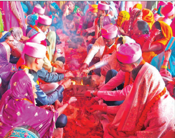
विवाह की रस्में अदा करते वर-वधू।