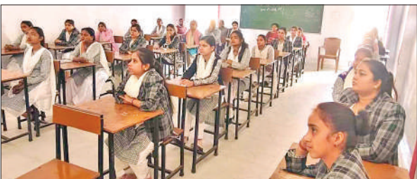
कार्यक्रम में मौजूद विद्यार्थी।