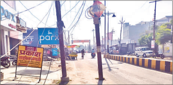
डॉन बॉस्को नहर पुलिया के पास आधी सड़क पर लगा बिजली का खंभा। ● अमृत विचार

शहर का प्रमुख मार्ग होने के कारण वाहनों का काफी दबाव रहता है। सौजन्या चौराहा से राजापुर चौराहा तक कई नर्सिंग होम, पैथोलॉजी और डॉन बॉस्को स्कूल है। निजी नर्सिंग