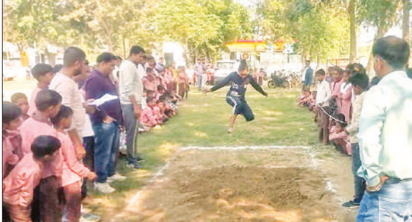
ऊंची कूद में प्रतिभाग करती छात्रा।