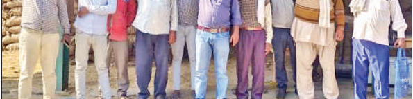
बीसलपुर में विरोध प्रदर्शन करते किसान।