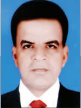
कैतिलाल मांडोब खतब लेखक

भारत की भागीदारी से जिस बांग्लादेश को अलग देश बनाया गया। वहीं आज हिन्दू अल्पसंख्यक हिंसा के शिकार हो रहे हैं। भारत के राजनयिक संबंधों की दरकिनार कर शेख हसीना का तख्तापलट करने वाले कट्टरपंथी समाज वहां अल्पसंख्यक हिन्दुओं के साथ सौतेला व्यवहार कर रहे हैं। बांग्लादेश दक्षिण एशिया में एक मुस्लिम बहुल राष्ट्र है, जहां लगभग प्रतिशत से अधिक आबादी हिन्दू अल्पसंख्यक है। जम्मा-ए-इस्लामी जैसे इस्लामवादी एवं धर्मनिरपेक्ष राजनीति में सक्रिय समूह देश की राजनीतिक सामाजिक तस्वीर को जटिल बना देते हैं। इसके अतिरिक्त, राजनीतिक दलों और सरकार के बीच सत्ता-संघर्ष के कारण यही जनसंघर्ष अक्सर सामाजिक तथा धार्मिक अल्पसंख्यकों को प्रभावित करता रहा है। वर्तमान में बांग्लादेश में समानुपातिक प्रतिनिधित्व प्रणाली की अवधारणा उस बदलाव के संदर्भ में उठ रही है, जिसे छात्र आंदोलन,