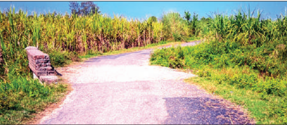
नहर पर बनी पुलिया की टूटी रेलिंग।