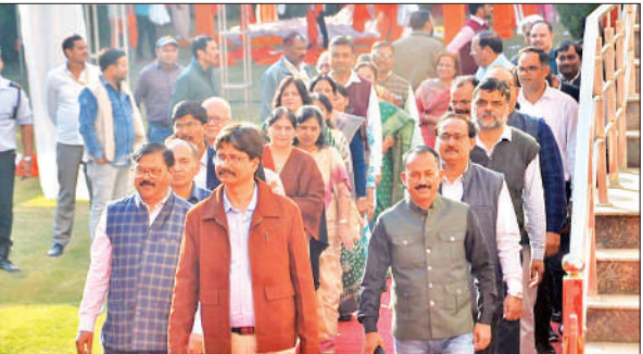
दीक्षांत समारोह का पूर्वाय्यास करते कर्मचारी।

समारोह से एक दिन पहले बुधवार को तैयारियों को अंतिम रूप दिया गया। अधिकारियों और शिक्षकों ने रिहर्सल किया। शोभायात्रा निकालने के साथ पदक भी वितरित करके देखा। राज्यपाल पहले एम बीए हाल का उद्घाटन करेंगी और अटल सभागार में शामिल होंगी। वह आंगनबाड़ी किट