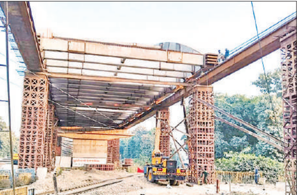
गोला में जंगल वाली क्रॉसिंग पर काम करते श्रमिक।