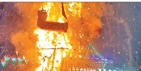
सिंगाही में जलता कुंभकरण का पुतला।