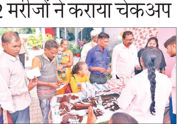
कैंप में जांव कराते स्वास्थ्य कर्मों।