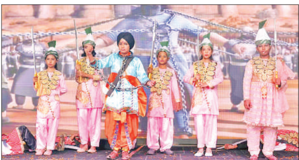
कार्यक्रम की प्रस्तुति देते बच्चे।

महाराष्ट्र की पारंपरिक मलखंब कला में छात्रों ने हवा में हैंगिंग और स्टैंडिंग पोज में योगिक एवं जिम्नास्टिक मुद्राओं का प्रदर्शन किया। ओडिशा के प्राचीन मार्शल आर्ट का प्रदर्शन किया गया। छात्रों ने सामूहिक योगाभ्यास के माध्यम से शारीरिक और मानसिक स्वास्थ्य के महत्व को बताया। छात्रों द्वारा प्रस्तुत नाट्य रूपांतरणों में योद्धाओं के जीवन और उनके शासनकाल को दर्शाया गया। स्वतंत्रता संग्राम