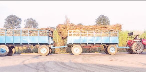
लखीमपुर-भीरा राजमार्ग पर पर डबल ट्रॉलियां जोड़कर गन्ना ले जाता ट्रैक्टर।

लखीमपुर-भीरा राजमार्ग मार्ग पर गुलरिया चीनी मिल पर गन्ना