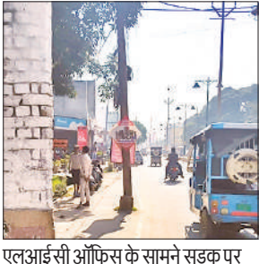
एलआईसी ऑफिस के सामने सड़क पर लगा बिजली का खंभा। ● अमृत विचार

यह स्टीमेट डीएम के माध्यम से शासन को भेजा गया था, लेकिन बजट स्वीकृत नहीं हो पाया। इससे खंभे नहीं हट सके। ठेकेदार ने बिना खंभे हटे ही सड़क के नए सिरे से चौड़ीकरण का कार्य पूरा करा दिया। इससे अब यह खंभे बीच सड़क पर आ गए हैं।