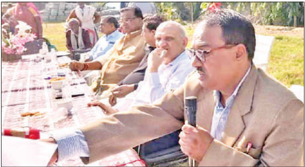
शिविर में मौजूद संस्थाध्यक्ष, अतिथि व अन्य।

शिविर में 273 लोगों ने पंजीकरण कराया। 70 साल से अधिक उम्र के 16 बुजुर्गों के आयुष्मान कार्ड बनाए गए और 50 जरूरतमंद वृद्धों को निःशुल्क गर्म कंबल वितरित किए गए। नेत्र विशेषज्ञ ने 168 से अधिक मरीजों की जांच कर उन्हें निःशुल्क चश्मे दिए। 39 मरीजों को मोतियाबिंद के ऑपरेशन के लिए बरेली के रुहेलखंड मेडिकल कॉलेज भेजा गया। दंत चिकित्सक ने 17 मरीजों