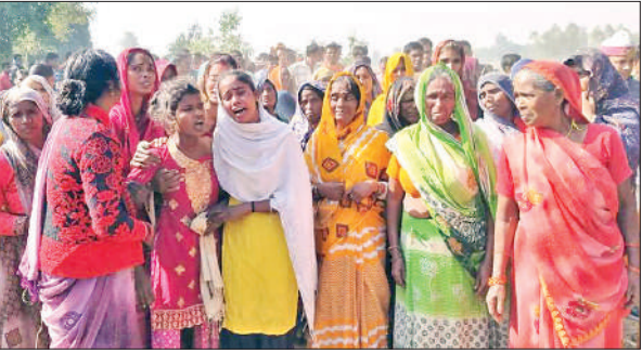
घटनास्थल पर मृतक की रोती बिलखती पुत्री को ढांडस बंधाती महिलाएं।