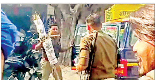
धीरेन्द्र शास्त्री का पुतला छीनकर कोतवाली ले जाते पुलिस कर्मी।