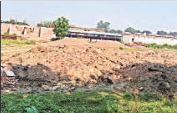
खेल मैदान पर निर्माण के लिए लगे मिट्टी के ढेर।

पांच दशक पहले रेलवे ग्राउंड तैयार किया गया था, इस ग्राउंड में हर साल रेलवे विभाग की ओर से हाकी का टूर्नामेंट कराया जाता