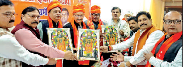
डीबीए अध्यक्ष व महामंत्री का स्वागत करते व्यापारी नेता ।