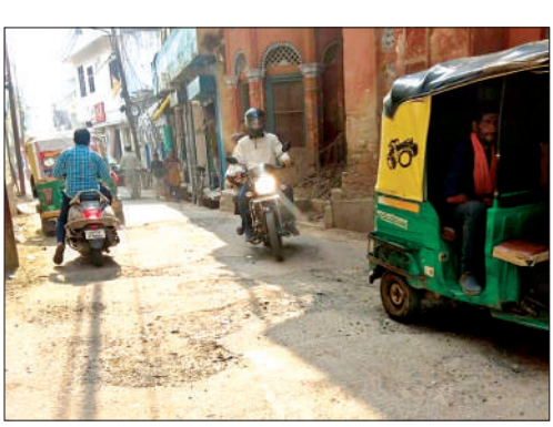
शहर के मुन्ना चौराहा पर फिर हुए गड्ढों से निकलते वाहन।