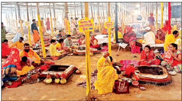
हवन कुंड में आहुतियां देते भक्तगण ।