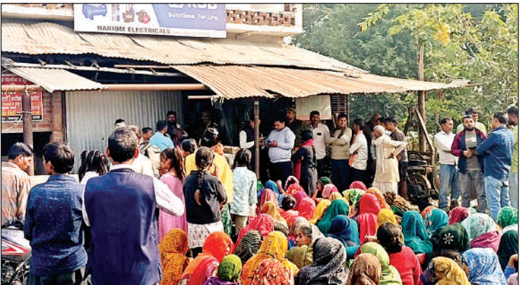
घटनास्थल पर मौजूद लोगों की भीड़।