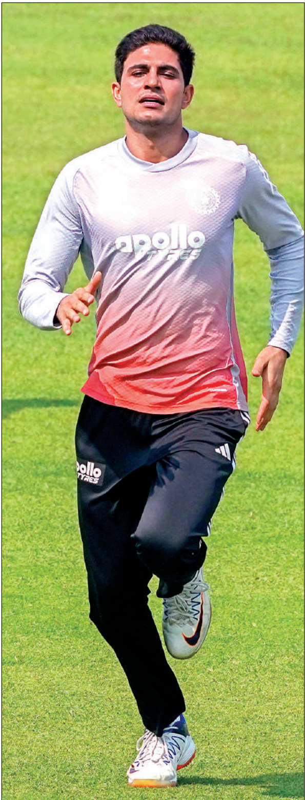
ईडन गार्डन्स में प्रशिक्षण सत्र के दौरान भारतीय कप्तान शुभमन गिल।

तूरिन (इटली)। गत चैंपियन यानिक सिनर ने धरलू दर्शकों के अपार समर्थन के बीच अलेक्जेंडर ज़रेव को 6-4, 6-3 से हराकर एटीपी फाइनल्स टेनिस टूर्नामेंट के सेमीफाइनल में जगह पक्की कर ली। सिनर ने इनडोर हार्ड कोर्ट पर अपनी जीत का सिलसिला 28 मैचों तक बढ़ा दिया है। यह सिलसिला दो साल पहले इस प्रतियोगिता के फाइनल में नोवाक जोकोविच से मिली हार के बाद शुरू हुआ था। यह सिनर की ज़रेव पर लगातार पांचवीं जीत है, जिसमें बरीश वर्ष का ऑस्ट्रेलियाई ओपन का फाइनल भी शामिल है। सिनर दो जीत के साथ ब्योन बोर्ग युग में शीर्ष पर पहुंच गए हैं, जबकि ज़रेव और फेलिक्स ऑगर अलियासिमे ने एक-एक जीत हासिल की है। बेन शेट्टन अभी तक एक भी मैच नहीं जीत पाए हैं। एक अन्य मुकाबले में आठवीं वरीयता प्राप्त ऑगर अलियासिमे ने शेट्टन को 4-6, 7-6 (7), 7-5 से हराकर प्रतियोगिता में अपनी पहली जीत दर्ज की।