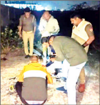
घटनास्थल की जांच करती पुलिस।

कस्बे के स्यावरी रोड पर नगर पालिका परिषद के कूड़ाघर के पास बुधवार की रात युवती के गंभीर रूप से जली हालत में मिलने के बाद सनसनी फैल गई। बताते हैं