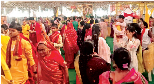
यज्ञ स्थल पर मौजूद लोगों की भारी भीड़ ।