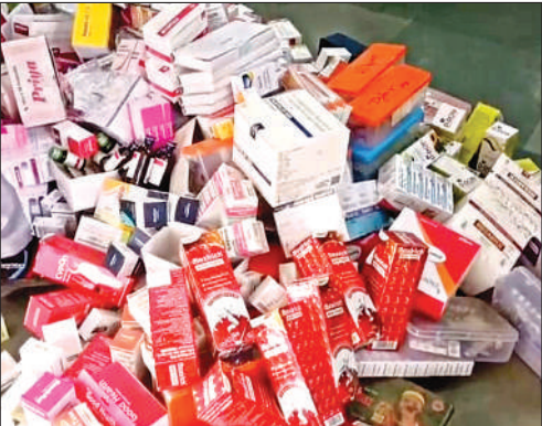
हास्पिटल में मिली दवाएं।

दवाओं का स्टॉक कर सकते हैं जो इमरजेंसी में उपयोग हो सकती है। इसके बाद भी बाहरी मरीजों को दवा की बिक्री कर रहे हैं। यह गलत है। निजी अस्पताल संचालकों को निर्देश दिये गये हैं कि दवा का स्टॉक करने से पहले लाइसेंस लेले। बिना लाइसेंस के मेडिकल स्टोर संचालित मिला तो संबंधित पर कार्रवाई की जायेगी।