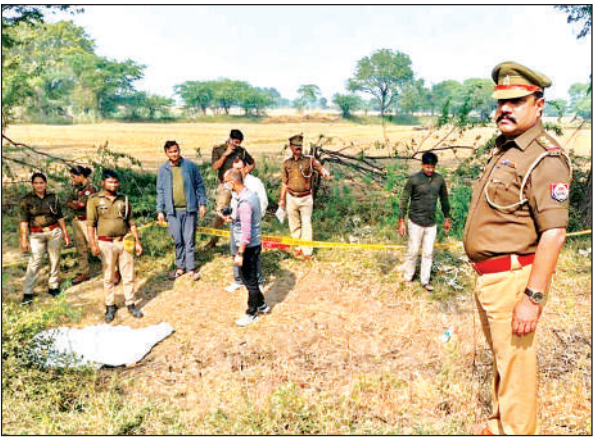
घटनास्थल पर जांच-पड़ताल करती मौदहा पुलिस।

अमृत विचार। कोतवाली क्षेत्र के चकदहा गांव के पास गुरुवार सुबह खेत पर अर्धनग्न हालत में खून से सना एक महिला का शव मिला, जिससे पूरे इलाके में हड़कंप मच गया। महिला का शव मिलने की सूचना पर पुलिस मौके पर पहुंची और प्रारंभिक जांच-पड़ताल की। पुलिस महिला से दुष्कर्म के बाद हत्या किए जाने की आशंका जता रही है। फिलहाल महिला की शिनाख्त नहीं हो सकी है।