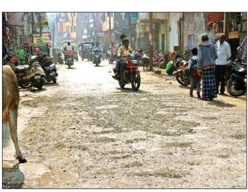
लाखन तिराहा से फूलमती जाने वाली बदहाल सड़क।