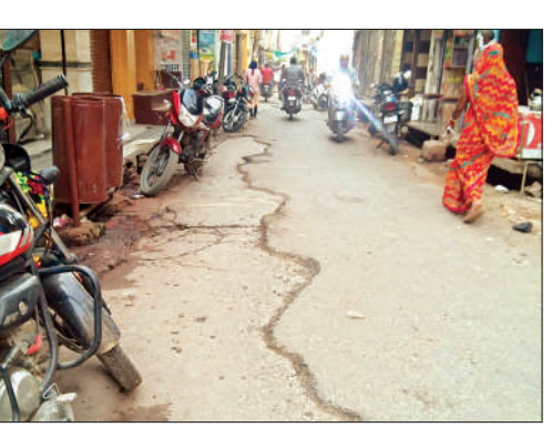
रामनारायण चौराहा से लाखन तिराहा की ओर जाने वाली सड़क का हाल।

नगर पालिका क्षेत्र की दो सड़कें क्रमशः रामनारायण चौराहा से तलैया चौकी तक और लाखन तिराहा से फूलमती देवी मंदिर तक कई साल से टूटी पड़ी थीं। लोगों के लिए सड़कें बनीं इन सड़कों के दिन गुत वर्ष दिवाली के बाद बहुरे और इनका निर्माण कराया गया।