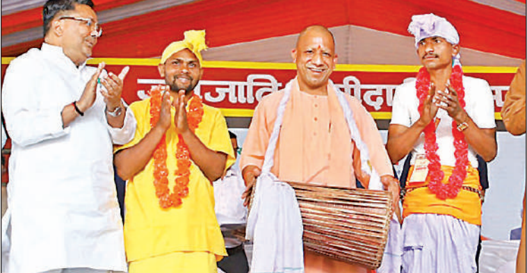
लखनऊ के इंदिरा गांधी प्रतिष्ठान में ढोल-नगाड़ों की थाप से जनजाति भागीदारी उत्सव की शुरुआत करते मुख्यमंत्री योगी आदित्यनाथ व इस मौके पर सांस्कृतिक कार्यक्रम प्रस्तुत करते विभिन्न राज्यों के कलाकार।

मुख्यमंत्री योगी ने इंदिरा गांधी प्रतिष्ठान में गुरुवार को ढोल-नगाड़ों की थाप से जनजाति भागीदारी