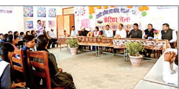
अभिनव इण्टर कॉलेज गंगधरापुर में आयोजित कार्यक्रम में मौजूद अतिथि व विद्यार्थी।