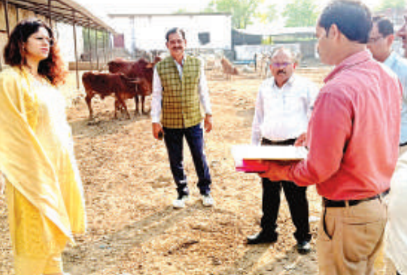
लाडपुर गौशाला का निरीक्षण करती डीएम गजल भारद्वाज।

निरीक्षण दौरान जिलाधिकारी ने पंजीयन रजिस्टर को व्यवस्थित करने तथा गोबर का व्यवसायिक उपयोग करने के लिए संबंधित अधिकारियों को निर्देशित किया। उन्होंने निराश्रित गोवंशों के लिए भूसा, पीने योग्य पानी, हरा चारा, साफ सफाई व्यवस्था सहित अन्य व्यवस्थाओं का जायजा लिया। जिलाधिकारी ने गोवंशों की नियमित