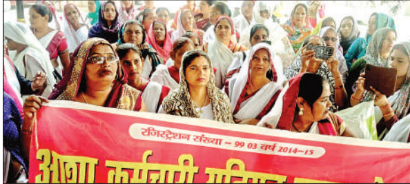
कचहरी में प्रदर्शन करती आशा व संगनी ।