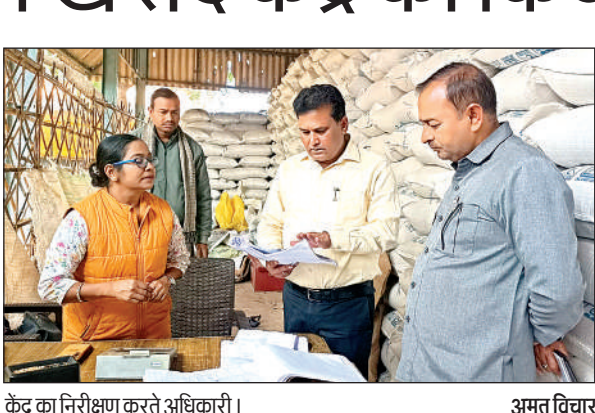
केंद्र का निरीक्षण करते अधिकारी ।

एसडीएम के अनुसार किसानों ने खरीद में गड़बड़ी का आरोप लगाया है, जिसके चलते व्यवस्था को पारदर्शी बनाने के लिए केन्द्र पर राजस्व कर्मी तैनात किया जाएगा। जिससे शासन की मंशा के अनुरूप सहकारी खरीद का लाभ किसानों को मिल सके। अगर खरीद में किसानों के शोषण की बात सामने आई तो जिम्मेदारों पर कड़ी कार्रवाई की जायेगी।