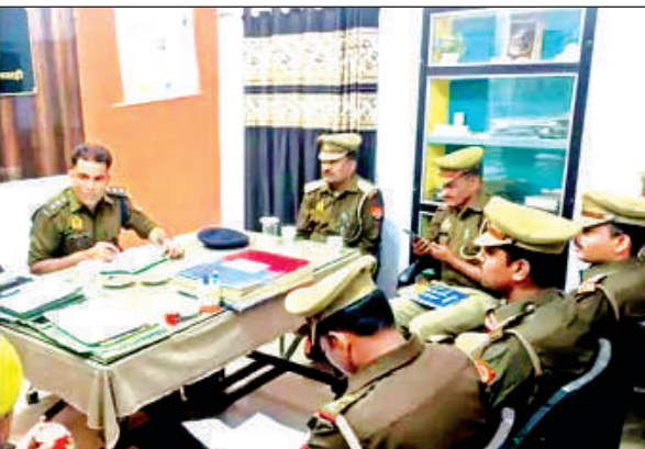
पनवाड़ी थाने का निरीक्षण करते कुलपहाड़ क्षेत्राधिकारी।

क्षेत्राधिकारी कुलपहाड़ ने निरीक्षण दौरान थाना कार्यालय के अभिलेखों, बैरक, मैस, मालखाना, महिला हेल्प डेस्क, साइबर हेल्प डेस्क और कंप्यूटर कक्ष का सूक्ष्म अवलोकन किया। उन्होंने थाना परिसर की साफ सफाई के अलावा लंबित मामलों की स्थिति की भी समीक्षा की। क्षेत्राधिकारी ने संबंधित अधिकारियों को महिला अपराधों के प्रति विशेष संवेदनशीलता बरतने, प्राप्त शिकायतों पर त्वरित और