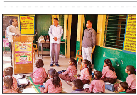
बच्चों से बात करते खंड शिक्षा अधिकारी व साथ में अन्य शिक्षक।