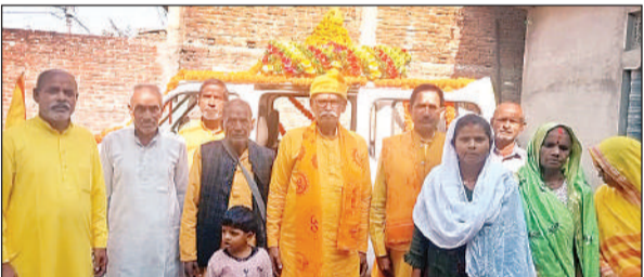
शक्ति कलश यात्रा के साथ गायत्री परिवार के लोग ।

यात्रा गैसड़ी में होने वाले राष्ट्र संवर्धन यज्ञ व नव दाम्पत्य सम्मेलन, तथा बलरामपुर शक्तिपीठ पर देव संस्कृति विश्वविद्यालय के कुलपति डॉ.