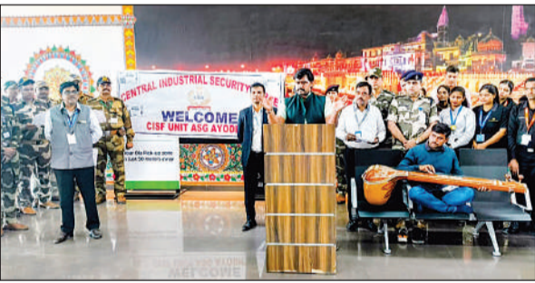
सामूहिक रूप से राष्ट्रीय गीत गाते हुए अधिकारी व कर्मचारी।