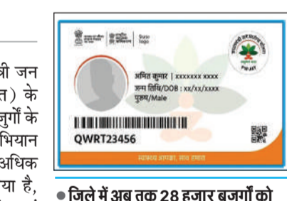
● जिले में अब तक 28 हजार बुजुर्गों को मिला लाभ