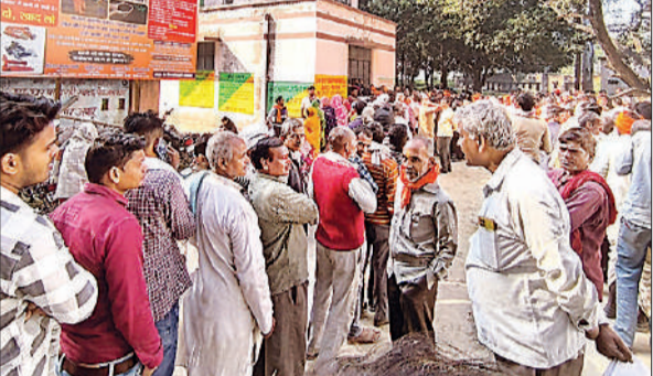
बीज वितरण केन्द्र पर उमड़ी किसानों की भीड़