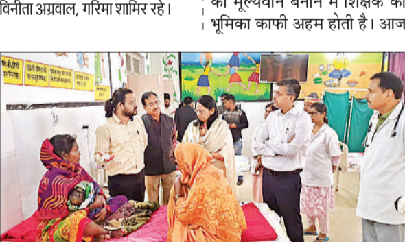
एनआरसी का डीएम संग निरीक्षण करती संयुक्त सचिव।