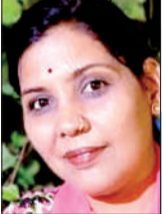
संध्याच राजपुरोहित लेखिका, मध्य प्रदेश

भारत की जनसंख्या में लगभग साढ़े आठ प्रतिशत हिस्सा आदिवासी समुदायों का है। यह समुदाय प्रकृति के सबसे करीब है,