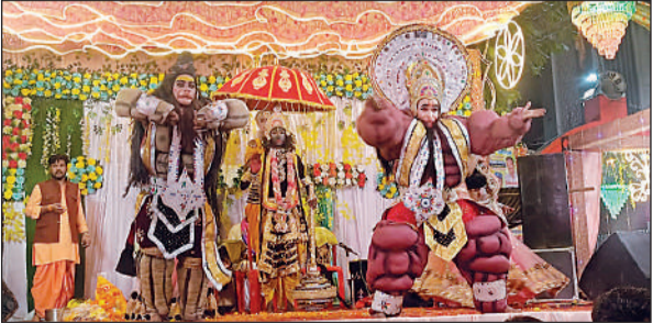
श्री बटुक भैरव बाबा का सजा दरबार व कार्यक्रम में प्रस्तुति देने कलाकार