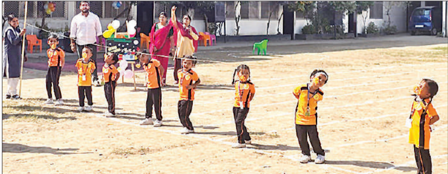
जलेबी रेस प्रतियोगिता में भाग लेते बच्चे।

और स्वस्थ प्रतिस्पर्धा की भावना को प्रोत्साहित करना है।