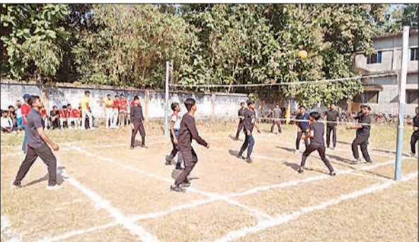
वॉलीबॉल प्रतियोगिता में भाग लेते छात्र।

उन्होंने कहा कि बच्चों की पहली पाठशाला परिवार से शुरू होती है जबकि शिक्षक उनको अध्यापन कार्य कर शिक्षा के माध्यम से तरासते हैं। छात्र-छात्राओं के जीवन को मूल्यवान बनाने में शिक्षक की भूमिका काफी अहम होती है। आज