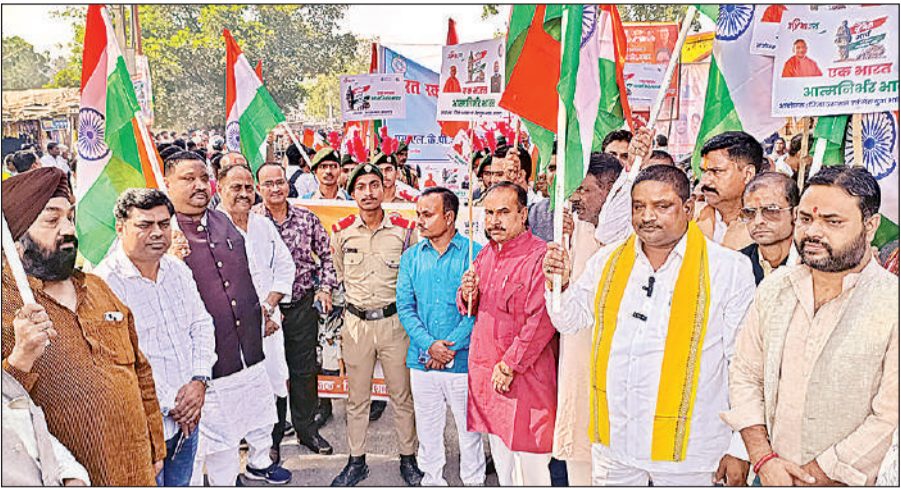
एकता पदयात्रा में शामिल भाजपा पदाधिकारी व कार्यकर्ता ।