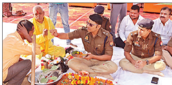
परियोजना की शुरुआत पर पूजन करते पुलिस अधीक्षक। अमृत विचार

उन्होंने बताया कि आवास निर्माण परियोजना के पूर्ण हो जाने से अपर पुलिस अधीक्षक एवं क्षेत्राधिकारी को पुलिस लाइन के निकट उच्च गुणवत्ता वाले आवासीय सुविधाएं प्राप्त होगी। इससे अधिकारियों को अपने दैनिक कार्यों, आकस्मिक घटनाओं एवं आपात