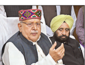
लखनऊ में पत्रकारों को जानकारी देते कृषि मंत्री सूर्य प्रताप शाही।

कृषि मंत्री सूर्य प्रताप शाही ने गुरुवार को लखनऊ के कृषि भवन सभागार में विकसित उत्तर प्रदेश 2047 पर आयोजित प्रेसवार्ता में कहा कि कृषि विभाग ने एक ठोस कार्ययोजना तैयार की है, जिसका उद्देश्य किसानों की आय बढ़ाकर उत्तर प्रदेश को आत्मनिर्भर, समृद्ध और टिकाऊ कृषि अर्थव्यवस्था के रूप में स्थापित करना है।