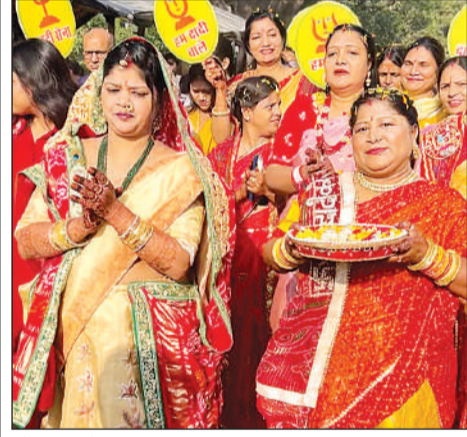
शोभायात्रा में शामिल श्रद्धालु।