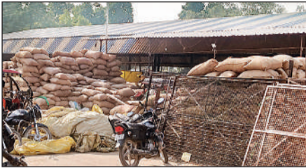
मंडी स्थित एक आढ़ती के यहां ढंप धान।