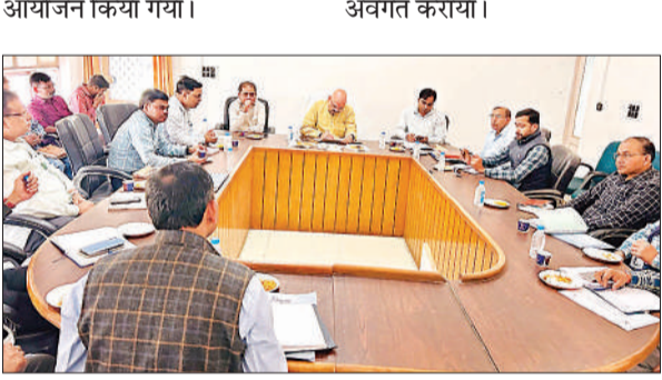
सिंचाई बंधु की बैठक में मौजूद अधिकारी व अन्य।