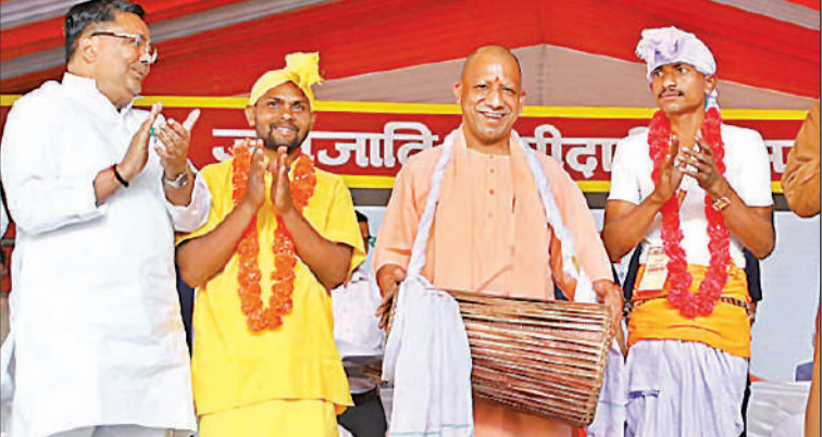
लखनऊ के इंदिरा गांधी प्रतिष्ठान में ढोल-नगाड़ों की थाप से जनजाति भागीदारी उत्सव की शुरुआत करते मुख्यमंत्री योगी आदित्यनाथ व इस मौके पर सांस्कृतिक कार्यक्रम प्रस्तुत करते विभिन्न राज्यों के कलाकार।

उत्सव की शुरुआत की। उन्होंने यहां लगी प्रदर्शनी का अवलोकन किया और बिरसा मुंडा की प्रतिमा