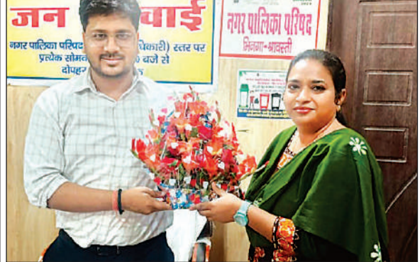
पालिका अध्यक्ष की जिम्मेदारी पाने वाले एसडीएम भिनगा का स्वागत करती ईओ।