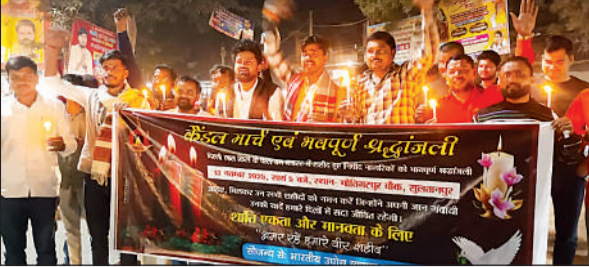
मोतिगरपुर में कैंडल मार्च निकालते लोग।

अमृत विचार: धान खरीद के लिए महकमे द्वारा 92 क्रय केंद्र बनाए गए हैं। क्रय केंद्रों पर प्रभारियों की तैनाती के साथ धान खरीद के उपकरण उपलब्ध कराए गए हैं। सरकार द्वारा समर्थन मूल्य 2,369 रुपये प्रति क्विंटल रुपए निर्धारित किया गया है। धान खरीद के बाद किसानों को उनके खाते में पैसा ट्रांसफर किया जाता है। सारी सुविधाएं उपलब्ध होने के बाद भी किसान सरकारी क्रय केंद्रों से दूरी बना रहे हैं। जिला मुख्यालय स्थित अमहट मंडी में विपणन शाखा के चार क्रय केंद्र, मंडी परिषद का एक क्रय केंद्र, एफसीआई का एक तो पीसीयू का एक क्रय केंद्र बनाए गए हैं। सातों क्रय केंद्रों पर खरीद शुरू होने के 13 दिन बाद भी दो सौ से ढाई सौ क्विंटल धान की खरीद हुई है। वहीं, अगर ग्रामीण क्षेत्रों के आढ़तियों की बात करें तो वह अभी तक इससे