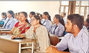
अवध विवि में जेंडर सेंसटाइजेशन पर आयोजित व्याख्यान में मौजूद छात्र-छात्राएं व अन्य ।