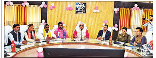
कलेक्ट्रेट सभागार में समीक्षा बैठक के दौरान मौजूद प्रभारी मंत्री व अन्य अधिकारी ।