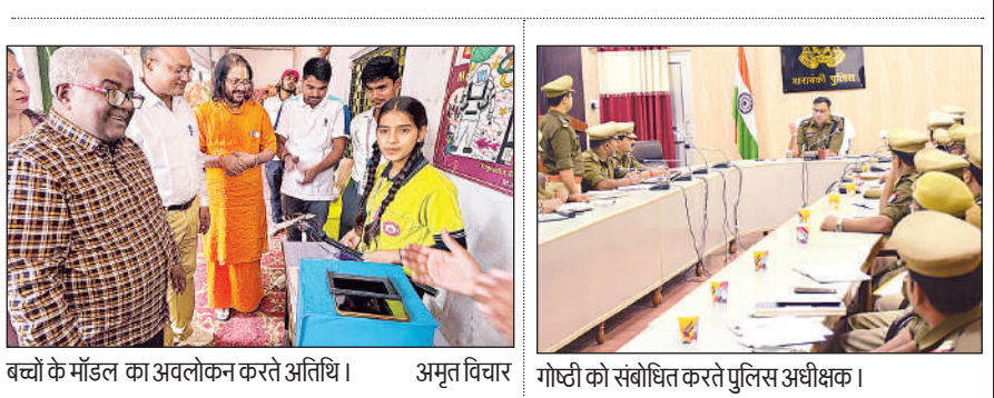
बच्चों के मॉडल का अवलोकन करते अतिथि।