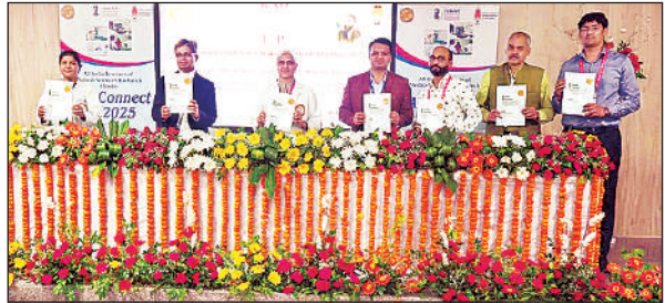
एम्स के रेडियोडायग्नोसिस विभाग में आयोजित क्षेत्रीय सम्मेलन में मौजूद लोग।