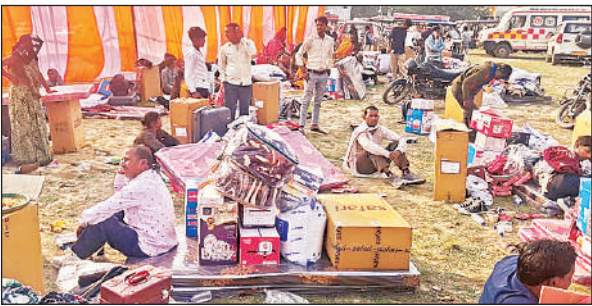
मुख्यमंत्री का उपहार समान लेकर बैठे लोग।