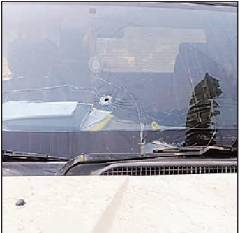
फायरिंग का शिकार अप्टा नरसंहार के गवाह का अमृत विचार