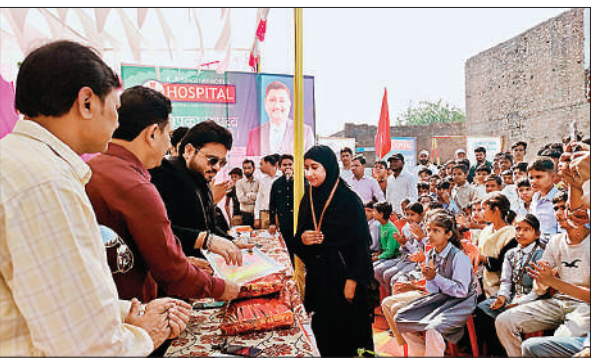
अतिथि को सम्मानित करते प्रबंधक ।