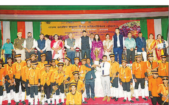
प्रतियोगिता के समापन समारोह में मौजूद अतिथि, छात्र-छात्राएं व अधिकारी।