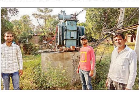
जर्जर हालात में ट्रांसफार्मर और मौजूद लोग ।