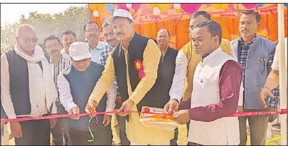
फीता काटकर प्रतियोगिता की शुरुआत कराते मुख्य अतिथि।