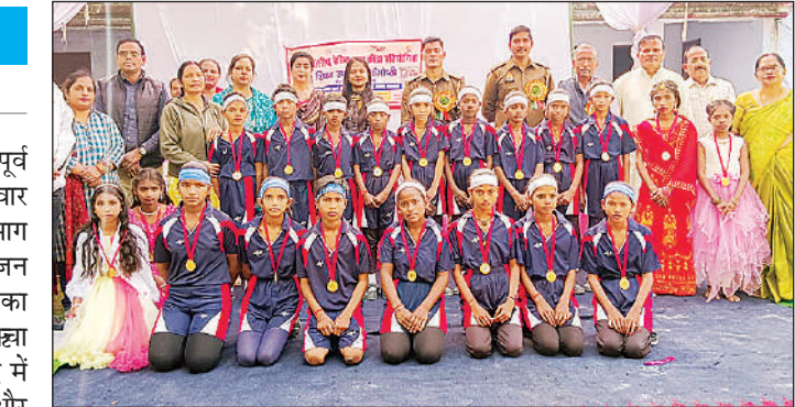
खेलकूद प्रतियोगिता में प्रतिभाग करते बच्चे।