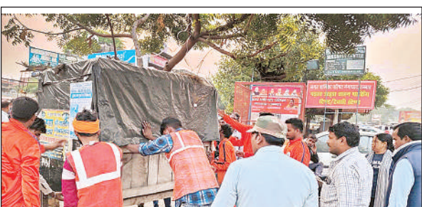
टेंपो स्टैंड से अस्थायी अतिक्रमण हटाते पालिका कर्मी।