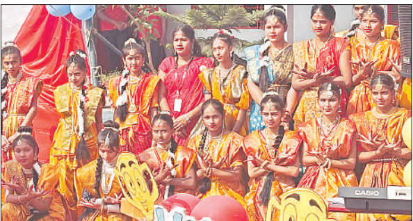
सांस्कृतिक कार्यक्रम प्रस्तुत करती छात्राएं।