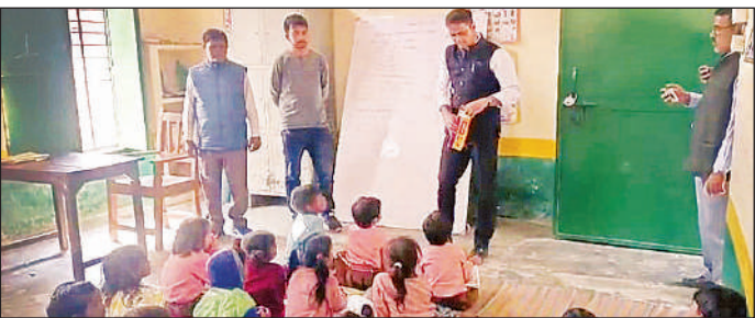
बच्चों से शिक्षा व्यवस्था पर जानकारी लेते अधिकारीगण।

अमृत विचार: मुख्यमंत्री सामूहिक विवाह योजना में तहसील के पंजीकृत 350 जोड़ों में 318 जोड़े विवाह बंधन में बंध गए। जिंदगी भर साथ रहने की कसम खाई। विवाह पंडाल घंटे घड़ियाल, शंख ध्वनि और शहनाई से गूंज उठा। एक तरफ वैदिक मंत्रोच्चार के साथ अग्नि के सात फेरे तो वहीं दूसरी तरफ चार जोड़ों ने निकाह कुबूल है की आवाजें आयीं। एक ही पंडाल के नीचे गंगा-जमुनी तहजीब की मिशाल पेश की गई। शांति कुंज हरिद्वार के पुरोहितों ने वैदिक मंत्रों का उच्चारण किया गया। मौलवियों ने मुस्लिम रीति-रिवाज से निकाह पढ़ाया गया। मिनी स्टेडियम में आयोजित कार्यक्रम में