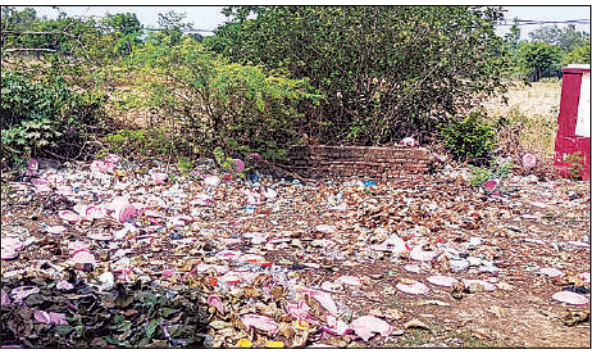
काली माई मंदिर के बगल में लगा कचरे का अंबार।

अमृत विचार: विकासखंड संग्रामपुर क्षेत्र के प्रसिद्ध काली माई मंदिर परिसर और उसके आसपास इन दिनों कचरे का अंबार लगा हुआ है। मंदिर के पास झूठी पत्तलें, प्लास्टिक व अन्य कचरा फैला हुआ है। क्षेत्र में कालिकन धाम, काली माई मंदिर, गंगापुर का शिवाला, सहजीपुर का शिव मंदिर, शंकरपुर का शंकरगढ़ चौराहा, पतापुर का बजरंगबली मंदिर सहित दर्जनों धार्मिक स्थल हैं जहां प्रतिदिन बड़ी संख्या में श्रद्धालु आते हैं। इसके बावजूद पंचायती राज विभाग की सफाई व्यवस्था लचर दिखाई दे रही है। स्थानीय श्रद्धालुओं का कहना