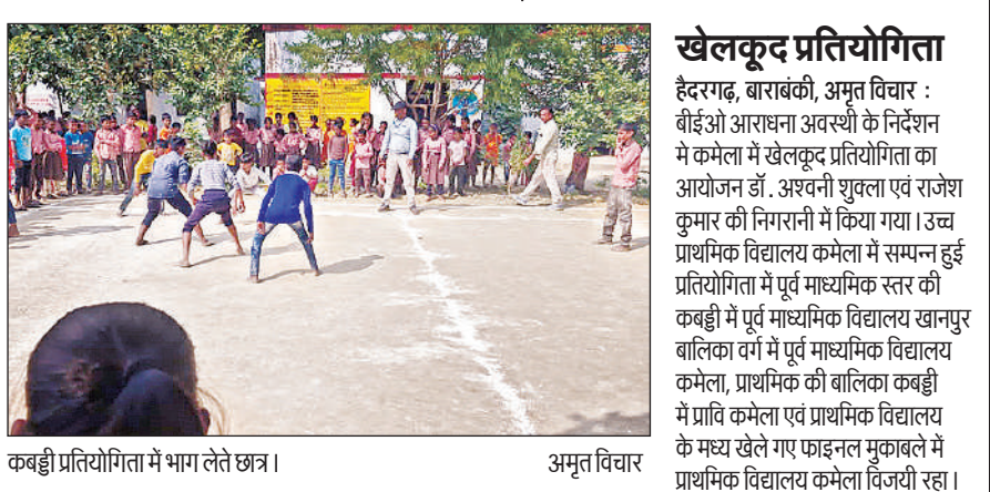
कबड्डी प्रतियोगिता में भाग लेते छात्र।