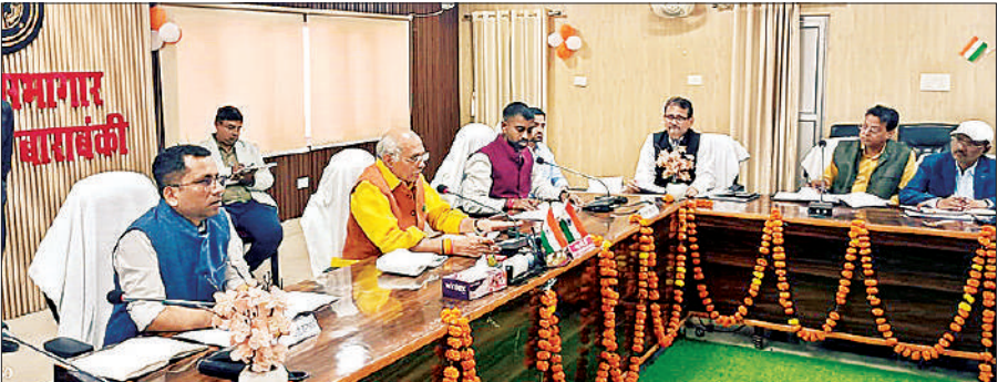
अधिकारियों के साथ बैठक करते मंत्री