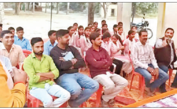
कार्यक्रम के दौरान उपस्थित शिक्षक और छात्र-छात्राएं ।