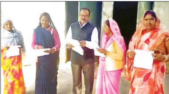
लोगों को फार्म वितरित करते बीएलओ।

संग्रामपुर अमेठी, अमृत विचार : विकासखंड संग्रामपुर क्षेत्र के ग्राम सभा पुनूपुर में लाखों रुपये की लागत से बन रहा एएनएम सेंटर अब तक अधूरा पड़ा हुआ है। भवन की नींव डाले जाने के बाद लंबे समय बीत चुके हैं, लेकिन लापरवाही और अधूरे बजट के कारण निर्माण कार्य आज तक पूरा नहीं हो सका। स्थानीय ग्रामीणों के अनुसार, प्रत्येक बुधवार और शनिवार को टीकाकरण कार्यक्रम आयोजित किया जाता है, परंतु भवन तैयार न होने के कारण एएनएम कभी नहरी पटरी पर बैठकर तो कभी घर-घर जाकर टीकाकरण करने को मजबूर हैं। इससे न केवल स्वास्थ्यकर्मियों को कठिनाई होती है, बल्कि ग्रामीणों को स्वास्थ्य सेवाओं का पूरा लाभ नहीं मिल पाता। ग्रामीणों का कहना है कि स्वास्थ्य विभाग द्वारा भवन की आधारशिला रखी गई और फोटो जारी कर दी गई, लेकिन जमीनी स्तर पर अब तक आधा-अधूरा निर्माण ही दिखाई दे रहा है। इस संबंध में अमेठी के मुख्य चिकित्साधिकारी (सीएमओ) ने बताया कि “भवन निर्माण के लिए जो बजट स्वीकृत हुआ था, उसका केवल 50 प्रतिशत धनराशि ही प्राप्त हुई है, जिसके चलते कार्य अभी पूरा नहीं हो सका है।”