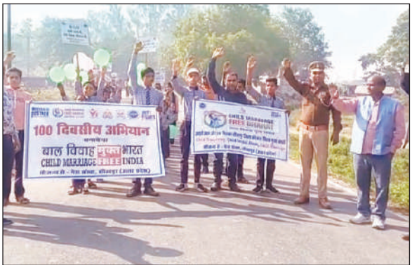
जागरूकता रैली निकालते लोग ।