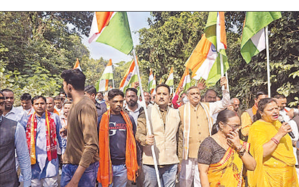
पदयात्रा में शामिल भाजपा कार्यकर्ता।

बायोफिल पुवाल फैक्ट्री में लगी आग रामनगर, बाराबंकी, अमृत विचार : रानी बाजार चौराहे के निकट दलसराय स्थित बायोफिल पुवॉल फैक्ट्री में अज्ञात कारणों से आग लग गयी। जिससे केंद्र पर एकत्रित पुवाल के ढेर जलने लगे। देखते ही देखते आग ने विकराल रूप धारण कर लिया। घटना की सूचना पर पहुंची फायर ब्रिगेड की टीम ने कड़ी मशरकत कर आग पर काबू पाया। लेकिन लपटें तेज होने के चलते उनकी पुवाल जलकर राख हो गया। दमकलकर्मियों ने बताया कि पुवाल में गैस बनने के चलते आग लगी है।