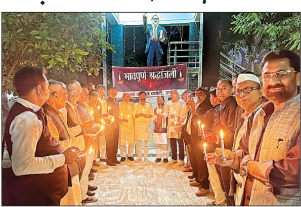
कैडल जलाकर मृतकों की आत्मा की शांति के लिए प्रार्थना करते कांग्रेसी। अमृत विचार

रात्रि में सक्रिय होते हैं इसलिए फाइलेरिया परजीवी की जांच के लिये नाइट ब्लड सर्वे अभियान जिले के 6 ब्लॉकों में हसनगंज, बांगरमऊ, बिछिया, अचलगंज फतेहपुर चौरासी व औरास में 16 से 26 नवंबर तक चलाया जाएगा। रात 10 बजे से 20 वर्ष व इससे अधिक आयु के लोगों की रक्त पट्टिकाएं बनाई जायेंगी।