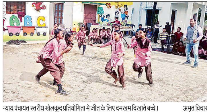
न्याय पंचायत स्तरीय खेलकूद प्रतियोगिता में जीत के लिए दमखम दिखाते बच्चे।