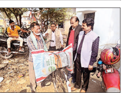
किसान को सलाह देते जिला कृषि अधिकारी ।

नेरी, सीतापुर, अमृत विचार : महोली तहसील क्षेत्र के पकाड़िया पांडे गांव में बिजली विभाग के जिम्मेदारों की लापरवाही लोगों की जान के लिए खतरा बनती जा रही है । पंचायत भवन के पास खुले में रखा गया ट्रांसफार्मर बिना सुरक्षा घेरे के पड़ा है, जिससे हर वक्त हादसे की आशंका बनी रहती है । ऐसे में ग्रामीणों ने बताया कि खुले ट्रांसफार्मर की चोट में आकर अब तक कई मवेशी झुलस चुके हैं । बावजूद इसके विभाग के जिम्मेदार अधिकारी कोई कार्रवाई नहीं कर रहे । ग्रामीणों का कहना है कि उन्होंने कई बार इसकी शिकायत भी की, लेकिन सुनवाई नहीं हुई । आरोप है कि विभाग की उदासीनता के कारण लोगों की सुरक्षा खतरे में है । ट्रांसफार्मर के आसपास अवसर मवेशी चरने आते हैं, जिससे कभी भी हादसा हो सकता है ।