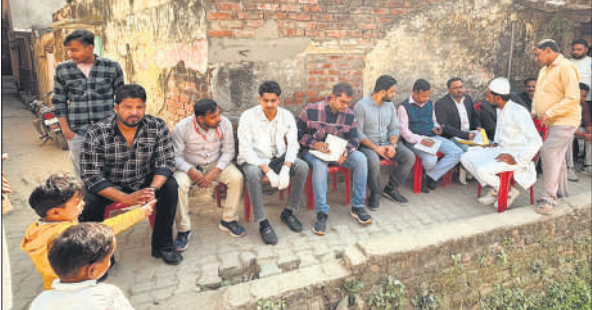
लोगों से वार्तालाप करते चिकित्सक।