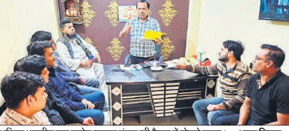
अखिल भारतीय युवा उद्योग व्यापार मंडल की बैठक में बोलेते वक्ता। ● अमृत विचार