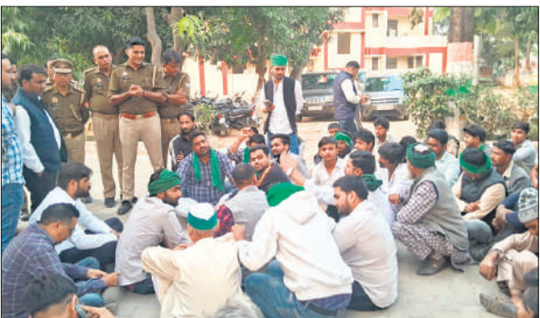
थाने का घेराव करते किसान यूनियन के लोग।

कुंदरकी थाना क्षेत्र में बढ़ते अवैध खनन के विरोध में भारतीय किसान यूनियन टिकैत के कार्यकर्ताओं और पदाधिकारियों ने गुरुवार को थाना परिसर में थाने का घेराव कर जोरदार प्रदर्शन किया। पुलिस ने किसानों को मनाने की कोशिश की। प्रदर्शनकारियों ने पुलिस प्रशासन के खिलाफ जमकर नारेबाजी की और थाने का घेराव कर पुलिस की कार्यप्रणाली पर सवाल उठाए। आरोप है कि क्षेत्र में अवैध खनन धड़ल्ले से जारी है, लेकिन पुलिस