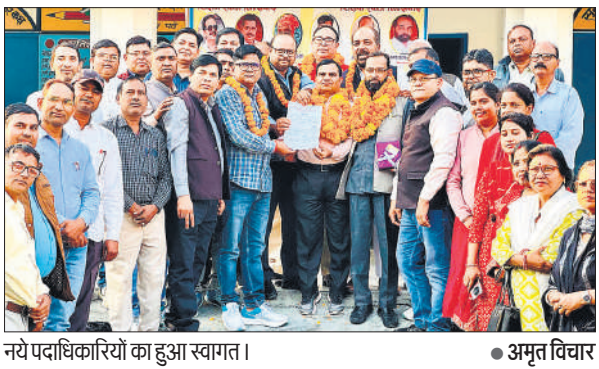
नये पदाधिकारियों का हुआ स्वागत।