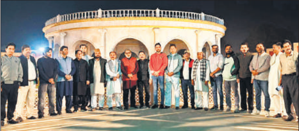
गांधी समाधि पर दो मिनट का मौन धारण कर करते कांग्रेसी।

जिला अस्पताल में चिकित्सकों की कमी है जिसके कारण मरीजों को काफी परेशानी का सामना करना पड़ता है। न्यूरो सर्जन नहीं होने पर दिमागी चोट लगने पर मरीज का सीटी स्कैन कराने के बाद बरेली, मुरादाबाद या मेरठ के लिए रेफर कर दिया जाता है। जिसके कारण गरीब मरीज और उसके तीमारदारों को आर्थिक परेशानी का सामना करना पड़ता है। इसके अलावा त्वचा और सर्जन की भी तैनाती नहीं है। मुख्य चिकित्साधीक्षक ने बताया कि चिकित्सकों की कमी पूरी करने के लिए कई बार पत्र लिखा जा चुका है।