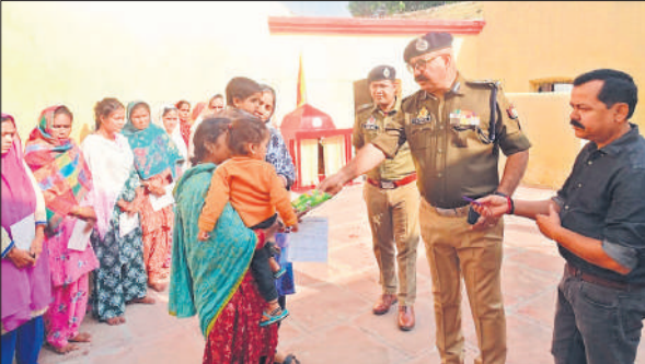
महिला बंदियों से वार्तालाप करते अधिकारी।