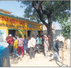
खाद मिलने की प्रतिक्षा में खड़े किसान।

रबी की फसलों की बोआई हो रही है लेकिन, एनपीके नहीं होने से किसानों को दिक्कत हो रही है। रबी की मुख्य फसल गेहूं होती है इसके अलावा मसूर, सरसों और पशुओं के लिए चारे की बोआई की जाती है। खाद नहीं होने के कारण रबी की फसलों की बोआई प्रभावित हो रही है। रबी की फसलों के लिए एनपीके की जरूरत रहती है क्योंकि इस खाद में नाइट्रोजन, फास्फोरस और पोटेशियम शामिल रहते हैं। यह एक रासायनिक खाद है जिसमें तीन मुख्य पोषक तत्व होते हैं जो पौधों के विकास के