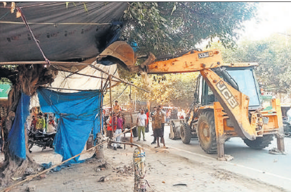
फरीदपुर में अतिक्रमण हटाओ अभियान में फड़ को हटाती जेसीबी । ● अमृत विचार

अंजाम दिया है। जबकि उसी मार्ग पर नाली पर स्लैब डालकर उस पर तख्त पर सामान बेचने वालों को टीम ने छुआ तक नहीं। सड़क पर ठेला व फड़ लगाने वालों की वजह से यातायात अवरूद्ध होता है। सरकारी जमीन को अपनी समझकर उस स्लैब डालकर सामान रखने वाले और तख्त डालकर सामान बेचने वाले भी यातायात को अवरूद्ध करने में सहायक हैं लेकिन नगर पालिका प्रशासन ने गुरुवार को केवल फड़ और ठेले वालों को ही निशाना बनाया। उनका सामान