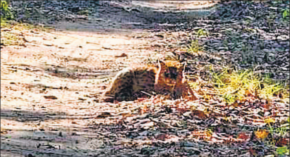
पीटीआर के जंगल में कच्चे रास्ते में बैठी फिशिंग कैट ।