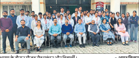
भ्रमण के दौरान मौजूद लैब प्रबंधन और विद्यार्थी।

छात्रों ने फॉरेंसिक साइंस लैब की बायोलॉजी, सेरोलॉजी, केमिस्ट्री, क्वेश्चन्ड डॉक्यूमेंट व डीएनए फिंगरप्रिंट डिवीजन का निरीक्षण किया। विशेषज्ञ अधिकारियों ने छात्रों को प्रत्येक विभाग में उपयोग होने