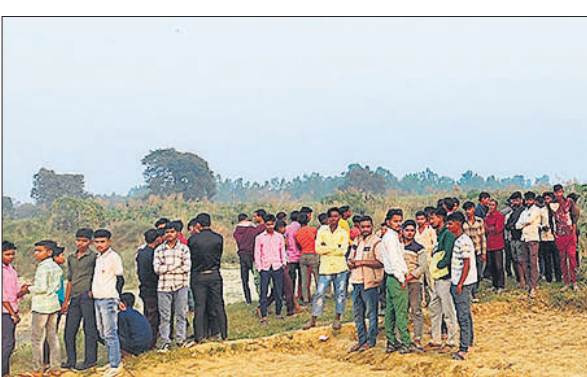
बहगुल नदी के किनारे एकत्र ग्रामीणों की भीड़ ।