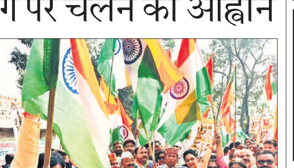
नवाबगंज में निकली पदयात्रा में शामिल लोग ।