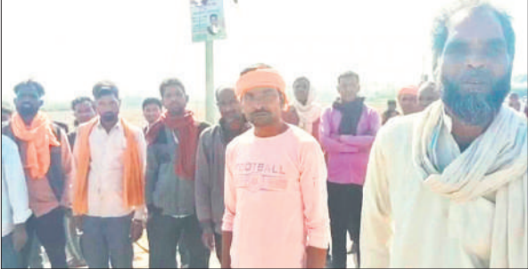
भारत-नेपाल सीमा पर घटना की जानकारी देते पीड़ित लोग।

भारत-नेपाल सीमा पर दोनों देशों के नागरिकों को आने-जाने की खुली छूट है। प्रतिदिन हजारों की संख्या में नेपाली सीमावर्ती बाजारों में रोजमर्रा की वस्तुएं खरीदते आते-जाते हैं। वहीं