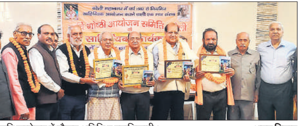
कवि सम्मेलन में मौजूद अतिथि व पदाधिकारी।