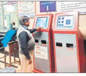
इज्जतनगर स्टेशन पर लगी एटीवीएम।

इज्जतनगर में नहीं लगाना पड़ेगा। यात्रियों को स्मार्ट कार्ड से भुगतान पर 150 किमी की दूरी तक के किराये पर 3 प्रतिशत का बोनस भी दिया जाता है। स्मार्ट कार्ड प्राप्त करने के लिए यात्रियों को स्टेशनों पर टिकट बुकिंग कार्यालय से संपर्क करना होगा।