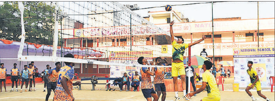
वालीबॉल मैच में भिड़ते दिल्ली और तमिलनाडु की टीमों के खिलाड़ी।