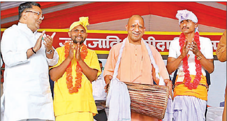
लखनऊ के इंदिरा गांधी प्रतिष्ठान में ढोल-नगाड़ों की थाप से जनजाति भागीदारी उत्सव की शुरुआत करते मुख्यमंत्री योगी आदित्यनाथ व इस मौके पर सांस्कृतिक कार्यक्रम प्रस्तुत करते विभिन्न राज्यों के कलाकार।

मुख्यमंत्री योगी ने इंदिरा गांधी प्रतिष्ठान में गुरुवार को ढोल-नगाड़ों की थाप से जनजाति भागीदारी