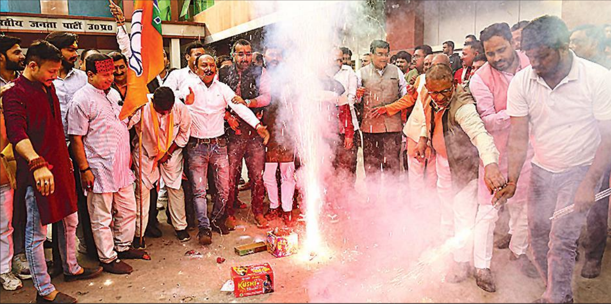
बिहार में राष्ट्रीय जनतांत्रिक गठबंधन ( राजग ) की प्रचंड जीत के उपलक्ष्य में भाजपा के यूपी मुख्यालय में शुक्रवार दोपहर जमकर जश्न मनाया गया । पार्टी कार्यालय परिसर ढोल -नगाड़ों की धाप, आतिशबाजी और विजय नारों से गूंज उठा । उत्साह से भरे कार्यकर्ताओं ने नृत्य कर खुशी का इजहार किया ।