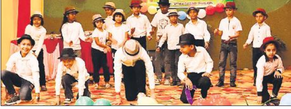
बाल दिवस पर रेलवे ऑफिसर्स क्लब में आयोजित रंगारंग कार्यक्रम में प्रस्तुति देते बच्चे।