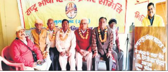
बाल दिवस पर काव्य-गोष्ठी में रचना प्रस्तुत करते कवि।