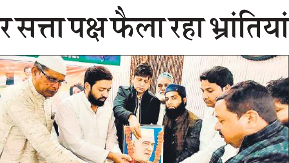
नेहरू के चित्र पर पुष्प अर्पित करते कांग्रेस पदाधिकारी व कार्य कर्ता।

भारतीय किसान यूनियन तोमर के पदाधिकारियों ने पिछले दिनों भोजपुर थाना क्षेत्र में हुई मुठभेड़ में पुलिस और मेरठ एसटीएफ के कार्य की