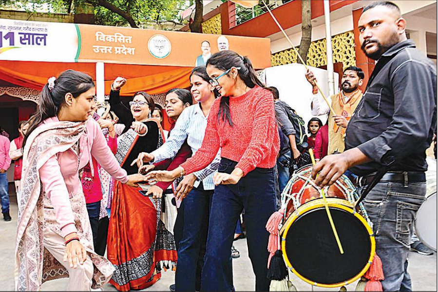
बिहार में राष्ट्रीय जनतांत्रिक गठबंधन ( राजग ) की प्रचंड जीत के उपलक्ष्य में भाजपा के यूपी मुख्यालय में शुक्रवार दोपहर जमकर जश्न मनाया गया । पार्टी कार्यालय परिसर ढोल -नगाड़ों की धाप, आतिशबाजी और विजय नारों से गूंज उठा । उत्साह से भरे कार्यकर्ताओं ने नृत्य कर खुशी का इजहार किया । अमृत विचार