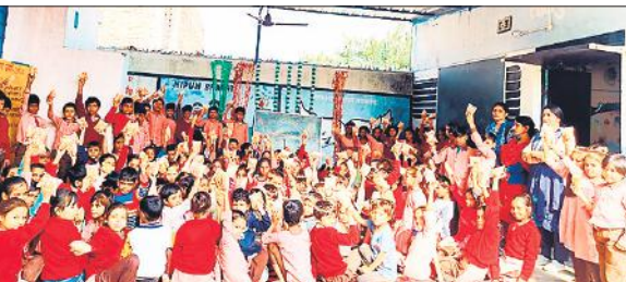
पुरस्कार दिखाते बच्चे।