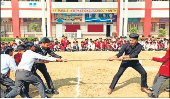
बाल दिवस पर आयोजित प्रतियोगिता में प्रतिभाग करते छात्र-छात्राएं।