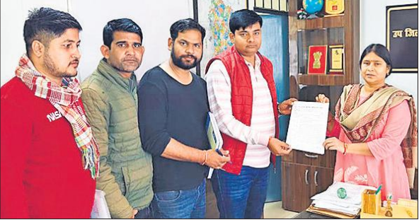
धरना-प्रदर्शन करने के लिए एसडीएम को ज्ञापन देते लेखपाल। ● अमृत विचार

हुए रॉयल पैलेस पहुंचकर सम्पन्न हुई। यात्रा के दौरान कार्यकर्ता हाथों में तिरंगा लिए, डीजे पर देशभक्ति गीतों की धुनों पर 'भारत माता की जय' और 'वंदे मातरम' के नारों के साथ जोशपूर्ण माहौल में आगे बढ़ रहे थे। कई स्थानों पर व्यापारियों और स्थानीय निवासियों ने पुष्पवर्षा कर यात्रा का स्वागत किया।