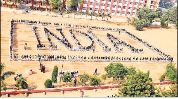
श्री वैक्टेश्वरा विश्वविद्यालय रैली के बाद लिखा इंडिया।