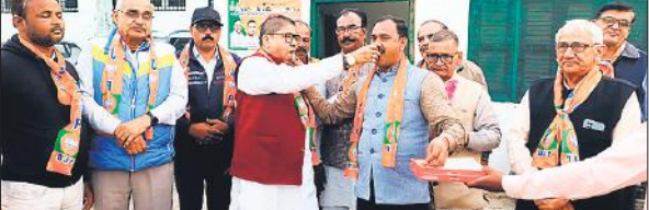
बिहारी में जीत पर मिठाई खिलाते भाजपाई। ● अमृत विचार