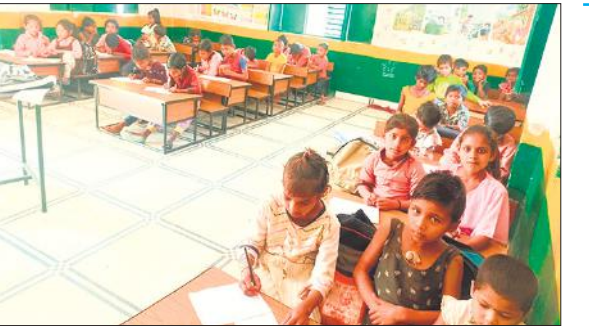
छज्लेट प्राथमिक विद्यालय में बिना स्वेटर और जूते मोजे के कक्षा में बैठे बच्चे।

शिक्षा विभाग को छात्रों के आधार पंजीकरण के लिए 18 आधार मशीनें मिली थीं, लेकिन इनमें से 17 मशीनें खराब पड़ी हैं। कई स्थानों पर ऑपरेटर नियुक्त नहीं हैं, जबकि जहां मशीनें हैं, वहां स्कूलों और बीआरसी केंद्रों पर आधार बनाने के कैप लग ही नहीं पाए। आधार न बन पाने के कारण हजारों बच्चों का डेटा पॉटल पर अपडेट नहीं हो सका, जिससे आगे की डीबीटी प्रक्रिया