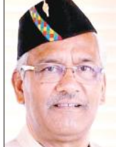
जिवेद्र सिंह रावत सांसद, हरिद्वार

हमारा स्वतंत्रता संग्राम देश के उन असंख्य बलिदानियों के त्याग और समर्पण की कहानी बयां करता है, जिन्होंने अपना जीवन, घर-परिवार, सुख-चैन और जवानी सब कुछ देश के लिए समर्पित कर दिया। ऐसे ही महान क्रांतिकारियों में एक नाम है भगवान बिरसा मुंडा, आज उनकी 150 वीं जयंती के अवसर पर आवश्यक है कि हम राष्ट्र प्रेम, सामाजिक अस्मिता, प्रकृति संरक्षण एवं आत्मनिर्भरता के उनके संदेशों को जन-जन तक पहुंचाएं और उनके आदर्शों का अनुपालन करें। भगवान बिरसा मुंडा भारत के इतिहास में अदम्य साहस, जनजातीय अस्मिता, आत्मनिर्भरता, प्रकृति संरक्षण और स्वाभिमान के उ्तीक के रूप में पूजे जाते हैं। उनका जन्म 15 नवंबर 1875 को बंगाल प्रेसीडेंसी, वर्तमान में झारखंड के उलिहातू गांव, जिला खूंटी में मुंडा