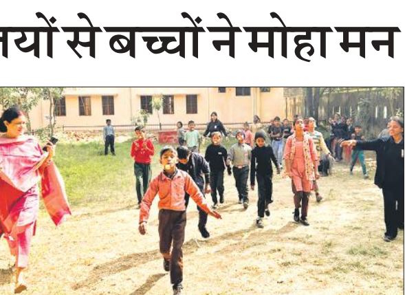
बच्चों के संग खेलते परिवर्तन दी चेंज संस्था के सदस्य।

उप पड़ गई। जिले में 20 हजार से अधिक बच्चों के लिए सर्दियों की यूनिफॉर्म का डायरेक्ट बेनिफिट ट्रॉसफर ( डीबीटी ) अब तक नहीं हो पाया है। विभागीय आंकड़ों के