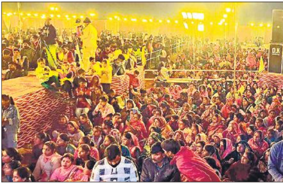
संकीर्तन में पहुंची भीड़।