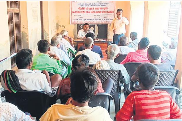
किसानों को जैविक खेती के प्रति जागरूक करते यूपी डास्प विभाग के अधिकारी।

नमामि गंगे योजना के तहत चार ब्लॉक उसावां, कादरचौक, उझानी, सहसवान और दहगांव का चयन किया गया है। यह ब्लॉक गंगा किनारे के हैं। इन ब्लॉकों के 68 गांव में जैविक विधि से खेती पिछले दो साल से हो रही है। इन