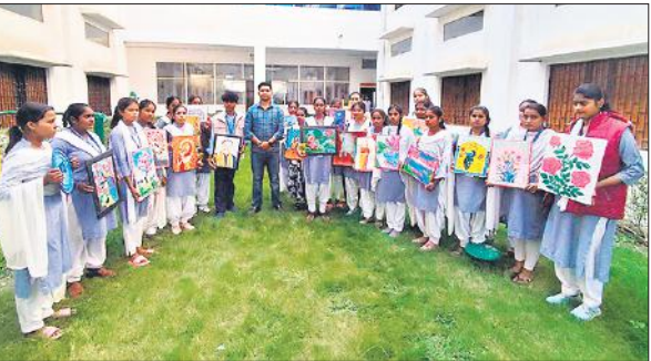
विटोली देवी महाविद्यालय की छात्राएं पोस्टर दिखाती हुई।