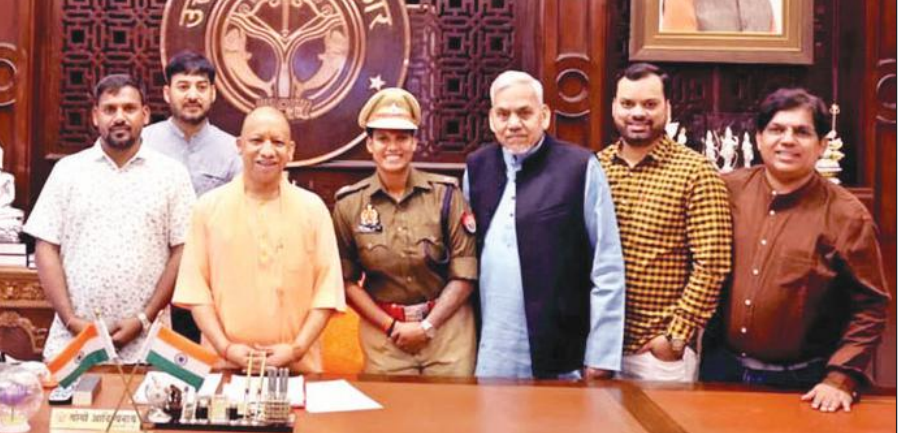
लोकभवन में शुक्रवार को मुख्यमंत्री योगी आदित्यनाथ से मुलाकात करतीं क्रिकेटर दीप्ति शर्मा, साथ में अन्य ।

शानदार खेल दिखाया, जिसकी बदौलत हमारी टीम पहली बार