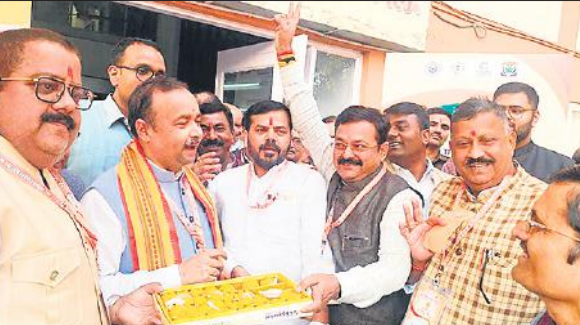
बिहार की बंपर जीत पर डीसीबी अध्यक्ष सहकारिता मंत्री को मिठाई खिलाते हुए।