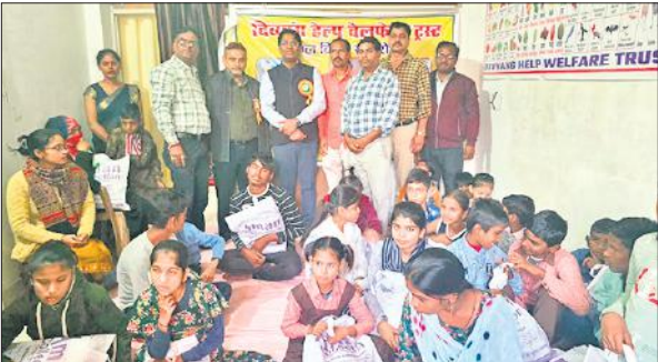
दिव्यांग बच्चों के साथ बाल दिवस मनाते समाजसेवी।