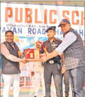
एडीएम का स्वागत करते प्रबंधक।