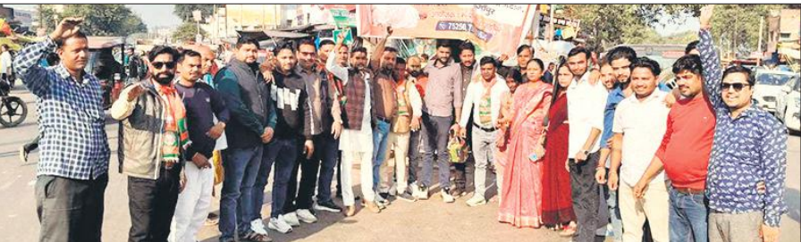
एनडीए की जीत का जश्न मनाते भाजपाई।

शाहजहांपुर, अमृत विचार : रेलवे स्टेशन पर अमृत भारत योजना के तहत निर्माण कार्य को लेकर प्लेटफार्म दो और तीन को ऊंचा करने के बाद प्लेटफार्म एक को ऊंचा करने की तैयारी शुरु हो गई। रेलवे स्टेशन पर पुनर्विकास करने के लिए 17 करोड़ रुपये स्वीकृत हुए थे। अगस्त 2023 में प्रधानमंत्री ने वटुअल के माध्यम से इसका शिलान्यास किया था। जारी बजट में एक फीट ओवर ब्रिज, स्वचालित सीढ़ियां, द्वितीय प्रवेश द्वार की तरफ त्रिकोणालय, टिकट घर और प्लेटफार्म को ऊंचा करने की कार्य होना था। फुट ओवर ब्रिज बनकर तैयार हो गया है और स्वचालित सीढ़ियों का कार्य चल रहा है। प्लेटफार्म दो और तीन को ऊंचा कर दिया गया है। क्यों कि कोच में चढ़ने के लिए यात्रियों को पावदान की अधिक सीढ़ियां नहीं चढ़नी पड़ेगी।