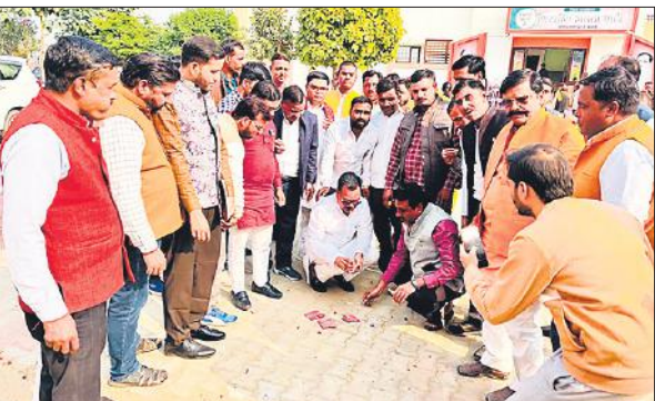
भाजपा कार्यालय पर आतिशबाजी छोड़ते जिलाध्यक्ष।

दौरान मृदा में जीवांश कार्बन 0.2 फीसद तक था। अब जमीन परती हो रही थी। जैविक विधि से खेती करने के बाद अब जीवांश कार्बन 0.3पहुंच गया है। जमीन परती होने की वजह से यहां पर खेती करना मुश्किल होने के साथ चुनौती भरा हो गया था। गोबर, गुड़, बेसन और