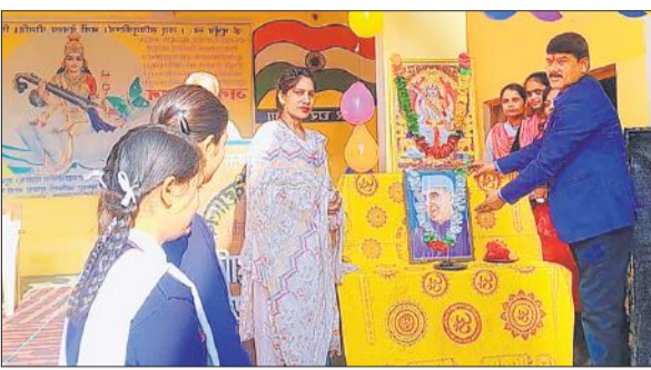
शेरगढ़ के स्कूल में पूर्व प्रधानमंत्री जवाहरलाल नेहरू के चित्र पर पुष्प अर्पित करते अतिथि।