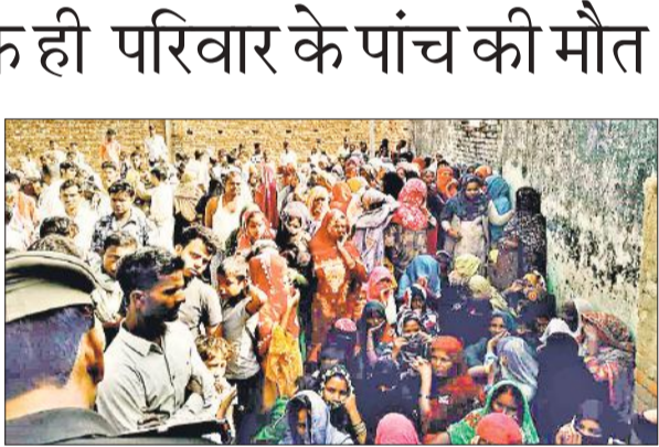
मौके पर मौजूद लोगों की भीड़।

अमृत विचार : प्रदेश में उच्च शिक्षा को विस्तार दिया गया है। मुख्यमंत्री योगी आदित्यनाथ की अध्यक्षता में शुक्रवार को लोकभवन में संपन्न मंत्रिपरिषद की बैठक में स्वामी शुकदेवानन्द विश्वविद्यालय, शाहजहांपुर की स्थापना के प्रस्ताव को मंजूरी प्रदान कर दी गई। यह विश्वविद्यालय मुमुक्षु आश्रम ट्रस्ट द्वारा संचालित शैक्षणिक इकाइयों के उच्चीकरण के रूप में विकसित किया जाएगा। यह जानकारी उच्च शिक्षा मंत्री योगेंद्र उपाध्याय ने शुक्रवार को कैबिनेट की बैठक के बाद दी। मंत्री योगेन्द्र उपाध्याय ने शुक्रवार को बताया कि उप्र. राज्य विश्वविद्यालय अधिनियम, 1973 ( उत्तर प्रदेश अधिनियम संख्या-29 सन् 1974 ) में आवश्यक संशोधन करते हुए विश्वविद्यालय की स्थापना अधिक मार्ग प्रशस्त किया गया है।