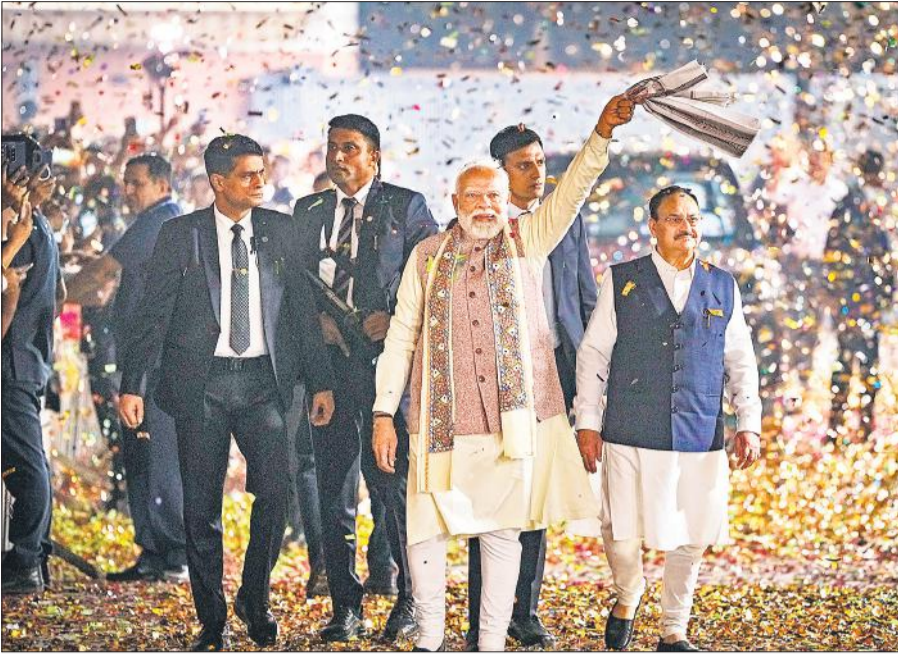
बिहार विधानसभा चुनाव में एनडीए की जीत के जश्न के दौरान नई दिल्ली स्थित भाजपा मुख्यालय में आयोजित कार्यक्रम में गमछा लहराते प्रधानमंत्री नरेंद्र मोदी। केंद्रीय स्वास्थ्य मंत्री और भाजपा के राष्ट्रीय अध्यक्ष जेपी नड्डा भी मौजूद थे।

पटना। असदुद्दीन ओवैसी के नेतृत्व वाली ऑल इंडिया मजलिस-ए-इतेहादुल मुस्लिमीन (एआईएमआईएम) ने शुक्रवार को बिहार विधानसभा चुनाव में पांच सीट पर जीत दर्ज की। मुस्लिम बहुल सीमांचल क्षेत्र में खासा प्रभाव रखने वाली इस पार्टी ने 243 चुनावी सभाओं में से 29 पर चुनाव लड़ा। जिन सीटों पर उसने चुनाव लड़ा, उनमें से 24 सीट सीमांचल क्षेत्र की हैं।