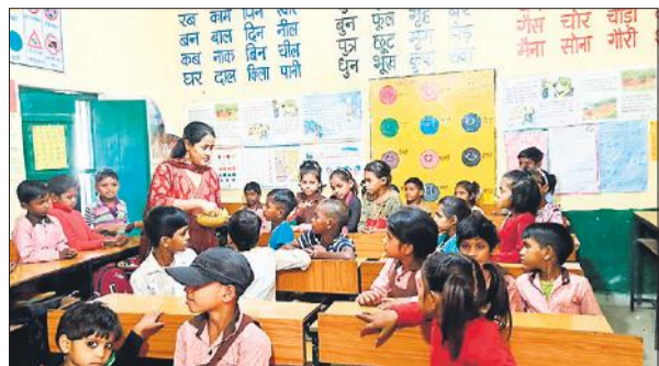
फरीदपुर के परिषदीय स्कूल में बच्चों को उपहार बांटती शिक्षिका।