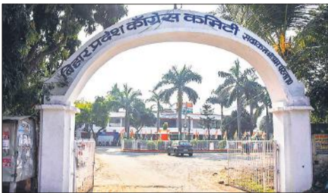
सदाकत आश्रम स्थित कांग्रेस के कार्यालय में छाया रहा सन्नाटा।

नई दिल्ली। भाकपा (माले) लिबरेशन के महासचिव दीपांकर भट्टाचार्य ने कहा कि बिहार चुनाव के नतीजे राज्य की जमीनी हकीकत से मेल नहीं खाते। भट्टाचार्य ने कहा, ये नतीजे बिल्कुल अस्वाभाविक हैं, ये बिहार की जमीनी हकीकत से बिल्कुल मेल नहीं खाते। उन्होंने कहा, दो दशक से सत्ता में रही सरकार 2010 के अपने प्रदर्शन को दोहरा रही है, यह समझ से परे है। उन्होंने ‘एक्स’ पर एक पोस्ट में कहा कि बिहार में मतदाता सुविधियों के एसआईआर के बाद 7.42 करोड़ मतदाता थे और चुनाव के बाद जारी निर्वाचन आयोग के प्रेस नोट में यह आंकड़ा 7.45,26,858 बताया गया है। उन्होंने कहा, 3,00,000 से अधिक की बढ़ोतरी! ये ‘अतिरिक्त 2 एबी’ कहां से आए। क्या आयोग इसका स्पष्टीकरण देगा।