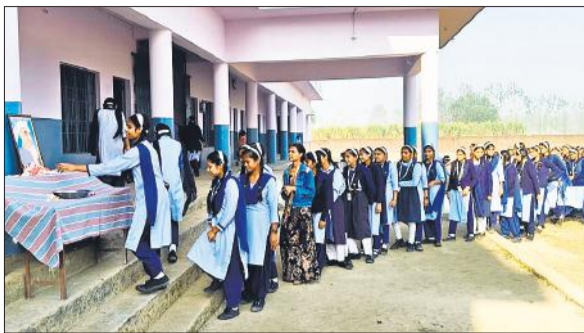
मीरगंज के स्कूल में पंडित जवाहर लाल नेहरू के चित्र पर पुष्प अर्पित करती छात्राएं।