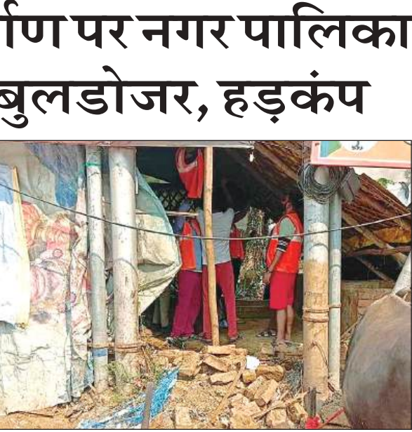
अवैध निर्माण को हटते नगर पालिकाकर्मों।