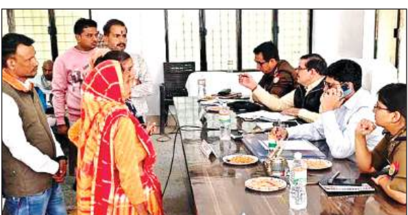
संपूर्ण समाधान दिवस में शिकायतें सुनते डीएम व एसपी।

निरीक्षण के दौरान बीज विक्रेताओं को बीज बिक्री पर अनिवार्य रूप से कैश मेमो देने के साथ-साथ स्टॉक रजिस्टर को अपडेट रखने के निर्देश दिए तथा लिए गए नमूनों को जांच के लिए प्रयोगशाला भेजा जायेगा।