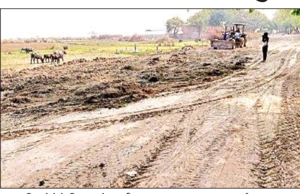
रामनगरिया मेले के लिए पुल के दूसरी तरफ दुरुस्त कराया जा रहा मार्ग।

अमृत विचार। पांचाल घाट पर आयोजित होने वाले एक माह के श्रीराम नगरिया माघ मेले की तैयारियां शुरू हो गई हैं। यह मेला 3 जनवरी से लगेगा, जिसमें हजारों श्रद्धालु कल्पवास करते हैं। इसी क्रम में घाट पर सड़क निर्माण का कार्य प्रगति पर है। पुल के दूसरी तरफ सड़क बनाई जा रही है। अधिकारियों ने बताया कि कल्पवास के दौरान श्रद्धालुओं को किसी प्रकार की असुविधा न हो, इसके लिए सड़क को इस बार ऊंचा बनाया जा रहा है। इससे पानी भरने जैसी समस्याओं से भी बचा जा सकेगा। मेले की व्यवस्थाओं को लेकर जिलाधिकारी (डीएम) आशुतोष कुमार द्विवेदी ने हाल ही में एक बैठक की थी। इस बैठक में विभिन्न समितियों का गठन किया गया, ताकि मेले का सुचारु संचालन