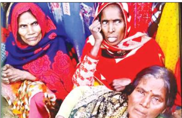
महिला की मौत के बाद गमगीन बैठे परजन।

● फोरेंसिक टीम ने भी घटना स्थल पर साक्ष्य जुटाए