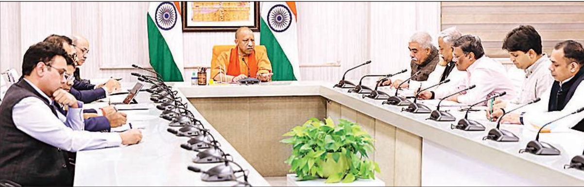
लखनऊ स्थित अपने सरकारी आवास पर एमएसएमई विभाग की समीक्षा करते मुख्यमंत्री योगी आदित्यनाथ, साथ में मंत्री राकेश सचान और शीर्ष अधिकारी।

समीक्षा बैठक में स्टार्टअप, सेमीकंडक्टर और डाटा सेंटर पर मुख्यमंत्री योगी का रहा फोकस