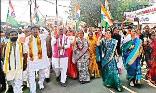
रन फॉर यूनिटी तिरंगा यात्रा निकालते लोग।