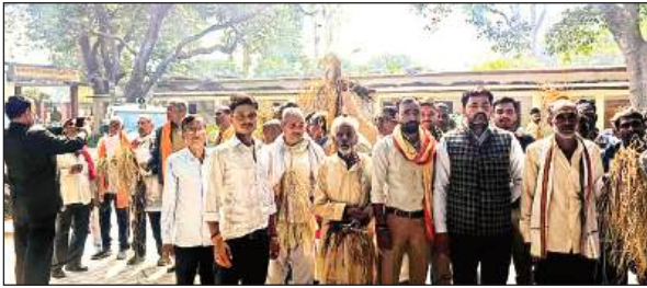
मुआवजे की मांग लेकर मुख्यालय पहुंचे किसान।