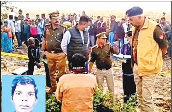
घटनास्थल पर मौजूद लोग व इनसेट में मृतक।

शनिवार की सुबह करीब 6 बजे कुछ किसान खेत में काम करने के लिए पहुंचे थे। तभी उन्हें पुलिया के नीचे खून से लथपथ एक युवक का शव नजर आया। किसानों ने इसकी जानकारी गांव में दी तो देखते ही देखते मौके पर लोगों की भीड़ जमा हो गई। युवक के सिर और चेहरे पर गंभीर चोटों के निशान देख ग्रामीणों