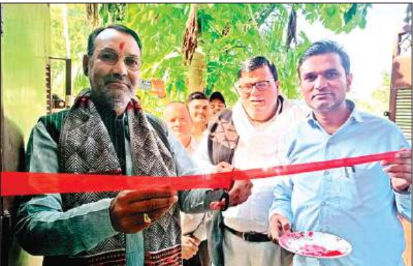
लाइब्रेरी का फीता काटकर उद्घाटन करते पूर्व प्रधान।

बेलाताल महोबा। कस्बे के ऐतिहासिक प्राचीन धौसा मंदिर में 18 पुराण, यज्ञ और भागवत कथा का आयोजन किया जा रहा है। कथा वाचक ने श्रद्धालुओं को कृष्ण की कथाओं का रसपान कराया। इसी क्रम में शनिवार को कथा वाचक ने इंद्र के कुपित होने पर श्रीकृष्ण ने गोवर्धन उठा लिए जाने की कथा सुनाई। कथा व्यास ने कथा का वर्णन करते हुए कहा कि एक बार कृष्ण ने देखा कि ब्रज के ग्रामीण भगवान इंद्र की पूजा की योजना बना रहे हैं, तब बालक कृष्ण ने उनसे पूछा कि वे पूजा करके भगवान इंद्र को प्रसन्न क्यों कर रहे हैं। एक ग्रामीण ने कृष्ण को समझाया कि यह हर वर्ष भगवान इंद्र को प्रसन्न करने के लिए किया जाता है, ताकि इंद्र भगवान ब्रज के लोगों पर वर्षा करके कृपा करते रहें। कृष्ण ने इसे अस्वीकार कर दिया। इस प्रश्न को सुनने के लिए श्रद्धालुओं की भीड़ मौजूद रही।