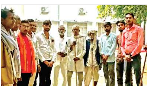
ज्ञापन देने के बाद खड़े ग्रामीण।

जिलाधिकारी को दिए ज्ञापन में बताया गया कि ग्राम पंचायत के पेड़ों की कटान और लकड़ी बेचकर प्राप्त धनराशि को गांव के रामजानकी मंदिर निर्माण के लिए सामूहिक स्वीकृति दी गई थी। ग्रामीणों ने बताया कि लकड़ी