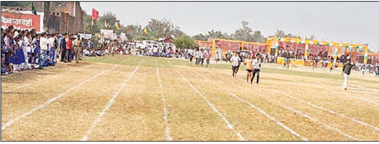
सांसद खेल प्रतियोगिता में दौड़ लगाते खिलाड़ी।

ही नहीं पूरे विश्व में गूंजेगा। कांग्रेस के इस आरोप कि भाजपा नहीं बिहार में एसआईआर की जीत हुई है पर केंद्रीय विदेश राज्य मंत्री ने कहा कि यह तो पहले से पता था कि कांग्रेस यही रहेगी। महागठबंधन के एमवाई फैक्टर पर भी तंज कसा और कहा कि बिहार में सिर्फ एक फैक्टर काम किया है वह बिहार का विकास। जो बिहार के विकास की बात करेगा और जिसने बिहार का विकास करके दिखाया है उनके साथ जनता रहेगी।