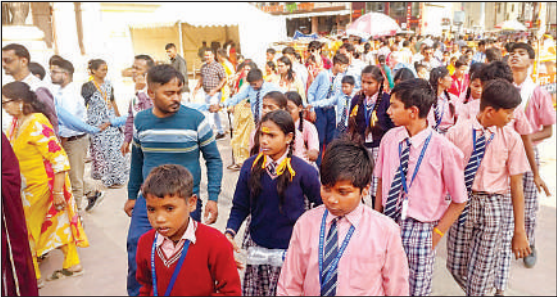
राम मंदिर पहुंच रहे अलग-अलग स्कूलों से आए छात्र-छात्राएं।