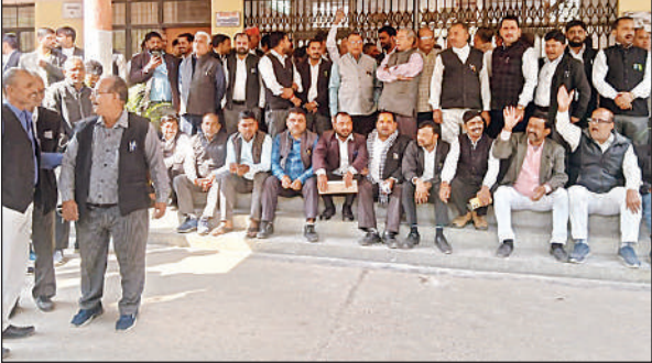
तहसील गेट पर धरना देते अधिवक्ता।