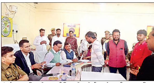
संपूर्ण समाधान दिवस में जनता की शिकायतें सुनते डीएम और एसपी।