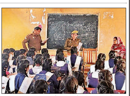
छात्राओं को योजनाओं की जानकारी देते पुलिसकर्मी ।