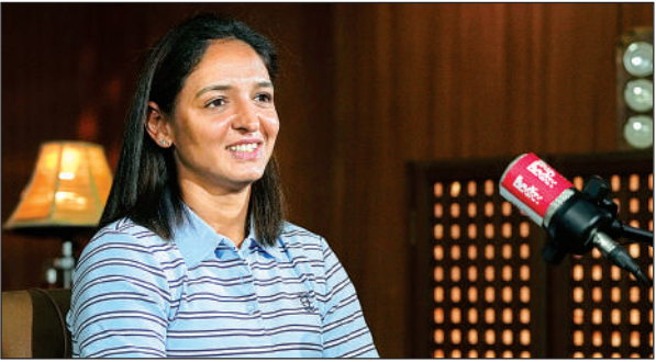
एक साक्षात्कार के दौरान हरमनप्रीत कौर।

कप्तान के इस कैच ने भारत को दक्षिण अफ्रीकी महिला टीम पर 52 रन से जीत दिलाकर ऐतिहासिक पहली विश्व कप ट्रांफी दिलाई। इस 36 वर्षीय खिलाड़ी ने यहां पीटीआई मुख्यालय के दौरे के दौरान विशेष साक्षात्कार में कहा मेरी जिंदगी पूरी तरह बदल गई है। मैंने वह आखिरी गेंद कम से कम एक हज़ार बार देखी है। सिर्फ मैं ही नहीं, हमारी टीम भी कई वर्षों से इस पल का इंतज़ार कर