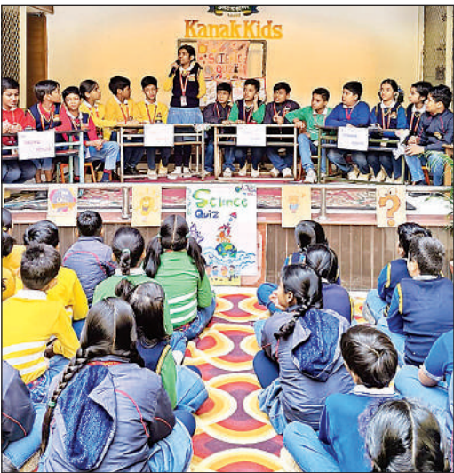
कनक किड्स इंटरनेशनल स्कूल में साइंस विवज कंपटीशन में अपनी प्रतिभा का प्रदर्शन करते बच्चे।