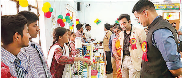
विज्ञान प्रदर्शनी में अपना मॉडल प्रस्तुत करती छात्राएं।