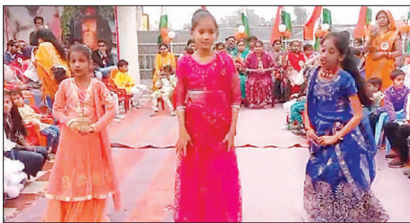
बाल दिवस पर सांस्कृतिक कार्यक्रम पेश करते बच्चे।