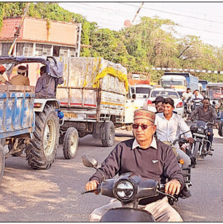
रूट डायवर्जन के चलते लगा लंबा जाम।

क्रॉसिंग पर वाहनों की भारी भीड़ के कारण सड़क पर लगी रबर शीट दबने लगी है, जो किसी भी समय दुर्घटना का कारण बन सकती है। शनिवार को हनुमानगंज क्रॉसिंग पर गुजरात ट्रैक्वल्स के तीन वाहन देखे गए, जिनमें कुल 21 यात्री सवार थे। ये यात्री