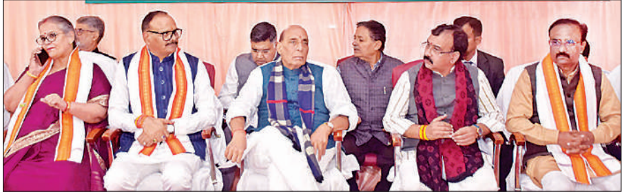
लखनऊ में वरिष्ठ कार्यकर्ता संवाद कार्यक्रम के दौरान उपस्थित रक्षा मंत्री राजनाथ सिंह, उप मुख्यमंत्री ब्रजेश पाठक व अन्य।

दो दिवसीय प्रवास पर राजधानी पहुंचे रक्षा मंत्री राजनाथ सिंह का एयरपोर्ट पर उप मुख्यमंत्री ब्रजेश पाठक और भाजपा पदाधिकारियों