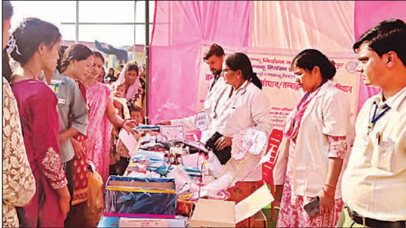
ग्राम स्वास्थ्य छाया पोषण एवं स्वच्छता कार्यक्रम का निरीक्षण करते सीएमओ व अन्य।