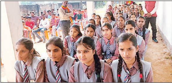
कार्यक्रम में मौजूद बच्चे।