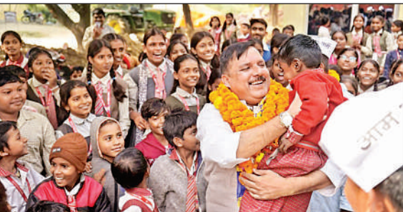
यात्रा के दौरान बच्चे को गोद में लेकर दुलारते हुए सांसद संजय सिंह।

अमृत विचार: बेरोज़गारी, भर्ती घोटालों और जनसमस्याओं के समाधान की मांग को लेकर आम आरमी पार्टी की ‘रोज़गार दो-सामाजिक न्याय दो’ पदयात्रा के चौथे दिन कूरेभार से कटका तक जबरदस्त जनसमर्थन देखने को मिला। जगह-जगह युवाओं, महिलाओं, आशा बहुओं व आम नागरिकों ने प्रतिभाग कर सांसद संजय सिंह के नेतृत्व में निकल रही इस पदयात्रा को मजबूत संदेश दिया। भीड़ का उत्साह देख सांसद संजय सिंह ने कहा कि सुलतानपुर की लड़ाई उनकी व्यक्तिगत लड़ाई है और हर बेरोज़गार नौजवान उनके परिवार का सदस्य है।