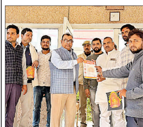
अतिरिक्त मजिस्ट्रेट को ज्ञापन सौंपते कार्यकर्ता।