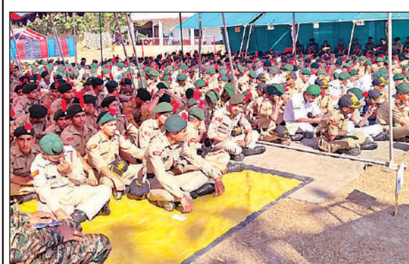
शिविर में मौजूद एनसीसी कैडेट।