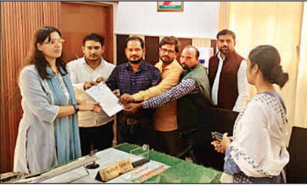
एसडीएम को ज्ञापन सौंपते लंभुआ तहसील के लेखपाल।