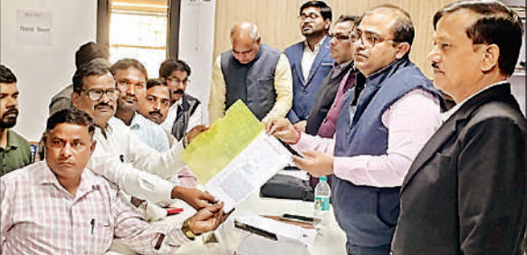
गोंडा तहसील में ज्ञापन देते लेखपाल।

समाधान दिवस कार्यक्रम समाप्त होने के बाद पदाधिकारियों ने 8 सूत्रीय मांगपत्र सौंप निस्तारण की मांग की। मांगपत्र में प्रारम्भिक वेतनमान का उच्चीकरण कर 2800 ग्रेड- पे लागू करने, पदोन्नति के अवसर बढ़ाने, एसीपी