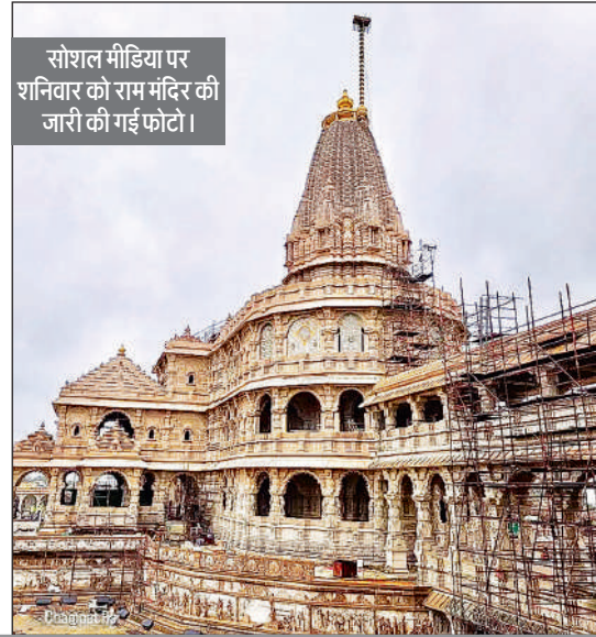
सोशल मीडिया पर शनिवार को राम मंदिर की जारी की गई फोटो।