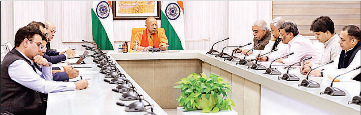
लखनऊ स्थित अपने सरकारी आवास पर एमएसएमई विभाग की समीक्षा करते मुख्यमंत्री योगी आदित्यनाथ, साथ में मंत्री राकेश सवान और शीर्ष अधिकारी।

समीक्षा बैठक में स्टार्टअप, सेमीकंडक्टर और डाटा सेंटर पर मुख्यमंत्री योगी का रहा फोकस