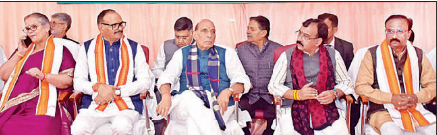
लखनऊ में वरिष्ठ कार्यकर्ता संवाद कार्यक्रम के दौरान उपस्थित रक्षा मंत्री राजनाथ सिंह, उप मुख्यमंत्री ब्रजेश पाठक व अन्य।

जांच रिपोर्ट के अनुसार, कई फर्मों द्वारा कूटरचित बिलों का इस्तेमाल कर अवैध रूप से कोडीन युक्त दवाओं को अन्य राज्यों और स्थानों में नशे के बाजारों तक पहुंचाया जाता रहा। उद्देश्य अधिक मुनाफा कमाना और नशे की अवैध आपूर्ति को बढ़ावा देना था।