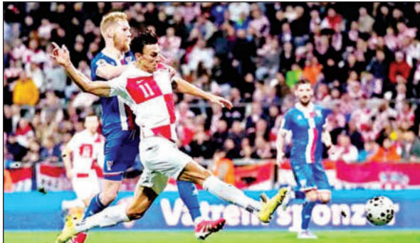
गोल करने का प्रयास करते क्रोएशिया और फरो आइलैंड्स के खिलाड़ी।

क्रोएशिया ने हालांकि जल्द ही वापसी की। उसके लिए 23वें मिनट में जोस्को ग्वार्डिओल ने बराबरी का गोल दागा। दो साल बाद राष्ट्रीय टीम में वापसी करते हुए पेटार मूसा ने जोसिप स्टानिसिक की मदद से हाफटाइम के बाद क्रोएशिया को 2-1 से आगे कर दिया। उसकी तरफ से तीसरा गोल निकोला क्लासिक ने किया। नीदरलैंड ने वारसा में पिछड़ने के बाद वापसी की।