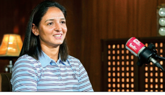
एक साक्षात्कार के दौरान हरमनप्रीत कौर।

यह एक ऐसा पल है जिसने उनकी जिंदगी और भारतीय महिला क्रिकेट की दिशा को बदल दिया और इसलिए इसमें हैरानी की कोई बात नहीं है कि हरमनप्रीत कौर ने विश्व कप फाइनल में नादिन डी क्लार्क का यादगार कैच अब तक कम से कम 1000 बार देखा है। कप्तान के इस कैच ने भारत को दक्षिण अफ्रीकी महिला टीम पर 52 रन से जीत दिलाकर ऐतिहासिक पहली विश्व कप ट्रांफी दिलाई। इस 36 वर्षीय खिलाड़ी ने यहां पीटीआई मुख्यालय के दौरे के दौरान विशेष साक्षात्कार में कहा मेरी जिंदगी पूरी तरह बदल गई है। मैंने वह आखिरी गेंद कम से कम एक हज़ार बार देखी है। सिर्फ मैं ही नहीं, हमारी टीम भी कई वर्षों से इस पल का इंतज़ार कर