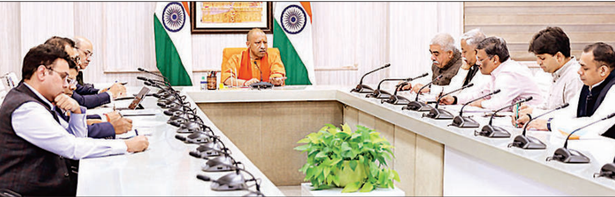
लखनऊ स्थित अपने सरकारी आवास पर एमएसएमई विभाग की समीक्षा करते मुख्यमंत्री योगी आदित्यनाथ, साथ में मंत्री राकेश सवान और शीर्ष अधिकारी।

समीक्षा बैठक में स्टार्टअप, सेमीकंडक्टर और डाटा सेंटर पर मुख्यमंत्री योगी का रहा फोकस