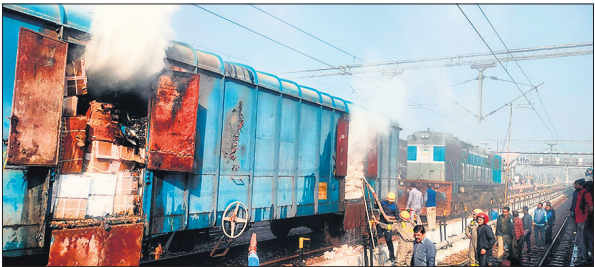
मालगाड़ी में आग लगने से जलता सामान।

दिल्ली से झारखंड जा रही पासल मालगाड़ी के एक डिब्बे में परसाखड़ा के पास शनिवार सुबह करीब 9 बजे आग भड़क गई। बरेली जंक्शन पर पहुंचने से पहले ही लोको पायलट ने बोगी से धुआं निकलते देखा और तत्काल कंट्रोल रूम को सूचना दी। सूचना मिलते ही रेलवे अफसर अलर्ट हो गए और फायर ब्रिगेड को मौके पर बुला लिया गया। बरेली जंक्शन पर मालगाड़ी को रोका गया। जिस डिब्बे में आग लगी थी, उसे तत्काल ट्रेन से अलग कर दिया गया।