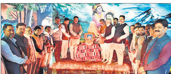
चौपला चौराहे के पास बगिया मंदिर प्रांगण में आयोजित कार्यक्रम में भगवान बिरसा मुंडा की जयंती मनाने के दौरान वनमंत्री एवं भाजपा पदाधिकारी।

फीडबैक लेकर ही रिपोर्ट बनाएं अधिकारी: मंडलायुक्त भूपेन्द्र एस