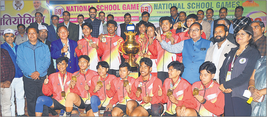
वालीबॉल प्रतियोगिता में बालक वर्ग की चैंपियन मणिपुर की टीम ट्राफी के साथ जश्न मनाती हुई।