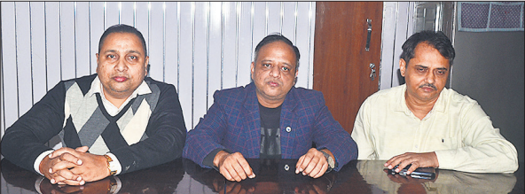
रामपुर गार्डन में आईडीए की गोष्ठी में शामिल विशेषज्ञ।