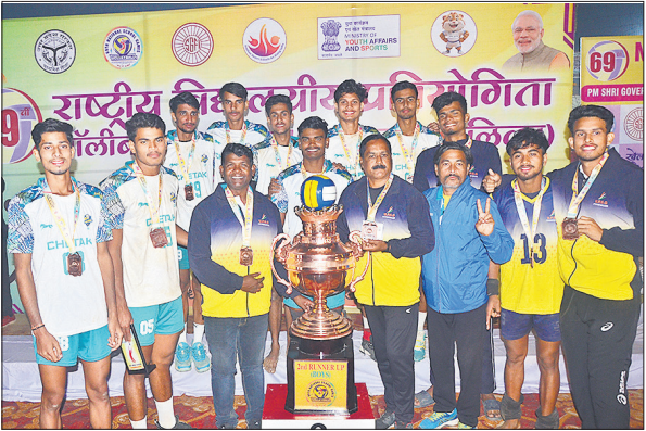
प्रतियोगिता में तीसरा स्थान मिलने पर खुशी जताते मेजबान यूपी टीम के खिलाड़ी।

यूपी की टीम को रोमांचक मुकाबले में 3-2 के सेट से हराया और फाइनल में जगह बनाई। मुकाबला जीतने के