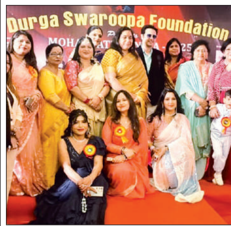
कार्यक्रम में शामिल दुर्गा फाउंडेशन के लोग।