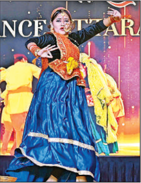
महोत्सव में नृत्य करती कलाकार।

नहीं है, अभी तो यह उत्तराखंड की आत्मा उसके परंपराओं और उत्तराखंड की लोक परम्परा को संजोये हुए है। उत्तराखंड देश की आध्यात्मिक राजधानी भी है। उसकी सांस्कृतिक ऊर्जा को समावेशित करके लखनऊ की धरती पर भी