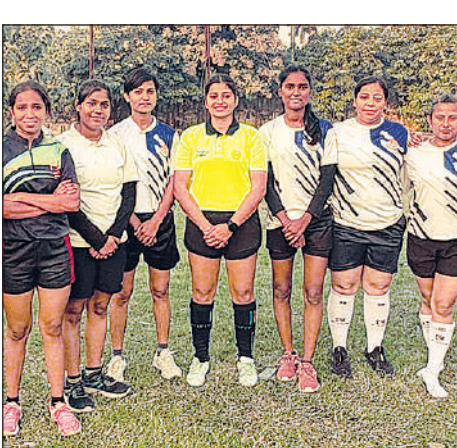
रग्बी लीग में भाग लेने वाली विश्वविद्यालय की टीम।