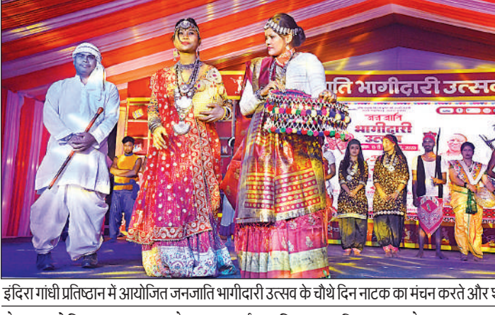
इंदिरा गांधी प्रतिष्ठान में आयोजित जनजाति भागीदारी उत्सव के चौथे दिन नाटक का मंचन करते और शरीर पर पशु-पक्षियों के चित्र बनाकर पशु प्रेम का संदेश देते कलाकार।

रैंप पर कलाकारों का क्रम जम्मू से शुरू हुआ जिसके बाद