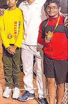
फिट टेनिस टूर्नामेंट की ट्रॉफियों के साथ विजेता खिलाड़ी।

जिससे पौधों की उत्पादकता में उल्लेखनीय वृद्धि होती है।