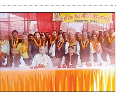
समारोह में शामिल क्षत्रिय समाज के लोग।