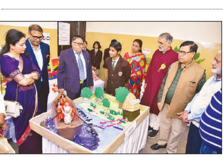
विज्ञान प्रदर्शनी में मॉडल देखते शिक्षक।

अमृत विचार, लखनऊ : खेलों इंडिया महिला रग्बी लीग 2025 में लविवि की छात्राओं ने दूसरा कांस्य पदक प्राप्त किया है। सीतापुर के मेजर ध्यानचंद स्टेडियम में चल रही प्रतियोगिता के सीनियर वर्ग में अशोका अकादमी, अटरिया ने पहला स्थान, केजीएमयूआईसी स्कूल बिसवां ने दूसरा स्थान और लविवि की टीम ने कांस्य पदक अपने नाम किया। बीपीएड और एमपीएड की छात्राओं ने विवि की टीम का प्रतिस्पर्धित किया। यू-15 वर्ग में भारतीय विद्या मंदिर खमेरैया ने खिताब जीता। सिधौली रग्बी क्लब उपविजेता और पं. दीनदयाल उपाध्याय मॉडल इंटर कॉलेज द्वितीय उपविजेता रहे। यू-18 वर्ग में सिधौली रग्बी क्लब विजेता, बिसवां रग्बी क्लब उपविजेता और एबीएमएल मेमोरियल कॉलेज महमूदाबाद तीसरे स्थान पर रहा।