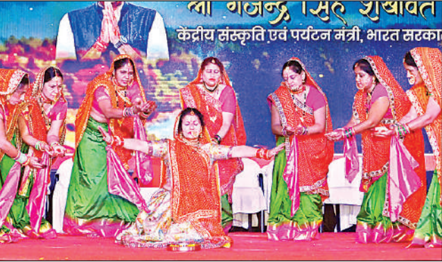
उत्तराखंड महोत्सव के सांस्कृतिक मंच पर नृत्य प्रस्तुत करती कलाकार।