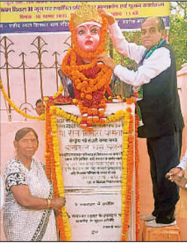
प्रतिमा पर माल्यार्पण करते लोग।