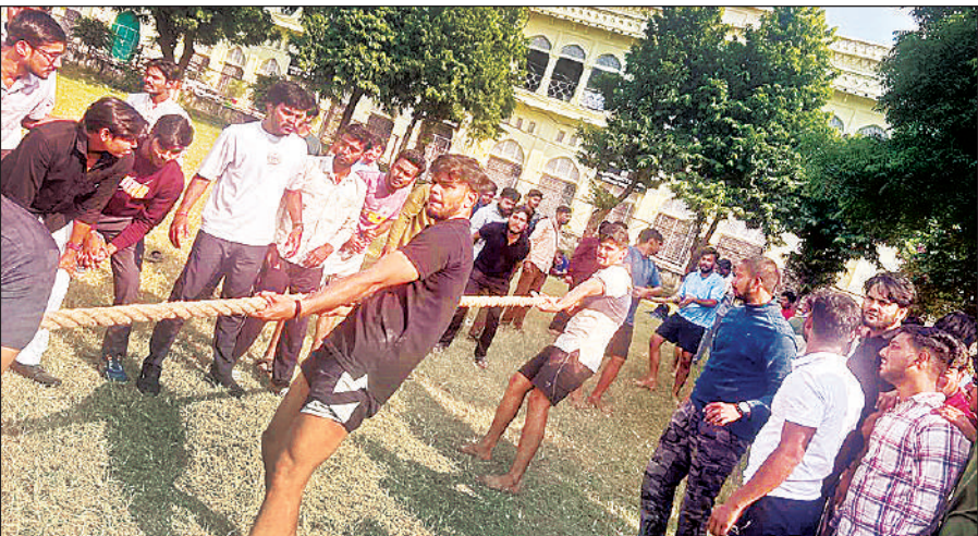
रस्साकस्सी प्रतियोगिता में जोर आजमाइस करते छात्र।