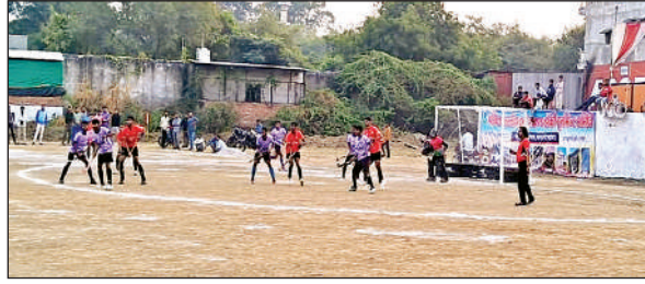
हॉकी मैच में गोल दागने का प्रयास करते खिलाड़ी।