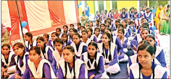
गोष्ठी के दौरान मौजूद छात्राएं।