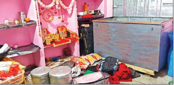
चोरी के बाद घर में बिखरा पड़ा सामान।