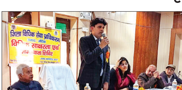
कार्यक्रम को संबोधित करते अतिथि।