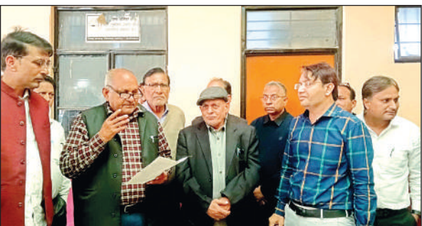
एसडीएम को ज्ञापन देते तहसील बार एसोसिएशन के पदाधिकारी।

तहसील पहुंचे एसोसिएशन पदाधिकारियों का कहना था कि तहसील में राजस्व मामलों में अवैध वसूली की जा रही हैं। वकीलों ने आरोप लगाया कि न्यायालय में केस लिस्ट न बनवाकर जान-बूझकर दबाव बनाया जा रहा है जबकि उनकी समस्याओं पर अधिकारियों द्वारा न तो कोई वार्ता की जा रही है