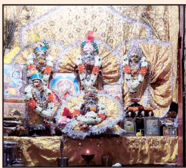
गोरे राम मंदिर का विग्रह