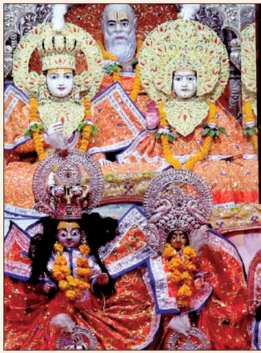
सियाराम किला मंदिर में विराजमान भगवान का स्वरूप

सियाराम किला झुनकी घाट मंदिर का मुख्य द्वारा।