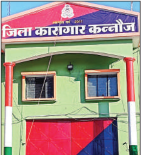
जिला कारागार कन्नौज।