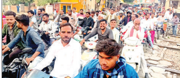
रेलवे क्रासिंग पर लगा जाम।