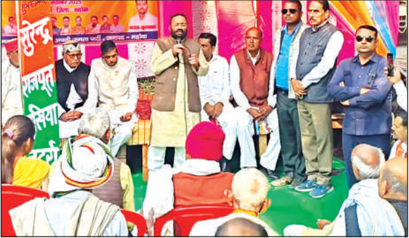
कार्यक्रम में बोलते पूर्व कैबिनेट मंत्री स्वामी प्रसाद मौर्य।

● स्वामी प्रसाद मौर्य ने बिहार में एनडीए की जीत पर कसा तंज