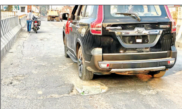
ओवरब्रिज पर भी जगह-जगह हुए गड्ढों से हो रही है दिक्कत ।