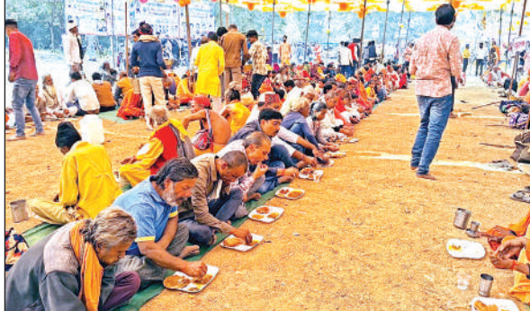
भंडारे का प्रसाद ग्रहण करते श्रद्धालु।

कस्बा जैतपुर के ऐतिहासिक धौसा मंदिर में एक सप्ताह तक भव्य महायज्ञ चलता रहा। महायज्ञ के समापन अवसर पर विशाल भंडारे का आयोजन किया गया। भंडारे की खबर लगते ही आसपास के ग्रामीण क्षेत्र के भारी संख्या में ग्रामीण मंदिर परिसर में प्रसाद ग्रहण करने के लिए पहुंच गए, जिसके