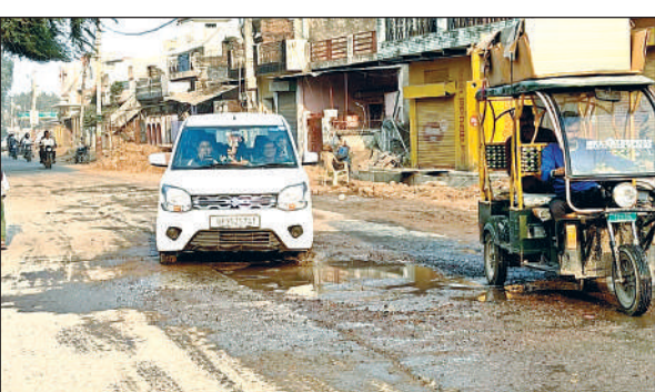
सोनेपुर रोड में भरा पानी और निकलते वाहन ।