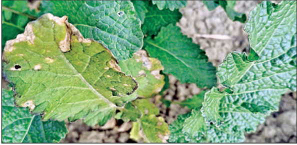
सरसों की फसल में लगा अल्टरनेरिया झुलसा रोग।

समारोह में जिला विकास अधिकारी, ब्लॉक प्रमुख, खंड विकास अधिकारी, जनप्रतिनिधि, अधिकारी एवं वर-वधुओं के परिजन उपस्थित रहे।