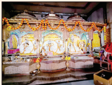
विभूति भवन मंदिर में विराजमान विग्रह