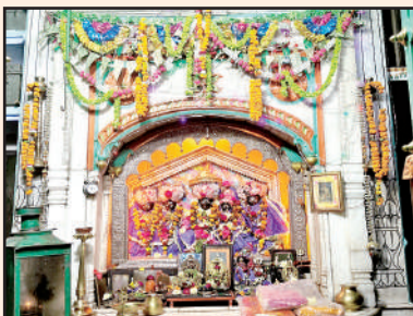
कालेराम मंदिर का विग्रह