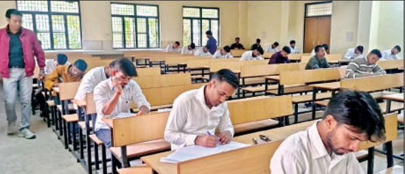
सेमेस्टर परीक्षा देते विद्यार्थी।

अमृत विचार। महामाया राजकीय पॉलिटेक्निक अनौगी में सोमवार को सेमेस्टर परीक्षाएं संचालित हुईं। इसमें प्रथम पाली में 128 नामांकित परीक्षार्थियों में से 124 छात्र, छात्राएं उपस्थित रहे। जबकि द्वितीय पाली में नामांकित 86 परीक्षार्थियों में से दो अनुपस्थित रहे। 84 परीक्षार्थी उपस्थित रहे।