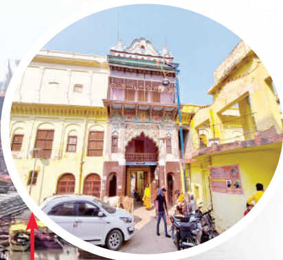
सद्गुरु सेवा सदन मंदिर का मुख्य प्रवेश द्वार और गर्भगृह में स्थापित विग्रह

युं तो अयोध्या को पहचान की न कभी जरूरत थी और न होगी। यह सृष्टि की आदि नगरी है, लेकिन लगभग 500 साल के संघर्ष के बाद श्रीराम जन्मभूमि पर मंदिर निर्माण का मार्ग प्रशस्त होने के बाद नए परिवेश में अयोध्या को नई पहचान जरूर मिली। इन दिनों राम मंदिर अयोध्या का आकर्षण है, लेकिन इसके साथ अयोध्या की यात्रा करें, तो यहां के अन्य मंदिरों के साथ पौराणिक स्थलों तक पहुंचेंगे तो आनंद कुछ ज्यादा मिलेगा।