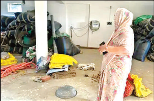
तिर्वा में चोरी हुई सरसों की बोरी देखती महिला।