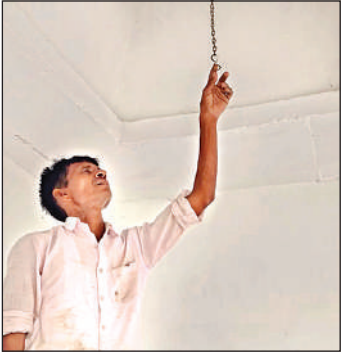
छिबरामऊ में यहीं टंगा था घंटा जो चोरी हो गया।