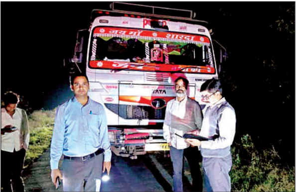
अवैध परिवहन की जांच करती टीम ।

जनपद में मौरंग खदानों का संचालन शुरू होते ही अवैध खनन, ओवरलोडिंग के साथ लोकेटरों का खेल शुरू हो जाता है । लोकेशन बाज अपने भिन्न-भिन्न गाड़ियों से प्रवर्तन वाहनों को 24 घंटे लोकेशन देते हुए उप खनिजों के अवैध खनन / परिवहन ओवरलोडिंग किए जाने वाले वाहनों को पास कराते हुए