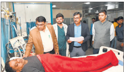
हैलट अस्पताल में घायलों की जानकारी लेते चिकित्साधीक्षक ।

अमृत विचार: बिल्हौर के अरौल थाना क्षेत्र में आगरा-लखनऊ एक्सप्रेस वे पर मंगलवार तड़के तीन बजे दिल्ली से बिहार जा रही डबल डेकर बस ड्राइवर को झपकी आने से अनियंत्रित होकर पलट गई। हादसे में एक मासूम सहित तीन लोगों की मौत हो गई, जबकि 24 यात्री घायल हो गए। सूचना मिलते ही पुलिस और यूपीडा के सुरक्षकर्मी मौके पर पहुंचे और रेस्क्यू शुरू किया। एंबुलेंस से सभी घायलों को बिल्हौर सीएचएस भेजा गया, जहां से गंभीर घायलों को प्राथमिक उपचार के बाद कानपुर रेफर किया गया। लखनऊ-आगरा एक्सप्रेसवे पर अरौल थाना क्षेत्र के मकनपुर कस्बे के पास दिल्ली से 45 यात्रियों को लेकर बिहार जा रही डबल डेकर स्लीपर बस