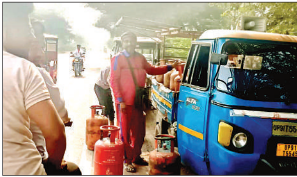
रसोई गैस सिलेंडर लेते उपभोक्ता ।

● दीपावली से दूर नहीं हो पा रही गैस सिलेंडर की किल्लत