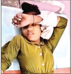
अस्पताल में भर्ती छात्रा।