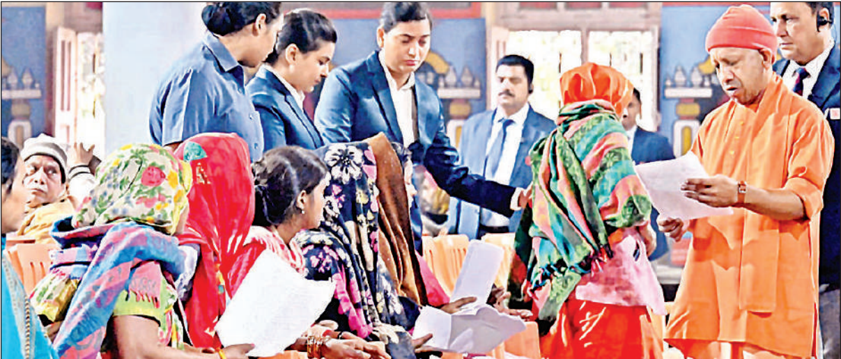
गोरखपुर के गोरखनाथ मंदिर में आयोजित जनता दर्शन के दौरान महिला फरियादियों की समस्याएं सुनते मुख्यमंत्री योगी आदित्यनाथ।

अमृत विचार : राष्ट्रपति द्रौपदी मुर्मू ने मंगलवार को को छठे राष्ट्रीय जल पुरस्कार (2024) समारोह में जल संरक्षण के क्षेत्र में उत्कृष्ट कार्य करने वाले जिलों का सम्मान किया। उत्तरी क्षेत्र में पहला स्थान मीरजापुर, दूसरा वाराणसी तो तीसरा स्थान जालौन को मिला इस अवसर पर वाराणसी जिले ने उत्तरी क्षेत्र में ‘सर्वश्रेष्ठ जिला’ के रूप में द्वितीय स्थान प्राप्त किया। इस उपलब्धि के लिए जिले को 2 करोड़ रुपये का नकद पुरस्कार भी दिया गया। वहीं, जल संचय जन