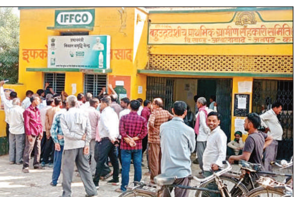
खाद लेने के लिए लगी किसानों की भीड़।

मंगलवार को साधन सहकारी समिति में यूरिया खाद की 700 बोरी बीते सोमवार को पहुंच गयी थीं मंगलवार को खाद का वितरण होने से पहले ही समिति पर भारी संख्या में किसान खाद लेने के लिए सुबह से ही पहुंच गए। जबकि किसानों ने आरोप लगाया कि देरी से खाद वितरण चालू किया गया। सुबह से बैठे किसानों का सन्न का बांध टूट गया और हंगामा करने लगे।