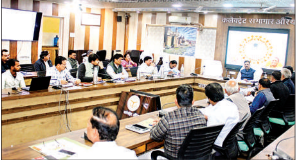
बैठक में अधीनस्थों को निर्देश देते जिलाधिकारी।

जनपद में संचालित निर्माण कार्यों की समीक्षा करते हुए जिलाधिकारी ने अधिशाषी अभियंता जल निगम (ग्रामीण) को पूर्ण परियोजनाओं के संचालन, समय के उपरांत तथा अपूर्ण परियोजनाओं को पूर्ण कराते हुए ग्रामीण क्षेत्र में पेयजलापूर्ति सुनिश्चित कराए जाने के निर्देश दिए। आवास विकास परिषद द्वारा पूर्ण निर्माण कार्यों में 07 दिन के अंदर विद्युत कनेक्शन कराने के निर्देश दिए। उन्होंने जयप्रकाश नारायण सर्वोदय विद्यालय हरदू के निर्माण कार्य में गुणवत्ता के साथ-साथ कार्य निर्धारित समय में पूर्ण न करने पर जिला समाज