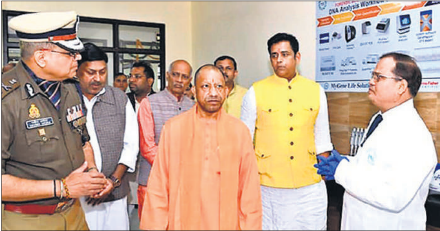
गोरखपुर के नवीन उच्चैकृत भवन जी+6 के लोकार्पण कार्यक्रम में सम्मिलित होते मुख्यमंत्री योगी आदित्यनाथ ।

अमृत विचार: मुख्यमंत्री योगी आदित्यनाथ ने कहा कि वह दौर खत्म हो गया जब पीड़ित तड़पता, भटकता था और अपराधी मौज-मस्ती करते थे। वर्ष 2017 के बाद का नया उत्तर प्रदेश अपराध को कतई स्वीकार नहीं करता है। यदि किसी ने यहां अपराध करने की जुरंत की तो उसे हर हाल में उसकी कीमत भी चुकानी होगी। अब राज्य सरकार ने जीरो टॉलरेंस की नीति के तहत साक्ष्य संकलन और फॉरेंसिक साइंस लैब्स ( विधि विज्ञान प्रयोगशाला ) के जरिए इसके प्रमाणन की ऐसी व्यवस्था सुनिश्चित कर दी है कि कोई भी अपराधी बच नहीं पाएगा। योगी ने कहा कि आज प्रदेश सरकार की जीरो टॉलरेंस की नीति, वैज्ञानिक साक्ष्यों पर आधारित जांच