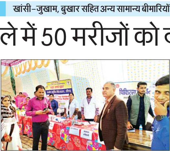
मेले में मौजूद चिकित्सक व ग्रामीण।

सभी ने मिलकर मेले को सुचारू रूप से संचालित किया और ग्रामीणों को स्वास्थ्य सेवाओं से जुड़ी जानकारी भी प्रदान की।