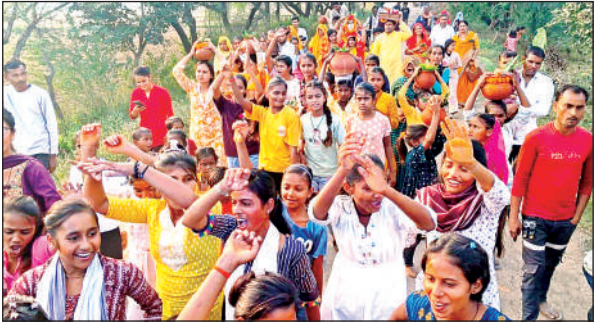
कलश यात्रा में शामिल महिलाएं और युवतियां ।

कीरतपुर बैठका धाम में प्रतिवर्ष की भांति सात दिवसीय श्रीमद् भागवत था का शुभारंभ मंगलवार से हो गया । इसके पूर्व कलश यात्रा निकाली गई । जिसमें आसपास के गांवों की सैकड़ों की संख्या में महिलाओं व बालिकाओं सहित