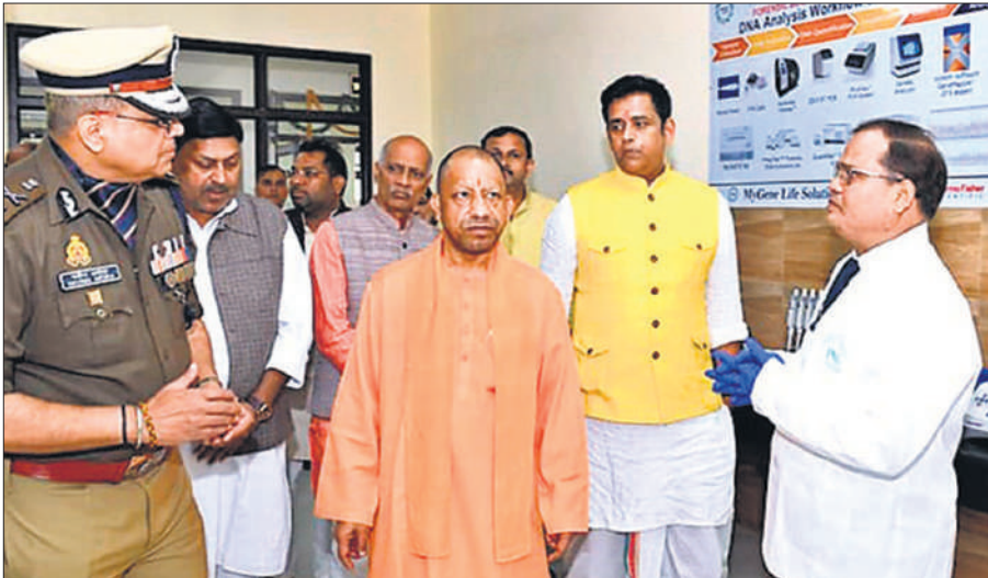
गोरखपुर के नवीन उच्चोक्त भवन जी+6 के लोकार्पण कार्यक्रम में सम्मिलित होते मुख्यमंत्री योगी आदित्यनाथ।

योगी ने कहा कि आज प्रदेश सरकार की जीरो टॉलरेंस की नीति, वैज्ञानिक साक्ष्यों पर आधारित जांच और आधुनिक फॉरेंसिक साइंस लैब्स के जरिए