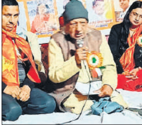
कवि सम्मेलन में अतिथि।