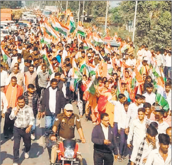
एकता पदयात्रा में जुटी भीड़।