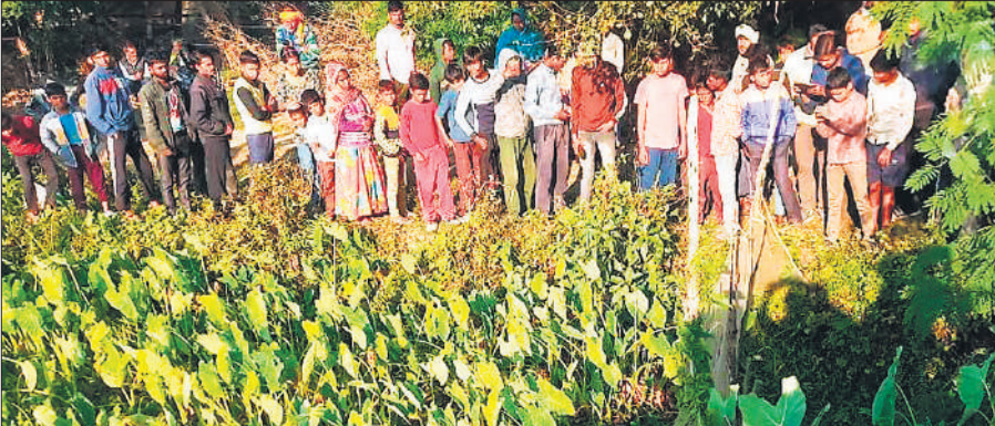
तेंदुआ को देखती ग्रामीणों की भीड़।

पिपराखास, जोकि सामाजिक वानिकी प्रभाग की बीसलपुर रेंज के अंतर्गत आता है, इसके ग्रामीण रोजाना की तरह मंगलवार सुबह तड़के खेतों की ओर आ-जा रहे थे। इसी बीच ग्रामीणों की नजर गांव के नजदीक ही तालाब किनारे एक तेंदुआ पर पड़ी। ग्रामीणों ने इसकी जानकारी गांव पहुंचकर अन्य ग्रामीणों को दी। कुछ देर बाद ही तालाब के आसपास तेंदुआ देखने वालों की भीड़ जमा होने लगी। सुबह करीब पांच बजे के आसपास कुछ ग्रामीणों ने इसकी सूचना वन महकमे