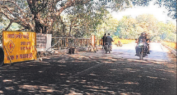
देवहा नदी पुल से गुजरते राहगीर।