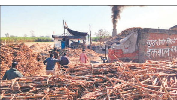
जलालपुर में कोल्हु की चिमनी से निकलता काला धुआं।

भागने में सफल नहीं हो पाते और पकड़े जा सकते थे। पीड़िता ने दो अज्ञात बदमाशों के खिलाफ पुलिस को तहरीर दी है, जिस पर पुलिस ने रिपोर्ट दर्ज कर जांच शुरू कर दी है।