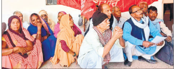
तहसील में धरना देते भाकपा कार्यकर्ता।