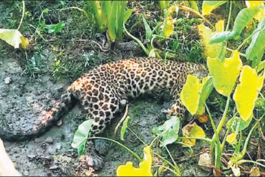
बरखेड़ा के पिपराखास में तालाब के किनारे पड़ा तेंदुआ।

जुलाई 2024 में मूसलाधार बारिश के बाद बाढ़ के हालात बन गए थे। जिसके बाद पीलीभीत से माधोटांडा रोड पर क्षतिग्रस्त होते हुए शाहगढ़ असम मार्ग तक जाने वाले रास्ते पर कई हिस्सों में मार्ग व पुलियां क्षतिग्रस्त हो गई थी। इन पर वैकल्पिक व्यवस्था करा दी गई, लेकिन क्षतिग्रस्त पुलियों व सड़कों का हाल नहीं सुधारा जा सका था। राहगीरों को इन मार्गों से गुजरने में