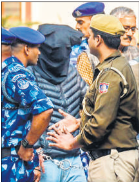
सहसाजिशकर्ता को कोर्ट ले जाती टीम।