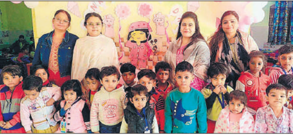
गतिविधियों में शामिल होते ऑल सेंट्स स्कूल के बच्चे।

अमृत विचार: ऑल सेंट्स स्कूल के किंडरगार्टन विभाग में पिंग और व्हाइट डे बड़े उत्साह और हर्षोल्लास के साथ मनाया गया। रंगों की पहचान कराना, रचनात्मकता बढ़ाना और सीखने को रोचक बनाना इस विशेष दिवस का उद्देश्य रहा। गुलाबी और सफेद रंग के परिधानों में सजे नन्हे-मुन्नों ने पूरे कार्यक्रम में आकर्षण बिखेरा। कक्षाओं को थीम के अनुरूप सजाया गया था—गुलाबी गुब्बारे, सफेद फूल, क्राफ्ट गतिविधियां और रंगों वाले चार्ट बच्चों को रोमांचित कर रहे थे। शिक्षकों ने रंगों से जुड़े रोचक गेम, डाइंग और स्टोरीटेलिंग की गतिविधियां कराईं,