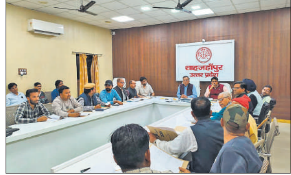
राजनीतिक दलों के प्रतिनिधियों संग बैठक करते जिला निर्वाचन अधिकारी।

सम्भाजन आवश्यक है। उन्होंने कहा कि बहुमंजिली इमारतों, ग्रुप हाउसिंग सोसायटियों और आरडब्ल्यू कॉलोनियों में जहां भूतल पर सामुदायिक स्थल उपलब्ध हैं, वहां नए मतदेय स्थल स्थापित करने पर विचार किया जा सकता है। इसके अलावा नगरीय क्षेत्रों की झुग्गी-झोपड़ी बस्तियों तथा अर्द्ध-नगरीय क्षेत्रों में भी आवश्यकता अनुसार नए स्थान प्रस्तावित किए जा सकते हैं। एक ही पोलिंग स्टेशन लोकेशन पर मतदेय स्थलों में मतदाताओं की संख्या संतुलित होनी चाहिए और किसी भी परिवार को विभाजित न किया जाए। सभी परिवारों को एक ही अनुभाग और एक ही