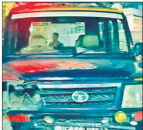
दुर्घटना प्रस्त कांट थाने का वाहन।