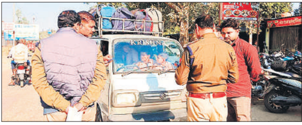
स्कूल वाहन को चेक करती यातायात पुलिस टीम।