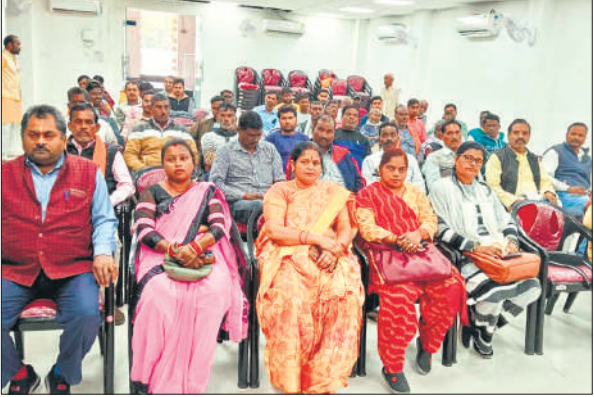
सहकारिता सप्ताह कार्यक्रम में प्रतिभाग करते सदस्य।