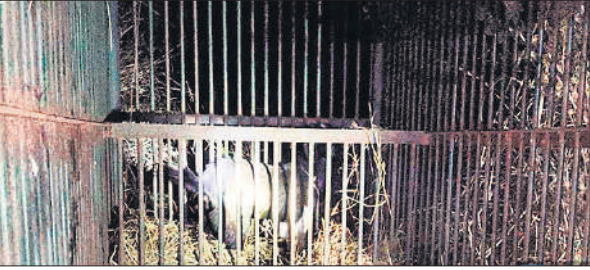
तेंदुए को पकड़ने को लगाए गए पिंजरे।