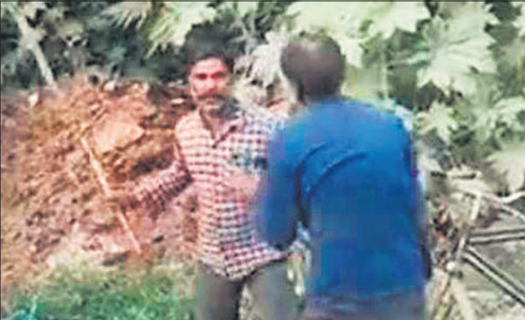
सब्जी विक्रेता को पीटता युवक, वायरल वीडियो से लिया गया फोटो।