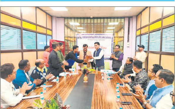
बैठक में उपस्थित अधिकारी और आईआईए सदस्य।