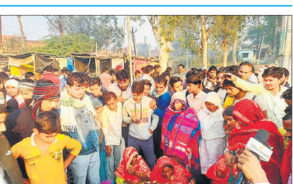
स्टेट हाईवे पर बैठक मृतक के परिजन व ग्रामीण।