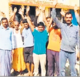
प्रदर्शन करते ग्रामीण। ● अमृत विचार

सरकारी जमीन पर कब्जा, ग्रामीणों ने किया विरोध