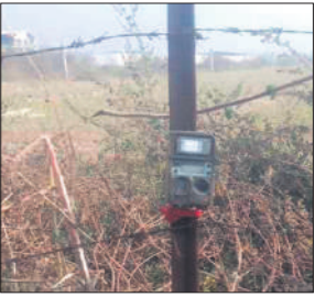
तेंदुए की लोकेशन को लगाए कैमरे।