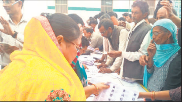
मतदाता पुनरीक्षण कैंप में फॉर्म भरते लोग।