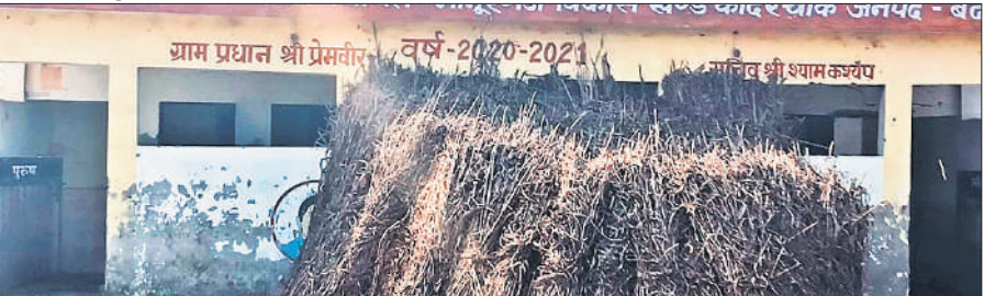
सामुदायिक शौचालय के बाहर पड़ा कूड़ा कबाड़।