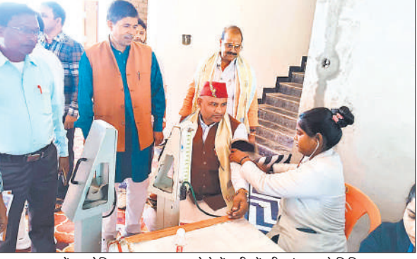
रामपुर कला में आयोजित मुफ्त स्वास्थ्य मेले में मरीजों की जांच करते चिकित्सक।

अमृत विचार: वरुण अर्जुन मेडिकल कॉलेज एवं रोहिलखंड अस्पताल, बंधरा के द्वारा रामपुर कला (पुवाया-खुटार रोड) स्थित मार्केट में मंगलवार को व्यापक स्तर पर एक मुफ्त स्वास्थ्य मेला आयोजित किया गया। मेले का शुभारंभ विधायक हरिप्रकाश वर्मा ने फीता काटकर किया। उन्होंने कहा कि ऐसे स्वास्थ्य शिविर लगातार लगाए जाते रहेंगे, जिससे जनमानस को निशुल्क इलाज की सुविधा मिल सके। उन्होंने नर सेवा को सर्वोत्तम सेवा बताते हुए हर संभव सहयोग का आश्वासन दिया। स्वास्थ्य मेले में कुल 648 लोगों ने पंजीकरण कराया। इनमें 55 मरीजों में मोतियाबिंद की पुष्टि हुई, जिनका ऑपरेशन वरुण अर्जुन मेडिकल कॉलेज एवं रोहिलखंड अस्पताल बंधरा में निशुल्क किया जाएगा। शिविर में 49 मरीजों की हड्डी की जांच (बीएमडी), 71 मरीजों