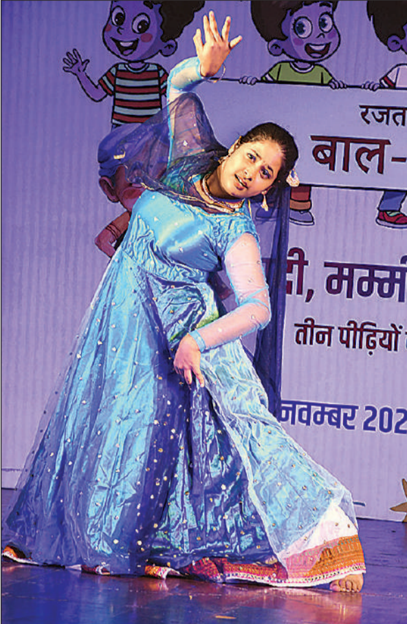
सचं फाउंडेशन के बाल उत्सव में नृत्य प्रस्तुत करती युवती।