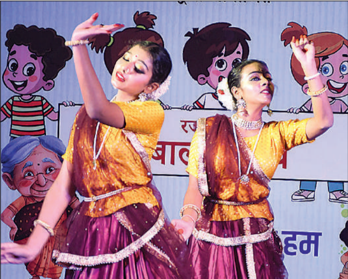
सचं फाउंडेशन के बाल उत्सव में नृत्य करती युवतियां।

सचं फाउंडेशन ने मंगलवार को गोमतीनगर स्थित अंतरराष्ट्रीय बौद्ध शोध संस्थान में 25वें बाल उत्सव का आयोजन किया। इसमें डॉ. दिनेश शर्मा ने पायनियर माण्टेसरी स्कूल की प्रधानाचार्या