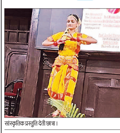
सांस्कृतिक प्रस्तुति देती छात्रा।