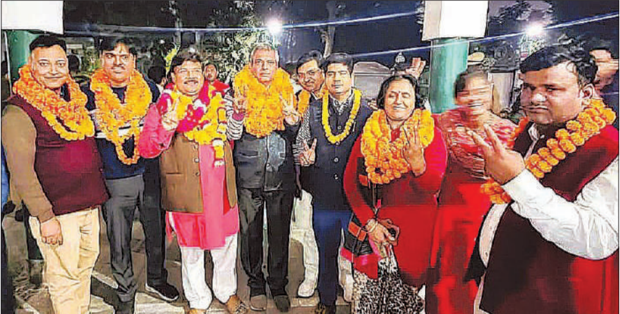
लुआक्टा चुनाव में विजयी प्रत्याशी।