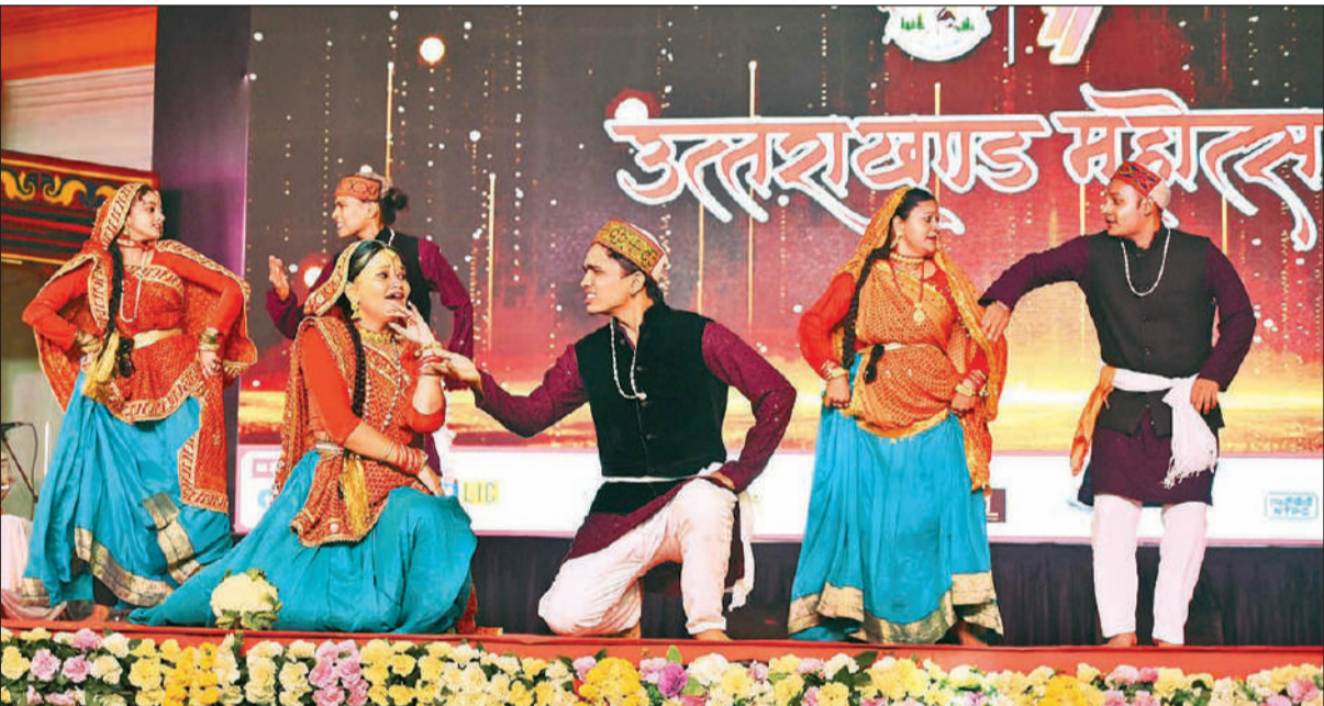
गोमती तट स्थित पं. गोविन्द बल्लभ पंत पर्वतीय सांस्कृतिक उपवन में आयोजित उत्तराखंड महोत्सव में कार्यक्रम प्रस्तुत करते कलाकार।