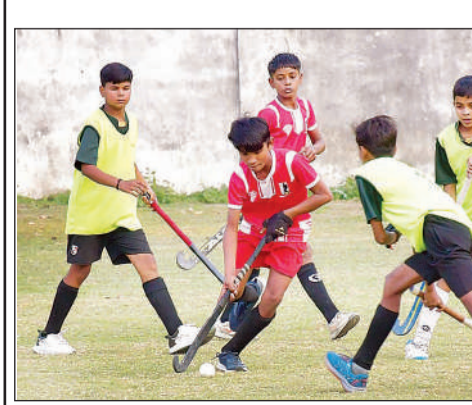
गेंद पर कब्जे की कोशिश करते खिलाड़ी।