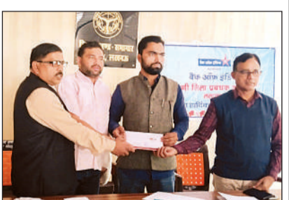
लाभार्थी को चेक देते बैंक के अधिकारी व अन्य।